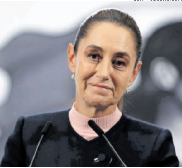
La presidenta Claudia Sheinbaum, ayer.

La Presidenta concluyó que quienes hoy enarbolan la consigna “patria, familia y libertad” están, en realidad, “moralmente derrotados”.