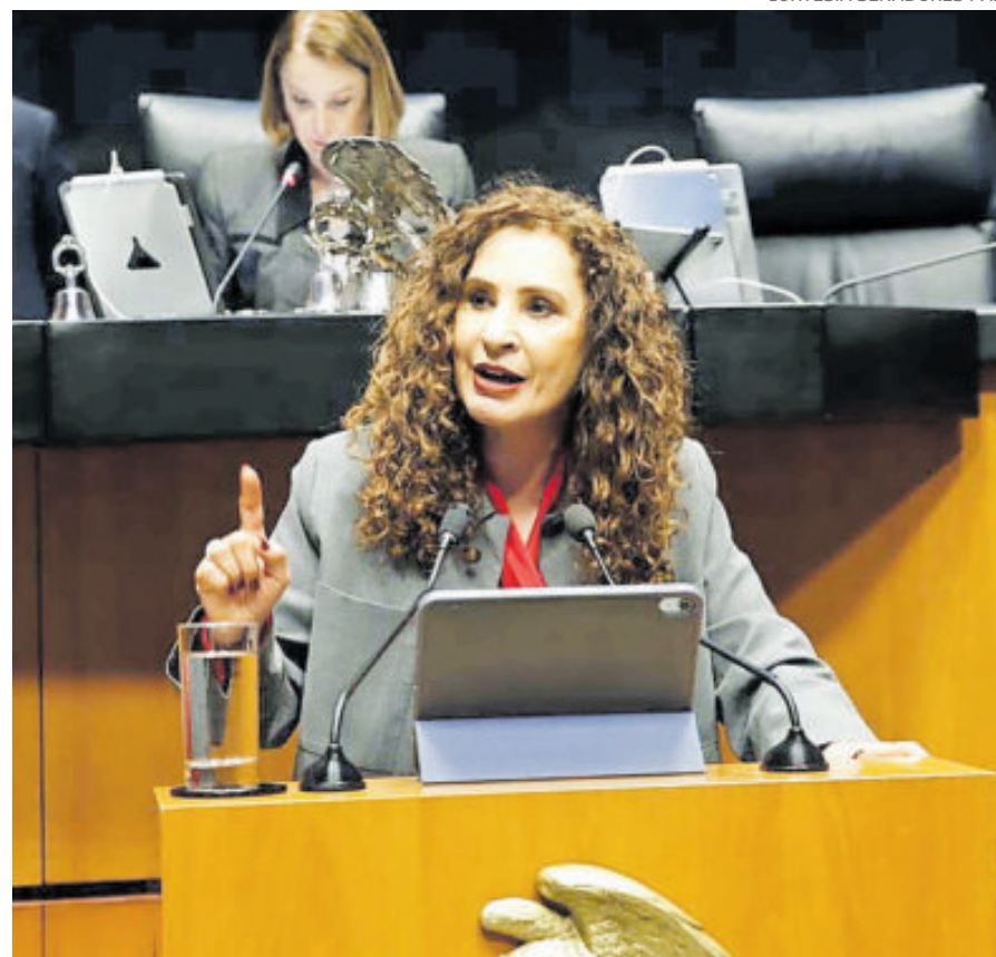
La senadora panista Gina Campuzano, ayer.

El senador subrayó que “por primera vez se consagra la igualdad sustantiva entre mujeres y hombres en todos los nive-