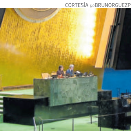
Votación contra el embargo en ONU.

“Como amigo de México, me entristece (...) Si vamos a hablar de la política estadounidense hacia Cuba, hagámoslo al menos basándonos en la realidad y no en fantasías. No existe ningún ‘bloqueo comercial’ a Cuba. Un ‘bloqueo’ es un cerco