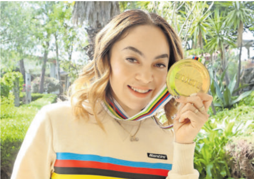
Tras su llegada a la capital, la ciclista acudió a la Conade.

“Yo siempre de pequeña dije ‘si yo llevara el maillot, si ganara un nacional aquí en México, no lo llevaría, pero si ganara el mundial, sin dudarlo mandaría a hacerme el uniforme para disfrutarlo y presumirlo porque me siento campeona’. La verdad es que estoy muy muy feliz, todavía no me cae el 20 y yo espero que no me caiga. Espero que muchos niños allá afuera estén inspirados y motivados a que los sueños sí se cumplen”, comentó al bajar del avión.