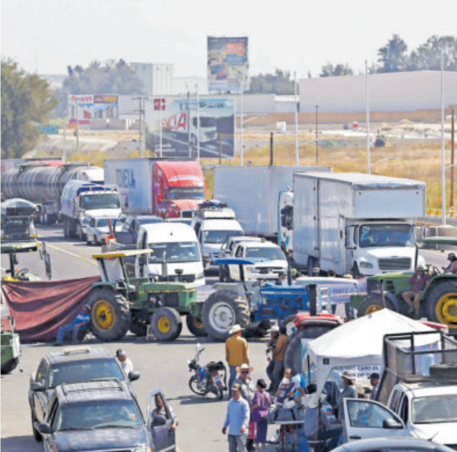
Agricultores de Jalisco levantaron su plantón en la carretera a Nogales, así como varios accesos carreteros de la ciudad.