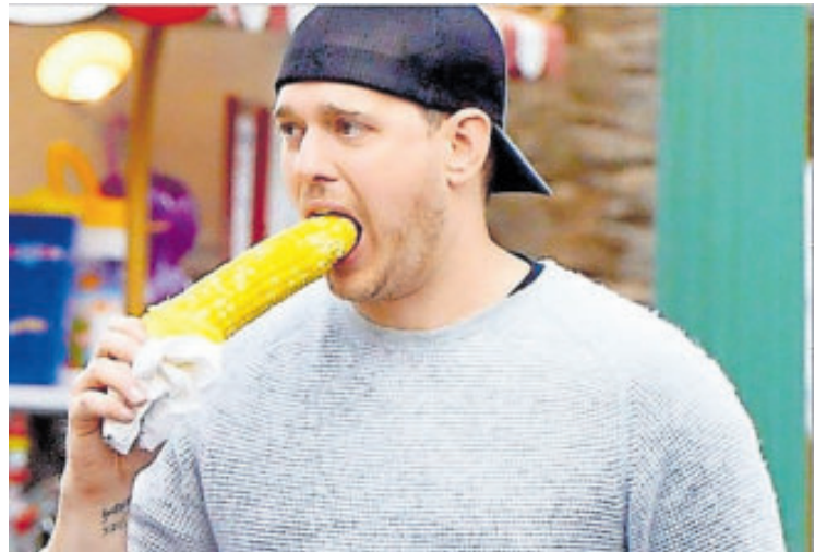
Aparece en el último capítulo de la serie de turismo.

Bublé aparecerá como invitado especial en un episodio rodado en Canadá, en el que Levy concluye su viaje cerca de casa, descubriendo la belleza de Vancouver.