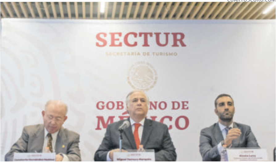
Simón Levy fue subsecretario de Planeación Turística en Sectur.