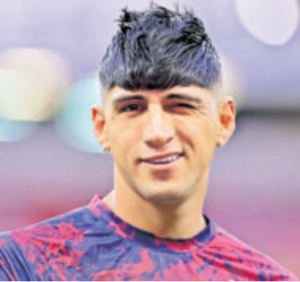
Chivas no renovará al delantero.

Y es que el tamaulipeco finaliza contrato al terminar este Apertura 2025 con Guadalajara y no se ve por dónde vaya a