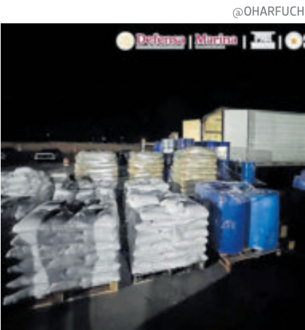
El narcótico iba rumbo a Chihuahua.

Fue mediante un punto de inspección, seguridad y vigilancia sobre la carretera Panamericana Durango-Hidalgo del Parral, a la altura del kilómetro 238+700, donde agentes de campo tuvieron contacto con un tractocamión acoplado a una caja seca, al cual le realizaron una revisión para evitar la comisión de algún delito. FGR asegura precursores químicos y asesta golpe millonario al narco en Durango. Durante la inspección, los agentes identificaron diversos materiales con características de precursores químicos, por lo que procedieron a su aseguramiento