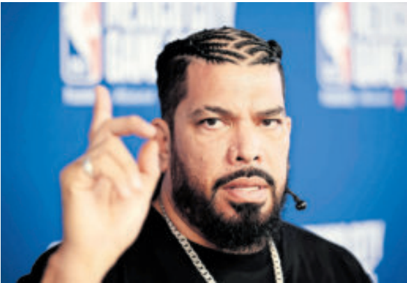
El mexicano habló sobre el escándalo de apuestas ilegales que se descubrió recientemente en la NBA.

Entre los personajes de la NBA arrestados estuvieron Chauncey Billups, en-