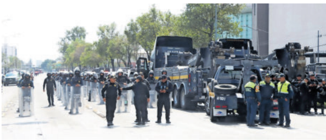
La movilización fue encapsulada por la SSC en los límites CDMX-Edomex.