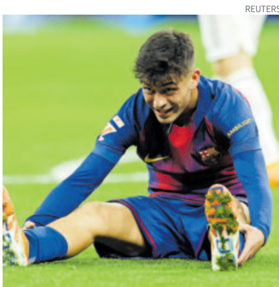
El jugador blaugrana tiene una lesión en el bíceps femoral de la pierna izquierda.

Trabajo diario de fuerza y prácticamente no descansar, porque la muscula-