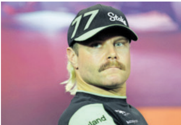
Sus vacaciones en Oaxaca fueron fugaces.