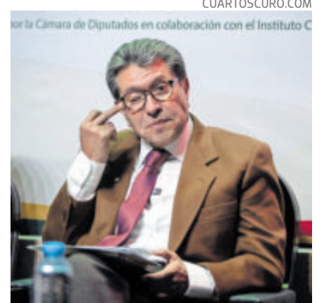
Ricardo Monreal, coordinador de los diputados de Morena.