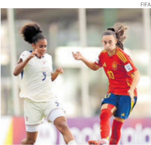
Francia superó a las españolas en tanda de penales y van ante Países Bajos.

Mientras tanto Colombia perdió 4-0 ante Ja-