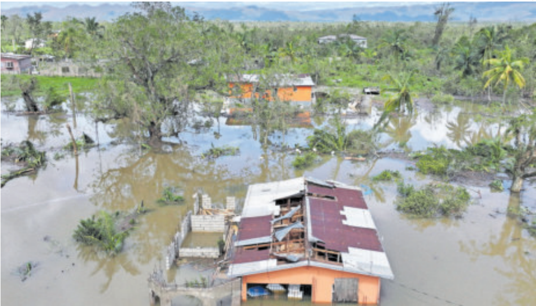
Melissa golpeó Jamaica como un huracán, el más fuerte que jamás haya azotado a la isla caribeña.

kilómetros por hora. Se espera que arribe por la madrugada de hoy a Bahamas. Por el momento el mayor precio en vidas lo ha pagado Haití, que reportó otros 20 muertos, lo que eleva a 23 el total en el país. Además tres personas murieron en Jamaica antes de la llegada del huracán, tres en Panamá y una en República Dominicana. La tormenta inundó casas y calles, que ayer continuaban intransitables. Vecinos de Santiago de Cuba, la segunda ciudad más importante de la isla con 500 mil habitantes, salieron machete en mano para cortar árboles derrumbados y liberar las calles. El presidente Miguel Díaz-Canel dijo que fue “una madrugada muy compleja con daños cuantiosos”. La tormenta también rompió cristales, paneles y otras estructuras de un hotel en el que se alojan periodistas, igual que sucedió en hospitales y centros educativos. Las autoridades cubanas informaron que 735 mil personas fueron evacuadas, especialmente en las provincias de Santiago de Cuba, Holguín y Guantánamo. La empresa estatal de telecomunicaciones, ETECSA, indicó que la provincia de