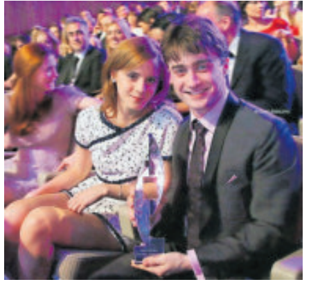
Ya había trabajado en el teatro en NY.