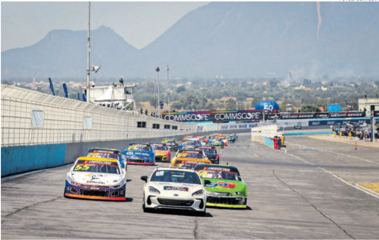
Este es el óvalo del Autódromo Miguel E. Abed, en Amozoc, Puebla.