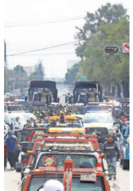
La Acme solicitó que la FGJEM respete derechos legales.