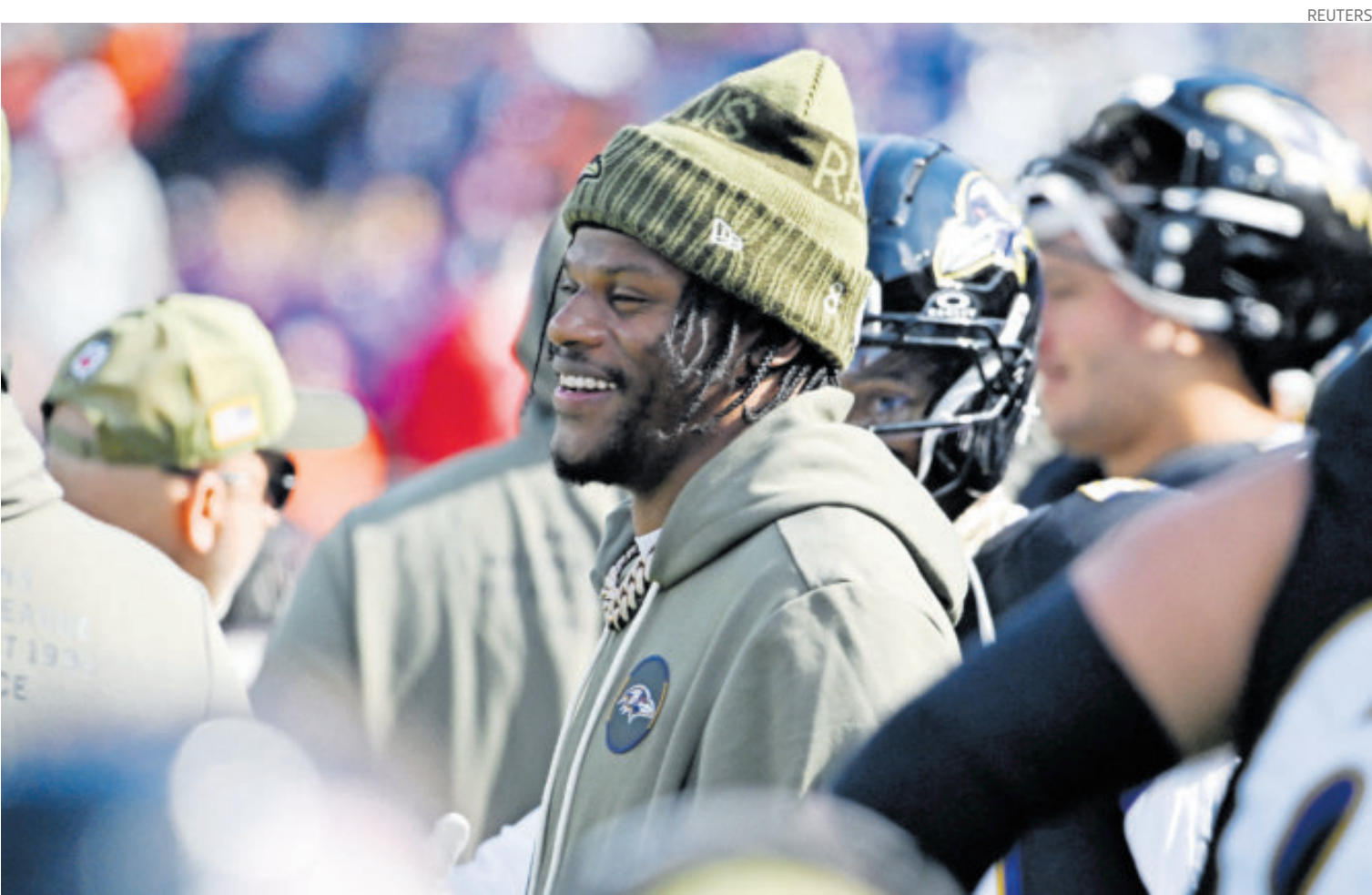
Con su retorno, se espera que el equipo de Baltimore apriete su paso en la NFL.