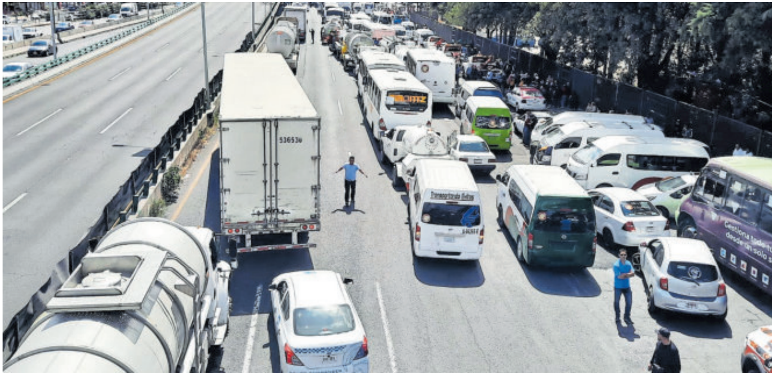
Bloqueo de lateral en Periférico a la altura del Parque Naucalli.