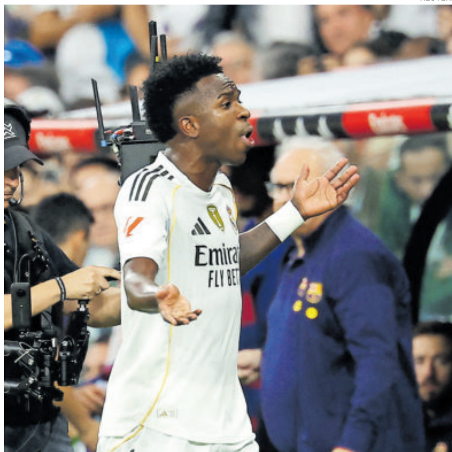
Vinicius Jr. se disculpó frente a jugadores y cuerpo técnico, y luego en redes.

Y, tras el partido, Xabi Alonso habló de lo ocurrido. Sin querer entrar pública-