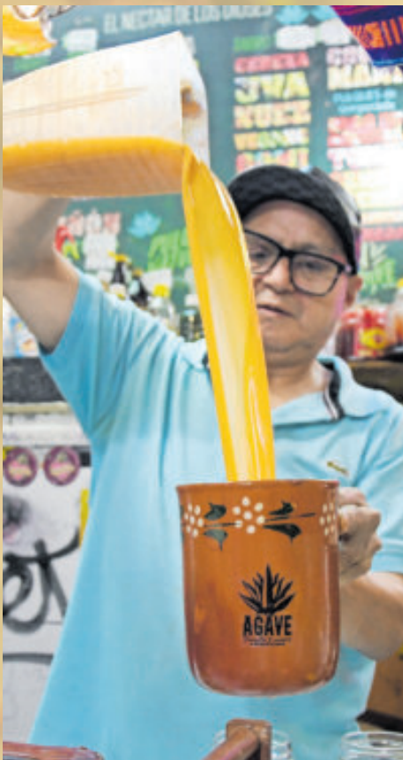
La preparación requiere cariño, delicadeza y respeto, según maestros picadores.