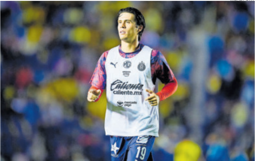
El joven defensor se perderá el resto del torneo por una fractura en el pie.