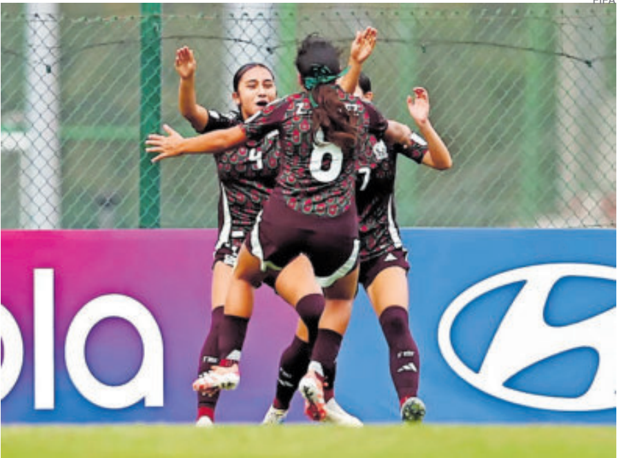
México avanza a cuartos de un Mundial sub-17 por primera vez desde 2018.