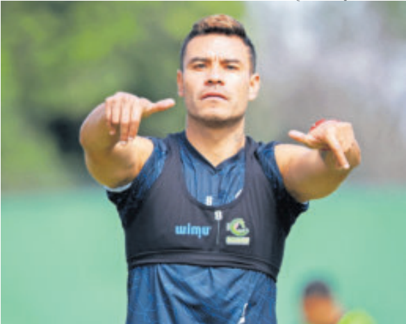
Barrera tuvo una larga trayectoria por el futbol.