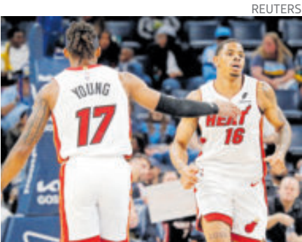
El equipo apoya la recuperación de la isla tras el paso del huracán Melissa.

“Mi familia sabe todo lo que he pasado e incluso, el tener que pararse todos los días. Últimamente estuvo lloviendo, nadie me acompañó a entrenar, nada más mi entrenador estando ahí, lloviendo, sufriendo arriba de la bicicleta. Todos esos baches donde la vida me pone a prueba, hicieron más fuerte y hoy estoy aquí”, añadió.