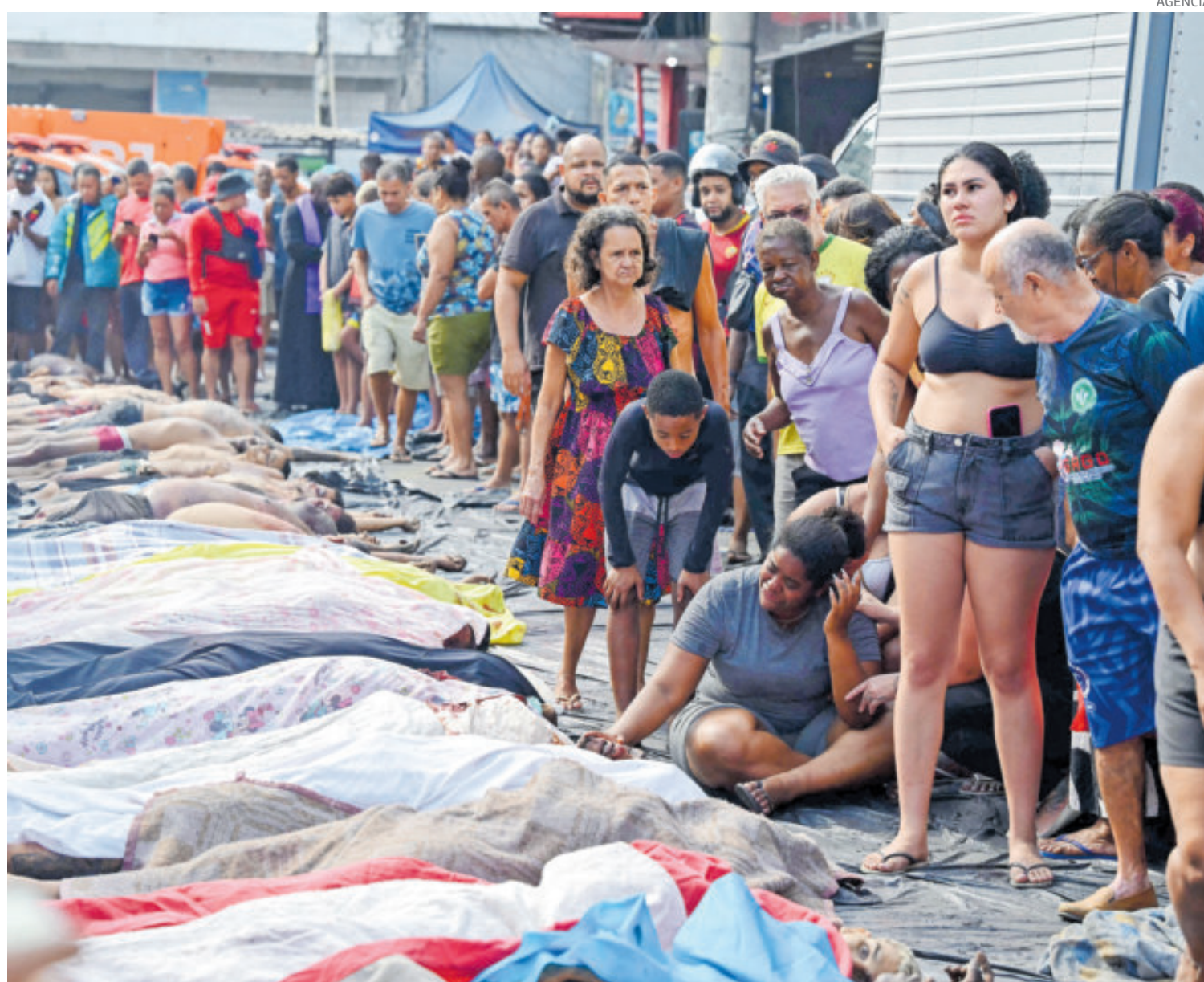
Vecinos y familiares colocaron los cuerpos de los fallecidos sobre la calle donde se efectuó el operativo.