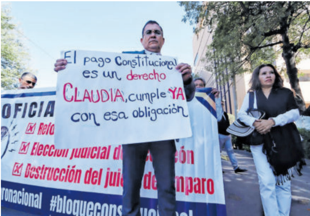
Cerca de 50 exjuzgadores piden los recursos que les corresponden.