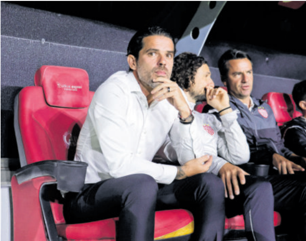
Al argentino Gago nada más no se le da el futbol mexicano.