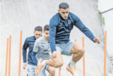
Berte ha tenido un buen torneo con nueve goles en su cuenta.

“Representar a la Selección es lo mejor que le puede pasar a un jugador. Yo me veo en el Mundial 2026. No es arrogancia, es confianza y fe en mis capacidades. Este equipo te da el escaparate para estar ahí. Si hacemos un buen torneo, si salimos campeones y mantenemos el nivel, podemos ser una defensa muy atractiva para selección. El Toro, Fidel, el Tecate... hay material”, sentenció el zaguero central.