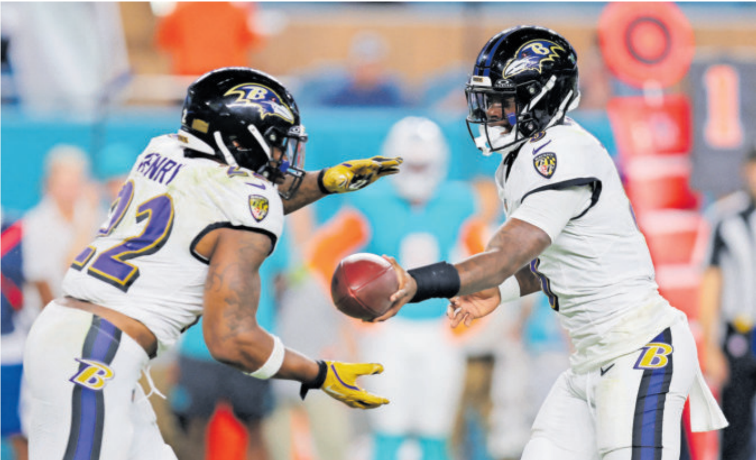
El regreso de Jackson cambió la perspectiva de los Ravens.