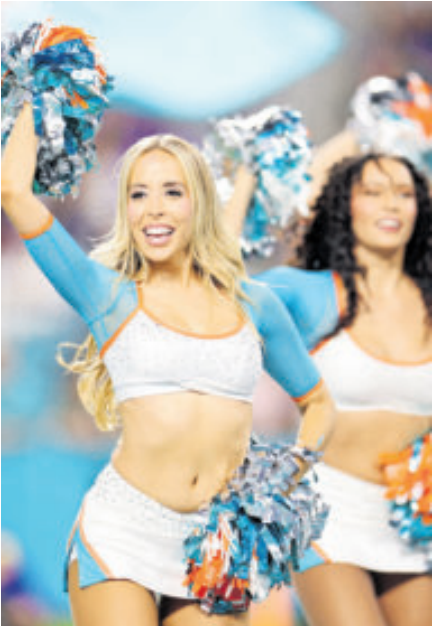
No le faltó apoyo a los Delfines.

llegó a estar 1-5 en la campaña, con una cómoda victoria. Los Ravens se enfrentarán a rivales mucho más fuertes, pero también contarán con un Jackson más sano al mando. Los Ravens ganaban 14-6 al descanso, a pesar de que los Dolphins tenían más yardas, con 225 contra 109 del rival y menos despejes (uno a cuatro), pero entonces Jackson comenzó a despertar. El tercer cuarto fue todo de Baltimore, que superó 14-0 en puntos a Miami y mantuvieron el balón durante 11:10 minutos, para encaminar la cómoda victoria en Hard Rock Stadium.