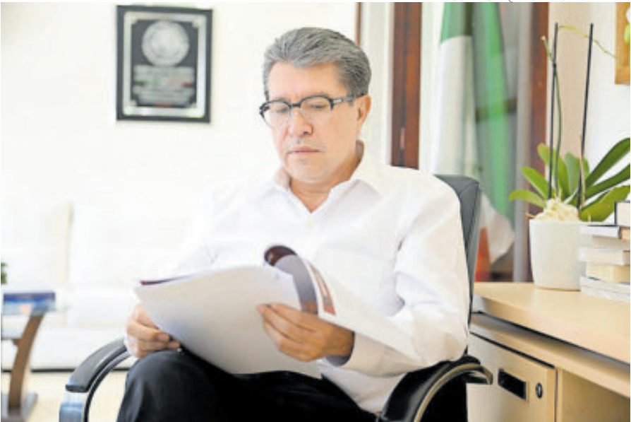
El diputado Ricardo Monreal, "revisando la agenda de la semana".