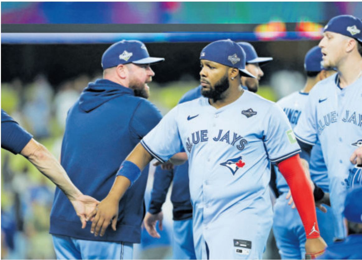
Vladimir Guerrero Jr. y compañía, con todo a su favor para derrotar al equipo angelino.