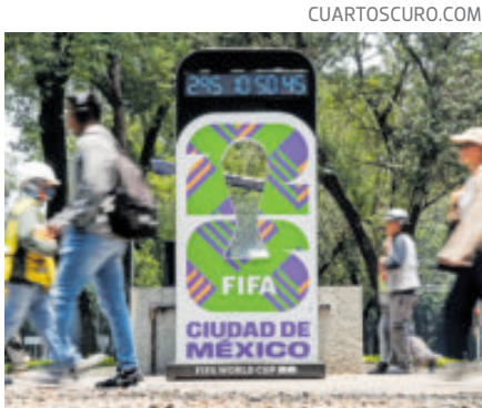
El reloj mundialista instalado en Paseo de la Reforma.

“Se van a presentar las actividades del Mundial en México”, adelantó Sheinbaum, quien será acompañada por representantes de la Secretaría de Turismo y de la Federación Mexicana de Fútbol.