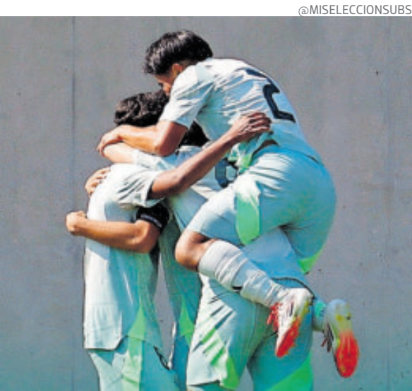
El equipo mexicano debuta el el 4 de noviembre.

La Selección Mexicana Sub-17 debutará el martes 4 de noviembre ante el equipo de Corea del Sur, dentro del Grupo F, que completan Costa de Marfil y Suiza, y se espera que cumplan un buen papel como en antaño.