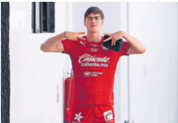
Armando suma 10 goles en el actual torneo que lo tienen como sublíder en ese departamento.

Por ello, en Verde Valle ya habrían comenzado a trabajar para presentarle una oferta al jugador y su entorno, con el obje-