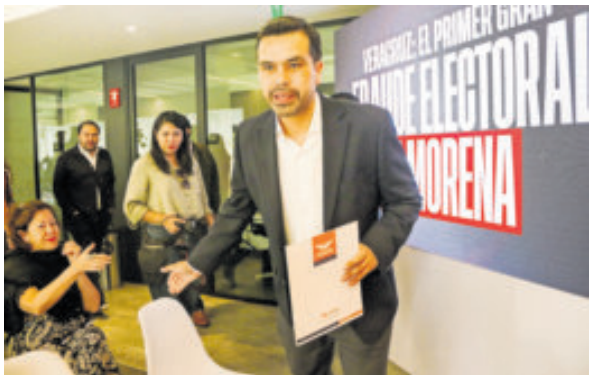
Jorge Álvarez Máynez, presidente de MC.