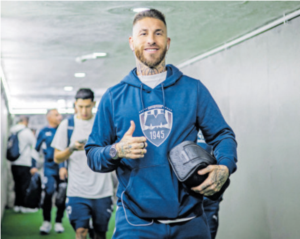
El español Sergio Ramos se ha asentado bien en el futbol mexicano con los Rayados.