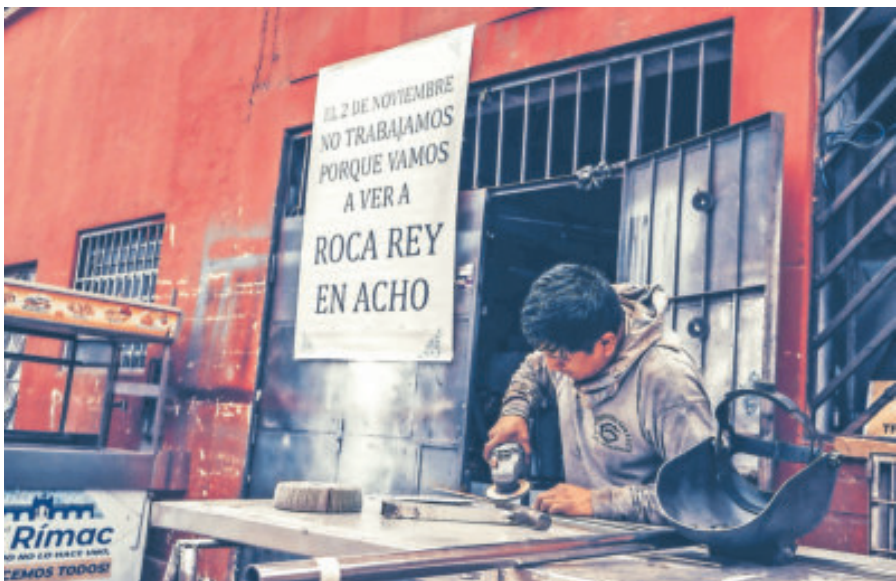
El joven torero regresa triunfante a su país, que lo ama.