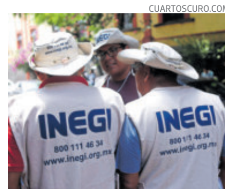
La dependencia dio a conocer el retroceso.

El declive sobre se estaría atribuyendo a la disminución de (-)1.5% en su comparación trimestral, en las actividades secundarias (industria y manufactura) principalmente, así como al avance acotado en las actividades terciarias (comercio, servicios y turismo, las cuales representan cerca de 60% del PIB).