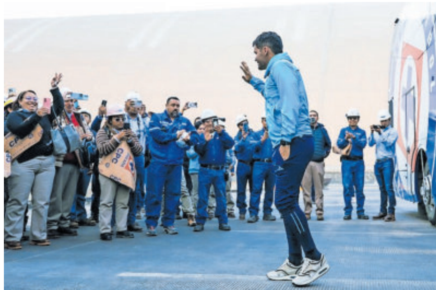
La charla no fue bien tomada por aficionados poblanos y auriázules.