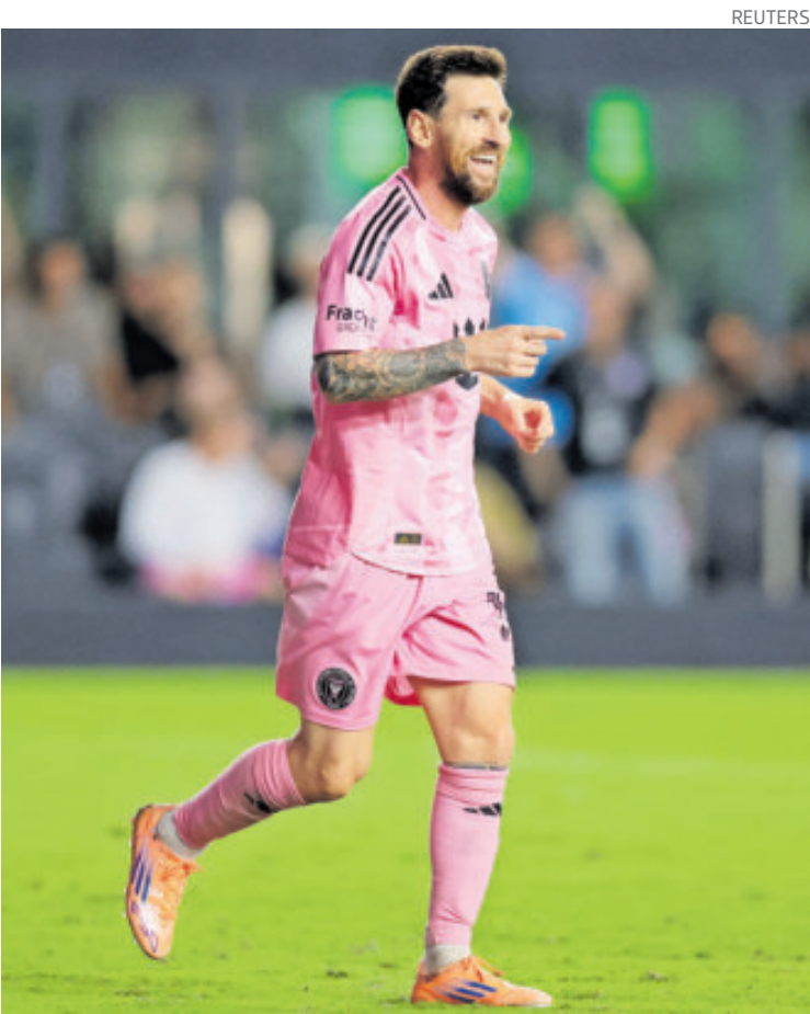
Lionel renovó recientemente su contrato con el equipo de Miami.

GANAR EL MUNDIAL FUE "EL SUEÑO DE MI VIDA" Por otra parte, Lionel Messi aseguró que ganar el Mundial con la selección argentina fue "el sueño" de su vida y que le encantaría defender la Copa Mundial en el campo el próximo verano en Estados Unidos. "Va a ser espectacular, es algo extraordinario poder estar en un Mundial, y me gustaría estar acá, sentirme bien y sentirme parte de la Selección. Voy a ver si pue-