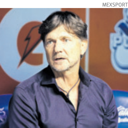
No pudo levantar al Puebla.

Aunque el conjunto poblano marcha en último lugar de la tabla general del Torneo de Apertura con apenas nueve