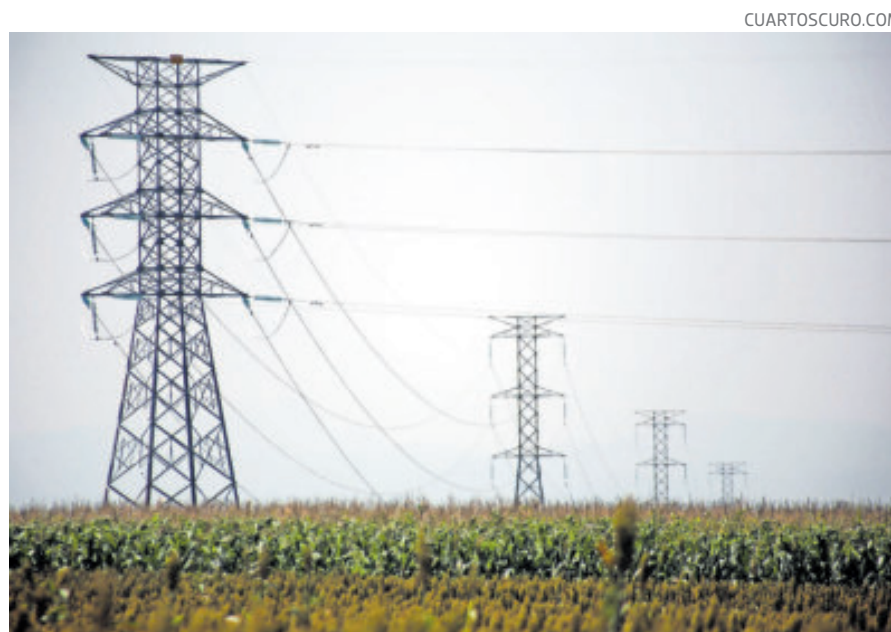
Los empresarios empujan por reglas claras de inversión.

FOCALIZADA en el sector industrial, que representa alrededor del 17% de la actividad económica del país, dijo el titular de Hacienda.