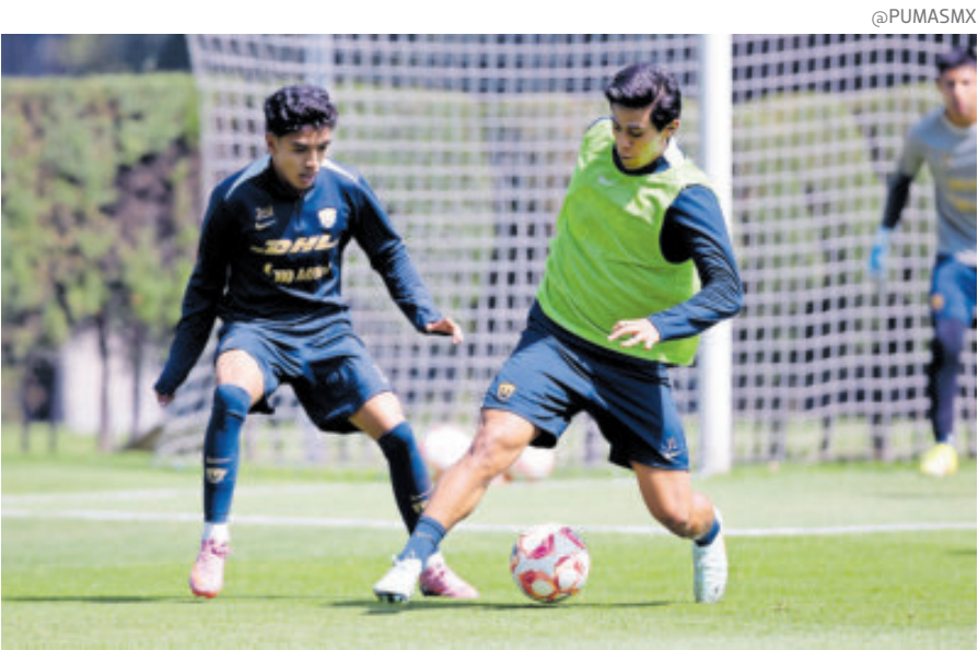
El delantero incluso dijo que en varios partidos fueron superiores al rival.