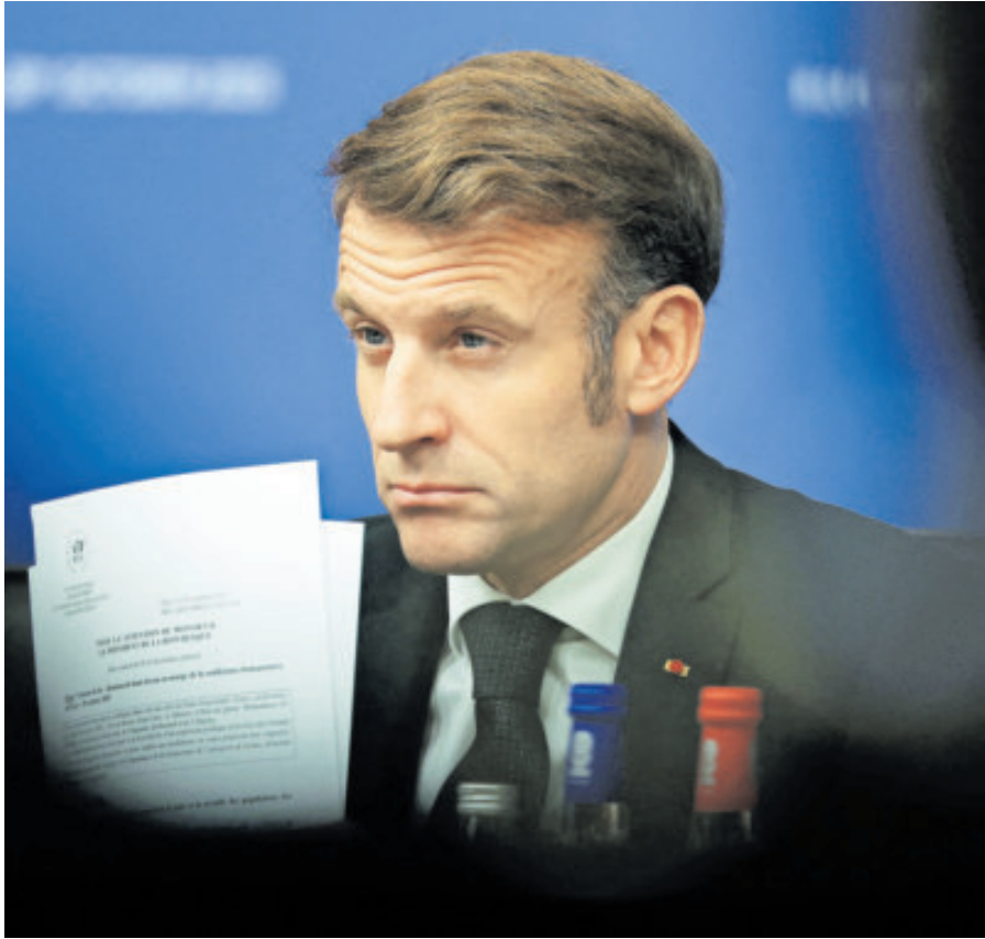
El presidente de Francia, Emmanuel Macron, ayer.

—¿Y habrá una conferencia conjunta? —Supongo que sí. Se está acordando la agenda, va a ser muy breve la visita, y se está acordando la agenda. Pero nuestro