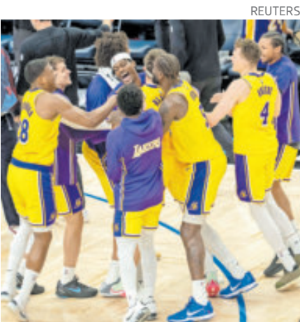
El acuerdo de la venta está valorado en 10 mil millones de dólares.

Jerry Buss compró los Lakers en 1979 por 67.5 millones de dólares en un paquete que incluía Los Angeles Kings de la NHL y el antiguo estadio, Los Angeles Forum.