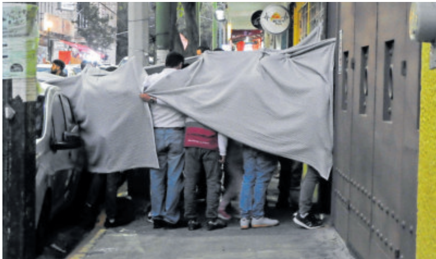
Momentos del traslado de las niñas y adolescentes.