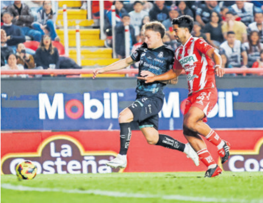
Santos Laguna se enrachó y ahora tratará de quedarse con el Play-In.

restantes, ya que están arriba de los fronterizos.