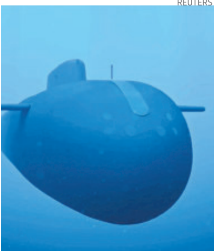
Rusia presentó un submarino nuclear.

veta todas las explosiones nucleares, pero aún no ha entrado en vigor porque faltan las ratificaciones de China, Egipto, India, Irán, Israel, Corea del Norte, Pakistán y Estados Unidos.