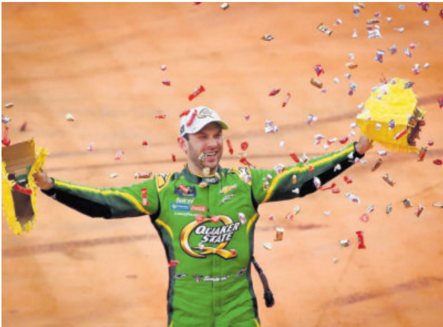
Está listo para despedir una etapa fundamental en su carrera.

“Fue interesante para mí, porque venía de un equipo que era un proyecto en ciernes, pero cuando llegó la pandemia de covid, no funcionó. Básicamente, Trackhouse era un proyecto similar. Yo creí en él enseguida; mi padre y otros no, pero mi instinto me decía que era algo bueno des-