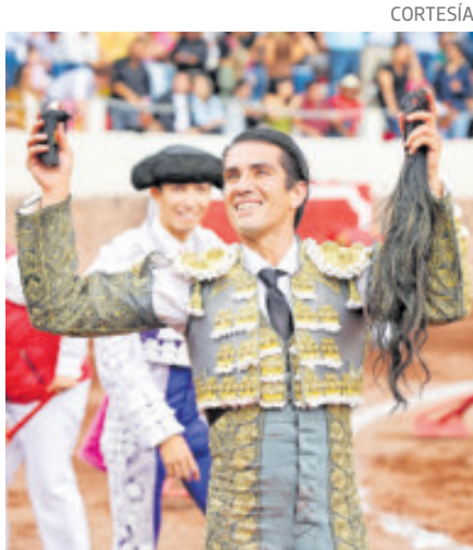
Es el líder del escalafón taurino.