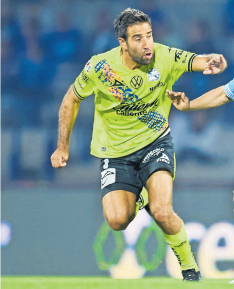
El equipo celeste salta como superfavorito para enfrentar a los Camoteros.

En tanto, los Bravos de Juárez también necesitan la victoria, porque con ello prácticamente asegurarían el Play-In e incluso se mantendrían en la pelea por Liguilla directa en la última fecha, aunque para ello tiene que ver lo que hagan Chivas, Pachuca y Tijuana en sus partidos