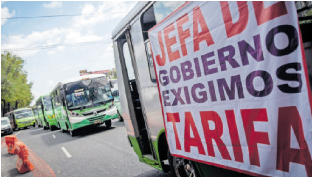
Los transportistas piden una tarifa justa al transporte.