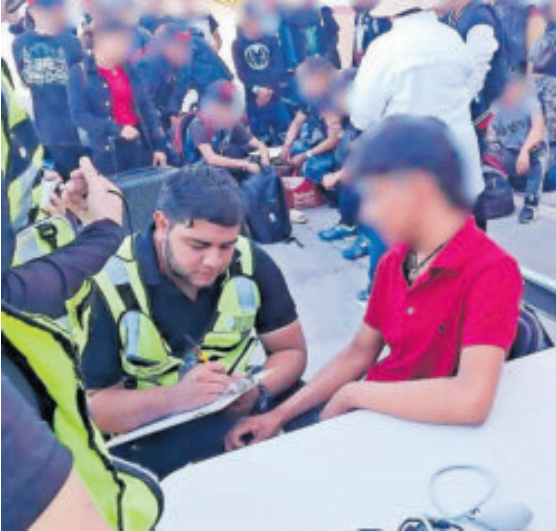
Los jóvenes, durante una inspección.

El Ministerio Público hizo entrevistas a las personas rescatadas; viajaron de forma voluntaria, señalaron.