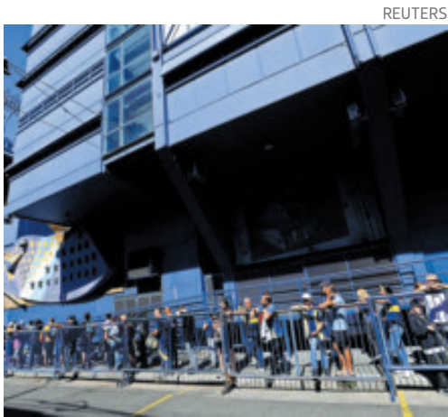
El equipo Xeneize será el primero con un restaurante de esa cadena en su estadio.

Fuentes del club citadas por prensa local detallaron que la apertura del establecimiento está prevista para mediados de 2026 y que Boca recibirá el 7% de los ingresos de todas sus ventas,