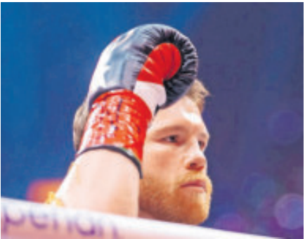
Agradece a su familia y a los fans de México.

El cierre de temporada en el Phoenix Raceway tendrá un significado especial, con Suárez y un esquema de pintura especial y el mismo casco que usó durante su histórica participación en el Autódromo Hermanos Rodríguez.