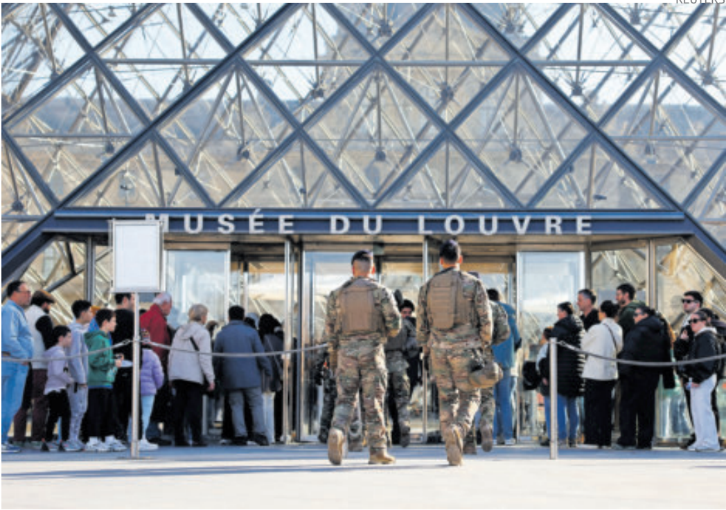
Una de las fachadas del museo del Louvre en París, Francia.

El valor material de las joyas fue estimado por el Louvre en unos 88 millo-