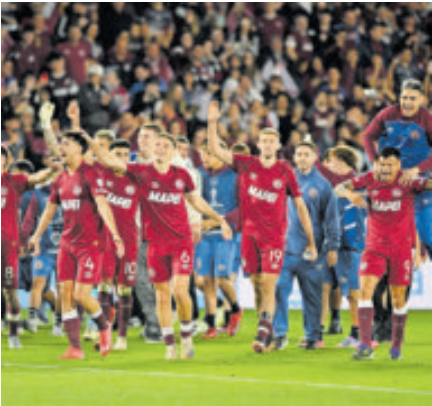
El equipo Granate ganó 3-2 en el global a la U. de Chile.