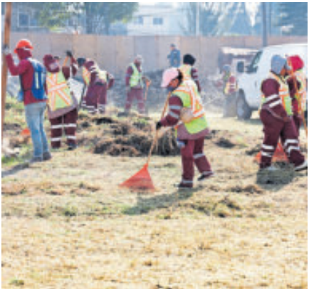
Limpieza del terreno donde estará la Utopía.