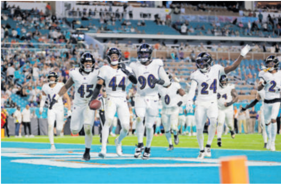
Baltimore se aprovechó de las debilidades de los Dolphins.