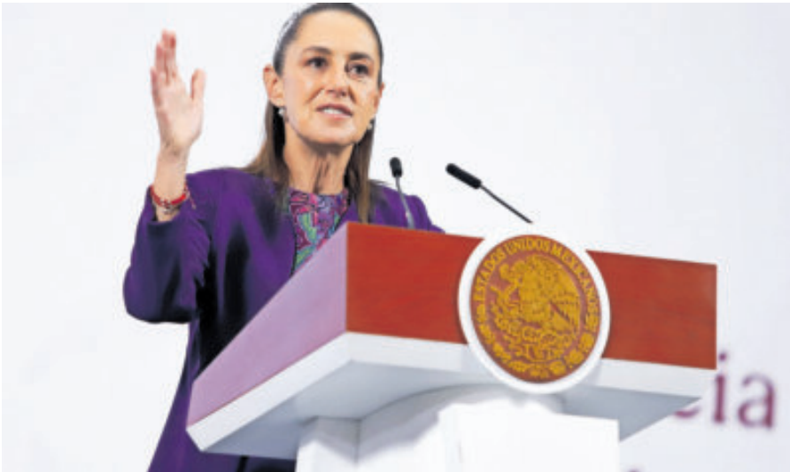
La presidenta Claudia Sheinbaum, ayer, en conferencia de prensa.

“La liberación en Portugal no extingue las causas en México ni el procedimiento de extradición”, remarcó Sheinbaum.