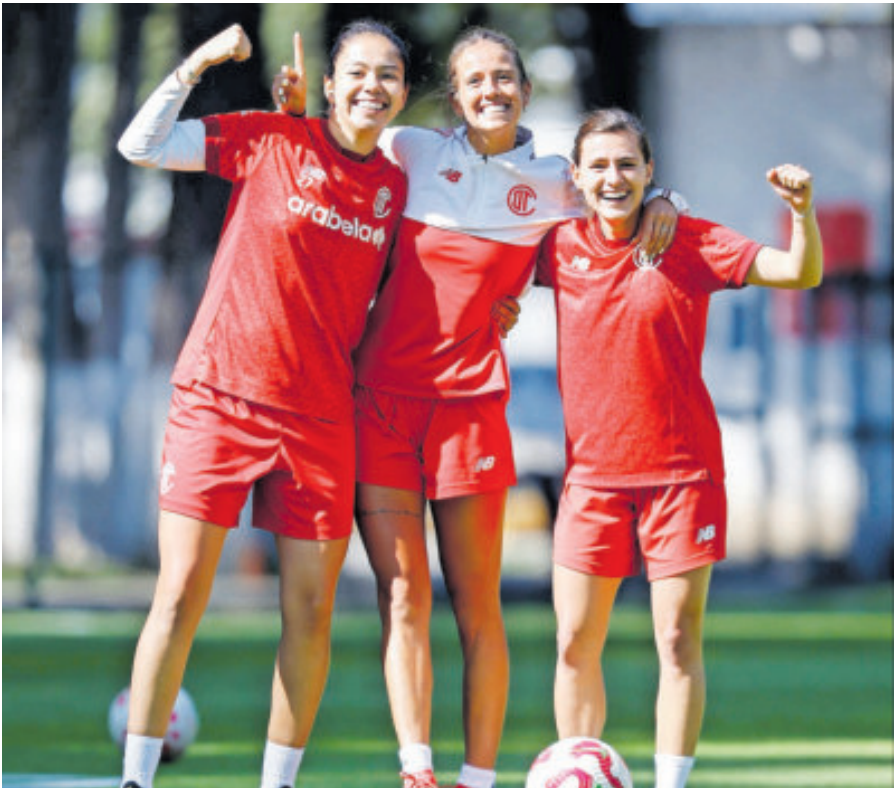
Toluca femenino tuvo un buen torneo y cierra la fase regular ante Puebla.

dio Akron. El Rebaño Sagrado, ya clasificado en la quinta posición de la tabla general, recibe a unas Centellas eliminadas. Pero las tapatías quieren más y con un triunfo, además de una derrota de Toluca, podrían colocarse en el cuarto sitio. El equipo del Guadalajara, con 30 puntos, uno más que las Rayadas del Monterrey, requieren forzosamente salir con el triunfo ante las del Necaxa, pues incluso en caso de sufrir un descalabro podría caer a la séptima posición. Pero si Chivas sale con el brazo en alto sumaría 33 unidades, por lo que se pondría uno arriba de las Diablas del Toluca, que llevan 32 puntos. Si gana Guadalajara y caen las del Estado de México, las tapatías ascenderían al cuarto sitio. Sin embargo, no se antoja sencillo que las escarlatas muerdan el polvo en patio propio, pues el estadio Nemesio Díez será el escenario en el que recibirán a las del Puebla de la Franja, ya sin opciones de Li-