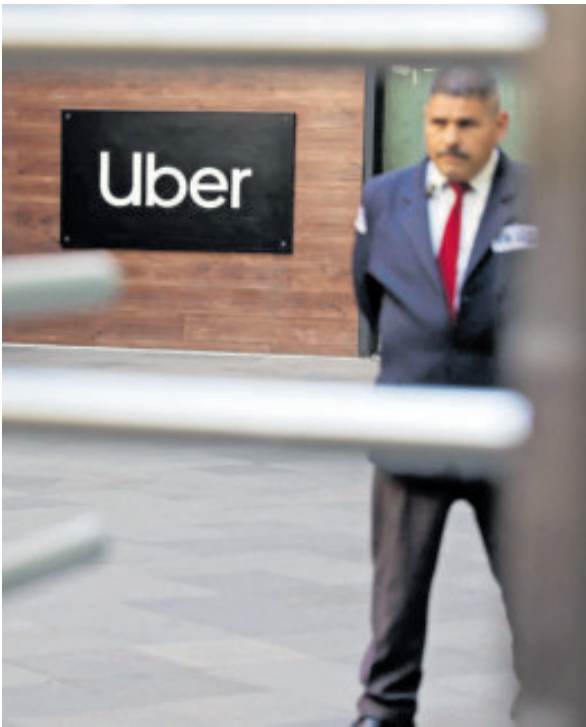
La plataforma digital debe esperar más tiempo para operar en terminales.

La Secretaría de Infraestructura, Comunicaciones y Transportes (SICT) aclaró ayer que la empresa Uber no cuenta con autorización para prestar servicios de traslado de pasajeros desde o hacia los aeropuertos del país, pese a que un juez suspendió la norma por la que era legal detener a los conductores de la compañía que realizan viajes en estos espacios. En un comunicado, explicó que la Dirección General de Autotransporte Federal (DGAF) no ha expedido ningún permiso a las plataformas digitales para operar en zonas aeroportuarias, por lo que su actividad en estos puntos carece de autorización oficial. La aclaración ocurre luego de que Uber promoviera un amparo tras los operativos de la Guardia Nacional realizados en diversos aeropuertos del país para impedir el servicio de vehículos de la aplicación, bajo el argumento de que no cumplen con la normativa vigente. El Juzgado Décimo Tercero en Materia Administrativa de la Ciudad de México otorgó una suspensión a la empresa, mediante la cual ordenó que las inspecciones y revisiones de la Guardia Nacional se realicen conforme a lo establecido en la Ley de Caminos, Puentes y Autotranspor-