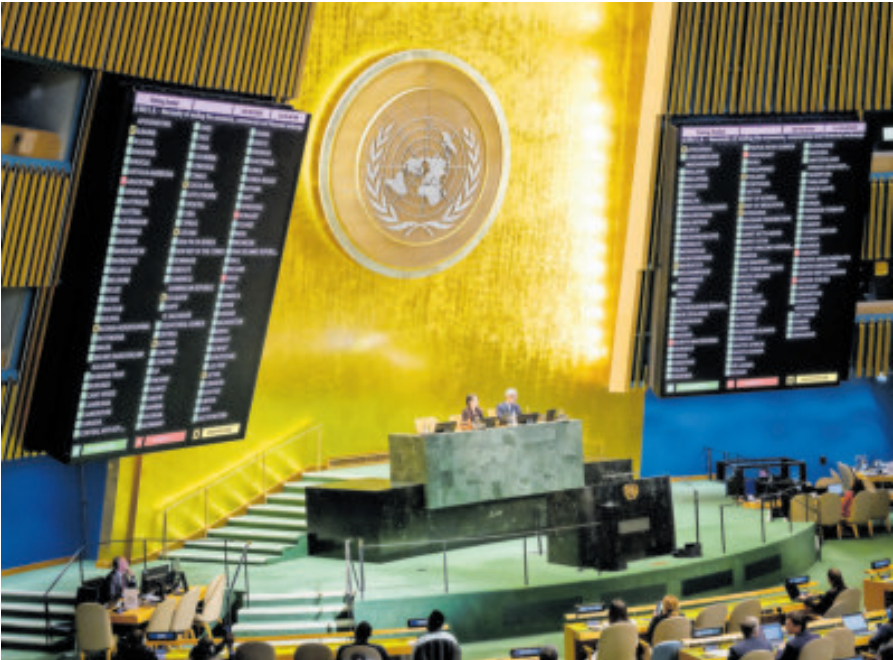
Tablero de la votación para poner fin al bloqueo de Estados Unidos a Cuba, durante la 22ª sesión plenaria de la Asamblea General de la ONU.

El hoy subsecretario de Estado de Estados Unidos cuestionó incluso los envíos de petróleo a la isla, al afirmar que “no existe un cerco” que impida el comercio o la llegada de visitantes a territorio cubano.