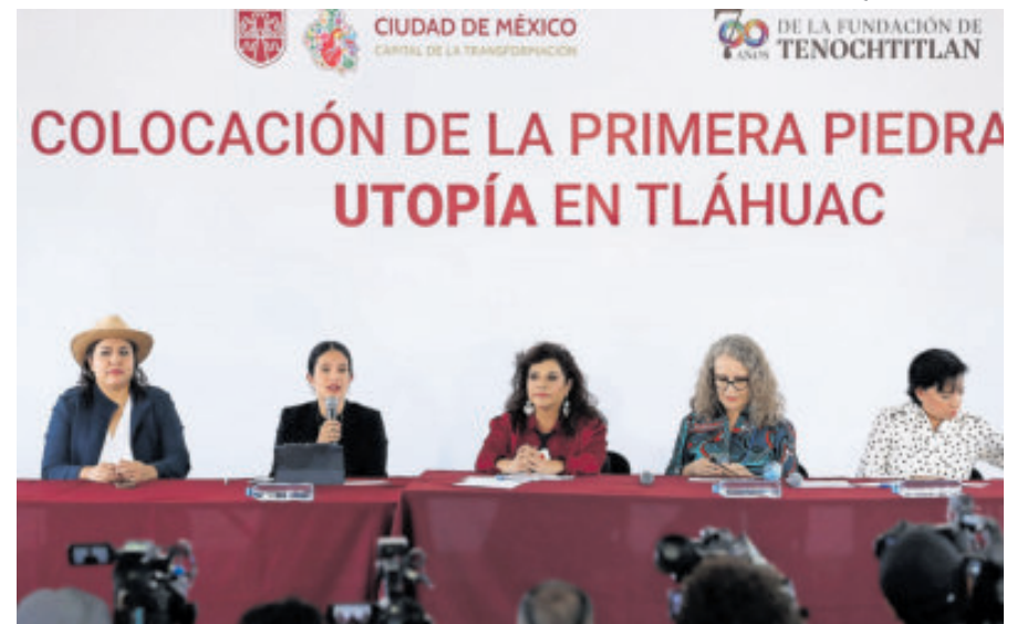
Autoridades darán seguimiento al caso.