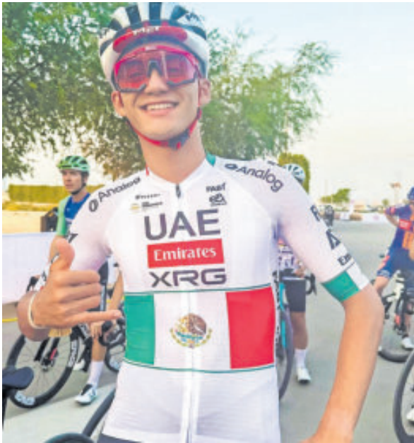
El ciclista luce orgullo con su nueva indumentaria.

La presentación del nuevo diseño coincide con el momento más dulce de la carrera del bajacaliforniano, quien la semana pasada se coronó como doble campeón nacional al imponerse en las pruebas de contrarreloj y ruta durante el Campeonato Nacional celebrado en su estado natal de Baja California. Por ello, el UAE Team