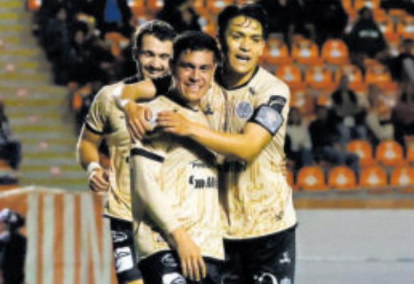
Los del cuadro de Zacatecas se mantienen con vida.