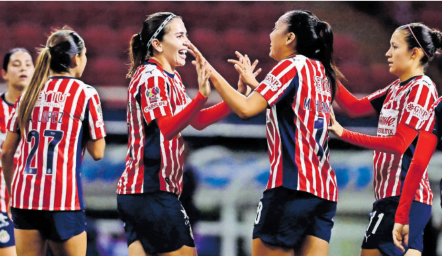
Con este resultado, el Rebaño concluyó la fase regular del torneo con 33 puntos.

DERROTAN A NECAXA Y PUEBLA, RESPECTIVAMENTE