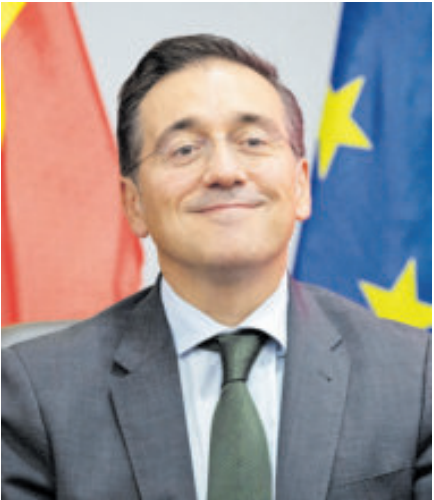
José Manuel Albares Bueno.