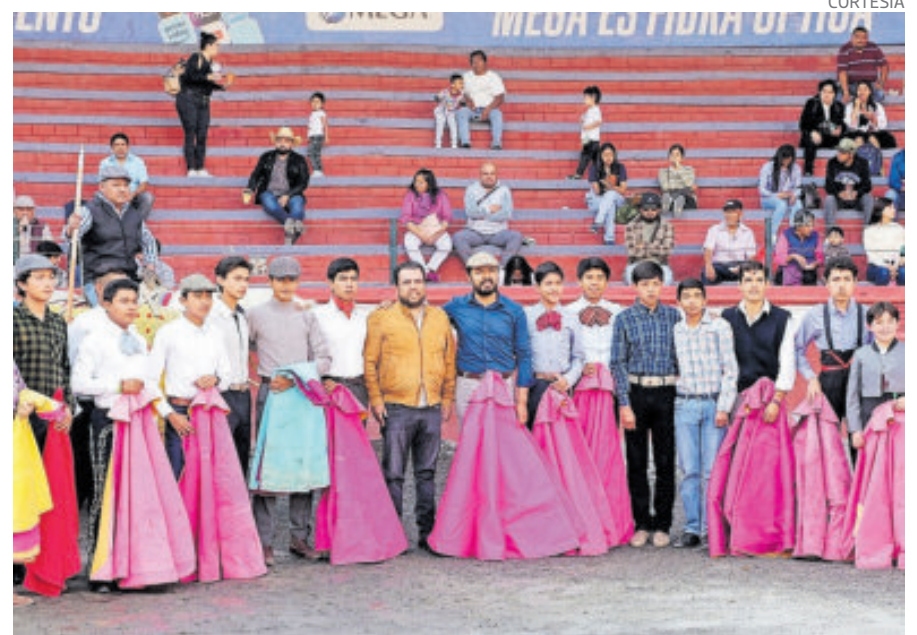
Con los mejores augurios comenzó el festival torero en Tlaxcala.

Más tarde, se registró un lleno absoluto durante la conferencia magistral Ecos de una despedida, moderada por el periodista