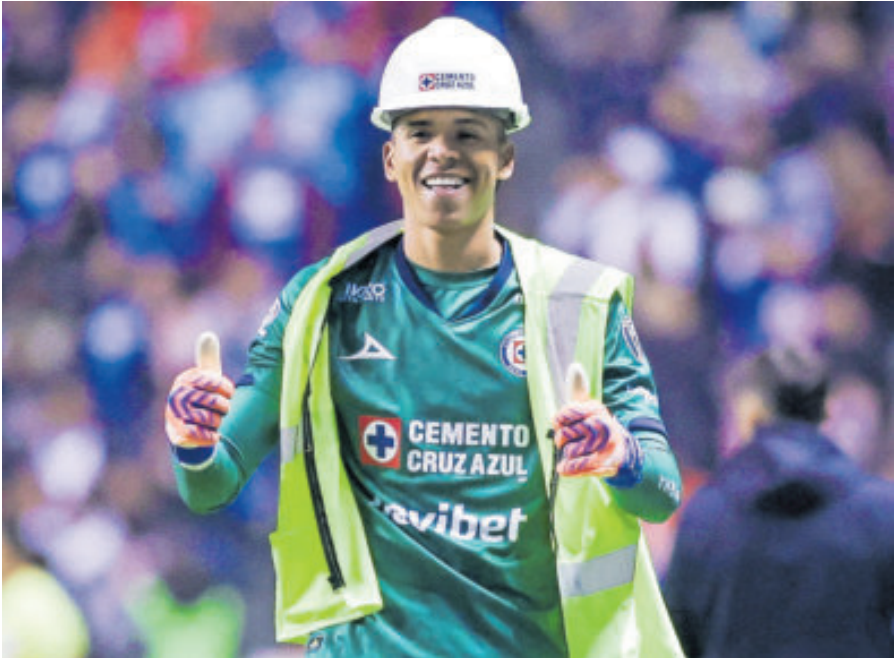
Todo fue felicidad para la visita en la cancha del Estadio Cuauhtémoc. La Máquina pita y pita.