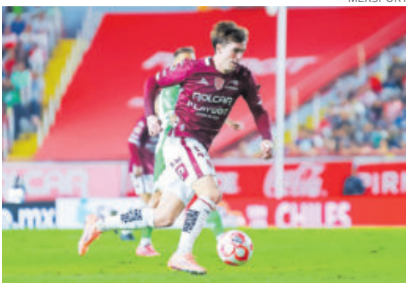
Valioso triunfo de Necaxa, que aún tiene esperanza.