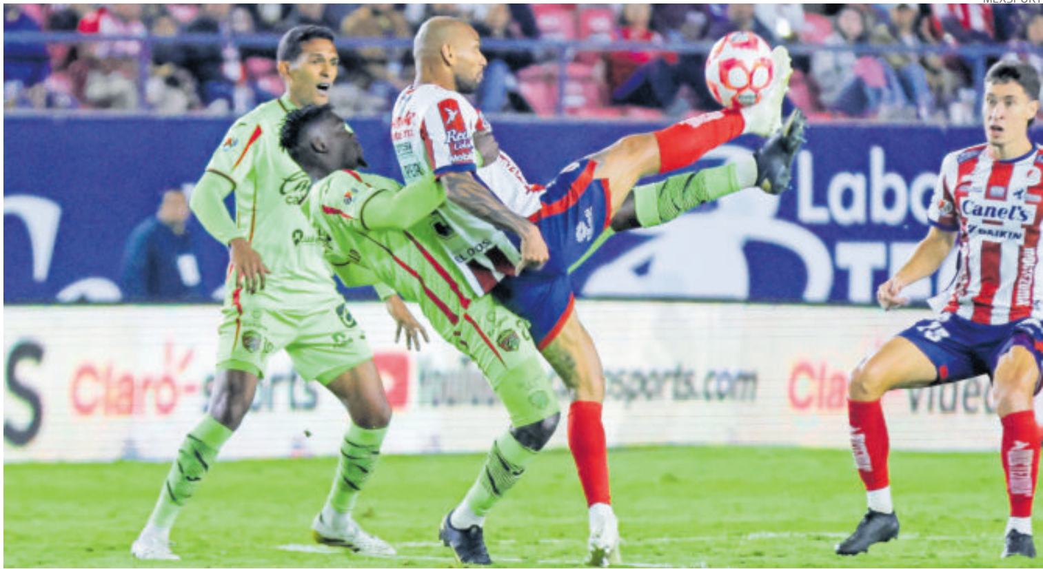
El equipo fronterizo suma valiosa victoria y se mantiene con vida para afrontar la siguiente fase del Torneo Apertura 2025.