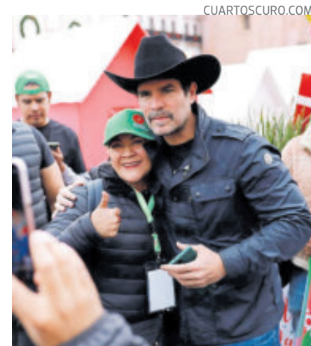
Eduardo Verástegui criticó a Milei.

La Conferencia de Acción Política Conservadora tenía programada su cumbre para el 15 y 16 de noviembre en CDMX.