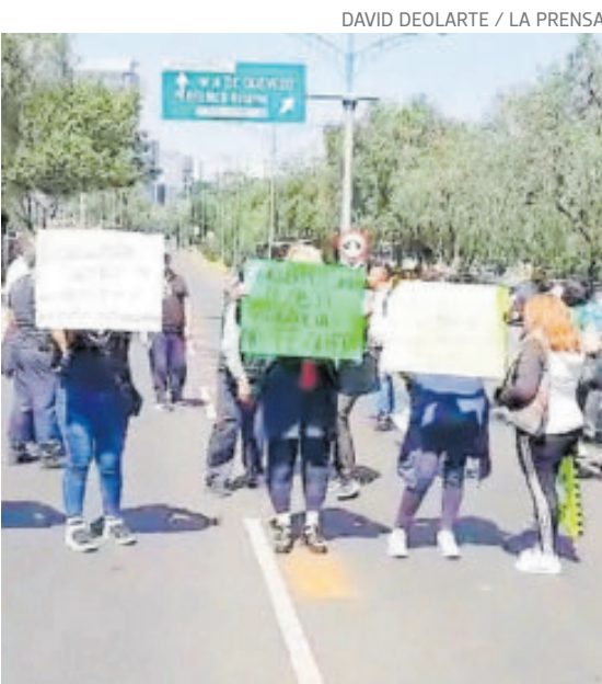
La manifestación, en avenida Insurgentes.

La fiscalía de CDMX informó que se detuvieron a cuatro elementos de seguridad UNAM y se aseguró una camioneta