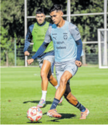
En el norte del país, el Clásico Regio.