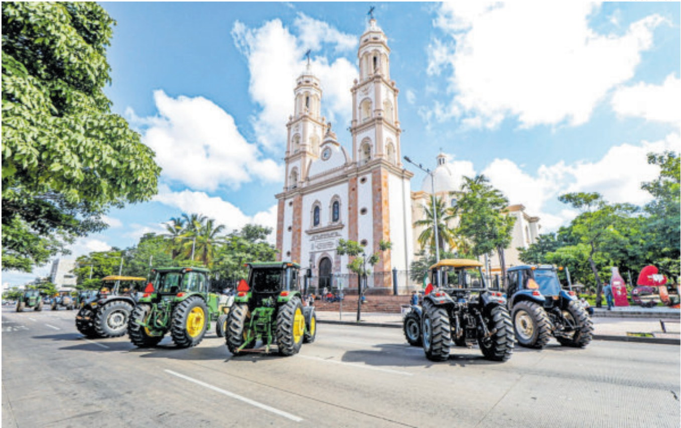
Una parte de los bloqueos que se registraron en Culiacán.