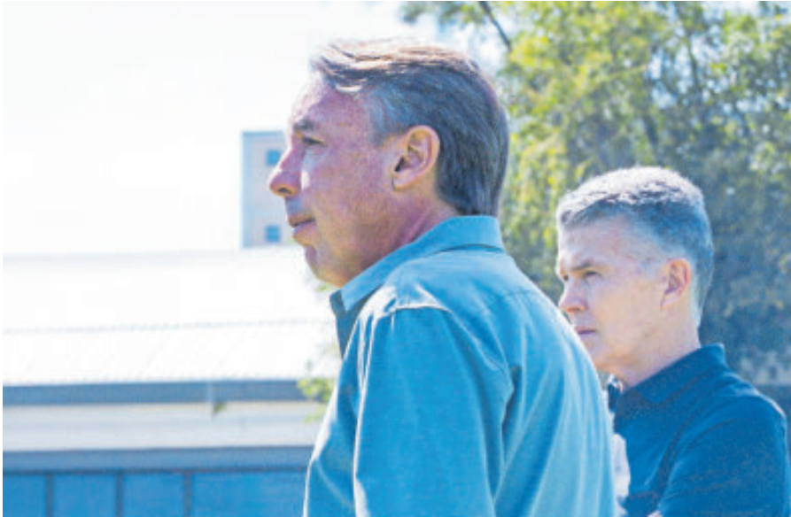
El cuadro de Coapa recibió la visita del dueño, el empresario Emilio Azcárraga.

Los Diablos visitan al Atlas, mientras que las Águilas reciben a León; en el Gigante de Acero, Rayados busca el triunfo ante Tigres