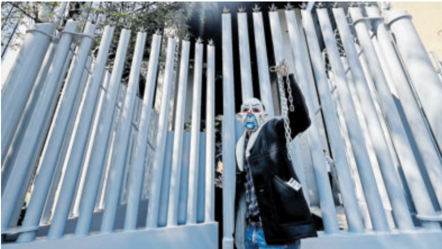
Poco antes del mediodía se abrieron las puertas.

Los manifestantes cerraron también el edificio del Órgano de Administración Judicial y las sedes de los tribunales en Guanajuato, Saltillo y otras entidades. Aseguraron que sólo se estaban atendiendo casos urgentes, como medidas cautelares, audiencias de control y libertades.