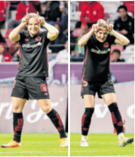
Las de Toluca aspiran a más.