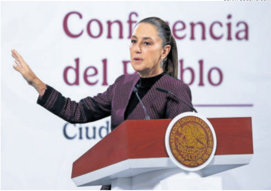
Claudia Sheinbaum Pardo, ayer, en su conferencia matutina.

Sheinbaum recordó que el 29 de septiembre de 2014 se publicó en el Diario Oficial de la Federación (DOF) la Decla-