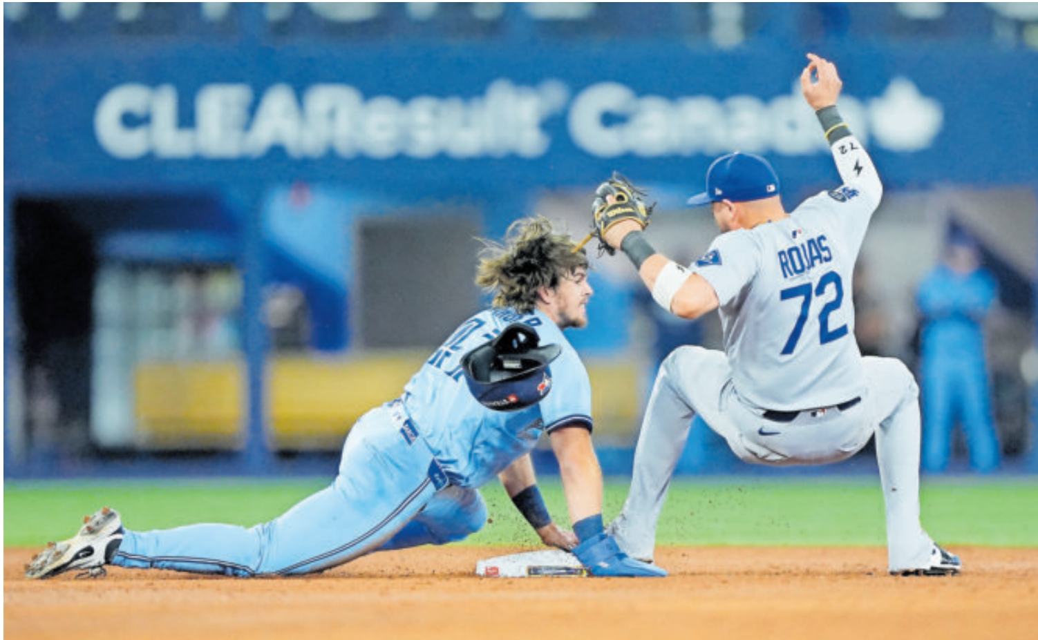
El juego acabó cuando Dodgers completaron una doble matanza en la novena.