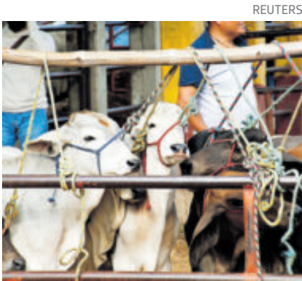
Sin riesgo con el gusano barrenador.