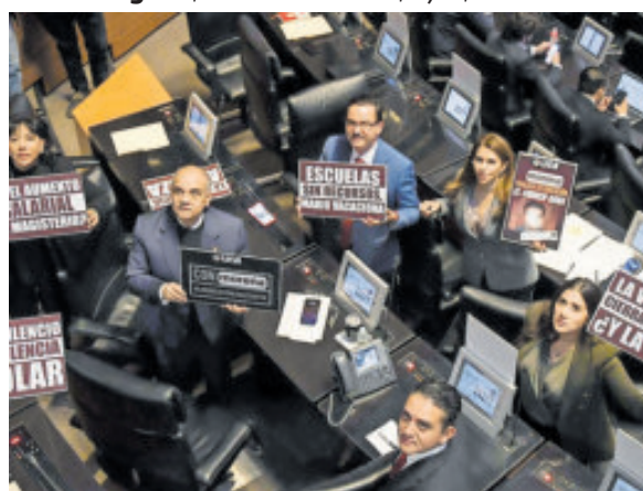
La oposición reclamó ante el secretario.