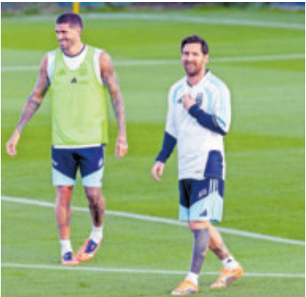
Messi piensa volver a Barcelona, pero no para jugar con los azulgrana.

“Extrañamos mucho Barcelona. Los nenes continuamente, y mi mujer, hablamos cosas de Barcelona, la idea de volver a vivir ahí. Tenemos nuestra casa, todo, así que es lo que deseamos”, indicó.