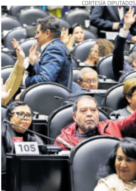
Legisladores, ayer, en sesión en la Cámara de Diputados