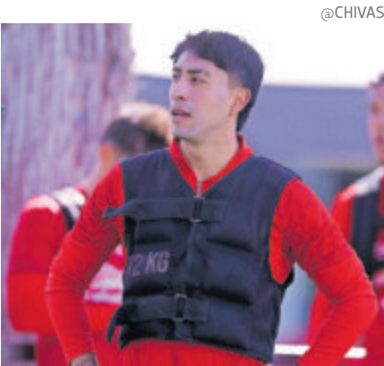
El Rebaño no quiere perder ritmo pues tendrá dos semanas de inactividad.