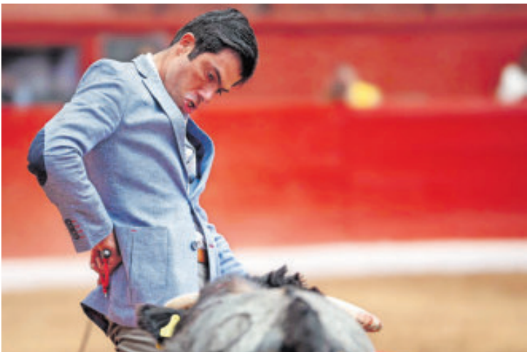
El 21 de noviembre tiene su cita en la Monumental de SLP.