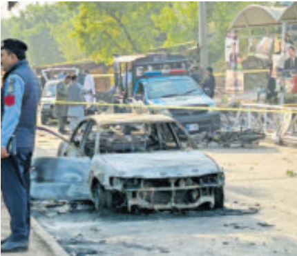
La mayoría de las víctimas eran civiles.

Islamabad. – Al menos 12 personas murieron y 27 resultaron heridas frente a un tribunal de Islamabad, la capital de Pakistán, por un ataque suicida reivindicado por los talibanes pakistaníes en un momento de fuertes tensiones con Afganistán, el país vecino. El ataque, el primero de este tipo que se produce en la ciudad en años, provocó el pánico entre la población y se produjo en una zona conocida por sus oficinas gubernamentales. AGENCIA