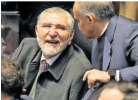
El senador morenista Adán Augusto López, ayer, en sesión.