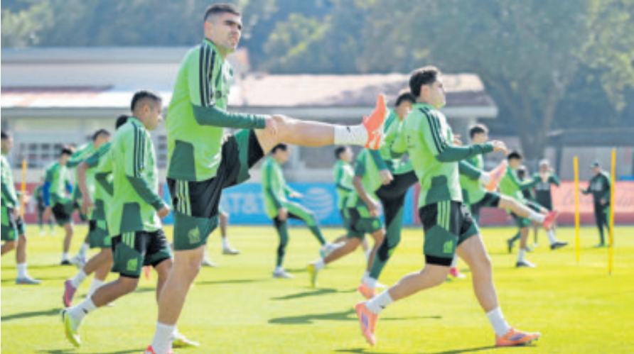
El Tricolor tiene prácticamente amarrados a Portugal y Bélgica para marzo.

Uruguay el próximo sábado en Torreón y con Paraguay el martes 18 en San Antonio.