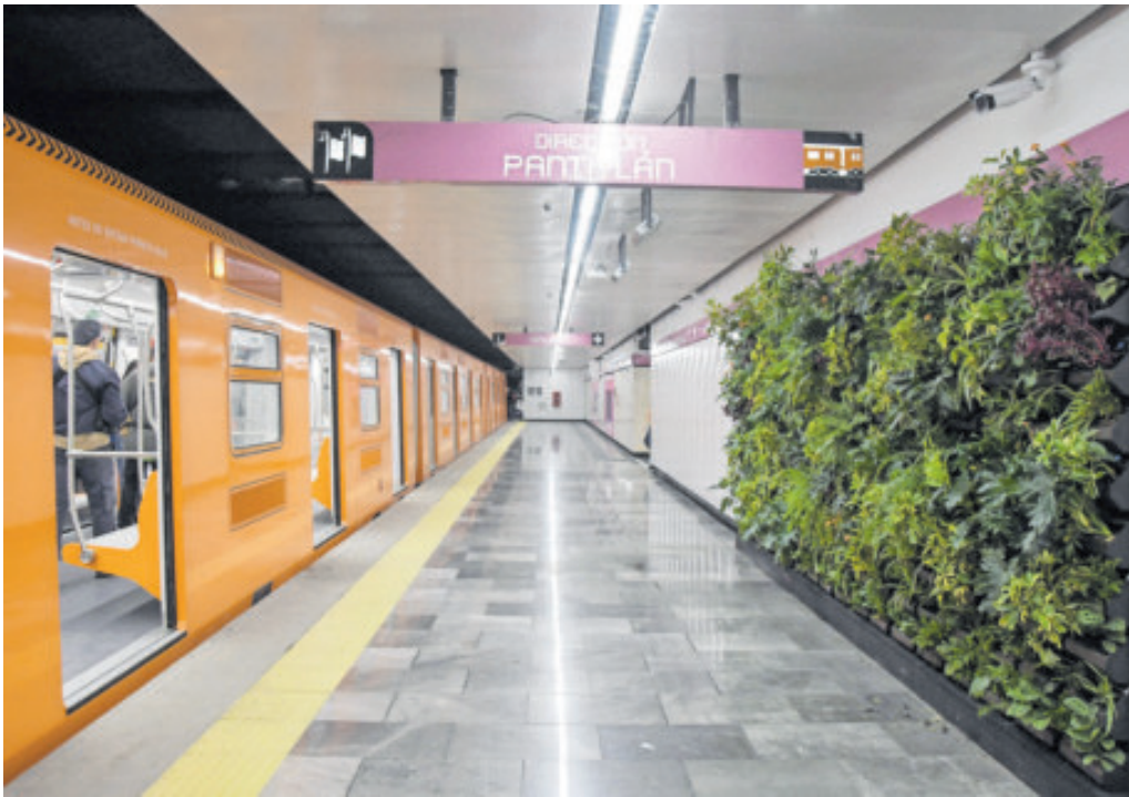
Todas las estaciones que corren de Pantitlán a Observatorio estarán en funciones.