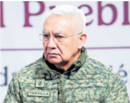
El general Ricardo Trevilla, titular de la Sedena, ayer.

“El protocolo no falló, el protocolo de nosotros, hablo de la Guardia Nacional”, dijo el general Ricardo Trevilla, titular de la Secretaría de la Defensa Nacional (Sedena), al referirse al asesinato del exalcalde Uruapan Carlos Manzo. Afirmó que los elementos asignados no pertenecían a la Guardia Nacional, sino a la policía local, por lo que se revisarán los procedimientos de protección y la capacitación del personal asignado a tareas de resguardo. El mando militar reconoció que será necesario fortalecer la concientización de las autoridades locales sobre la importancia de colaborar con las medidas de protección y aceptar el acompañamiento de unidades federales especializadas.