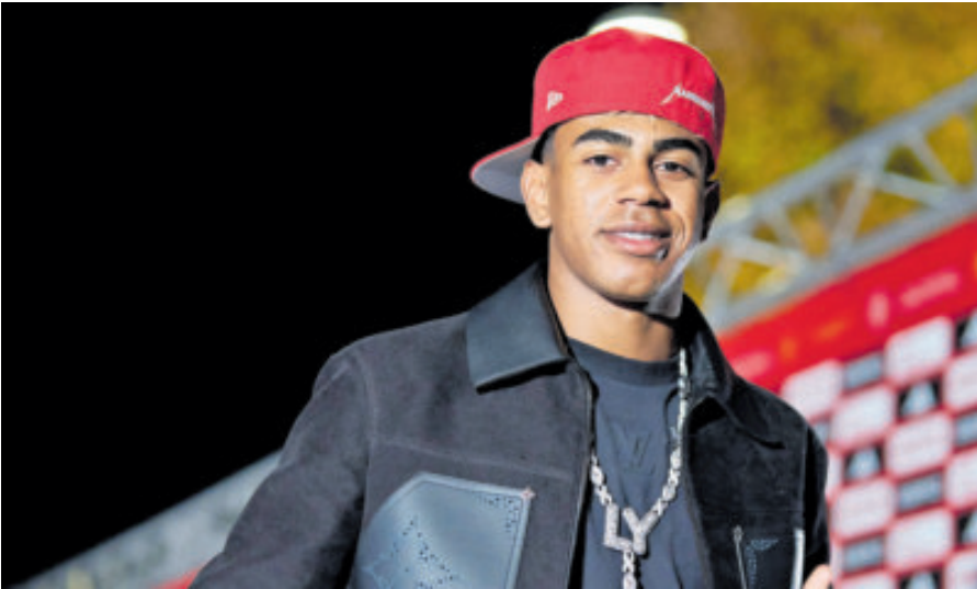
Lamine Yamal debe reposar entre 7 y 10 días tras un tratamiento que se realizó.

Agregó que “dicho procedimiento se ha realizado sin comunicación previa al cuerpo médico de la Selección, teniendo conocimiento de los detalles del mismo únicamente mediante un informe recibido a las 22:40 horas de anoche, en el que se indica la recomendación médica de reposo durante 7-10 días”, informó la RFEF, que desea al jugador una pronta y completa recuperación.