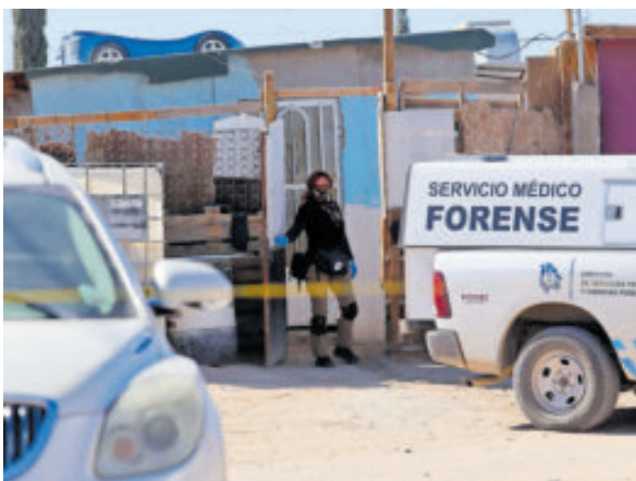
De enero a septiembre, 8 mil casos de extorsión

comercio exterior y la industria nacional, enfrenta un deterioro acelerado en sus condiciones de seguridad”, indicó. Reafirmó que la seguridad es la base del Estado de Derecho y condición indispensable para el desarrollo económico y social. “Las extorsiones, el cobro de piso y las amenazas afectan especialmente a las micro, pequeñas y medianas empresas (pipymes), que son el corazón productivo de nuestras comunidades. Cuando un empresario tiene que cerrar, trasladarse o trabajar bajo amenaza, se pierden empleos, oportunidades y confianza”, señaló.