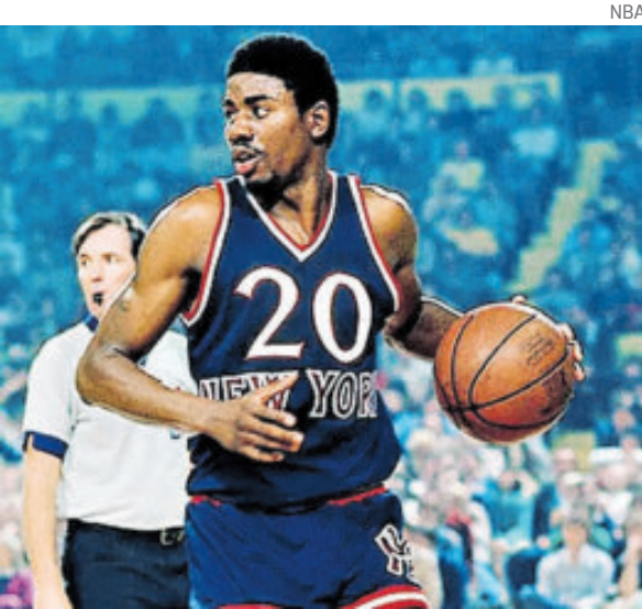
En 1986 dio positivo en un test y fue expulsado.

En 1986 Micheal Ray Richardson fue expulsado de por vida por la NBA, dirigida en ese entonces por David Stern, por violar por tercera vez la política antidopaje de la liga. Este jugador, dos veces miembro del mejor quinteto defensivo de la NBA, tenía problemas de abuso de sustancias derivados del consumo de cocaína.