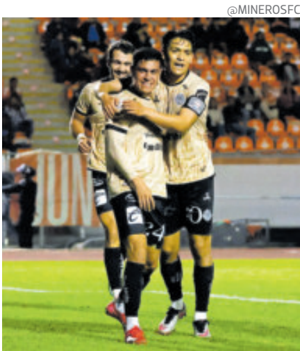
Mineros busca aprovechar la casa.