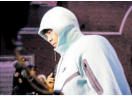
El dominicano seguirá su proceso en libertad, pero con restricciones.

“Tengo confianza y fortaleza mental y he jugado un gran tercer set. He aprovechado lo poco que me ha concedido en el segundo”, explicaría después Alcaraz, quien reconoció la dificultad del combate. “No he sido capaz de devolver bien con ese saque que tiene y lo he pasado mal. Pero ha estado muy igualado. Siempre se mantiene en el partido”, agregó.