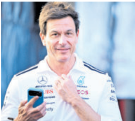
Toto Wolff negociaría 5% de su parte en el equipo de Mercedes.