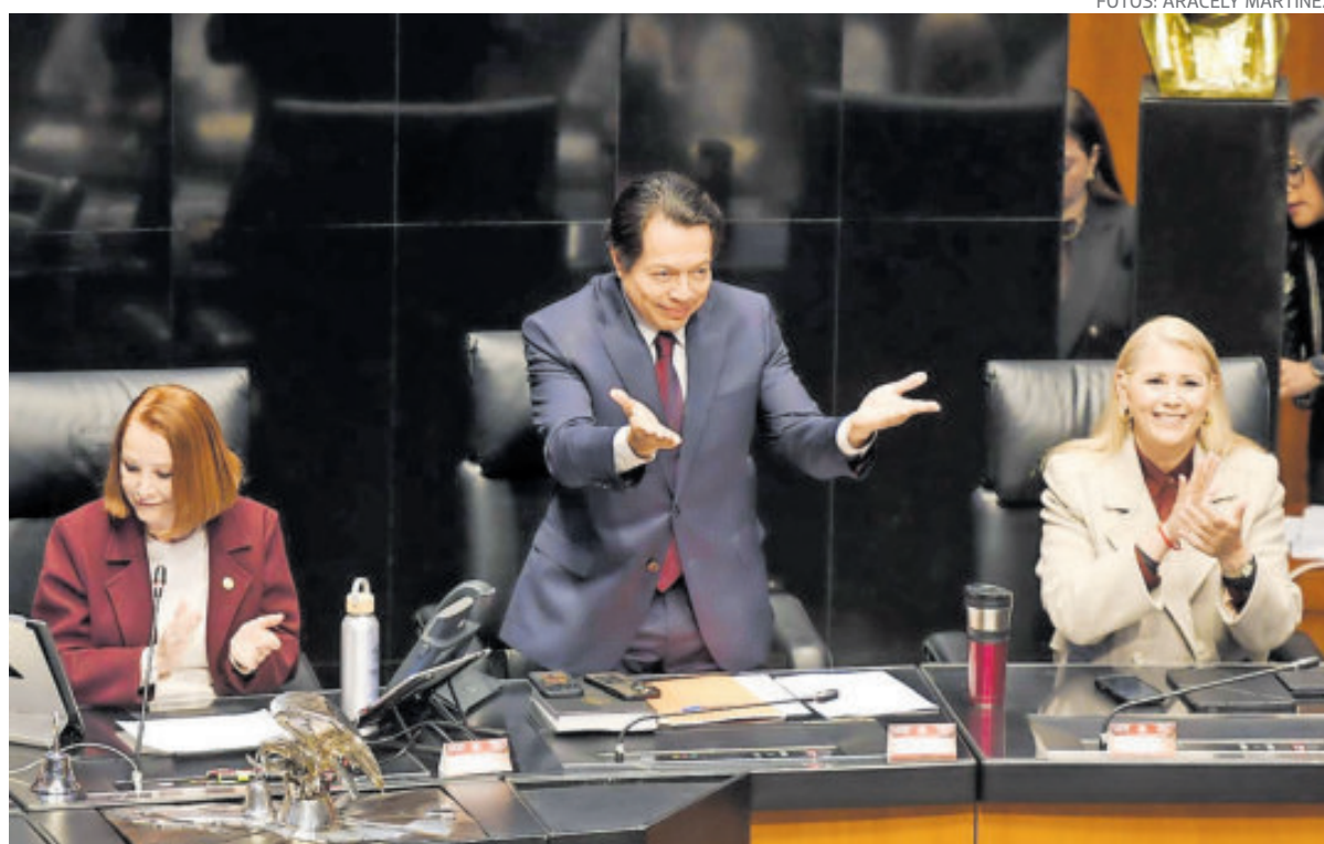
Mario Delgado, titular de la SEP, ayer, en el Senado.

Cuestionó la falta de resultados en materia de aprendizaje y la insuficiencia del presupuesto federal para atender el rezago escolar, y advirtió que los libros de texto “reflejan una visión ideológica que no corresponde con los retos reales del sistema educativo”. Citó datos de ejercicios integradores de aprendizaje de la SEP, que