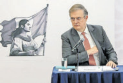
Desde 2014 no se renovaba el arancel.