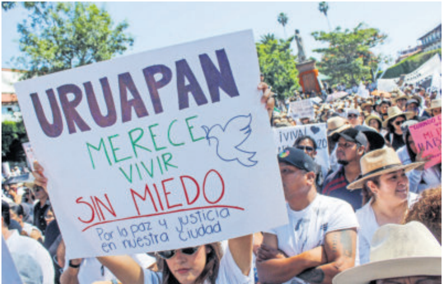
La población de Uruapan clama vivir sin miedo.