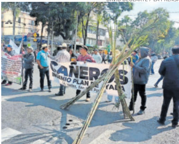
Cañeros y productores de maíz se plantaron afuera de la Sader.