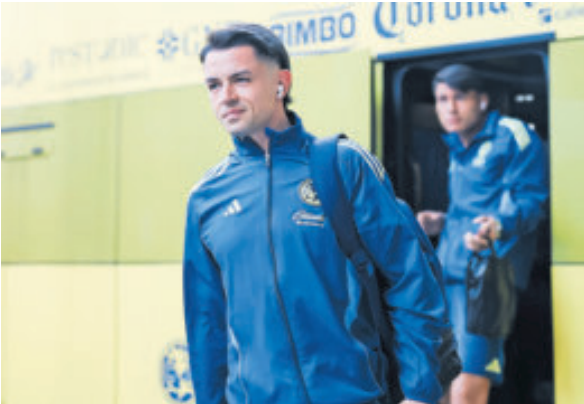
El español nacionalizado mexicano no puede jugar con el Tri hasta el próximo año por reglamento.

El Maguito pelearía por un puesto en el mediocampo tricolor para el Mundial del 2026 con gente como Marcel Ruiz, Gilberto Mora y hasta Charly Rodríguez.