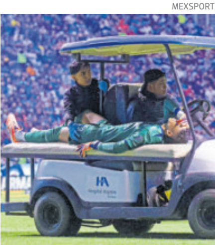
La Máquina quiere la inhabilitación del jugador panameño.