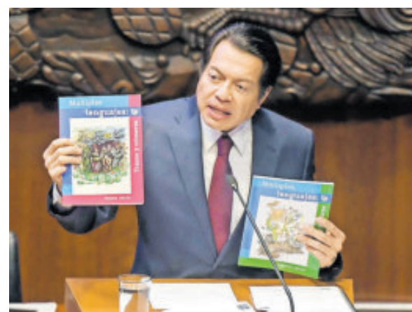
El funcionario defendió los libros de texto.

muestran que sólo una minoría de alumnos de secundaria alcanza niveles adecuados en matemáticas.