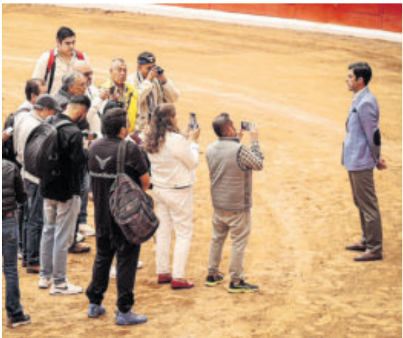
El torero anunció su desafío con seis toros.

Añadió que, en tiempos donde la sociedad cambia y las corrientes artísticas se diversifican, mantener un estilo clásico también implica resistencia.