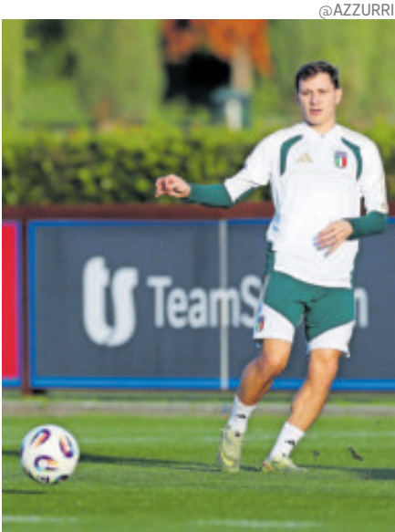
Italia lucha por regresar al Mundial, luego de faltar a los últimos dos.

Para el conjunto de Thomas Tuchel, los dos encuentros que le restan estos días son intrascendentes para su interés aunque influyentes para Albania, segunda;