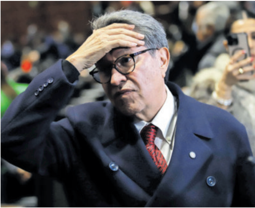
Ricardo Monreal, líder de Morena en la Cámara de Diputados.

cos y personas con experiencia en consultas de democracia directa y expertos en materia electoral, con la confianza de que saldrá un documento por consenso. Luego de que la presidenta Claudia Sheinbaum asegurara que la propuesta es buena, pero advirtiera que no debe aprobarse al vapor, sino abrirse a una discusión amplia, Monreal Ávila precisó que la Comisión de Puntos Constitucionales, que preside el diputado Leonel Godoy Rangel, va a revisar de qué manera establece un mecanismo que permita mayor discusión y deliberación sobre la revocación de mandato, en las semanas que restan antes de que acabe el año. “Puede salir a final del año la iniciativa presentada por el diputado Alfonso Ramírez Cuéllar o puede esperarse hasta el segundo periodo ordinario, que inicia el 1 de febrero, pero no nos vamos a precipitar. Como lo dije, vamos a esperar que haya una discusión más amplia y que la sociedad sepa de lo que se trata la revocación de mandato”, puntualizó.