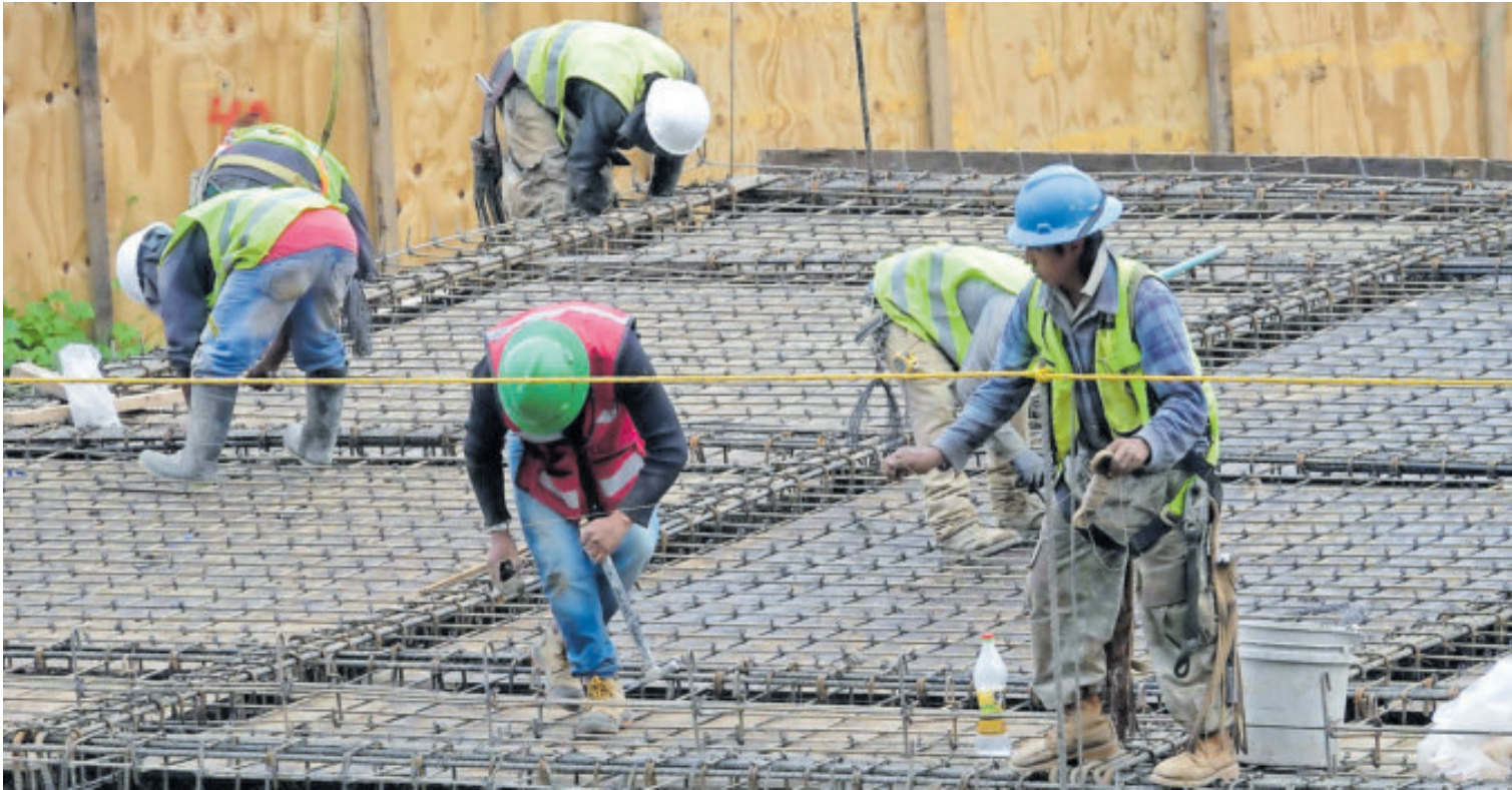
La construcción sufrió fuertes contracciones mensuales, con lo que afectó a la actividad industrial.