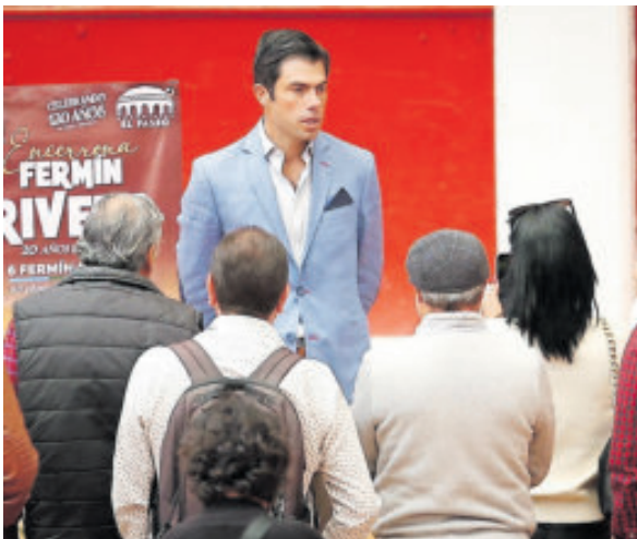
Llega en un momento de madurez en su carrera.