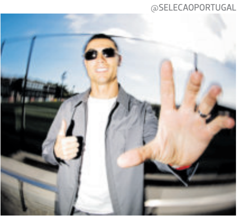
Cristiano Ronaldo sabe que el Mundial 2026 será el último en su carrera.

“Esto (diez años) significa próximamente