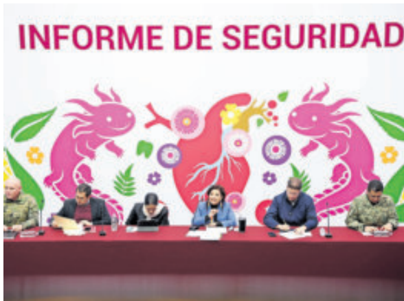
Clara Brugada, con el gabinete de seguridad.