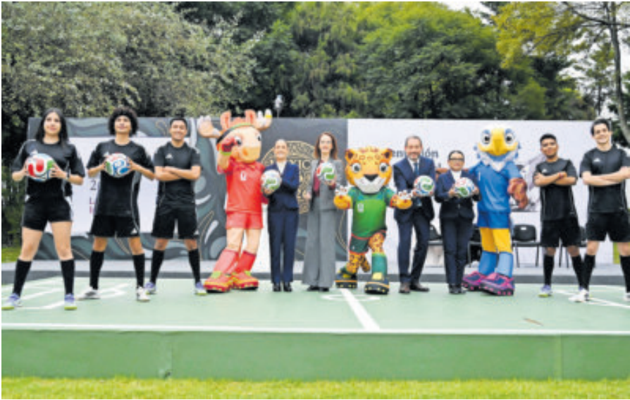
México se alista en todos los sentidos para recibir la Copa del Mundo del 2026.