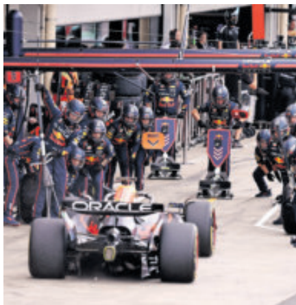
Red Bull y Racing Bulls se asociaron con Ford para sus motores.

Toto Wolff está en conversaciones avanzadas para vender parte de su participación en Mercedes F1 en una operación que valoraría al equipo de Fórmula Uno en la cifra récord de 6 mil millones de dólares, informaron Sportico y el Financial Times . En la actualidad, Wolff, Mercedes-Benz e Ineos poseen 33% de las acciones cada uno. Los reportes señalan que el austriaco, que es director del equipo y de Mercedes Motorsport, planea atraer a un inversor externo al holding que posee su participación.