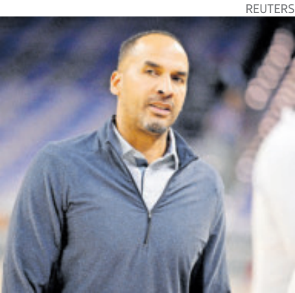
Harrison se echó a la afición encima.

Con un inicio de temporada 2025-26 marcado por un deprimente récord de 3-8, la salida de Harrison pone fin a cuatro temporadas al mando, pero será eternamente recordada por el que ya es con-