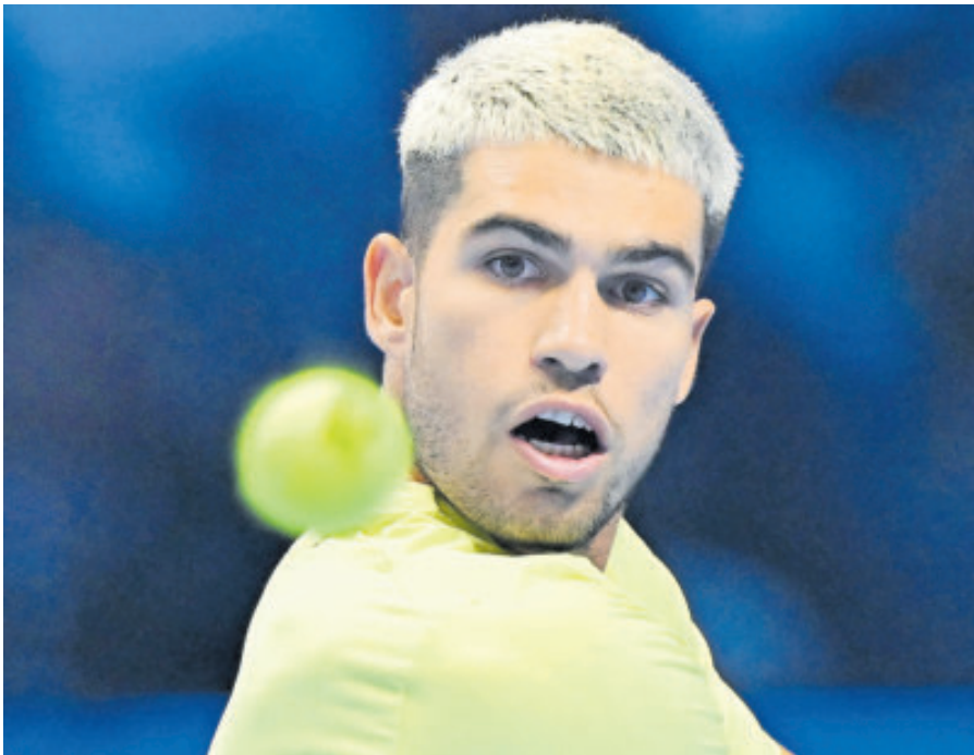
El español está muy cerca de acceder a las semifinales del torneo.

CON LA VICTORIA Alcaraz no sólo lidera el Grupo Jimmy Connors, sino que se perfila como el favorito para el primer puesto anual.