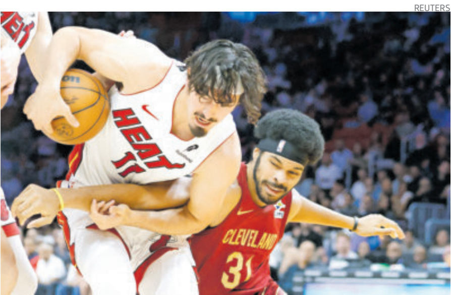
Jaquez Jr. está registrando sus mejores números en la NBA en su tercer año.