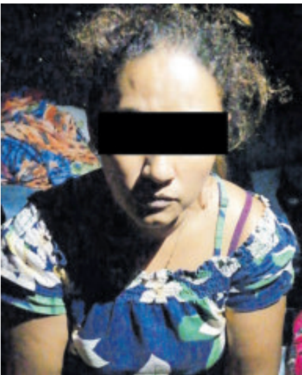
Una de las mujeres detenidas por la policía.