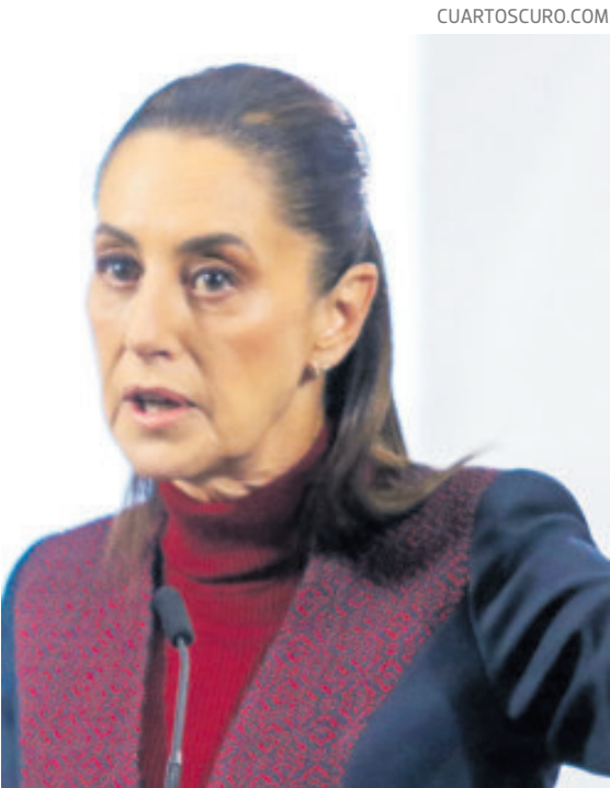
La presidenta Claudia Sheinbaum, ayer, en conferencia de prensa.

a la Constitución. No es algo nuevo, ya forma parte de nuestras leyes”, señaló. Recordó que, cuando López Obrador fue jefe de Gobierno organizaba consultas telefónicas cada dos años para conocer si la población deseaba que continuara en el cargo. Subrayó que, por ese antecedente, la actual discusión legislativa se limita a definir la fecha de la próxima consulta, no su aplicación. “Algunos diputados propusieron que la revocación se haga en 2027, no en 2028, como originalmente correspondería, y eso es algo que puede analizarse. No significa que se esté convocando anticipadamente a una revocación, sino que se está revisando el calendario”, explicó. Según la mandataria, adelantar la consulta tendría ventajas logísticas y financieras. No obstante, insistió en que cualquier cambio debe ser analizado con responsabilidad y transparencia. “No debe aprobarse al vapor. Es una buena propuesta, pero tiene que discutirse”, indicó.