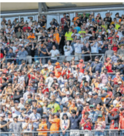
Los aficionados podrán ver el regreso de Checo el próximo año.

Los organizadores recomiendan a los seguidores planificar su compra con anticipación y mantener paciencia durante el proceso.