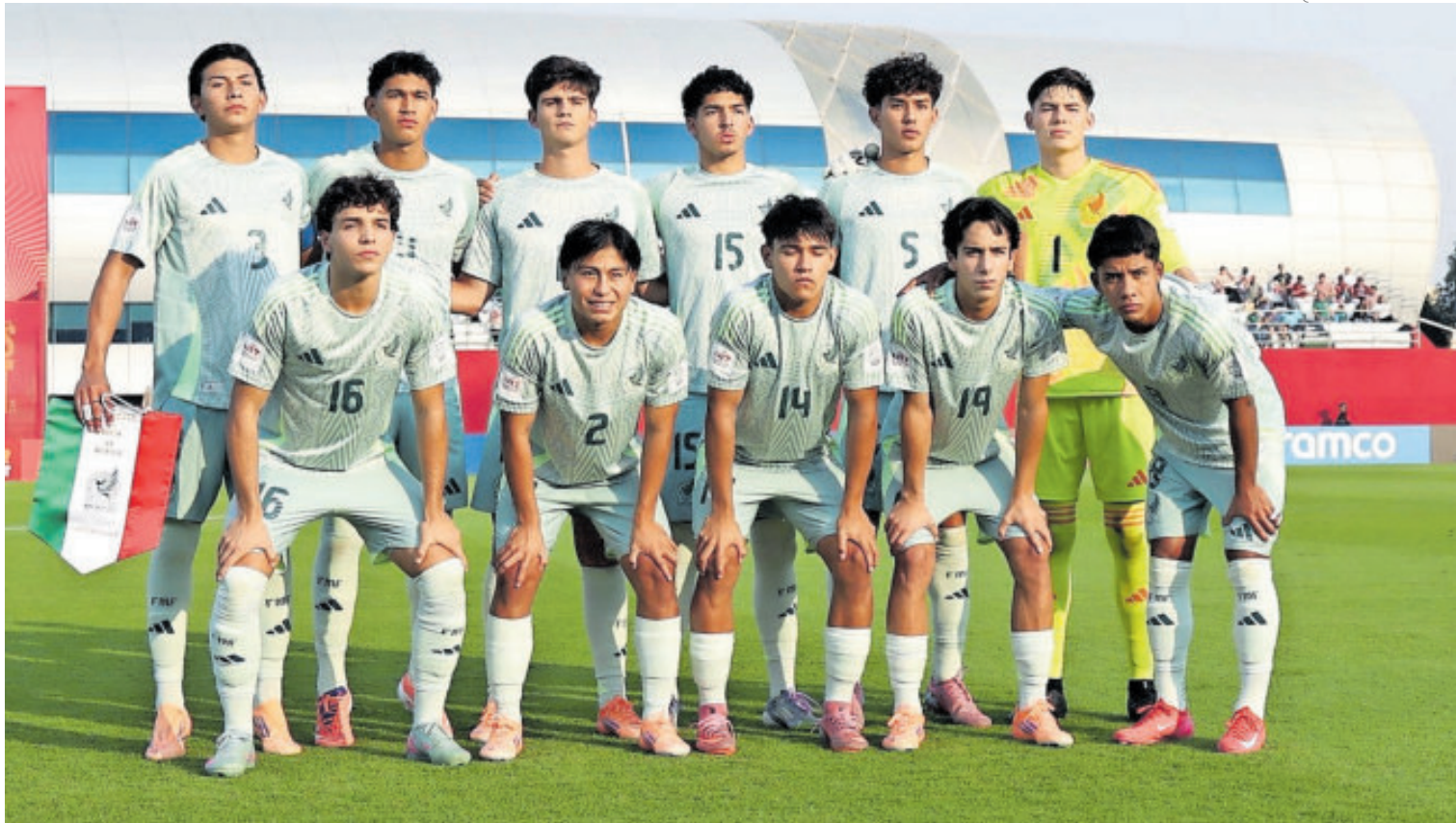
Como sea, pero finalmente al Tricolor le alcanzó para colarse a la siguiente ronda y continúa con vida en el Mundial juvenil en Qatar.