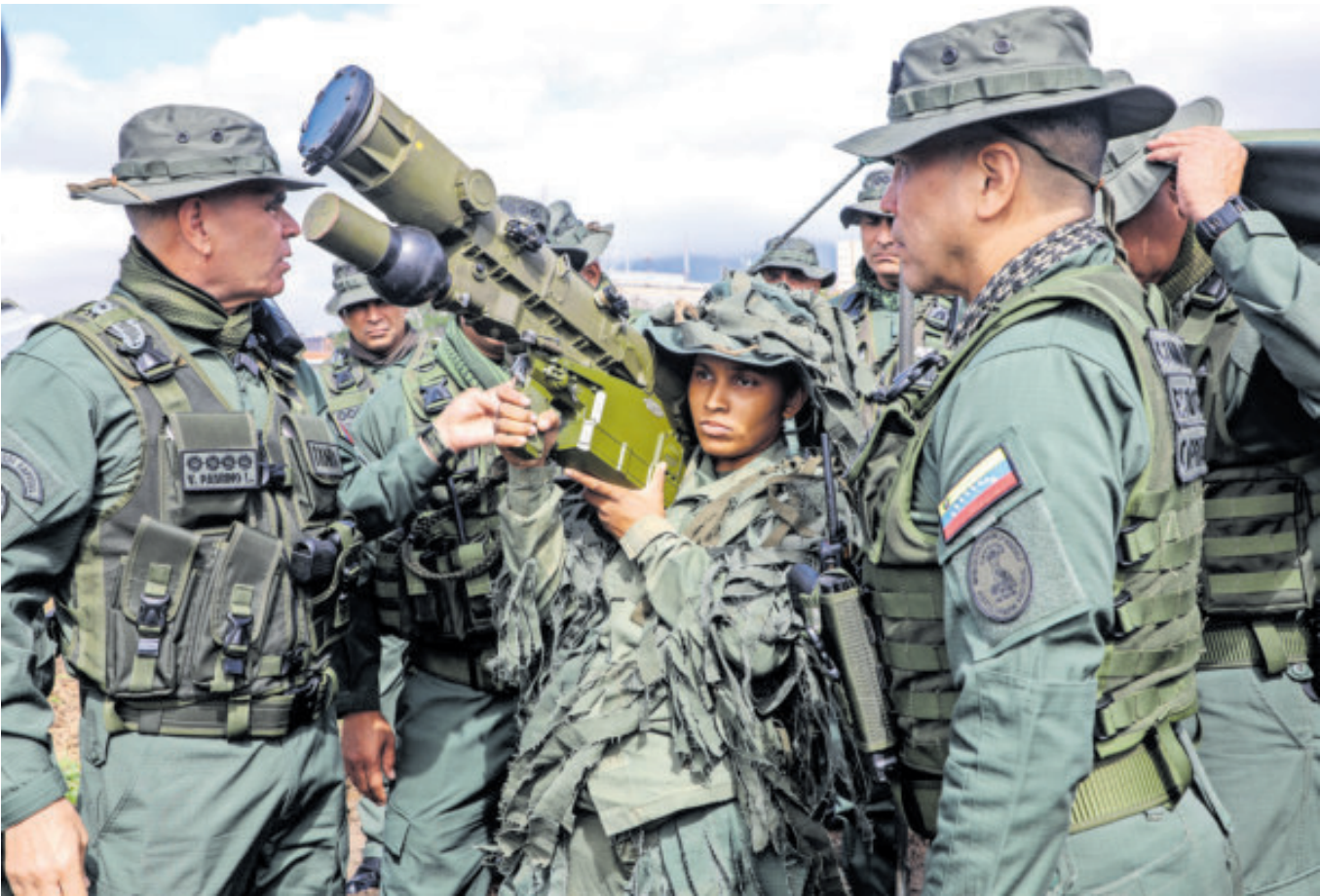
Militares venezolanos realizan ejercicios ante una posible invasión estadounidense por el Caribe.