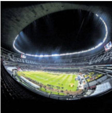
Costa será el responsable de la reapertura del Estadio Azteca en marzo.

A su vez, se informó que Costa será el responsable de la reapertura del estadio Azteca, la cual está programada para el 28 de marzo del 2026, con el partido de preparación de México ante, muy probablemente, Portugal, con