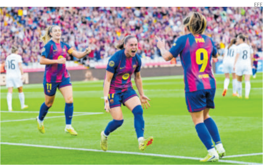
La polaca Ewa Pajor regresó con el Barça y le metió dos al Real Madrid.