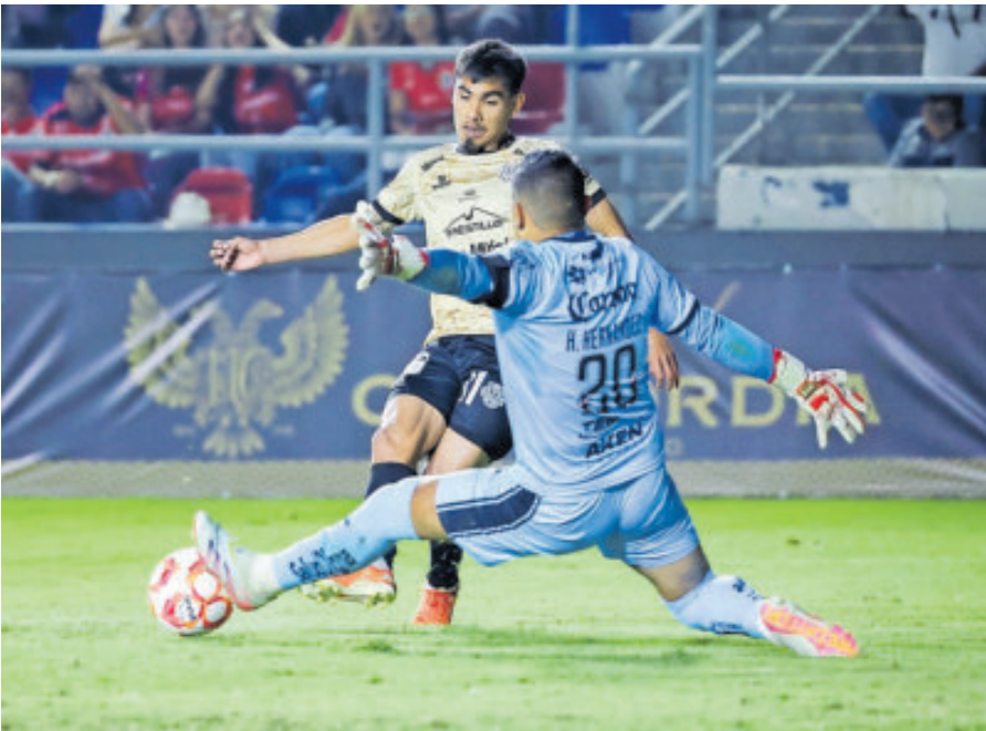
El conjunto minero pudo empatar el global, pero se quedó a la orilla.