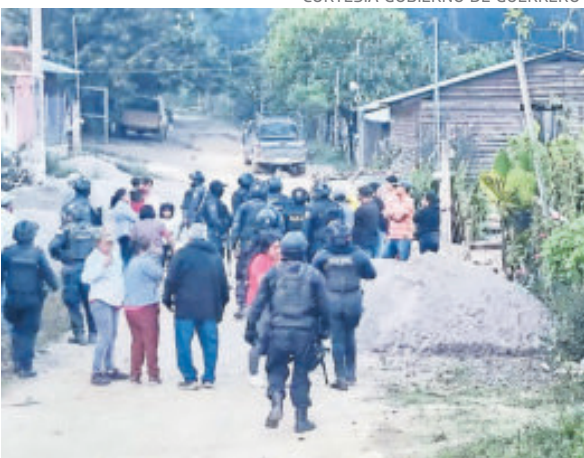
Pobladores denuncian ataques con drones explosivos en comunidades de la sierra de Chilpancingo.

Tras los hechos, el Ayuntamiento de Chilpancingo solicitó al gobierno Federal reforzar la seguridad, señalando que la violencia ha superado la capacidad municipal. El pronunciamiento se dio luego de denuncias de ataques con drones, vehículos incendiados y la desaparición del comisario de El Tejocote.