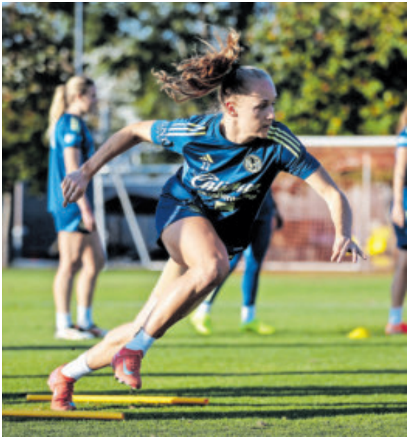
El equipo de Coapa tiene una cómoda ventaja de dos goles sobre las Chivas de Guadalajara.

En tanto, a las 16:00 horas en el Volcán de Nuevo León, las Amazonas reciben a Cruz Azul, con un empate 1-1 en el global, con el que Tigres avanza a la Final. El conjunto felino terminó líder en la fase regular, por lo que con cualquier empate en este cotejo, accederá a la Final del fútbol mexicano. Mientras que La Máquina necesita forzosamente ganar este encuentro, para acceder a la que sería su primera gran Final de la Liga MX Femenil.