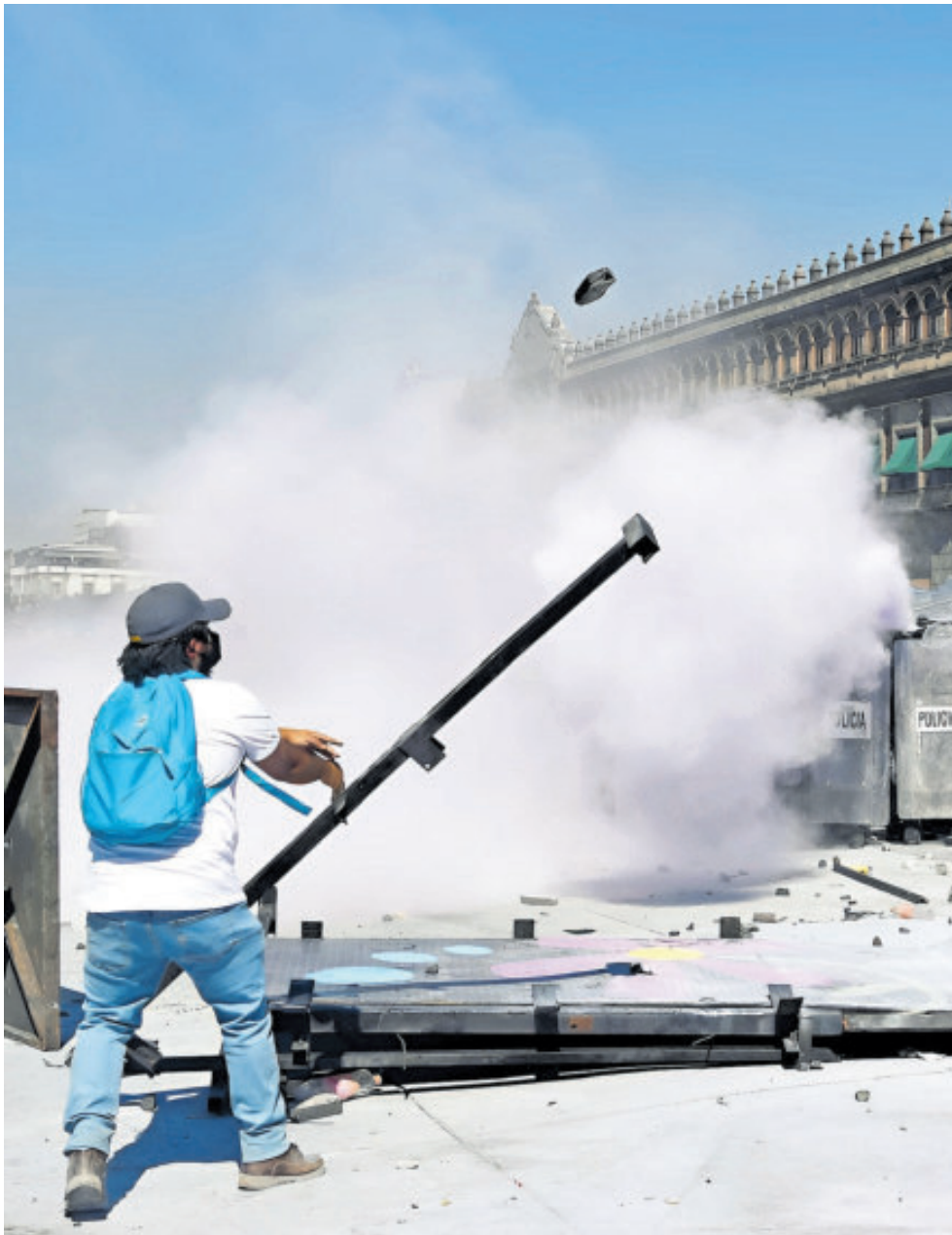
Algunos jóvenes utilizaron parte de los objetos de las vallas para atacar a los policías.

La agresión ocurrió precisamente por el costado de la Catedral Metropolitana, donde el bloque negro concentró sus embates iniciales. Los policías, apostados del lado interno del cerco que rodeaba la sede del Poder Ejecutivo federal, devolvieron los proyectiles lanzados desde el grupo encapuchado y activaron gases y dos artefactos de dispersión, en un intento por