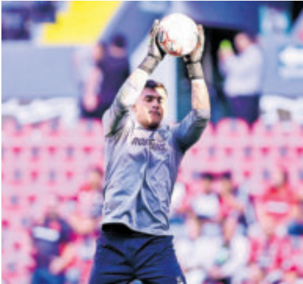
El arquero es pieza clave del Toluca.