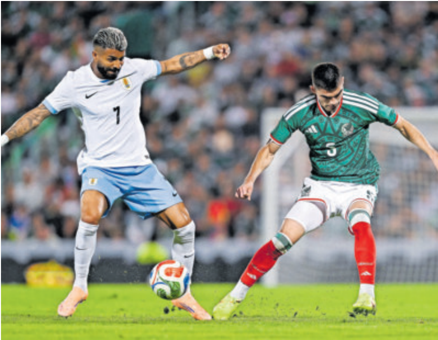
Uruguay presentó una alineación con jugadores de la Liga MX, como el Búfalo.

Rodríguez y Rodrigo Aguirre (América, además de Juan Manuel Sanabria (San Luis) en tridente ofensivo, aunado a algunas figuras europeas como José María Giménez (Atlético de Madrid) y Rodrigo Bentancur (Tottenham).