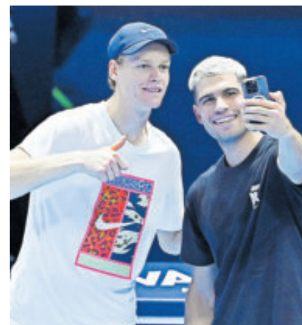
Carlitos Alcaraz y Jannik Sinner se han visto la cara un total de 15 veces.

Los otros duelos de este domingo son: Panthers vs Falcons, Buccaneers vs Bills, Texans vs Titans, Bears vs Vikings, Packers vs Giants, Bengals vs Steelers, Chargers vs Jaguars, Seahawks vs Rams, 49ers vs Cardinals, Ravens vs Browns, Chiefs vs Broncos y Lions vs Eagles; el lunes, Cowboys vs Raiders.