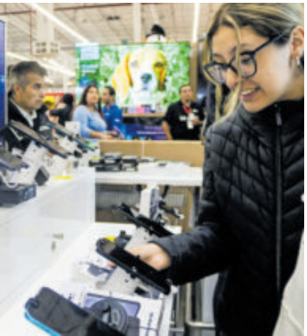
Compra de celulares y tecnologías predominan.