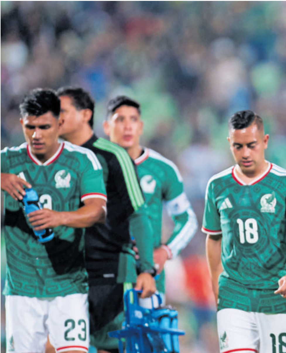
Nada cambió para la Selección Mexicana, que estuvo muy errática al frente y los cambios tampoco funcionaron, a unos meses del Mundial 2026.