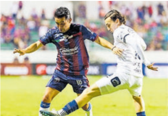
Ni la experiencia del Hobbit Bermúdez pudo pesar para evitar la eliminación de los Potros.

El encuentro arrancó con un Tepatlilán valiente y posesivo. Al minuto 19, un remate certero decretó el 1-0 parcial, lo que amplió la ventaja global a 2-0. Esto obligó al Atlante a anotar dos goles para avanzar.