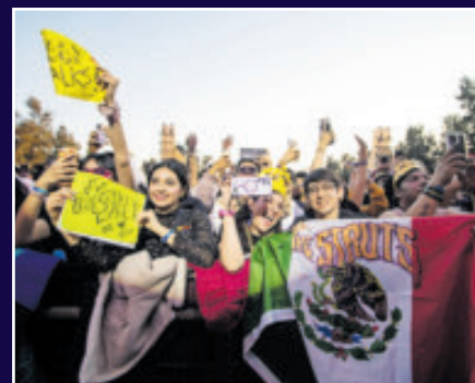
Los fans disfrutaron su show.

Al bajar el sol y con un ambiente por todo lo alto, ya la banda escocesa Mogwai tomó el escenario principal, donde algunos aprovecharon que aún no descendía la temperatura, para descansar un momento en