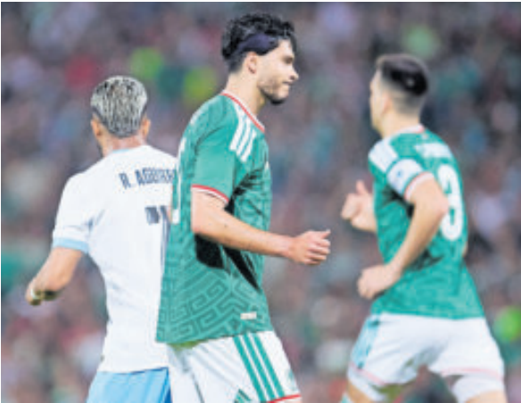
Raúl Jiménez estuvo poco certero en el ataque mexicano al dejar escapar por lo menos dos claras.