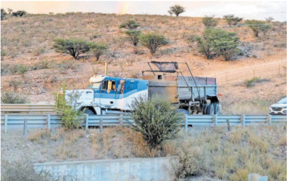
Varios vehículos fueron atravesados en el camino poco después del ataque.

TESTIGOS señalaron que las detonaciones se prolongaron varios minutos, lo que provocó pánico entre quienes se encontraban en las inmediaciones.