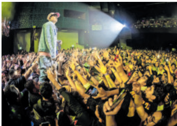
Presentó los temas De vuelta a las andadas .

Tras cantar "Vuelta a las andadas", Alemán expresó: "Gracias por estar aquí presentes una vez más acompañándonos a la Homegrown Mafia (el colectivo de rap al que pertenece).