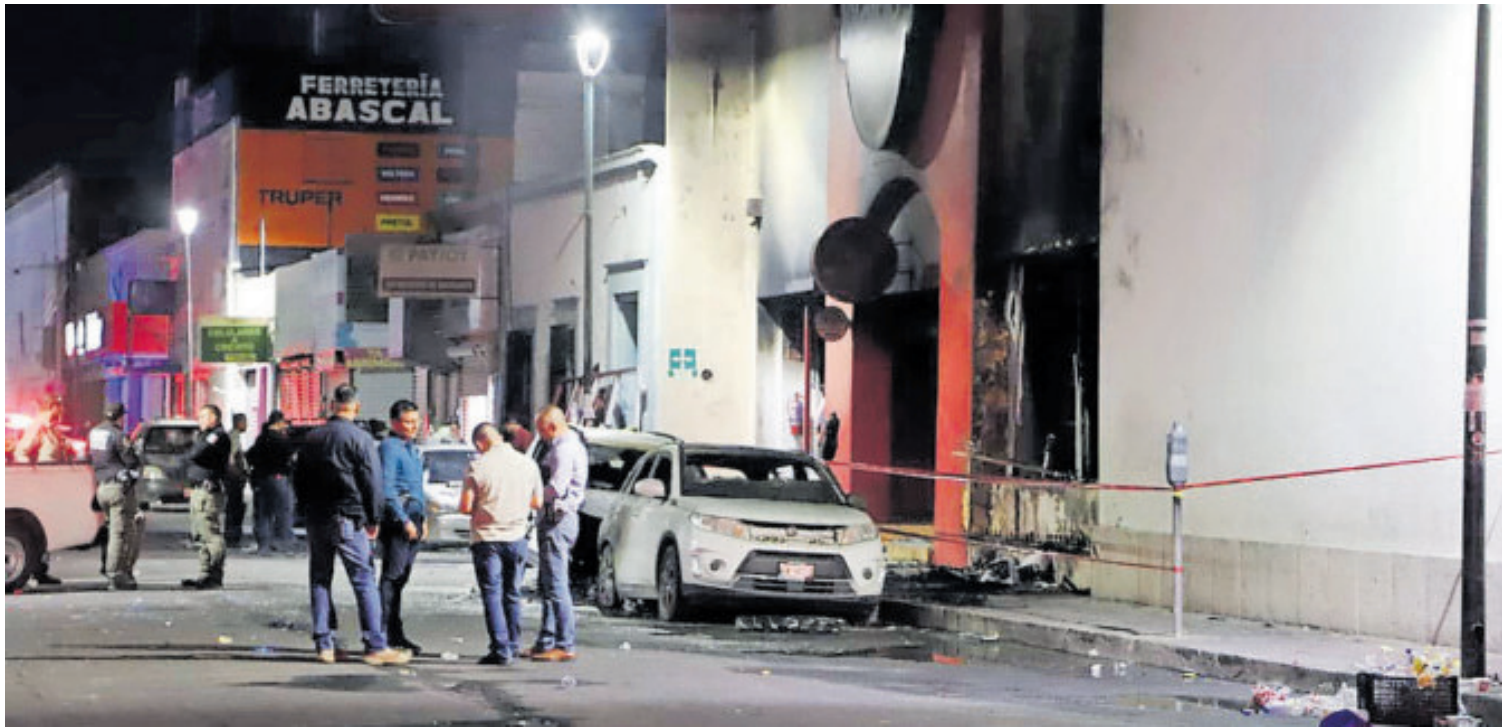
Una fuerte explosión se registró en la sucursal de Waldo's del Centro de Hermosillo.