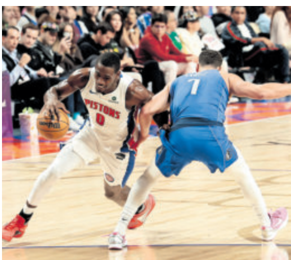
El duelo cumplió sobradamente con la expectativa.