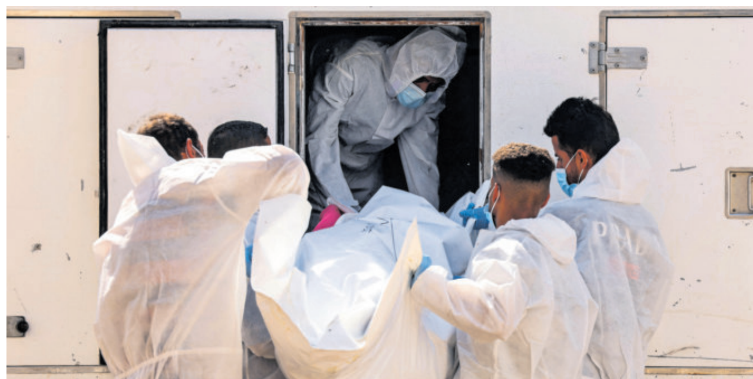
Resguardo de cadáveres entregados por Israel.

La tregua mediada por Estados Unidos, que dejó sin resolver cuestiones como el desarme de Hamás y un calendario para la retirada israelí de Gaza, ha sido puesta a prueba por brotes periódicos de violencia desde que entró en vigor.