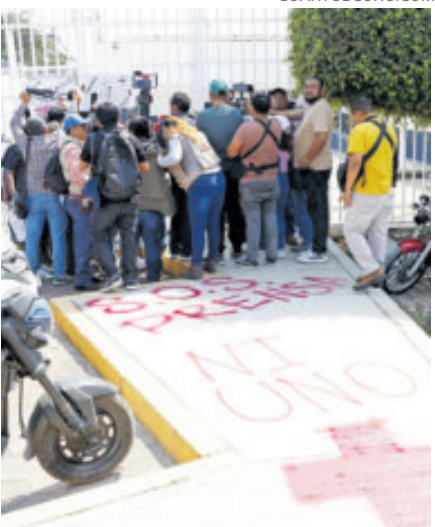
Protesta de periodistas en Guerrero.

G inebra.- México se posiciona como el país sin un conflicto armado donde más periodistas han sido asesinados, 10, superando a Sudán, con siete. La Campaña Emblema de Prensa (PEC) reportó ayer que esos 10 comunicadores muertos en el país son parte de los 153 periodistas y trabajadores de medios asesinados en el mundo en lo que va de año, una cifra que “nunca había sido tan alta en 10 meses”, resaltando que dos tercios de las muertes se produjeron en conflictos armados. La Franja de Gaza ha sido especialmente peligrosa para los profesionales de la información, con 57 periodistas asesinados en lo que va de año. Le siguen la guerra de Ucrania y Yemen, sumido en una contienda civil desde 2015, con otros 11 cada uno. México sigue en la lista, con 10. “Nunca antes habían sido asesinados tantos periodistas sin que se lleven a cabo