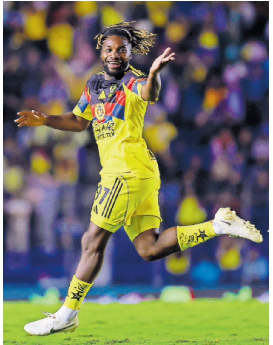
Saint-Maximin abrió el marcador con tremendo golazo fuera del área.

Al interior del cuadro de Coapa esperan recuperar a varios de sus jugadores, aunque si no están listos, tampoco habrá necesidad de arriesgarlos porque está cerca la Liguilla.