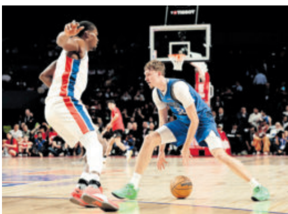
Los Mavericks se quedaron lejos.