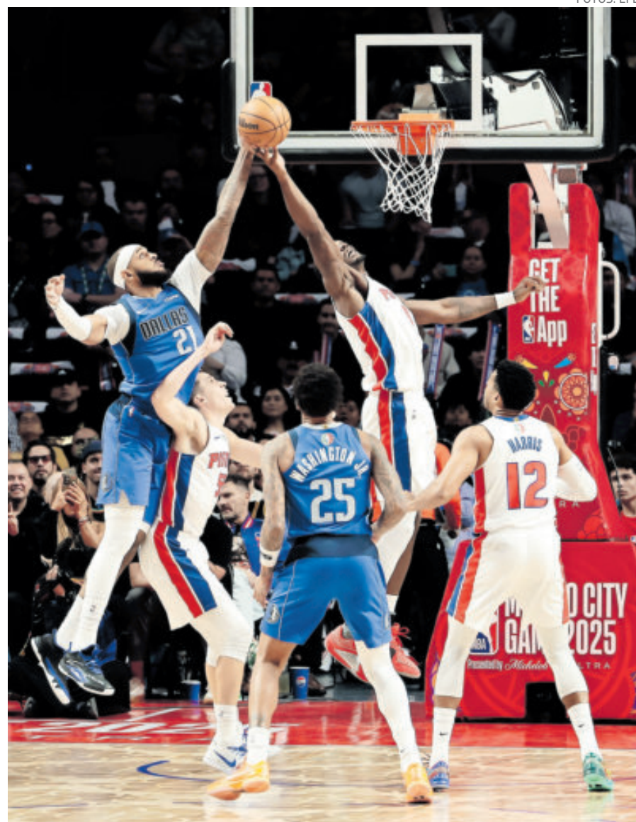
La Arena CDMX lució pletórica, al máximo de su capacidad, en medio de un ambiente colorido por la celebración del Día de Muertos y buen baloncesto.

El toque mexicano llegó a la mitad con un emotivo espectáculo de alebrijes y catrinas por el Día de Muertos.