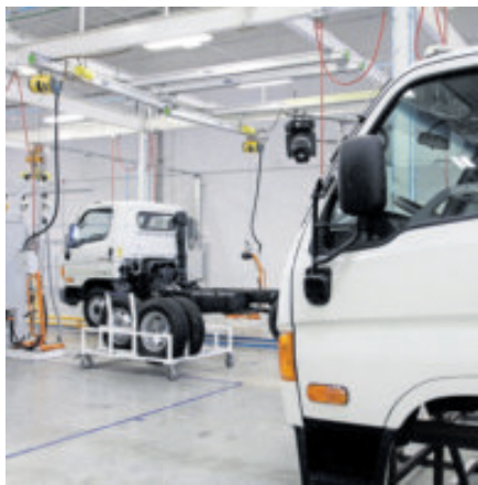
Gran parte de camiones de Ford, GM y Stellantis procede de México.

Los aranceles de 25 por ciento sobre los camiones medianos y pesados importados a Estados Unidos entraron en vigor este sábado, una medida que afecta especialmente a México, donde se producen principalmente vehículos de tonelaje medio para fabricantes estadounidenses. Así, desde ayer los nuevos impuestos aduaneros se aplican a los camiones que van de la clase tres a la clase ocho, así como a sus componentes relacionados. La medida, enmarcada en la guerra comercial emprendida por el presidente estadounidense, Donald Trump, había sido adelantada varias veces por el propio mandatario, quien afirmó en principio que los gravámenes entrarían en octubre, pero fue a principios del mes pasado cuando Trump confirmó que los aranceles regirían a partir ayer.