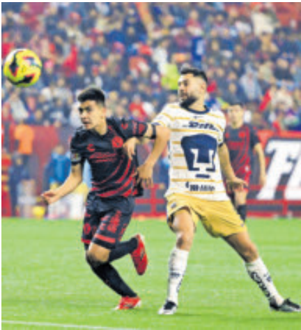
Pumas y Xolos no tienen de otra más que sacar el triunfo este mediodía.