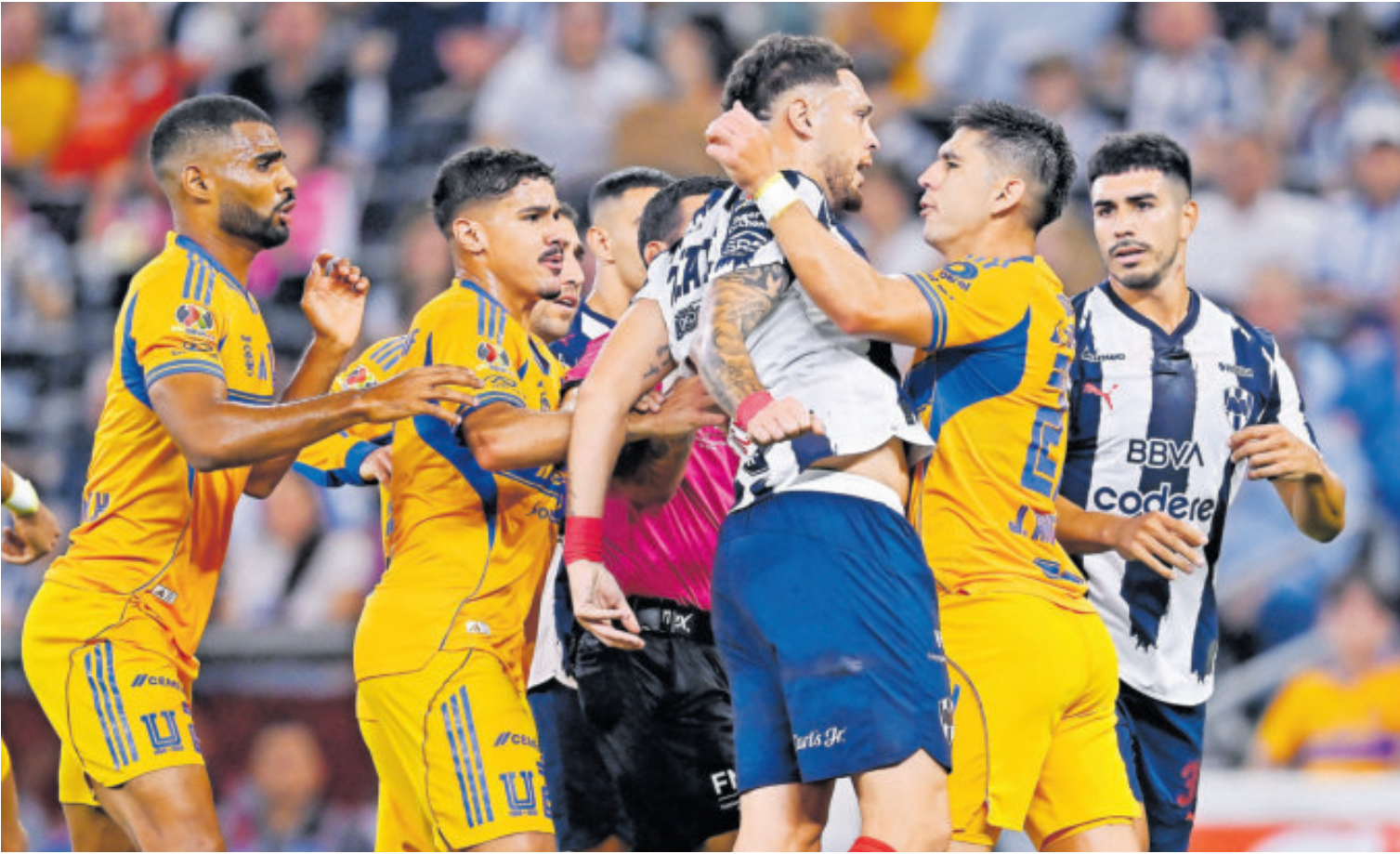
Los ánimos se prendieron entre regios desde los primeros minutos en disputa en el BBVA.