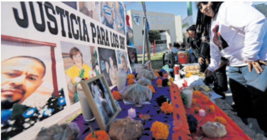
Altar de personas desaparecidas y víctimas del manejo irregular del crematorio.

FAMILIARES anunciaron que mantendrán movilizaciones y solicitarán una reunión con autoridades federales ante la falta de resultados.