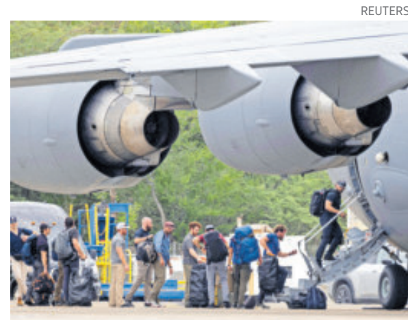
Decenas de militares de EU llegaron a Puerto Rico en la última semana.

Rusia criticó el uso excesivo de fuerza de Estados Unidos en el Caribe y respaldó a Venezuela, calificando las maniobras de ilegales.