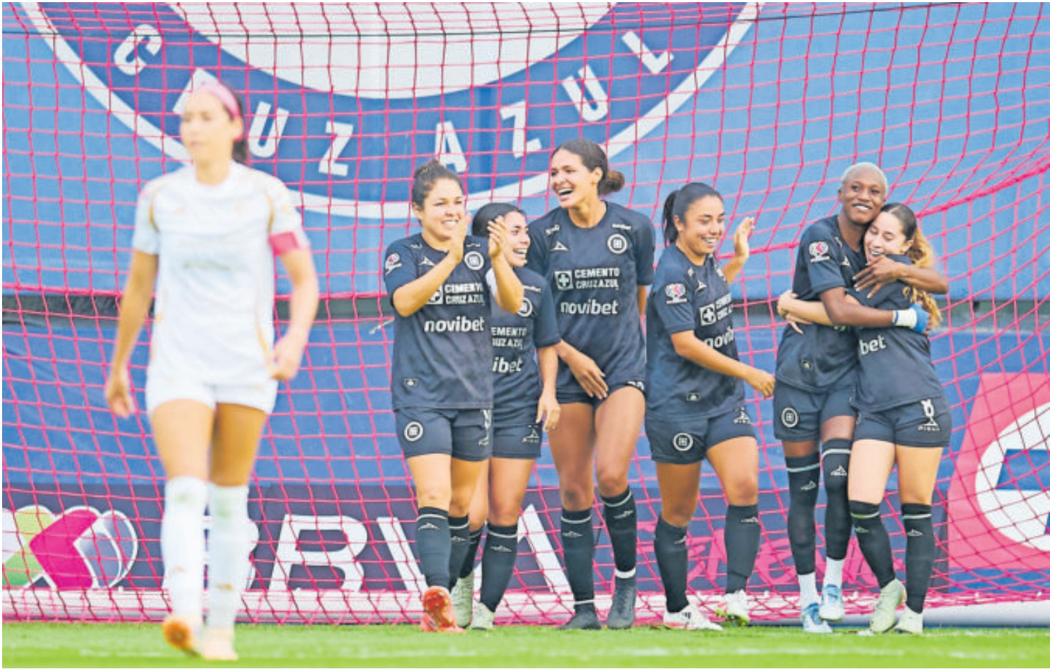
Las Cementeras lograron su clasificación a la siguiente fase del Torneo Apertura, luego de avanzar como séptimas de la general.