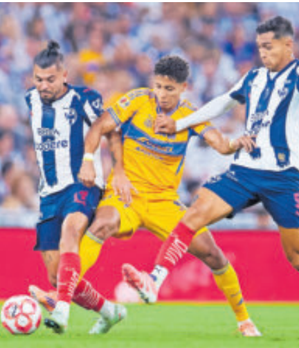
Como todo clásico, ambos equipos no se dieron espacios entre líneas.