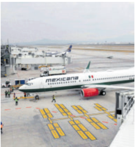
Aviones de carga y pasajeros, en el AIFA.

Poner Fin a la Impunidad de los Crímenes contra Periodistas que se conmemora el 2 de noviembre, la ONG urgió a todos los Estados miembros de la ONU a apoyar el establecimiento de una comisión independiente internacional que investigue las violaciones graves del derecho internacional humanitario, penal o de derechos humanos cometidas contra los periodistas. Esta comisión independiente emitiría recomendaciones para fortalecer la legislación de los países, los mecanismos de rendición de cuentas y la reparación de las víctimas, “facilitando así la verdad y previniendo la reincidencia”. “Cuando un periodista es asesinado y el crimen queda impune, esta tragedia también transmite el mensaje de que matar a periodistas es aceptable (...), envía una señal escalofriante de que los poderosos pueden silenciar voces”, denunció la ONG. El resto de asesinatos de periodistas en 2025 se ha producido en India (seis), Pakistán (cinco), Bangladesh, Ecuador e Irán (cuatro); Filipinas y Siria (tres); Afganistán, Colombia, Honduras, Irak, Líbano, Nigeria, Perú, República Democrática del Congo y Estados Unidos (dos), y Brasil, Guatemala, Haití, Nepal, Arabia Saudita, Somalia, Turquía y Zimbabue (una).