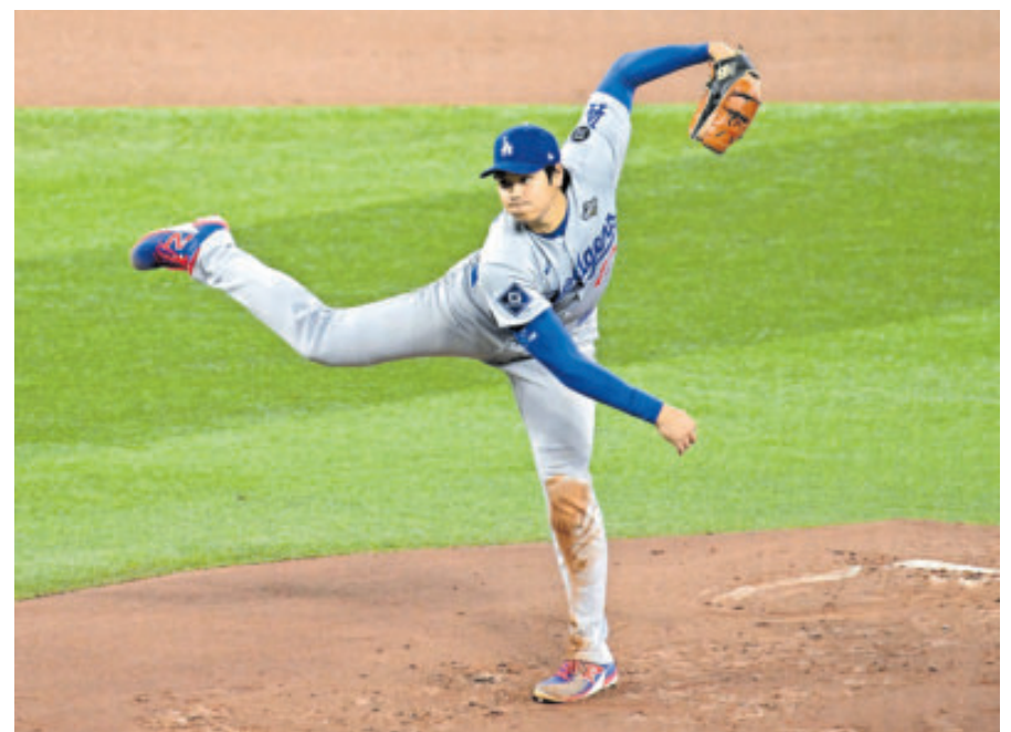
Shohei Ohtani, jugador de doble función de Dodgers, durante la primera entrada.

El diestro no había lanzado con menos de cuatro días de descanso desde su llegada a MLB en 2024, pero su resistencia fue