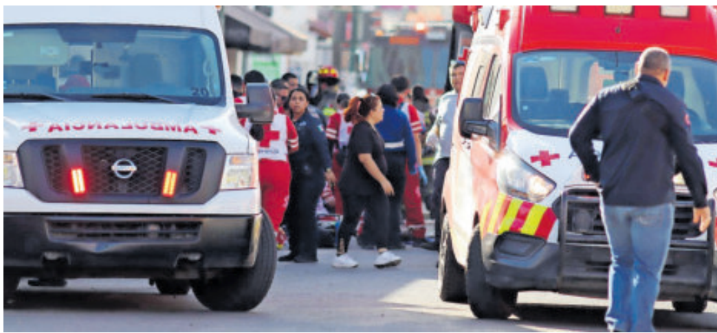
Varias ambulancias ayudaron en el rescate de cuerpos y heridos.