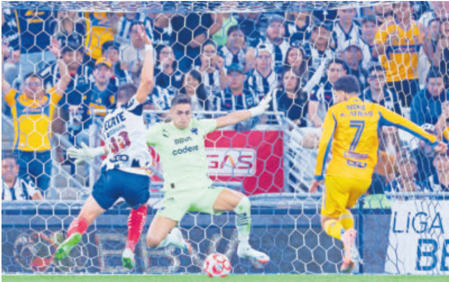
Hubo opciones en ambas porterías, pero poca contundencia de los delanteros.