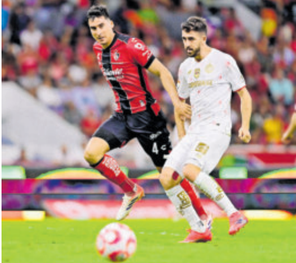
El campeón corre riesgo de bajar en la tabla general.