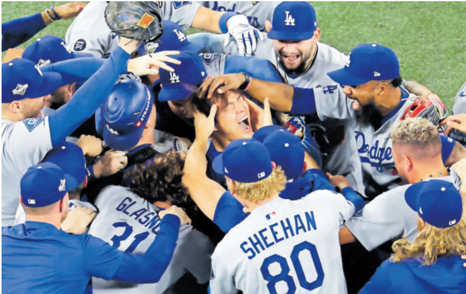
Los Dodgers, campeones MLB por segundo año consecutivo, tras llevarse el título en el séptimo partido, en la 11ª entrada.

Después de un asombroso giro de los acontecimientos en el Rogers Centre, que le dio el triunfo a Dodgers, el pitcher Yoshinobu Yamamoto fue nombrado ganador del Premio JMV de la Serie Mundial. El japonés se consolida como un lanzador para grandes momentos.