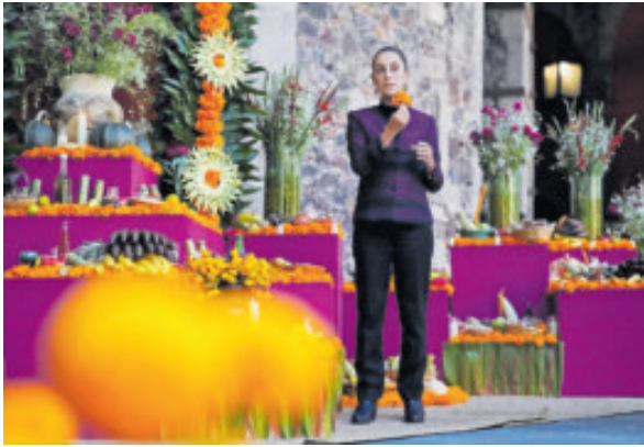
Claudia Sheinbaum, posando junto al altar.

La Presidenta encabezó la conmemoración del Día de Muertos con un homenaje a ‘las ancestras de México’, en Palacio Nacional.