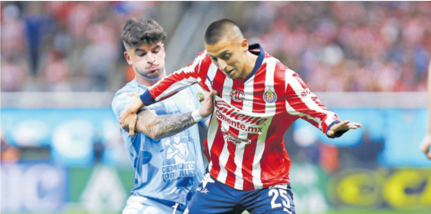
Tanto Tuzos como Chivas, prácticamente se juegan el sexto puesto que les daría el pase directo a la Liguilla.