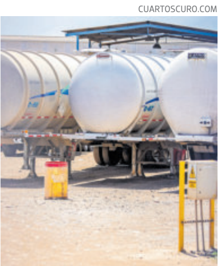
En el operativo fueron detenidas ocho personas.

Esta acción se llevó a cabo en el municipio de Perote, después de tener conocimiento de que una empresa de manejo de