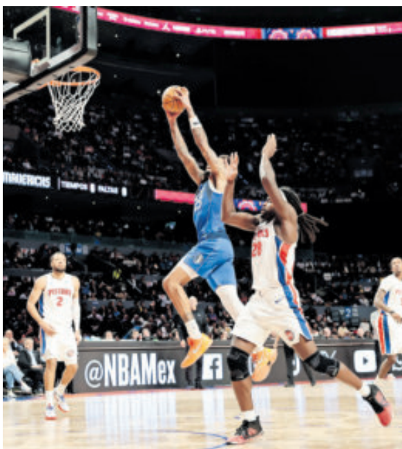
La afición mexicana registró una gran entrada.