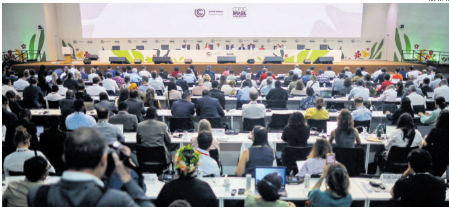
Los negociadores discutían de última hora en plenaria de la COP30 en Belém.

LA CUMBRE TERMINA, PERO LAS NEGOCIACIONES SE EXTIENDEN