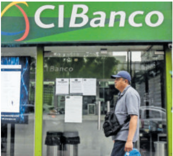
Para México, el CIBanco no está en la lista negra.

to se difundió el señalamiento estadounidense. La reacción inmediata de clientes y operadores llevó a una disminución repentina de fondos que, según el diagnóstico gubernamental, podía comprometer la estabilidad del sistema financiero si no se activaba una medida de control. De acuerdo con la Presidenta, Hacienda y la CNBV aplicaron la intervención para frenar el retiro de capital, estabilizar la operación y evitar un contagio que afectara a otras instituciones del sector. La administración de Claudia Shein-