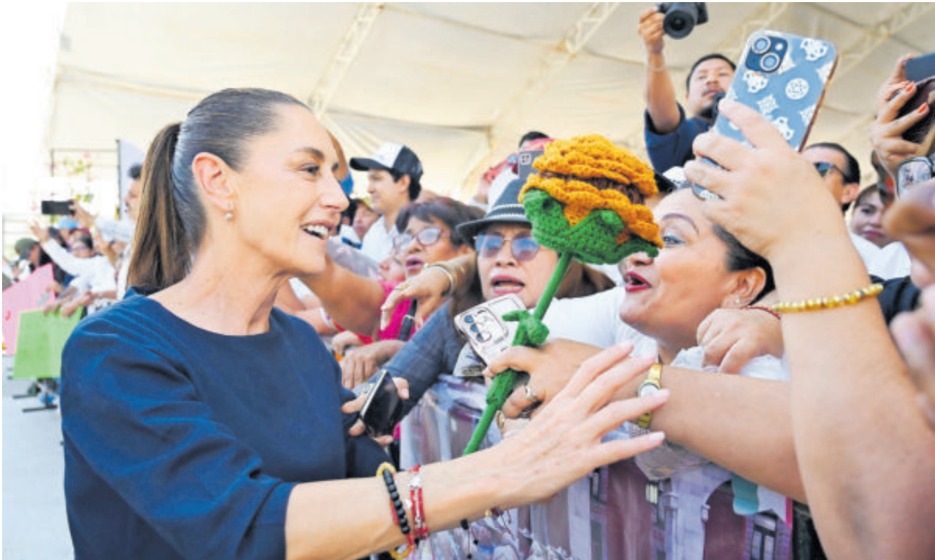
La presidenta Claudia Sheinbaum estuvo de gira por Chiapas, ayer viernes.