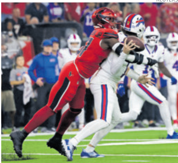
Will Anderson Jr., ¿el Jugador Defensivo del Año?

La pesadilla de Allen se agudizó con 3:13 por jugar en el primer cuarto, en tercera y seis, Will Anderson Jr. lo atrapó por detrás y lo estrelló contra el césped. El quarterback quedó boca abajo mientras pateaba el aire, luego se giró sobre la espalda y se tomó la mano con gestos evidentes de dolor. Se levantó solo, caminó a la banda, se sentó en la banca, se puso el casco y volvió al juego. Después explicó que había caído sobre el hombro izquierdo y que el brazo se le había dormido momentáneamente. "Al final no fue nada", dijo, aunque las ocho capturas y las dos intercepciones hablaban de una noche mucho más dura de lo que él admitía.