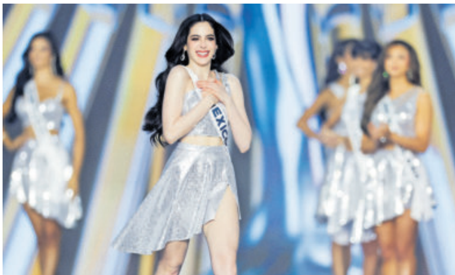
La polémica marcó la edición del evento de belleza más reconocido del mundo.

Bosch, de 25 años, se dijo muy emocionada por su triunfo y mostró interés en trabajar durante su año de reinado para impulsar la igualdad de género en su país e inspirar a jóvenes de otras partes del mundo.