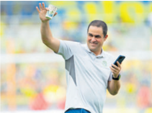
André Jardine. Busca volver a ponerse la corona.

Pero de alguna forma, los fracasos del Flaco en la Selección Chapina y del Piojo con los ticos no abonó nada nuevo a esta crisis de estrategias nacionales, que nada más no pueden hacerse de un lugar en el torneo local. Lo cierto es que los técnicos mexicanos son una especie en extinción.