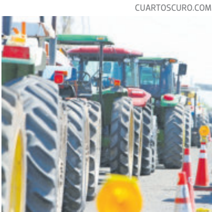
Todavía no hay detalles sobre todas las carreteras que serán tomadas.