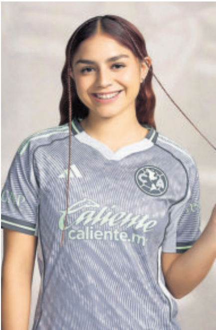
Así luce el nuevo uniforme de las Águilas, que se alistan para la Liguilla.

Además, la playera tiene algunas tonalidades en verde, que representan el césped del estadio.