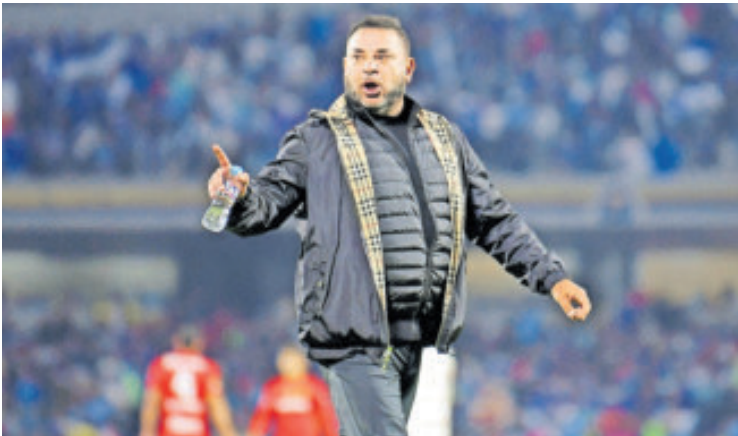
Antonio Mohamed. El actual monarca va por el bicampeonato.