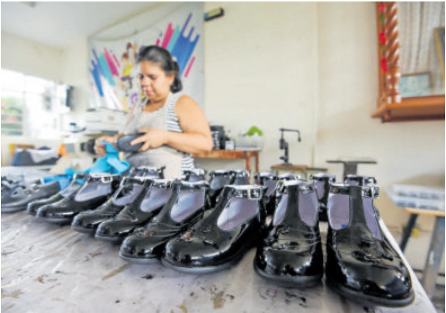
La industria del calzado sigue sin encontrar el rumbo.

El Instituto Nacional de Estadística y Geografía (Inegi) ajustó este viernes al 0.2% trimestral la caída definitiva del producto interior bruto (PIB) en el tercer trimestre de 2025, tras estimar un descenso del 0.3% en octubre pasado. El retroceso en el tercer trimestre del año obedeció a la caída trimestral de la industria (-2.7%), en contraste con la subida en el sector agropecuario (2.9%) y de los servicios (1%), detalló el Inegi en su reporte, con base en cifras desestacionalizadas. Asimismo, el instituto rebajó al 0.1% el retroceso interanual en el periodo de julio a septiembre, tras haber divulgado una caída preliminar del 0.2%. El retroceso interanual en el trimestre fue resultado de los avances en las actividades primarias (3.7%) y terciarias (1.1%), aunque con un descenso en las secundarias (-2.7%). Con estos datos, el PIB de México acumula un crecimiento del 0.1% en lo que va del año, por debajo del 0.2% proyectado el mes pasado. En los primeros tres trimestres de 2025, hubo subidas interanuales en el sector agropecuario (3.1%) y en los servicios (1%), pero la industria cayó -1.8%. Con estas estadísticas, la economía de México rompe su racha de tres trimestres consecutivos con crecimiento a tasa anual.