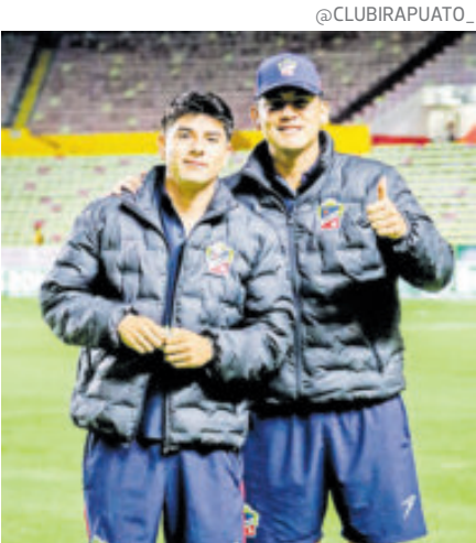
La Trinca Fresera está en su casa y con la ventaja en el marcador parcial.

Porque Irapuato tiene aura, tiene empuje, tiene presión y tiene un hervidero de emociones en casa, con una afición que está bien metida con su equipo y lo quiere ver campeón de algo importante, luego de más de una década sumido en las sombras del futbol mexicano y ya casi como un