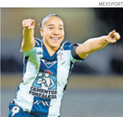
La delantera del Pachuca.