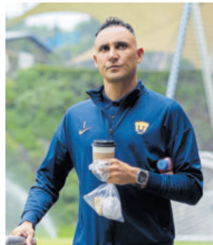
Pumas rompió filas tras quedar fuera.