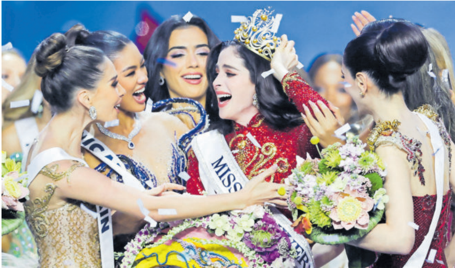
La mexicana fue arropada por sus compañeras luego de obtener el título de Mis Universo.