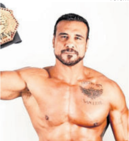
El Patrón tiene un serio compromiso para el 10 de enero.

Pero Alberto El Patrón no llegará solo. A su lado estarán dos pilares de la lucha mexicana como el legendario Dr. Wagner Jr y el heredero de una dinastía, Hijo de Dos Caras, estarán ahí. Juntos formarán un trío que encarna décadas de historia