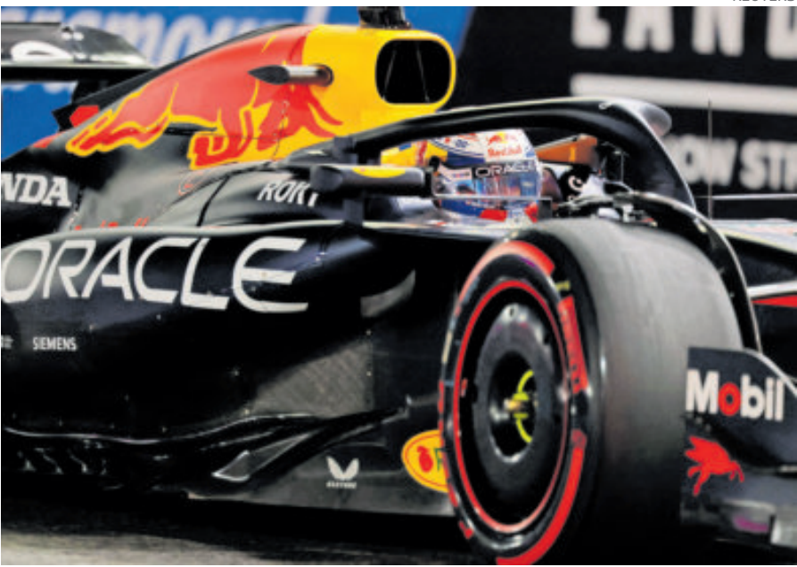
Max Verstappen va con todo con tal de refrendar su título.

capítulo de una disputa que parece inclinarse de manera inminente hacia el británico. Con dos victorias seguidas, Norris llega con la tranquilidad de que incluso terminar segundo en las últimas citas le bastaría para coronarse.