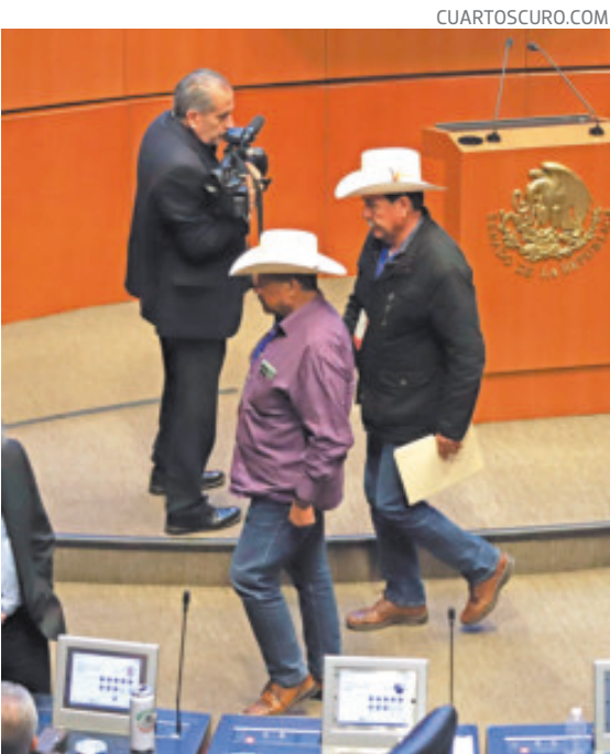
Campesinos entraron al Senado buscando hablar con Ariadna Montiel, pero los batearon.

diferenciados, por lo que pidió actualizar los mecanismos de medición y revisar si las transferencias monetarias están reduciendo carencias, fortaleciendo la movilidad social y atendiendo efectivamente a los grupos con mayor vulnerabilidad. También solicitó una estrategia integral para atender la pobreza infantil y acciones concretas para avanzar hacia un sistema nacional de cuidados. Por parte del PRI, la senadora Anabel Ávalos Zempoala cuestionó directamente la cifra de 13.4 millones de personas que habrían salido de la pobreza y pidió a la secretaria explicar de manera técnica cómo se obtuvieron esos resultados tras la desaparición del Coneval. También expuso la falta de medicamentos en centros de salud, las inconformidades de pequeños productores que aseguran no recibir precios de garantía y la insuficiencia de una política basada únicamente en transferencias monetarias.