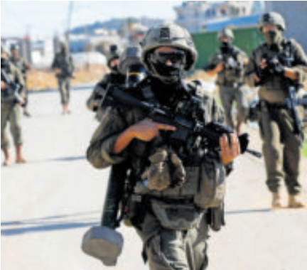
Fuerzas israelíes realizaron arrestos.