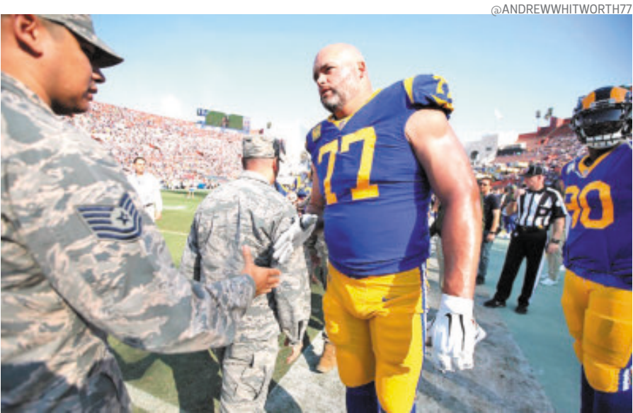
Whitworth ahora es analista de la liga junto a Sherman para Prime Video.