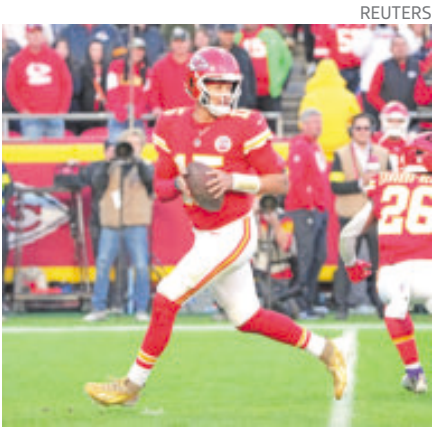
Será su primer Thanksgiving Day.

Mahomes liderará este jueves, en juego de la semana 13 de la temporada de NFL, la ofensiva de los Chiefs, que tenían 20 años sin disputar un juego en el Día de Acción de Gracias, contra los Dallas Cowboys,