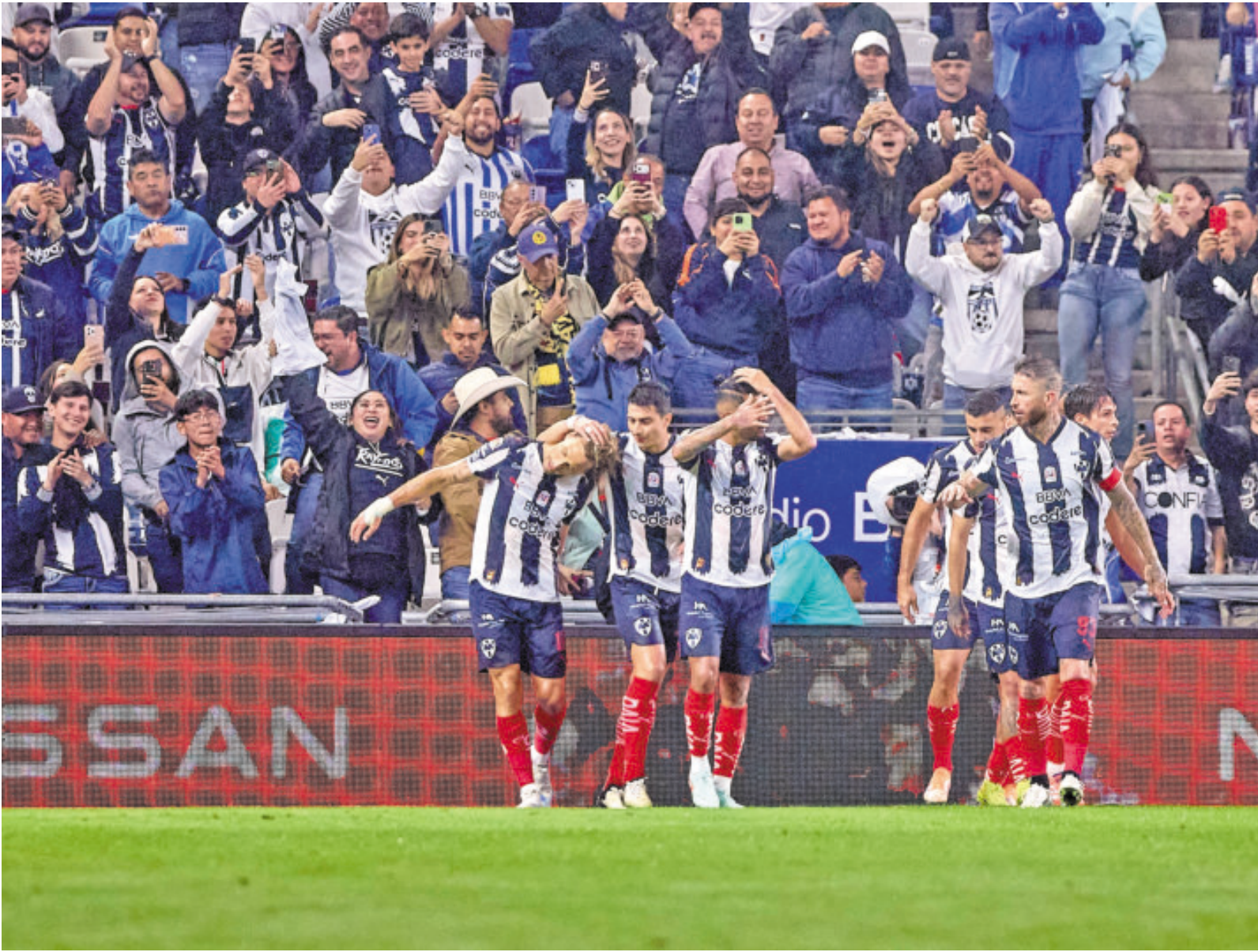
La Pandilla tiene una importante ventaja que tratará de concretar en el juego de vuelta en la capital del país.