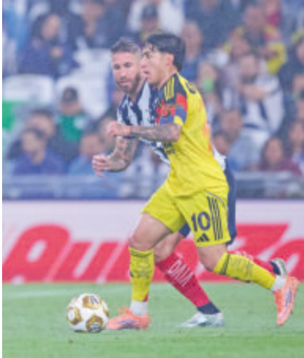
Alejandro Zendejas estuvo bien contenido por Sergio Ramos.