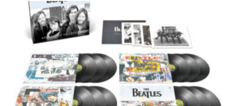
La Anthology Collection se colocó en el mercado con una estructura de 12 LP y ocho CD.

El nuevo volumen Anthology incluye 13 demos y grabaciones de sesión inéditas, además de rarezas de archivo que amplían el inventario del cuarteto.