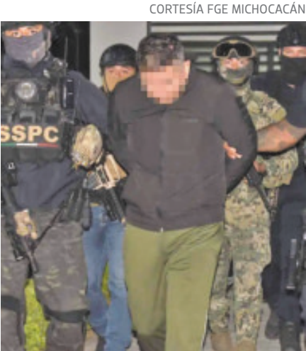
Dice ser "licenciado en comunicaciones".

cidad (CFE), de 2010 a 2017. Informó que es comunicador al contar con la licenciatura en Ciencias de la Comunicación y de Periodismo; además de que ayudó a diputadas y diputados de la 64 Legislatura de la Cámara de Diputados de 2018 a 2021, dedicándose por un tiempo a la vida política. Indicó que formó parte de la anterior administración del Ayuntamiento de Santa Ana Maya, ubicado en la región Morelia, de 2020 a 2024, en donde más tarde, buscó un cargo político en las Elecciones del 2024, sin embargo, no ganó; aunque sin especificar en qué puesto buscaba contender. Agregó que luego de su detención el pasado 18 de noviembre en la colonia Centro de la capital michoacana, sufrió