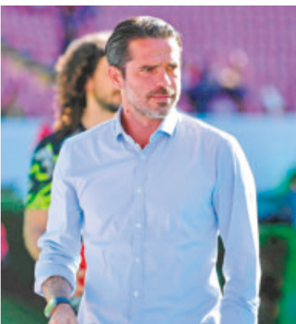
Fernando Gago. Otra vez se va por la puerta de atrás del fútbol mexicano.