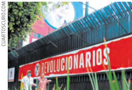
El partido deberá pagar una sanción de 750 mil pesos.

En ese tenor, el senador Jorge Carlos Ramírez Marín, del Verde, defendió el método de designación y recordó que “es el mismo que se ha aplicado históricamente”.