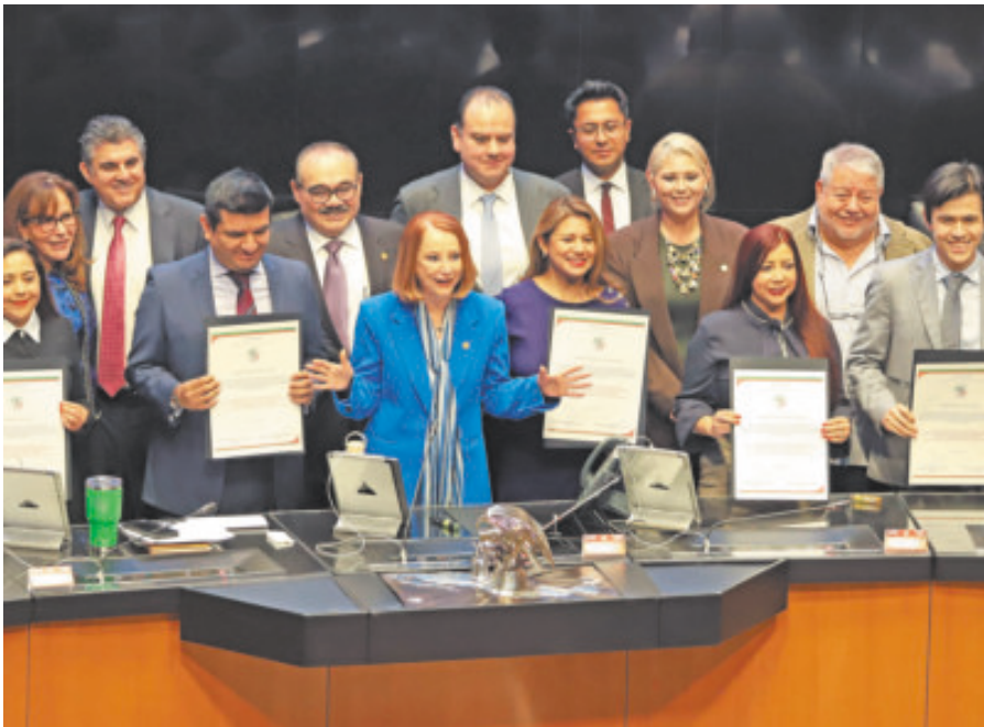
Los nuevos magistrados, ayer, en el pleno de la Cámara alta.

La sesión estuvo acompañada por acusaciones de la oposición, principalmente