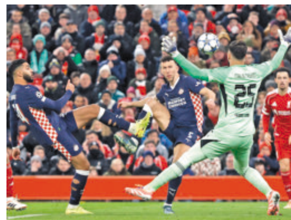
Liverpool no ve la luz y PSV lo goleó a domicilio.