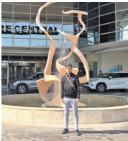
El rejoneador español estuvo 12 días internado.