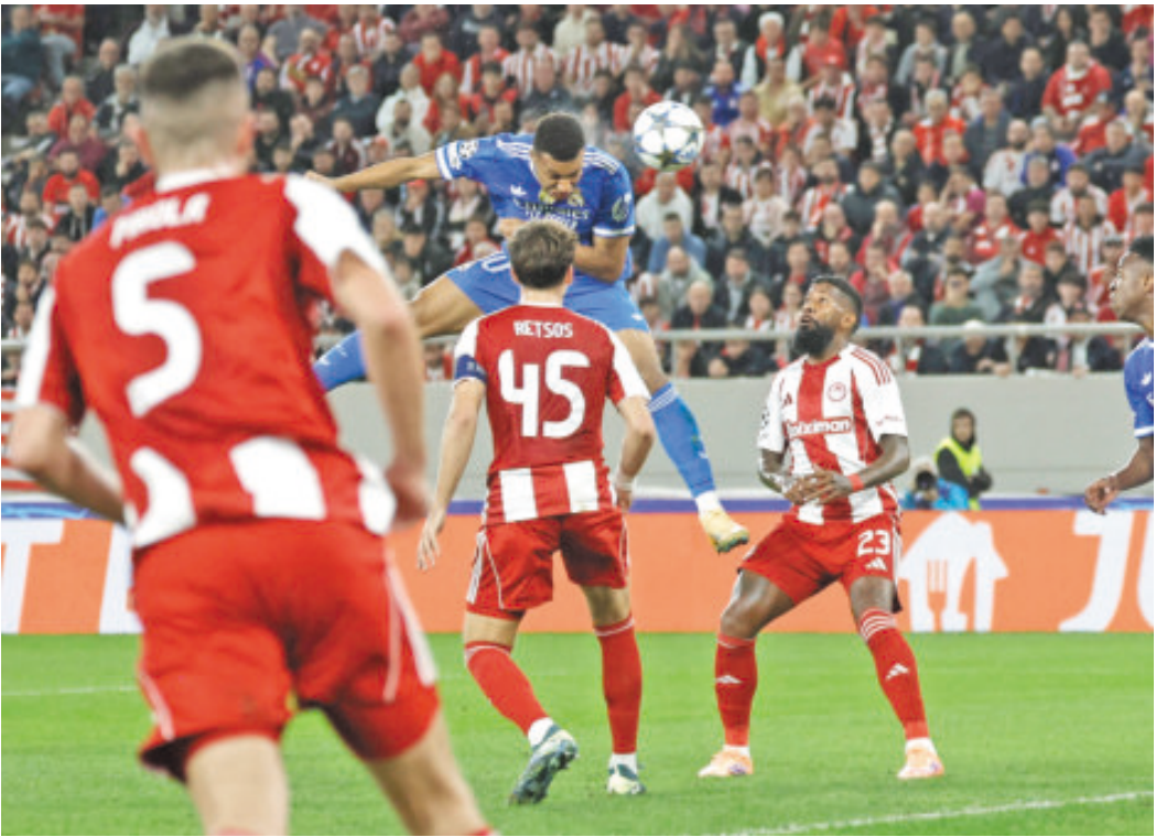
Kylian Mbappé, cuarto jugador del Madrid que marca póker, con Di Stéfano, Puskás y CR7.

Al Real Madrid le salvaría su pegada. La de Mbappé. En siete minutos marcó un triplete. Favorecido por la valentía asociada a osadía de Mendilibar. Su línea defensiva adelantada era un disparo al pie ante la inspiración de Vinicius y la velocidad de Kylian. Un pase que habría firmado Luka Modric, Vinicius presentó a Mbappé la oportunidad de levantar a su equipo. No