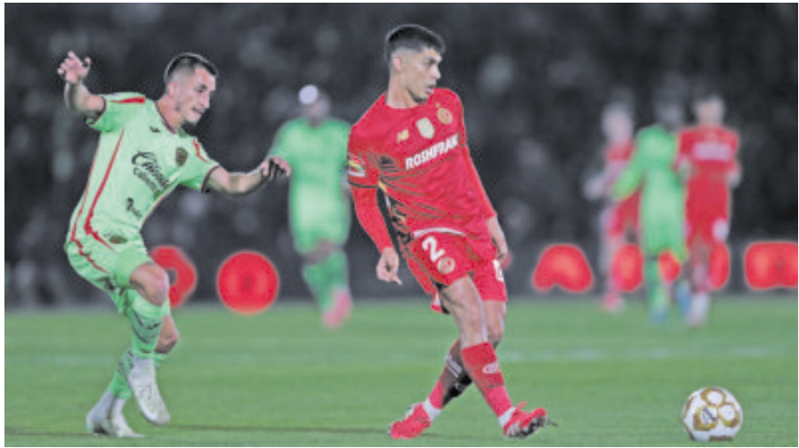
Toluca se vio abajo pronto en el marcador, pero no se volvió loco y le dio la vuelta sin mucho esfuerzo, mostrando por qué fue el líder de la fase regular.

LA VENTAJA de Toluca es pesada para Bravos, porque debe ganar por dos goles y los rojos sólo perdieron uno en casa y por un gol, con Tigres.