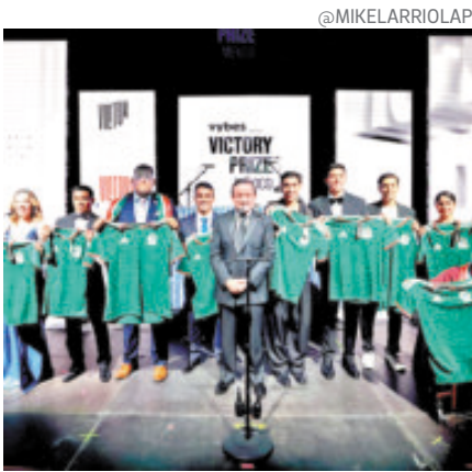
El 12 ideal de deportistas que se suman a la campaña Somos México.