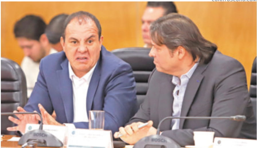
El diputado de Morena Cuauhtémoc Blanco, en sesión.