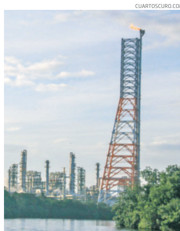
En la foto, la refinera de Dos Bocas, en Tabasco.

Además, desde hace varios años enfrenta una creciente deuda con cientos de proveedores -y que alcanzó 28 mil millo-