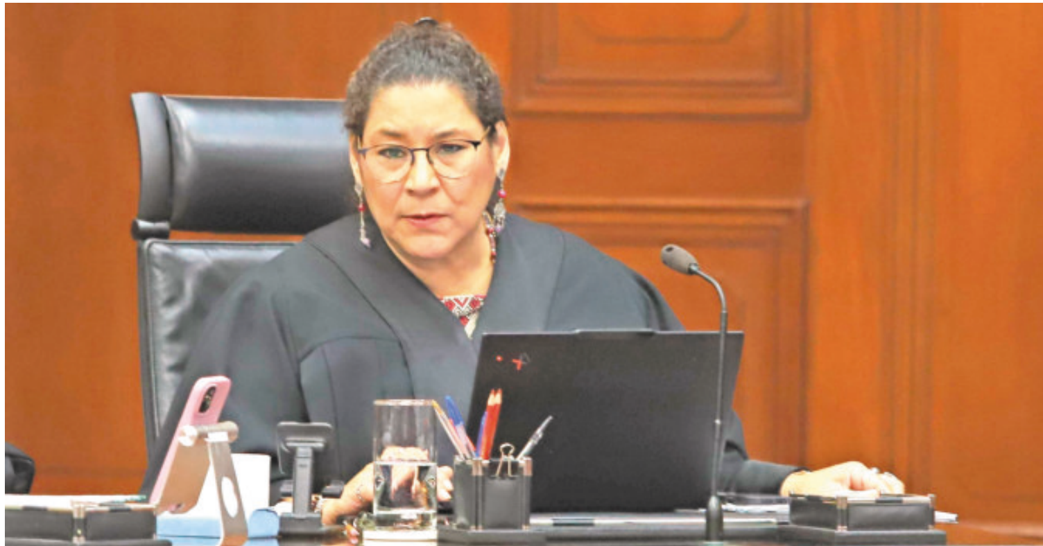
La ministra Lenia Batres fue quien promovió la reapertura del caso desechado.