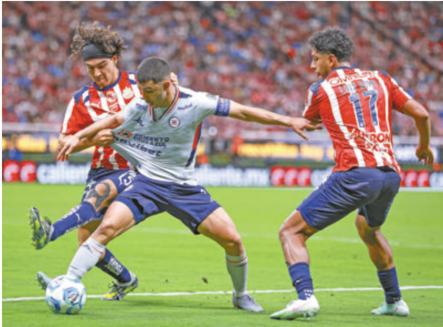
El equipo de La Noria salta como favorito en esta serie de cuartos de final.