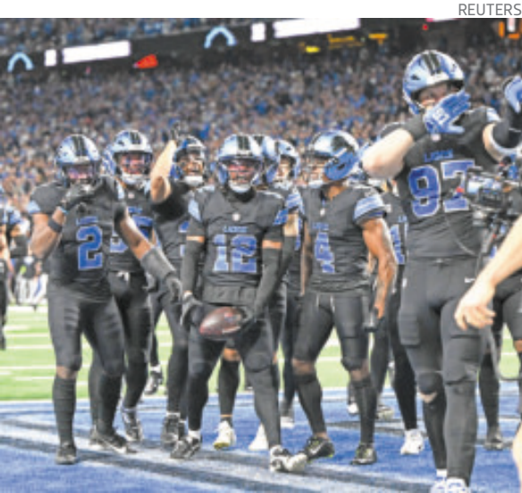
Los Leones serán locales en este partido.

Detroit jugará su partido número 86 en Día de Acción de Gracias —donde sostiene un récord de 38-45-2, que se remonta a 1934— mientras que Green Bay jugará el Thanksgiving Day por tercera temporada consecutiva y por ocasión número 39 en total con marca de 16-20-2. Ambas franquicias jugaron todos los años ininterrumpidamente desde 1951 hasta 1963, por lo que verlos de nuevo en escena, será un retorno a las raíces de este juego. Es así que este Día de Acción de Gracias podría ser un momento de redención para Lions o la confirmación del dominio de Packers.