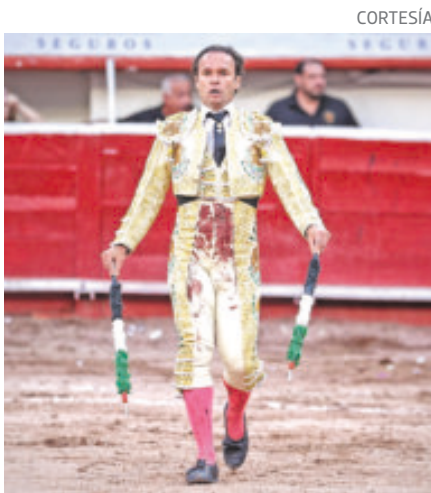
Ratifican los corridas de la feria de Moroleón.