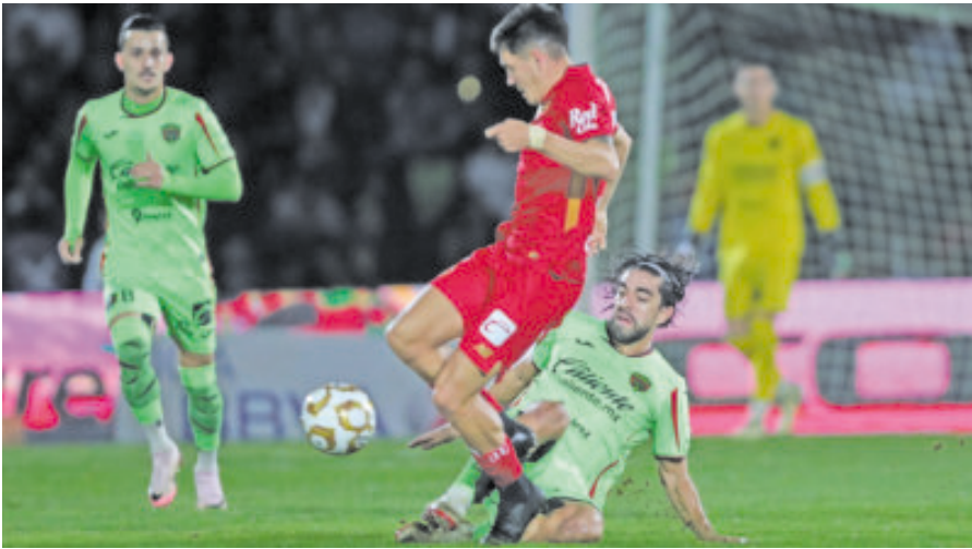
Los Bravos le pusieron ganas, pero no les alcanzó para sacar un buen resultado y ahora tienen una dura misión cuando paguen la visita en el infierno rojo.