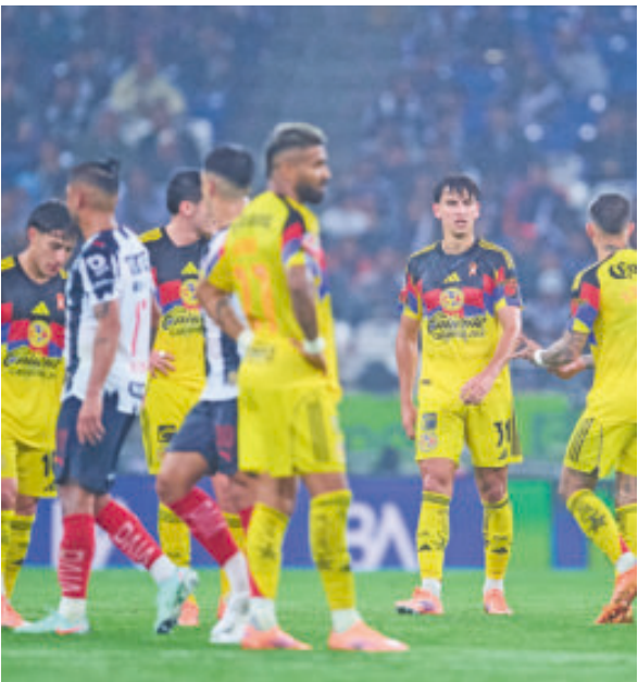
América está contra las cuerdas de cara a la vuelta.