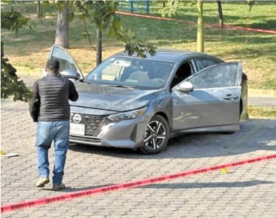
La unidad fue ubicada en la zona de Paseo de los Virreyes, en Zapopan.

Una fuerte movilización de autoridades de los tres niveles de gobierno se registró entre la noche del martes y madrugada de este miércoles en la zona de Paseo de los Virreyes, en Zapopan, tras el hallazgo de un vehículo oficial con placas federales, impactos de arma de fuego y manchas hemáticas. Dos elementos del área de inteligencia de la Secretaría de Seguridad y Protección Ciudadana (SSPC) fueron privados de la libertad en este punto. El Ministerio Público Federal encabeza las investigaciones y coordina un operativo de búsqueda para localizar a los agentes, cuya ubicación aún se desconoce. La Secretaría de Seguridad y Protección Ciudadana informó que los dos elementos realizaban labores de inteligencia e investigación de campo para la prevención del delito y la desarticulación de células criminales en el estado de Jalisco, se encuentran en calidad de no localizados. Los hechos ocurrieron cuando los agentes se dirigían a Guadalajara a bordo