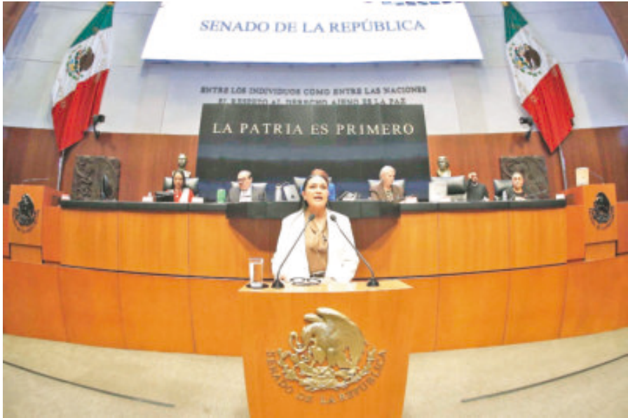
Ariadna Montiel, ayer en el Senado, durante su comparecencia.

hoy aseguran defender”. Aunque la oposición planteó preguntas sobre padrones, evaluación y transparencia, Montiel respondió solo algunos puntos y centró su intervención en defender la continuidad de los programas como conquistas del pueblo. Sostuvo que los señalamientos “reproducen la visión de gobiernos que administraron la pobreza y descalificaron a quienes menos tienen”. La secretaria del Bienestar aprovechó para hacer un contraste de esos antecedentes con el modelo actual, en el que los apoyos sociales son derechos constitucionales, por lo que pidió a las bancadas opositoras definir una postura coherente frente al bienestar, al señalar que año tras año votan en contra del presupuesto destinado a los programas, aun cuando en