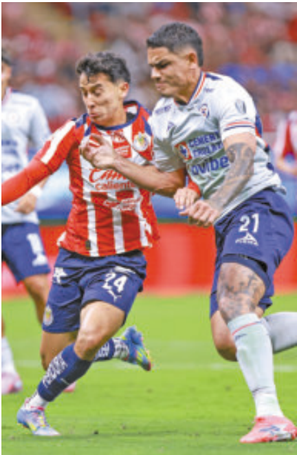
Chivas tuvo mejor cierre de torneo.