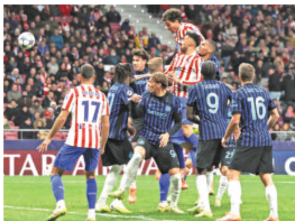
Atlético de Madrid derrotó in extremis al Inter.

El guante de Mislav Orsic, un seguro de vida para el Pafos con sus lanzamientos a balón parado, amargó al Mónaco, que no pasó del empate (2-2) en su visita al estadio del conjunto chipriota. Monacó se adelantó dos veces pero... Los goles fueron de Minamino y Balogun, Balogunaron David Luiz y Salisu (autogol).