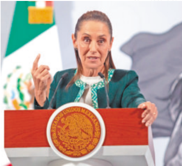
La presidenta Claudia Sheinbaum, ayer.

Recordó que el objetivo de la administración es consolidar un diferencial de precio que reconozca la especificidad del cultivo mexicano y priorice a productores.