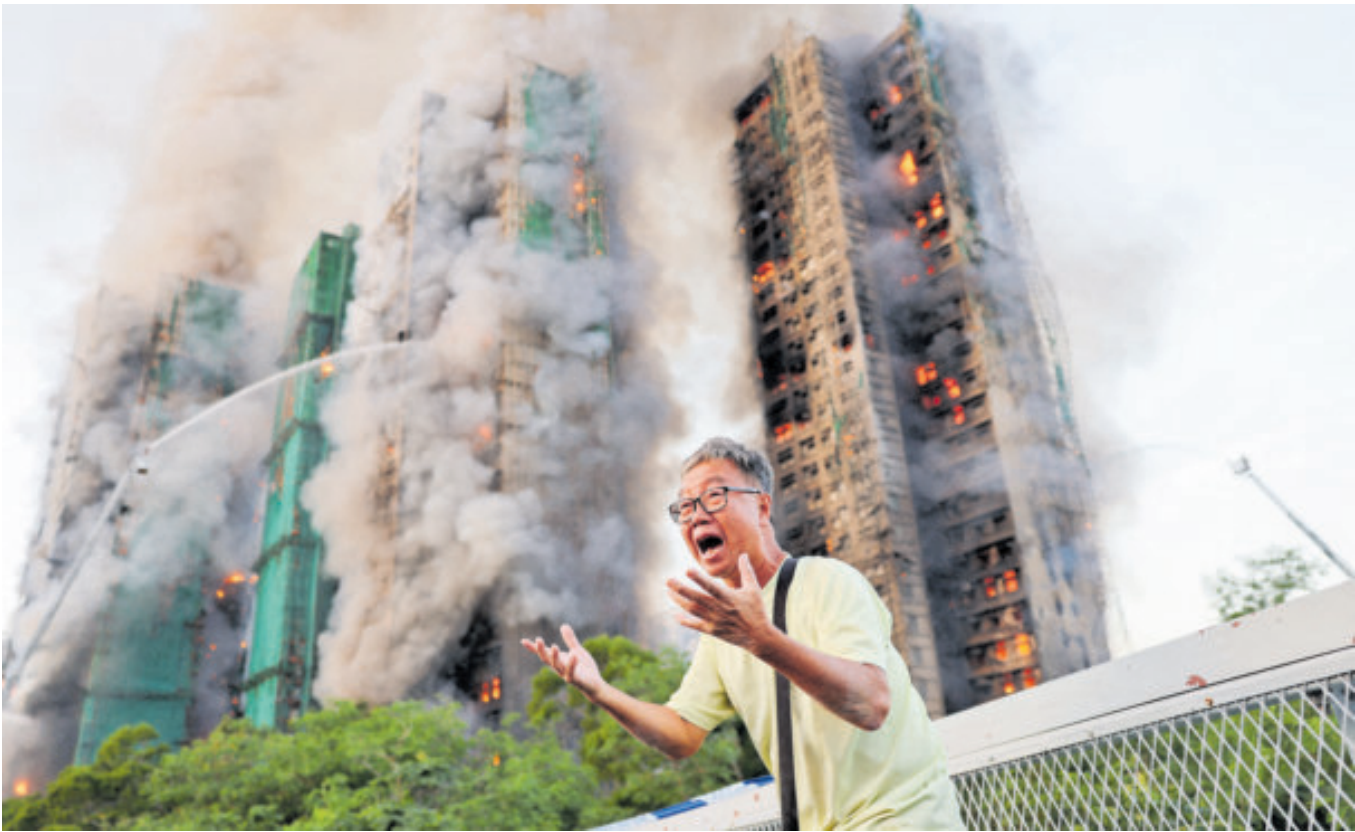
El siniestro fue calificado como de categoría cinco, el nivel más alto de alerta, que determina la movilización de rescatistas.