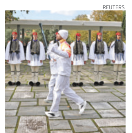
Fue una ceremonia muy discreta en Atenas, Grecia.

La antorcha pasará por 60 ciudades y 300 pueblos italianos, con un total de 10 mil 1 portadores, antes de llegar a Cortina d’Ampezzo el 26 de enero, exactamente 70 años después de la ceremonia inaugural de los Juegos Olímpicos de Invierno de 1956.