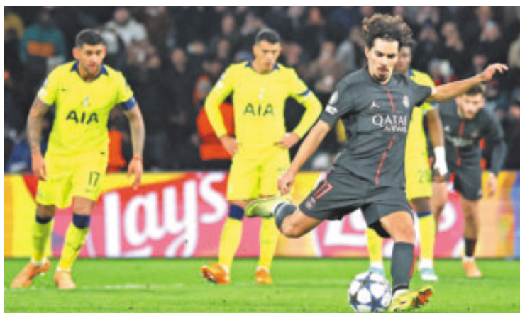
El campeón PSG recuperó la memoria y se impuso a los Spurs.