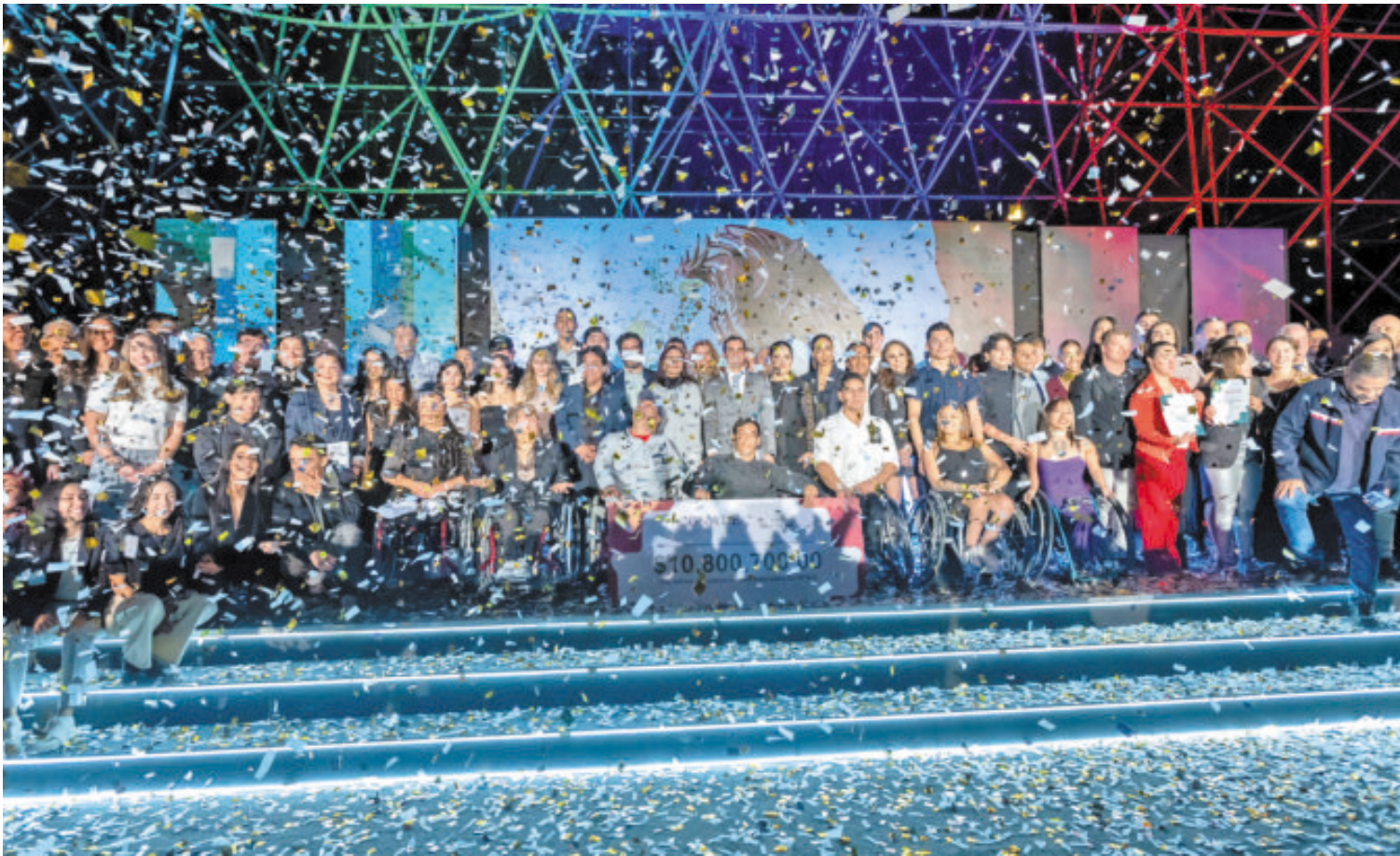
Los deportistas se reunieron en el domo del Centro Nacional de Desarrollo de Talentos Deportivos y Alto Rendimiento.