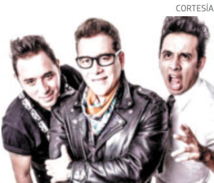
La banda es pionera del rockabilly español desde 1979.

Su colección La Vacanza , elogiado para Versace, que ella creó junto a Donatella Versace, se lanzó en 2023 y fue, según la revista Vogue , "la colaboración más cantante del verano".