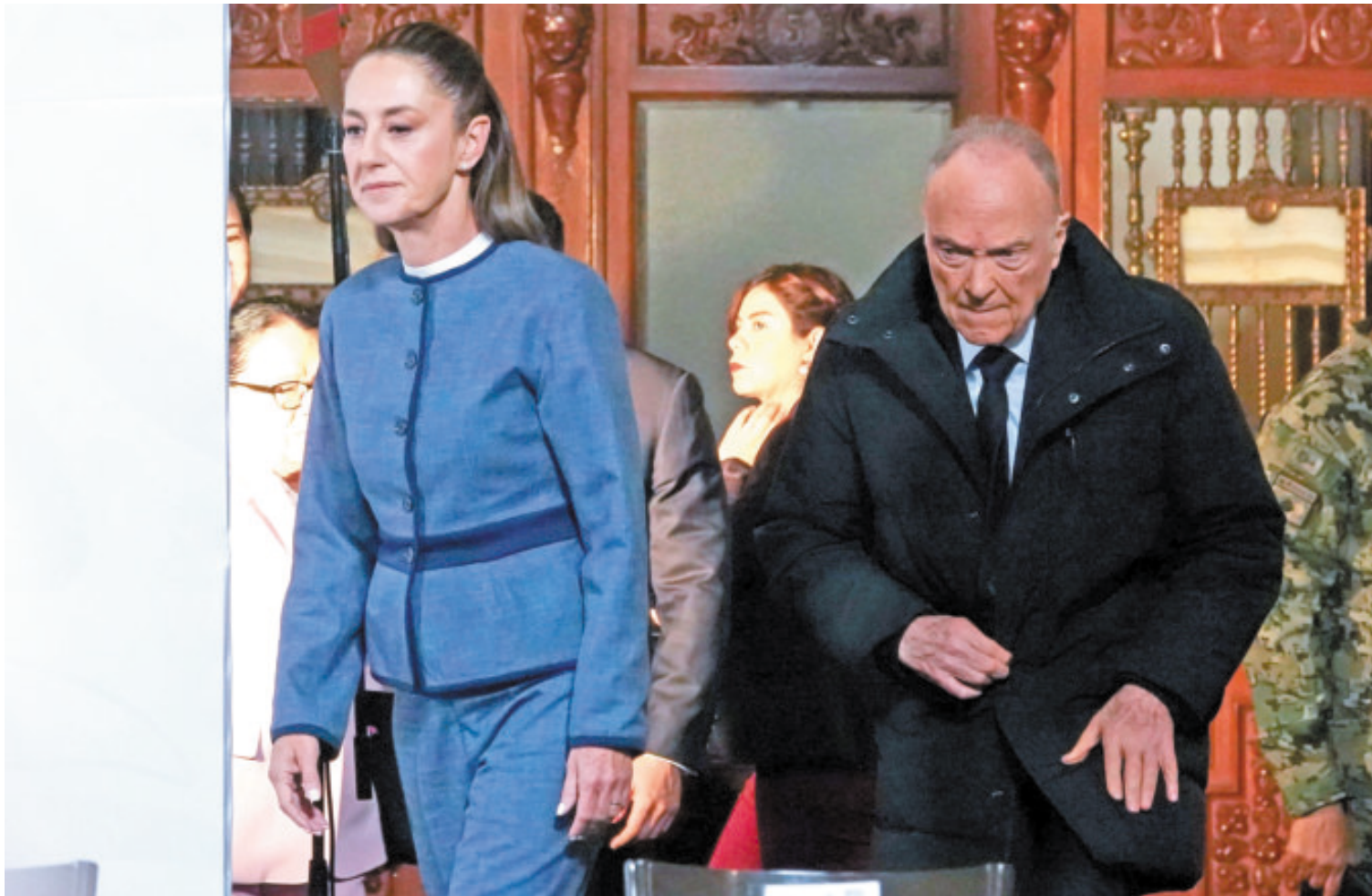
La presidenta Claudia Sheinbaum y el hoy exfiscal Alejandro Gertz.