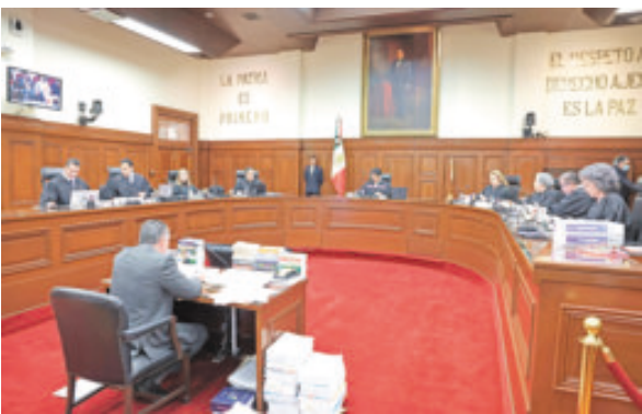
Los ministros de la Corte, ayer, en sesión.

Ante la polémica desatada por la posibilidad de reabrir litigios que ya habían sido cerrados, lo que generó críticas hasta de la presidenta Claudia Sheinbaum, la SCJN señaló que el sistema normativo