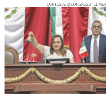
Momento del inicio de la sesión en el Congreso local.