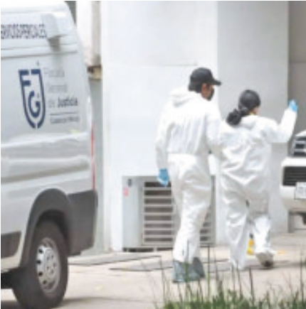
Personal de la fiscalía se presentó para iniciar las investigaciones.

En los escalones del edificio sólo era visible un pequeño rastro de sangre, mientras que en la acera quedaron un casco amarillo, otro blanco y un folder beige.