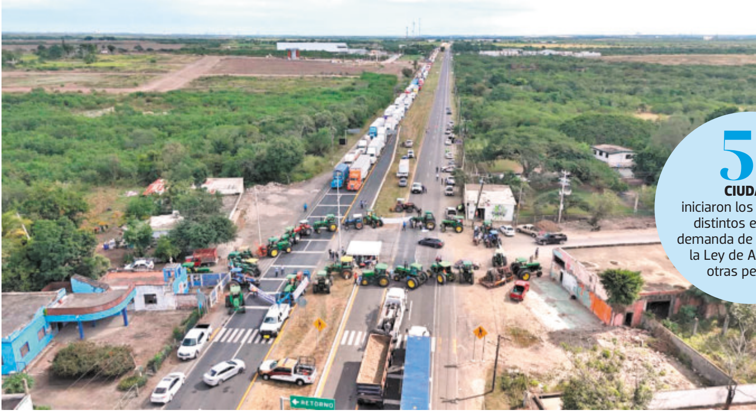
Los bloqueos han provocado una larga fila de vehículos en varios estados.