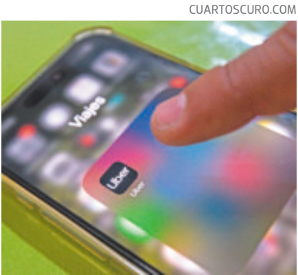
Debe pagar 2% por usar infraestructura.

Algunos ministros de la Corte han propuesto modificar las compensaciones por daños patrimoniales derivados de muerte o incapacidad, para sustituir el esquema basado en salarios mínimos por uno distinto.