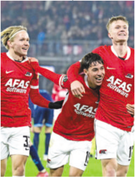
Chávez sumó minutos con el AZ.

Los jugadores mexicanos tuvieron una buena participación en la Copa Conferencia; ganaron y sus cuadros tienen opciones.