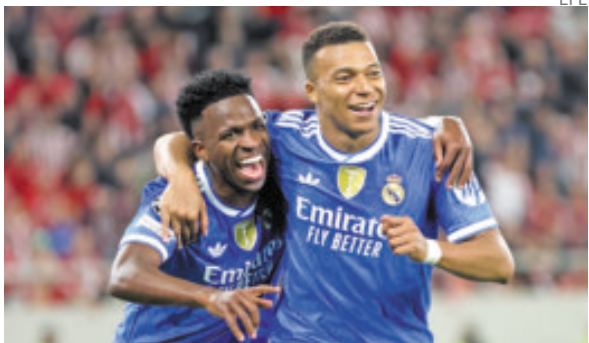
Su póker le valió la designación en Champions.