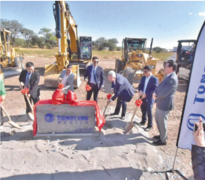
La primera piedra fue colocada por empresarios y autoridades.

“El nacimiento de esta fábrica surge de nuestra profunda comprensión de dos grandes oportunidades