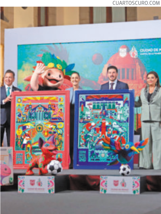
La Presidenta, los gobernadores de NL y Jalisco, y la jefa de Gobierno, ayer, en Palacio.

por la concentración de sedes, proyecciones comunitarias y actividades culturales asociadas al Mundial. Pablo Lemus, gobernador de Jalisco, señaló que su administración definirá días de asueto para los cuatro partidos programados en Guadalajara, aunque matizó que el anuncio formal quedará sujeto a los horarios que se darán a conocer tras el sorteo del 5 de diciembre en Washington. A su vez, el gobernador de Nuevo León, Samuel García, apuntó que su entidad ya definió un esquema preliminar: el primer partido caerá en sábado, el segundo en domingo y el tercero en miércoles, por lo que el gobierno estatal previó declarar día inhábil escolar en el tercer encuentro y acordar con el sector privado opciones de home office o medio turno. Sheinbaum informó que el gobierno de México destinará entre mil 500 y 2 mil millones de pesos por entidad federativa sede, con la finalidad de fortalecer infraestructura de transporte y movilidad.