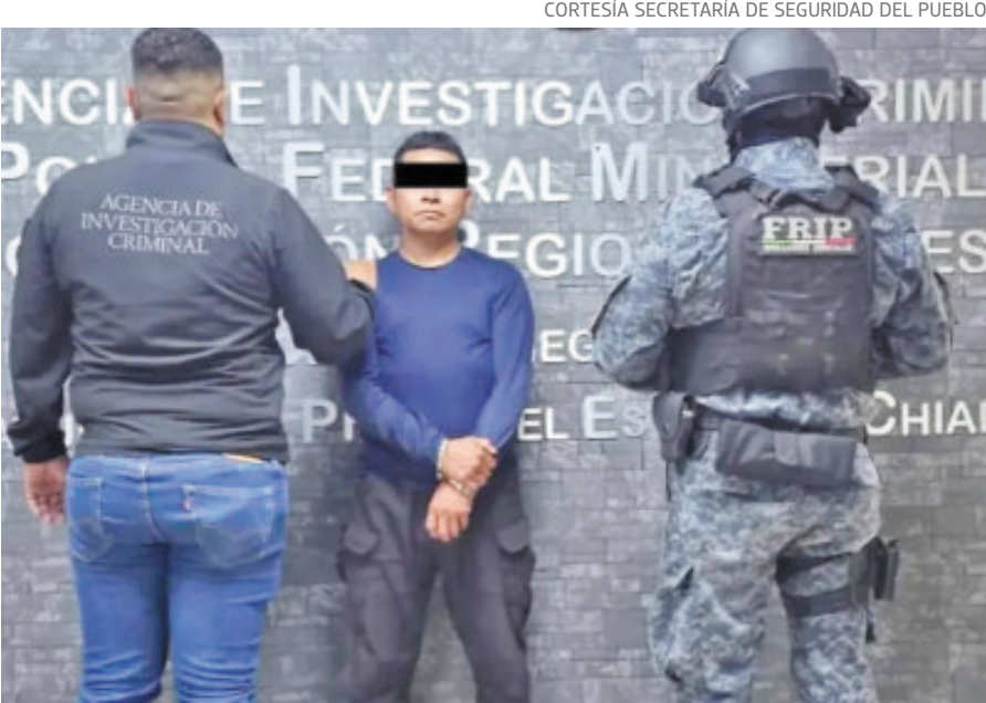
El operativo de su detención se llevó a cabo de manera precisa.

A través de un comunicado, la Secretaría de Seguridad del Pueblo identificó al Coreano como parte del grupo que operaba en el predio conocido como La Galera, en Teuchitlán, Jalisco, donde presuntamente se reclutaba y adiestraba de