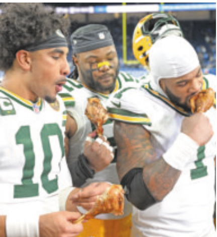
Su premio tras vencer a Detroit fue un delicioso pavo.

El estelar defensivo se convirtió en una pesadilla para Goff y la ofensiva de Detroit, al sembrar el caos en las trincheras con 2.5 capturas, ocho tacleadas, cuatro