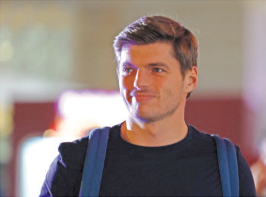
El piloto de Red Bull dijo que Piastri debe tener libertad para competir.

La advertencia llega en un momento crítico. Norris lidera a Piastri por apenas 24 puntos antes del Gran Premio de Qatar,