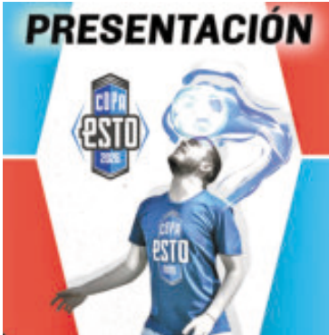
La iniciativa busca impulsar el futbol amateur y el deporte en el país.

La competencia, que será cien por ciento amateur, se hará en cuatro sedes: Ciudad de México, Toluca, Querétaro y Puebla; en cada una de las mismas se podrán inscribir 20 equipos de hasta 18 jugadores. Se jugará una fase de grupos, cuartos de final, semifinal y final en cada sede; cada equipo tendrá al menos tres juegos a disputar. En Puebla se jugará en la Universidad de Puebla; en Toluca en el Centro Médico ISSEMYM del IMSS; en Querétaro serán dos sedes: la Casa de la Juventud y el Estadio Olímpico de Querétaro, mientras en la CDMX en la Codeme. El campeón de cada sede tendrá un premio de 30 mil pesos en efectivo y el subcampeón de 15 mil pesos; los ganadores de las cuatro sedes disputarán un Campeón de Campeones en la Ciudad de México y el que lo gane obtendrá 50 mil pesos, y el subcampeón 25 mil pesos. En Puebla y Toluca, el torneo comienza el 7 de marzo y finaliza el 18 de abril; en Querétaro y CDMX inicia el 11 de abril y finaliza el 16 de mayo. El Campeón de Campeones se realizará el 23 y 24 de mayo con sede por definir. La inscripción por equipo tendrá un costo de 21 mil 600 pesos, incluye uniformes, registros, uso de cancha, arbitraje, balones y medidas de seguridad. Las inscripciones estarán abiertas a partir del 28 de noviembre y podrán hacerse a través del sitio web y redes de la Organización Editorial Mexicana y del periódico ESTO, donde se publicarán las convocatorias.