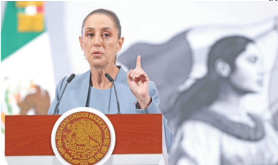
La presidenta Claudia Sheinbaum, ayer, en la mañanera.

ENFATIZÓ que la Corte debe circunscribirse a decidir si las sentencias y los amparos proceden conforme a derecho.