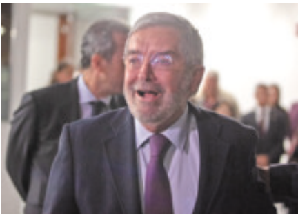
El canciller Juan Ramón de la Fuente.