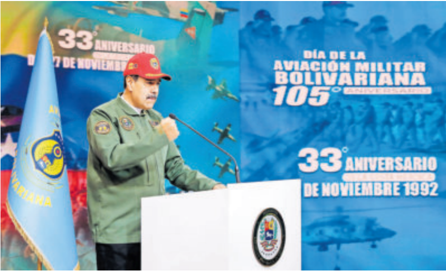
Maduro celebró el aniversario 105 de la Aviación Militar Bolivariana, en Caracas.

señalar que los supuestos narcotraficantes de Venezuela “están mandando su veneno a Estados Unidos, donde matan a miles de personas al año”.