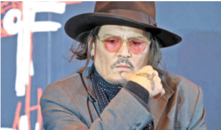
La muestra es un recorrido por la mente del artista.

En su primera visita a Japón en 8 años, el actor subrayó el carácter personal de la exposición.