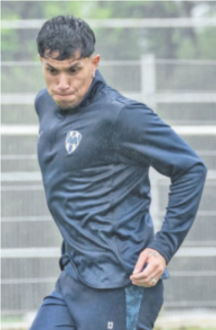
El Monterrey tiene una ventaja importante y suma gente para defenderla.

En la práctica del jueves, los jugadores que fueron titulares el miércoles realizaron trabajo de recuperación en el gimnasio, mientras que Carlos Salcedo participó