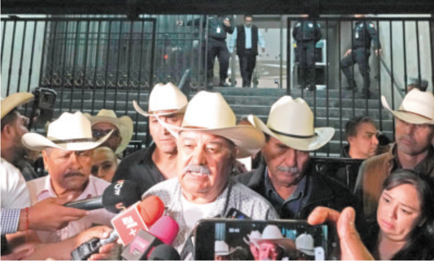
Campesinos , afuera de la Secretaría de Gobernación.