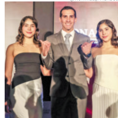
El director de Conade explicó los aumentos del 30% en becas.