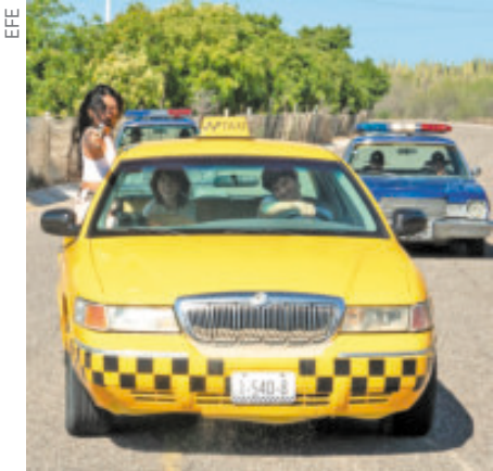
Sacude la culpa y el ruido social.

El episodio final titulado The Rightside Up se estrenará de manera simultánea en cines y en Netflix, siendo la primera vez en la historia que un episodio de una serie se proyecta en la gran pantalla.