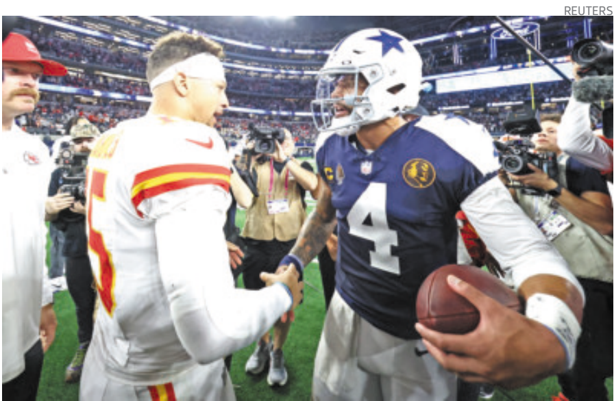
Los dos mariscales de campo se brindaron para dar un gran espectáculo.