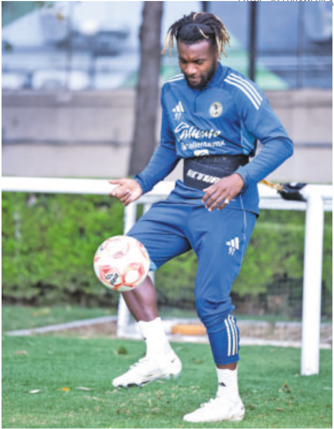
Las Águilas regresaron con mucha molestia y preocupación. Deben echar todo en la vuelta y no guardarse a nadie.