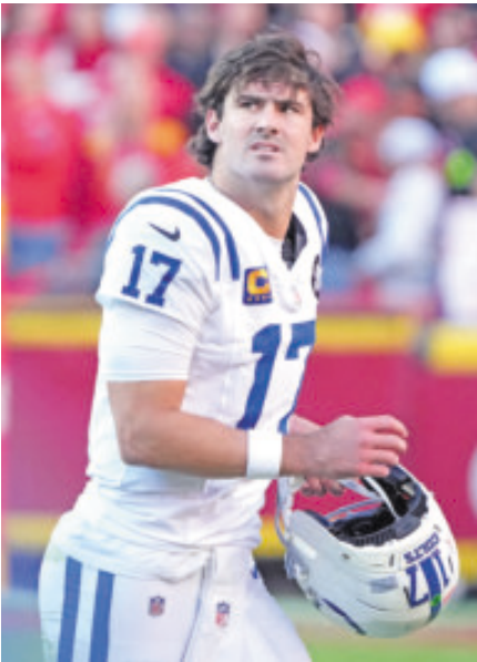
Daniel Jones ha lanzado para 2 mil 840 yardas y 17 touchdowns.