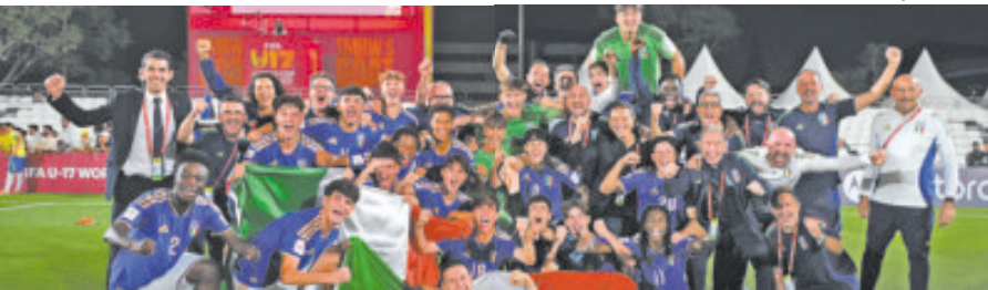
Italia derrotó a Brasil en los penales.