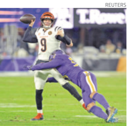
Joe Burrow está de vuelta con Cincinnati.

Burrow, de regreso tras su operación del 19 de septiembre, cerró el partido con