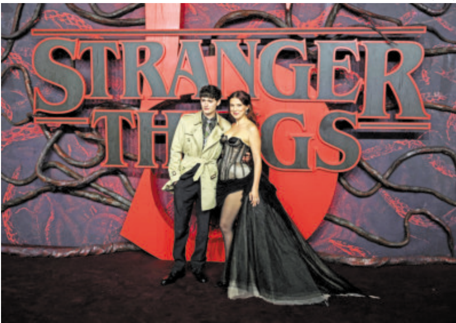
No fue la primera vez que Netflix se satura por el tráfico de Stranger Things .

“Algunos usuarios experimentaron un problema con la transmisión en dispositivos de TV, pero el servicio se recuperó para todas las cuentas en cinco minutos”