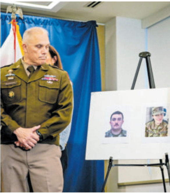
El FBI presentó fotos de los militares baleados y del sospechoso.

Lakanwal enfrenta cargos de asesinato en primer grado tras la muerte de