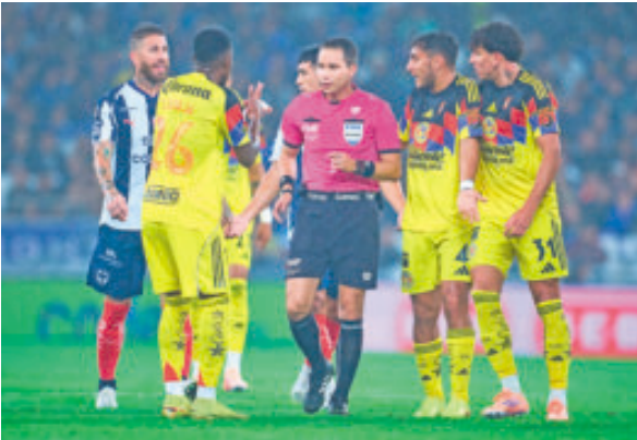
El silbante debió echar al cuarto de hora al Tecate Corona, no lo hizo y luego cometió más fallas.