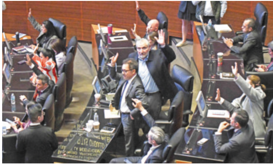
Senadores, ayer, durante la votación para aprobar la renuncia de Gertz Manero.

EL PAÍS “requiere un enlace más sólido entre la Fiscalía General de la República y las fiscalías estatales”, dijo la Presidenta.