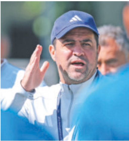
André Jardine señaló que el trabajo de los árbitros fue una vergüenza.

Y es que a los 15 minutos de partido una durísima entrada de Jesús Tecatito Corona, quien le dejó la plancha en el muslo a Álvaro Fidalgo, sólo fue considerada de tarjeta amarilla y ni fue revisada en el VAR, y las Águilas la veían