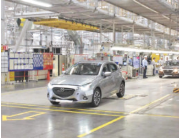
EL SOL DE SALAMANCA

Se ubica sobre una superficie de 256 hectáreas, que equivale a 341 canchas de fútbol; a lo largo de 11 años se ha posicionado como una de las más importantes para la marca a nivel global; desde su inauguración en marzo de 2025 produjo un millón 859 mil 423 unidades, el 70% de esta producción se destina al mercado estadounidense.