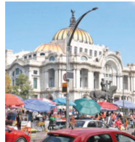
El Centro, atestado de ambulantes.