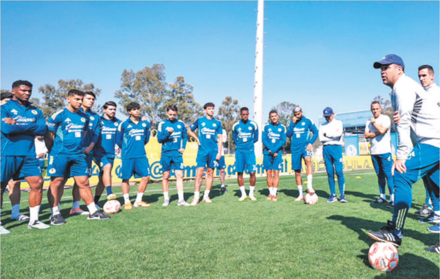
En el América saben que no hay mañana y echarán toda la carne al asador para remontar la desventaja que tienen ante los regios.