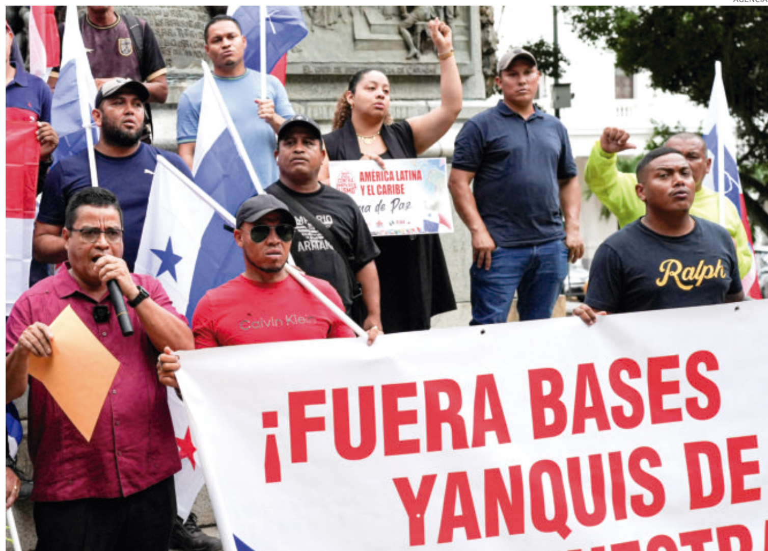
Protesta contra las amenazas de EU a Latinoamérica, en Panamá.

Pese a esta advertencia, Trump indicó el martes que "podría hablar para salvar muchas vidas" con Maduro, una conversación que sería "bienvenida" en Venezuela, de acuerdo con el fiscal general venezolano, Tarek William Saab.