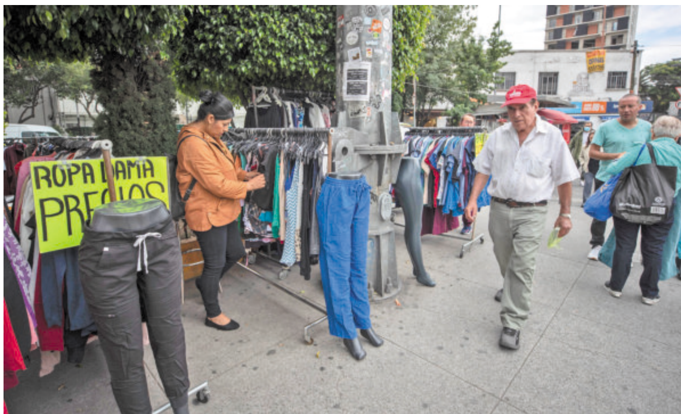
La informalidad se manifiesta en cada rincón del país.