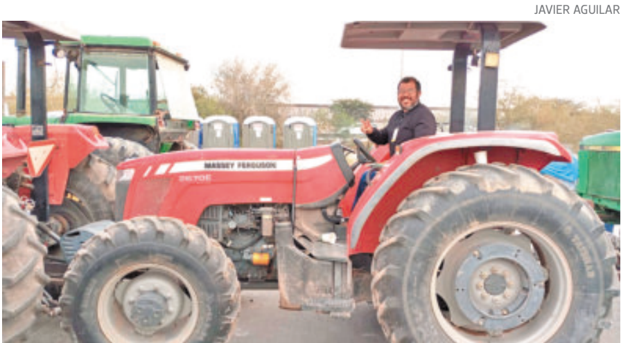
El apoyo será directo, sin intermediarios.