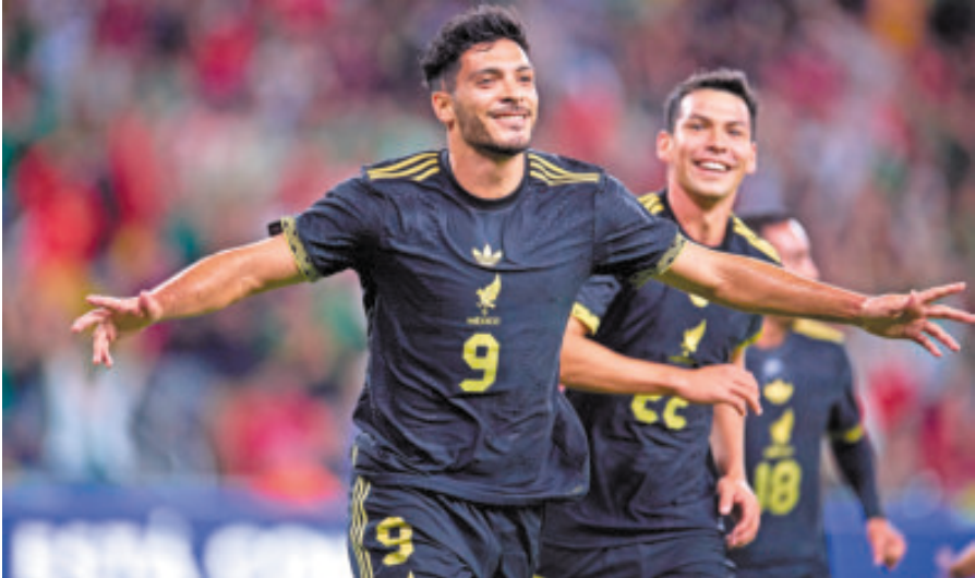
Consideran en Femexfut que ganar los títulos del área y el ejercicio de observar jugadores de Javier Aguirre eran los objetivos y se lograron. ¿Será?

"Fue un buen año en general con dos triunfos importantes en la Copa de Naciones, que no habíamos ganado y en la Copa