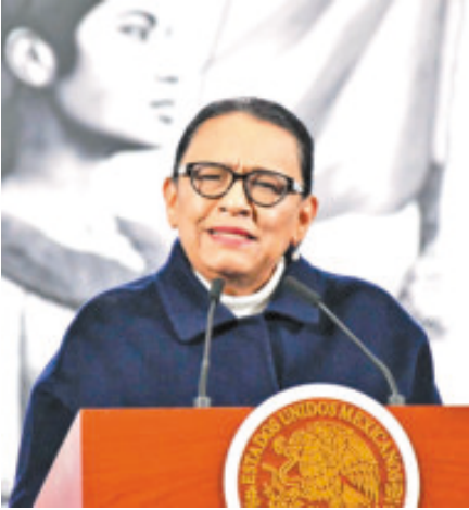
Rosa Icela Rodríguez da cuenta del trabajo realizado.