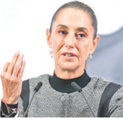
Quiere un cambio en la fiscalía.