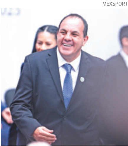
Cuauhtémoc Blanco recuerda que rumbo a Francia pasó lo mismo.

El Cuau vivió el bajón del equipo en 1998, pero se recuperaron y espera que le pase ahora al Tri, al que desea mucha suerte en 2026.