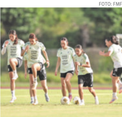
Por lo pronto, el Tri Femenil inicia hoy su camino al Mundial de Brasil 2027.