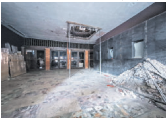
En el interior hay escombros y un hoyo en el techo.

La Cédula de publicitación vecinal pende de la cortina del teatro, a través de la cual se pueden ver escombros en el piso y un boquete en el techo; ahí se in-