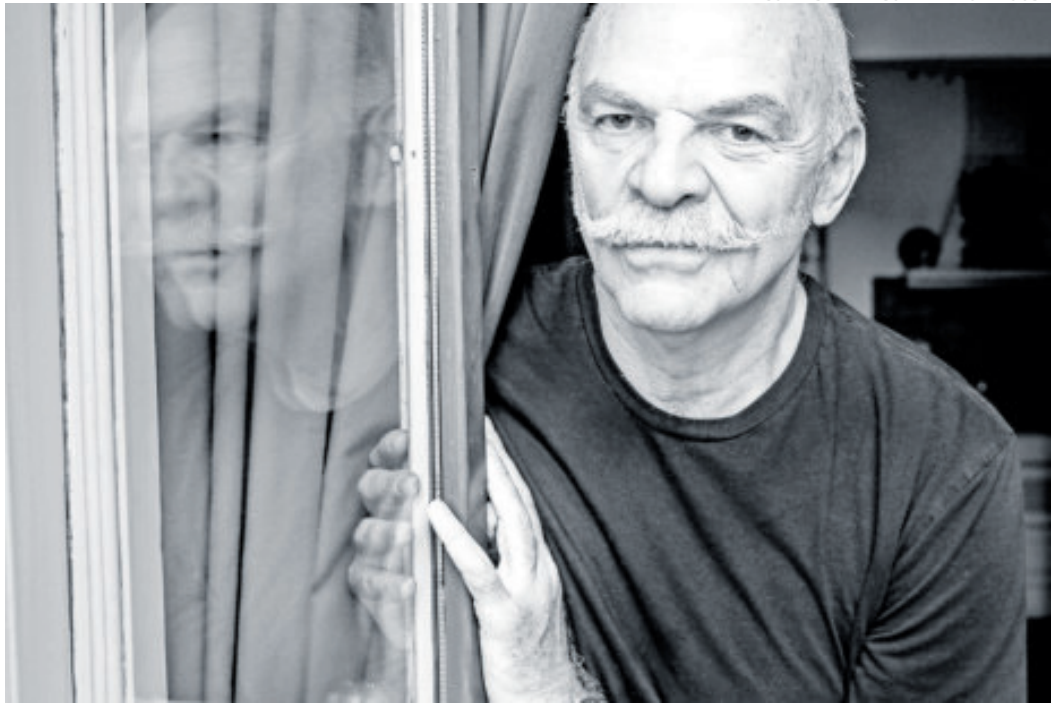
Aún no se confirma la presencia de Martín Caparrós en la entrega de la distinción universitaria.

El argentino Martín Caparrós fue postulado como escritor, filósofo y periodista acompañante de generaciones de lectores críticos en Latinoamérica. “Su desenvolvimiento filosófico ha sido en las áreas de periodismo. Además de ser columnista, sus libros nos explican, desde la crónica, el ensayo e incluso la novela, lo que significa el mundo hoy. De hecho, el último de sus libros, que reflexiona sobre su propia vida, sigue la corriente de pensar la ontología del pre-