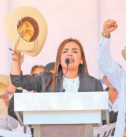
La viuda del exalcalde de Uruapan.

Según la encuestadora Poligrama, la nueva alcaldesa sería la favorita de los ciudadanos para gobernar el estado de Michoacán, con un 43.4% de los apoyos.