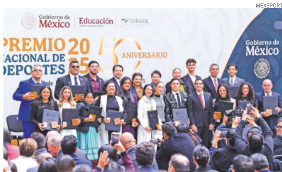
Los atletas destacaron el apoyo y los buenos resultados que lograron en 2025.

Y destacó el aumento en el alto rendimiento de 100 millones de pesos en inversión de becas directas a atletas, que es el 36% más de apoyo que les llega.