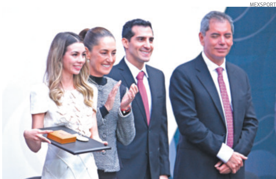
La presidenta Claudia Sheinbaum reconoció a los ganadores del PND 2025.