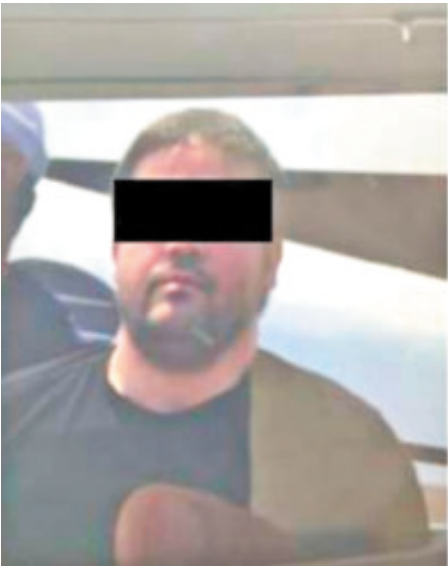
Joaquín Guzmán López y el Mayo Zambada.

Guzmán López, uno de Los Chapitos , se encuentra detenido en Estados Unidos desde el 25 de julio de 2024, cuando se entregó a autoridades estadounidenses