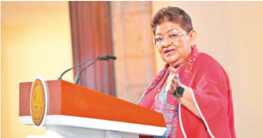
Afirma que se conducirá con profesionalismo en su nuevo cargo.

“Hoy cierro esta etapa agradecida y orgullosa del equipo con el que trabajé y de los avances que logramos juntas y juntos. Me llevo la certeza de que México sigue caminando con rumbo firme hacia un futuro más justo, más humano y con