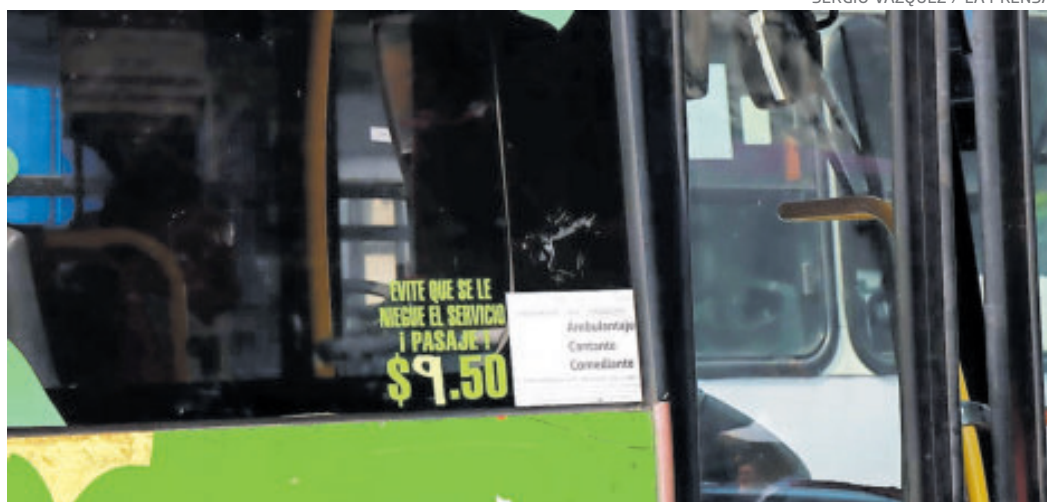
SERGIO VÁZQUEZ / LA PRENSA

Aviso por parte de los transportistas a los usuarios.