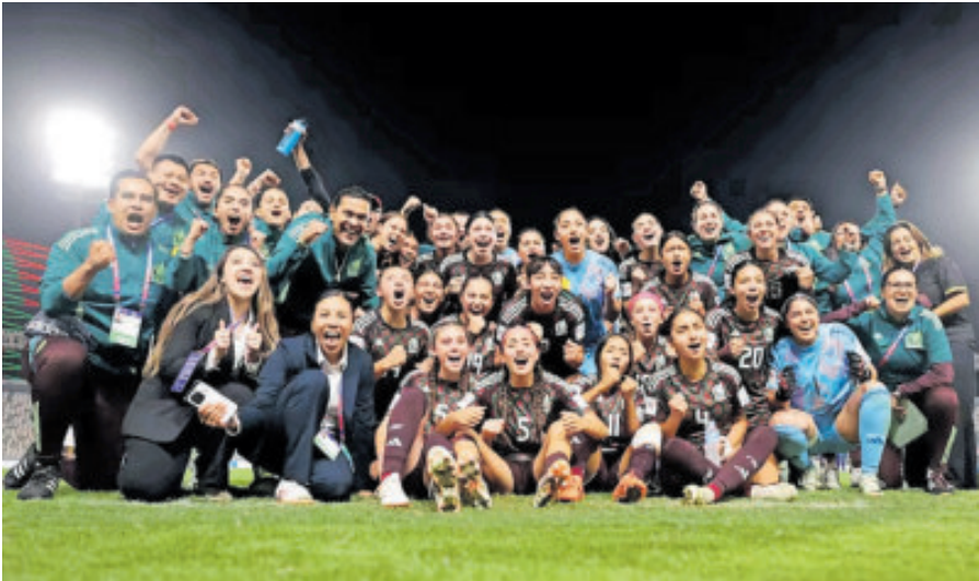
El conjunto azteca está muy cerca de la gran final del Mundial.