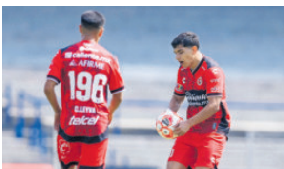
Tijuana se desdibujó por completo.