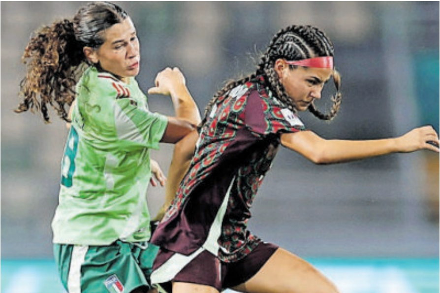
México volverá a toparse con Países Bajos, equipo al que ya venció en grupos.