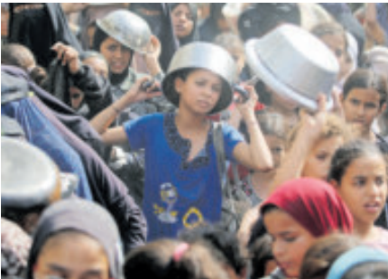
El hambre en Gaza no ha menguado.