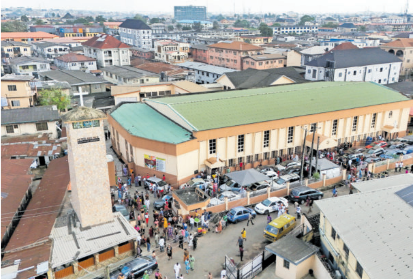
Cristianos salen de la iglesia católica de San Pedro y San Pablo, tras la misa dominical en Palmgrove, Lagos.