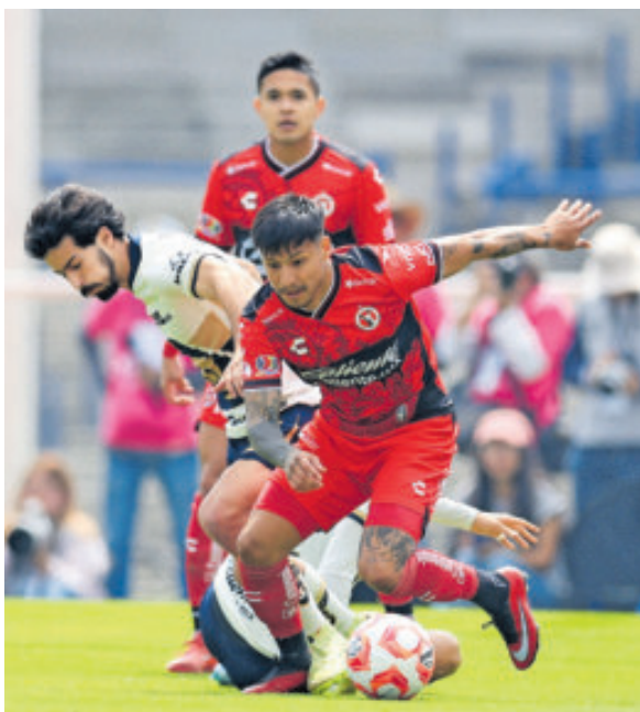
Xolos ya tiene asegurado un lugar en Play-In.

Con este resultado, Pumas logró su segundo triunfo como local en el torneo; el anterior fue ante Atlas en la Jornada 7, el pasado 31 de agosto, con gol de Aaron Ramsey, jugador que ya no forma parte del plantel, tras abandonar la institución de manera intempestiva, sin mascota, con le-