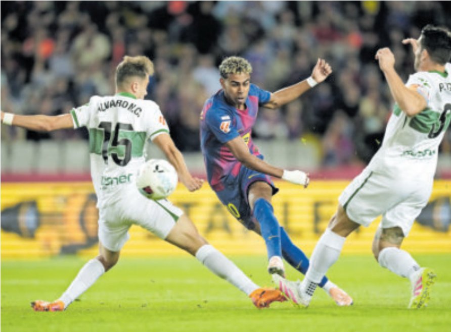
Lamine Yamal no anotaba desde el pasado 31 de agosto.

El primero llegó tras un pase errado de Affengruber que interceptó Alejandro Baldé. El lateral izquierdo avanzó y envió un preciso pase en profundidad a Yamal, que recortó hacia el interior antes de soltar un zurdazo que se coló por la escuadra. Era el primer gol de Yamal en LaLiga desde el 31 de agosto, y supuso una inyección de moral muy necesaria para el joven de 18 años, después de varias semanas luchando contra una lesión en la ingle. Dos minutos después, el lateral derecho del Elche Adrià Pedrosa se resbaló cuando intentaba controlar el balón en su propio campo y Fermín López aprovechó el balón suelto y corrió hasta la línea de fondo antes de enviar un centro raso al área pequeña, donde Torres estaba listo