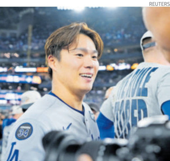
Yoshinobu Yamamoto, el Jugador Más Valioso.

Roki Sasaki llegó a Los Ángeles como un abridor, pero ante la necesidad del equipo aceptó el rol de relevista, en el cual entregó una actuación de gran nivel, lanzando en nueve partidos, en los cuales completó 10.2 entradas de solo una carrera y seis ponches, con una efectividad de 0.84.