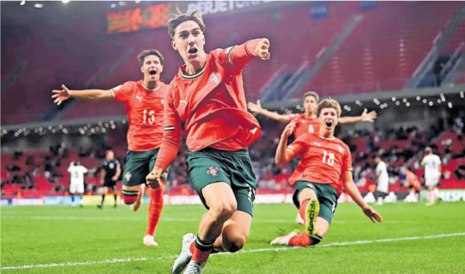
Portugal debuta esta mañana frente al equipo de Nueva Caledonia, en una jornada inaugural donde habrá 8 partidos.