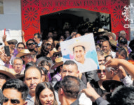
Cientos llegaron a la funeraria a despedir al edil.