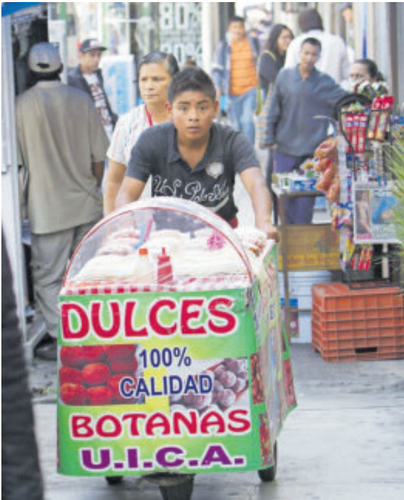
La informalidad laboral se elevó de 54.1%, en septiembre de 2024, a 54.9%, este año.

La iniciativa privada exige al gobierno federal dé la real importancia de fortalecer las condiciones que permitan un crecimiento de la economía más elevado y sostenido, de tal manera que facilite la creación de mayores empleos de calidad, formales y mejor remunerados. Ello, tras conocer la estimación oportuna del Instituto Nacional de Estadística y Geografía (Inegi), que señala que el principal indicador de la actividad económica del país, el Producto Interno Bruto (PIB), se debilitó en el tercer trimestre del año al reportar una caída trimestral de 0.3%, que respecto al mismo periodo del año pasado muestra una disminución de la misma magnitud, y representa su primera variación anual negativa desde el primer trimestre de 2021. Con estos resultados, tal parece que el debilitamiento de la actividad económica del país ya se resiente en el mercado laboral; “porque la situación es complicada, incluso para la población ocupada que se puede considerar formal”, aseveró el Centro de Estudios Económicos del Sector Privado (CEESP), en su análisis semanal. Pues en este ámbito, observa que, de acuerdo con los datos publicados por el Inegi, del aumento total de la población