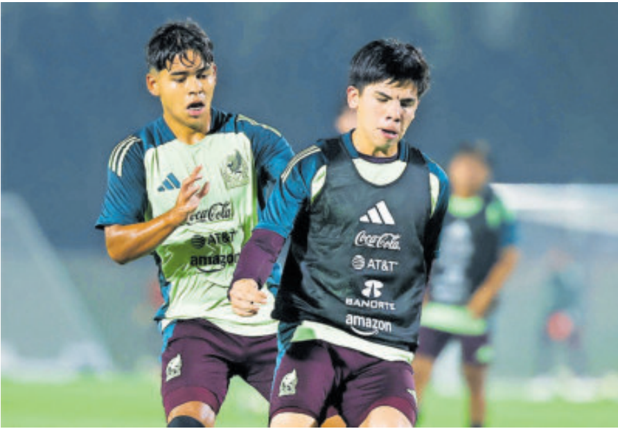
Los niños mexicanos se presentan mañana martes ante Corea del Sur.

El Mundial Sub-17 masculino de 2025 será la primera edición en contar con 48 selecciones, el doble de equipos que participaron en el de 2023 en Indonesia, y comenzará este lunes en Qatar hasta el 27 de noviembre con Alemania como vigésimo campeona. Será un campeonato sin precedentes que reunirá a 9 países asiáticos (AFC), 10 africanos (CAF), 8 de la Concacaf (Norteamérica, Centroamérica y el Caribe), 7 de la Conmebol (Sudamérica), 3 oceánicos (OFC) y 11 europeos (UEFA). Catar será la sede de esta vigésima edición y también de las próximas hasta 2029, y lo hará anualmente, a diferencia de los anteriores mundiales de la categoría, que se disputaban cada dos años. Un caso igual al de Marruecos, que organizará anualmente el Mundial Sub-17 femenino durante el mismo periodo de cinco años. Un país, el catari, que va acogiendo cada vez más eventos deportivos y de importante entidad, como el Mundial de Fútbol de 2022 (Argentina), la Fórmula 1 (Lu-