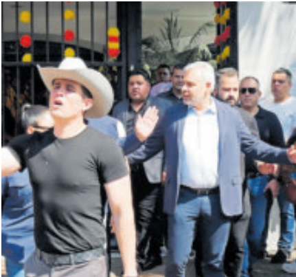
El gobernador Alfredo Ramírez, ayer.

ras del recinto a la espera de que saliera la carroza con el ataúd del alcalde para dirigirse hacia la Pérgola Municipal, donde se le dedicó un homenaje de cuerpo presente.