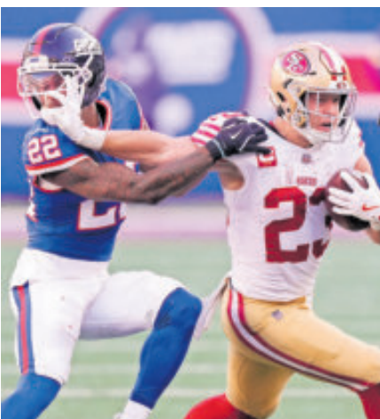
Christian McCaffrey acumuló 173 yardas totales y dos touchdowns.

McCaffrey, por su parte, tejió otra actuación magistral al acumular 173 yardas totales y anotar dos touchdowns —uno por tierra y otro por aire—. El corredor estrella registró 106 yardas terrestres en 28 acarreos y añadió 67 yardas por