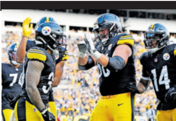
Triunfo inesperado logra Pittsburgh sobre Colts.

NO REFLEJA el dominio real de Steelers, quienes lideraron 27-10 hasta el último cuarto, antes de permitir 10 puntos de la reacción de Colts.