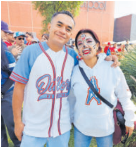
Acudir a esos eventos, una experiencia única.

Se ha tratado de una edición más de la estratégica serie de activations ideadas por la oficina de la liga en ter-