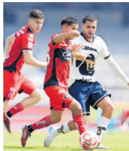
El equipo fronterizo es noveno general con 21 unidades.