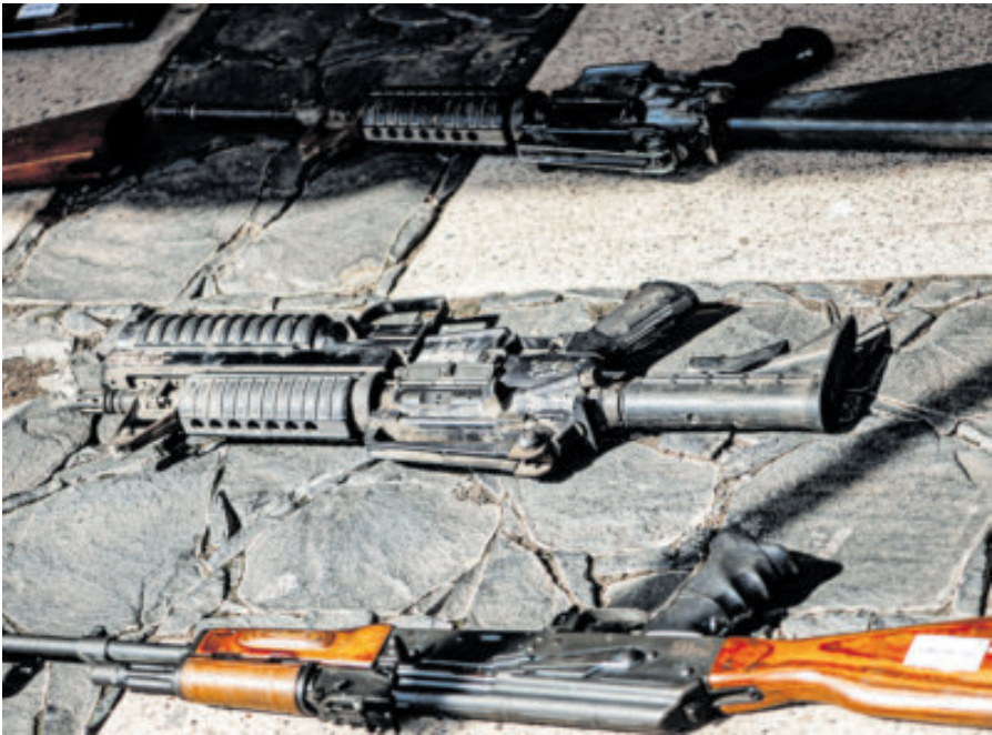
El caso se centra en delitos por posesión de armas de fuego.

El Tribunal de Disciplina Judicial aplicó, por primera vez, una suspensión a un juez para investigar si incurrió en alguna irregularidad en el desarrollo de un proceso legal. La Comisión de Investigación señaló que un juez de distrito, con sede en Colima, será investigado para determinar si incurrió en faltas graves en el ejercicio de la administración de justicia, debido a un “notorio desvío de la legalidad”, al actuar como parte activa en la reducción de penas acordadas en al menos cuatro asuntos relativos a procedimientos abreviados, relacionados con la comisión de delitos de portación y posesión de armas de fuego y de estupefacientes. La suspensión provisional ya fue notificada al juez y tiene como objetivo “evitar el ocultamiento o destrucción de pruebas; impedir la continuación de los efectos perjudiciales de la presunta falta administrativa; evitar la obstrucción del adecuado desarrollo del procedimiento de investigación de responsabilidad administrativa, y salvaguardar la integridad de las personas potencialmente afectadas por conductas graves”. Señaló que este procedimiento está acorde con lo previsto en los artículos 123 de la Ley General de Responsabilidades Administrativas y del artículo 98 del