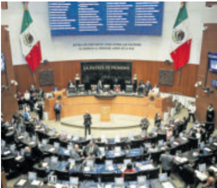
El dictamen se abordará esta semana en la Cámara alta.

hagan las reasignaciones presupuestales definitivas. El dictamen establece que para 2026 habrá un gasto neto total de 10 billones 193