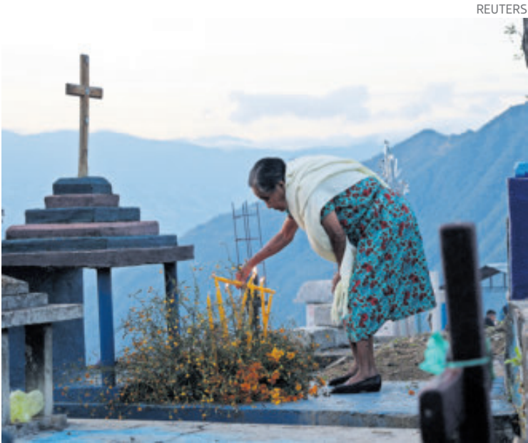
Hay que elaborar un plan funerario antes de morir.