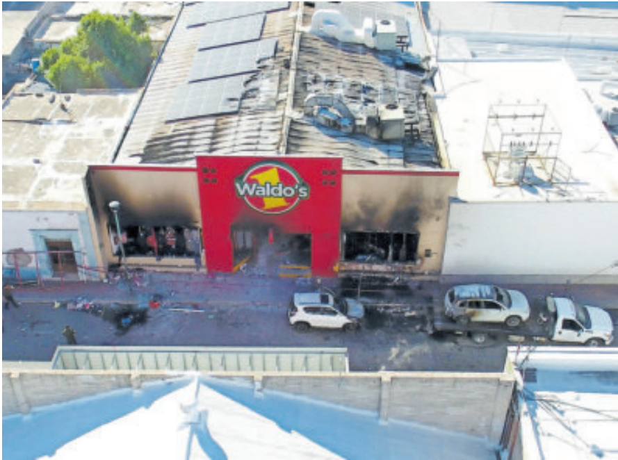
La fachada de la tienda tras el incendio en su interior.

El fiscal general de Justicia de Sonora, Gustavo Rómulo Salas Chávez, aseguró ayer que la principal línea de investigación en la trágica explosión en una tienda de Waldo's, que dejó 23 muertos y 15 heridos en Hermosillo, Sonora, es un transformador que brindaba electricidad al establecimiento, y anunció el cierre de las 68 tiendas de la cadena en el estado. “Están revisándose toda la instalación, en superficie como en la parte superior, ya que cuentan con convertidores para convertir la energía solar en eléctrica”, apuntó. “No se ha permitido por supuesto la alteración de ninguna manera, ni de los equipos, ni de los aires acondicionados, ni de ninguna instalación en el lugar, de tal suerte que los peritos tengan al alcance la mayor información que puedan recabar”.