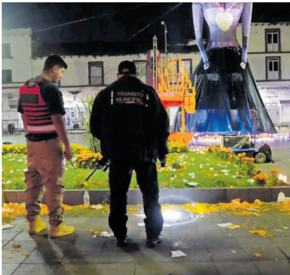
El alcalde Carlos Manzo fue atacado al concluir el Festival de las Velas, en el centro de Uruapan, el sábado por la noche.

Los agresores, argumentó, “aprovecharon la vulnerabilidad de un evento pú-