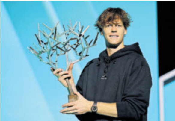
Fue su vigesimosexto triunfo consecutivo bajo techo.

Tras la eliminación de Alcaraz en su entrada en juego, Sinner, de 24 años, no ha tenido rival en un torneo en el que hasta este año solo había ganado un partido en tres participaciones y se alza con el título sin haber perdido un set, algo que no ocu-