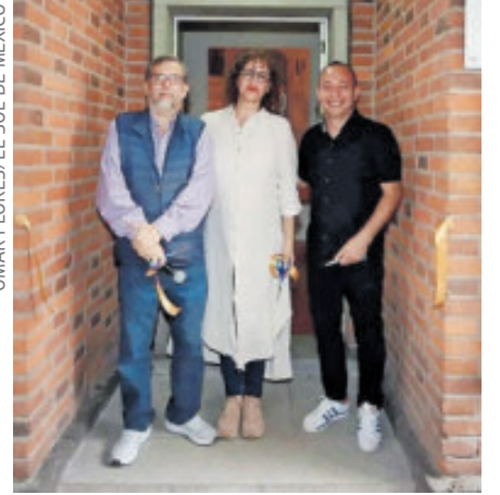
Recuerdan el legado del cineasta español Luis Buñuel.