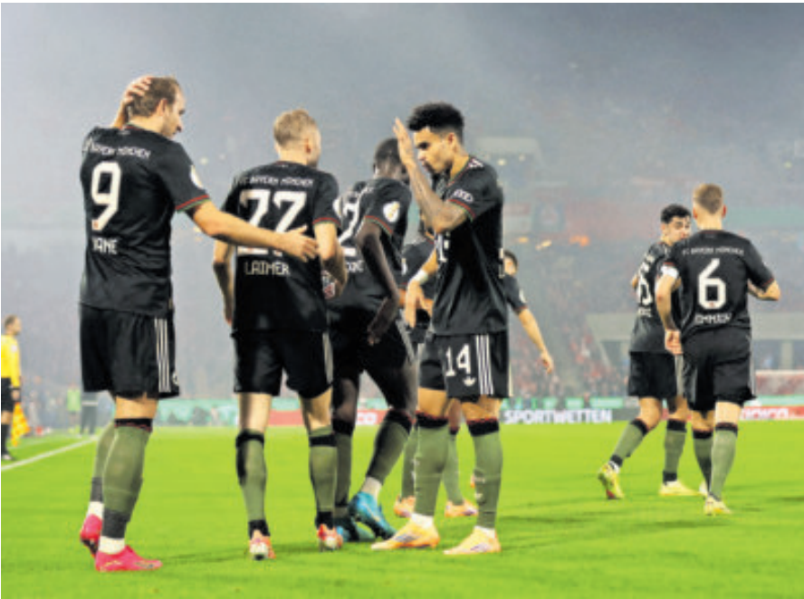
Bayern Múnich tiene cinco puntos de ventaja sobre el Leipzig en Alemania.

Nadie es capaz aún de discutir en esta campaña los lideratos del Bayern Múnich ni al Arsenal, incontestables en la cima, indiscutibles en el ataque y referencias imponentes en defensa en esta campaña en Europa, como dos equipos inabordables tanto en Alemania como en Inglaterra, entre los vaivenes que surgen todavía en la competición por la primera plaza tanto en Francia e Italia. El París Saint-Germain es el líder en la Ligue 1, pero con sólo dos puntos sobre sus perseguidores (el Marsella y el Lens). Y el Nápoles es el dominador de la agitada competición en Italia, aunque sólo con una ventaja de un punto sobre el Inter, el Milán y Roma. Nada que ver con Bayern y Arsenal, con cinco y seis puntos de renta, respectivamente. El equipo de Mikel Arteta sólo ha encajado tres goles en diez jornadas. Un reflejo de su figura inabarcable para el resto de sus competidores. Su victoria por 0-2 ante el Burnley la definió en la primera parte. Viktor Gyokeres, reencontrado con el gol cinco jornadas después, y Declan Rice resolvieron el duelo en poco más de media hora.