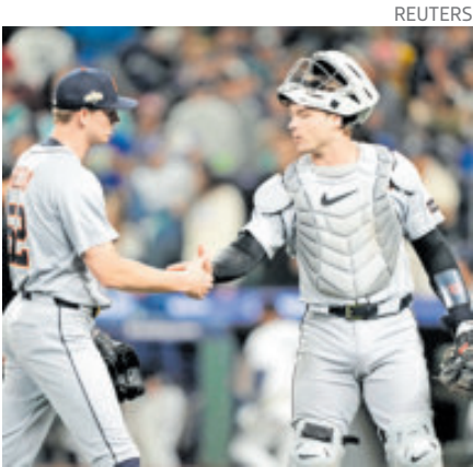
Es el receptor los Tigres de Detroit.

te de los Tigres en llevarse el honor desde Ian Kinsler como segunda base en la temporada de 2016.