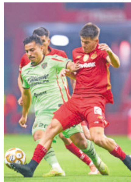
Los Bravos se presentaron en el Nemesio Díez a no recibir más goles.