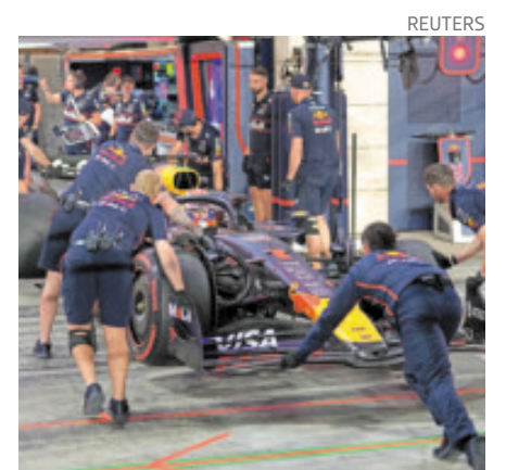
Max Verstappen saldrá tercero hoy.

ció, tras clasificarse octavo de cara al GP de Qatar, que “la F1 tiene exceso de todo menos de cosas que den espectáculo”.