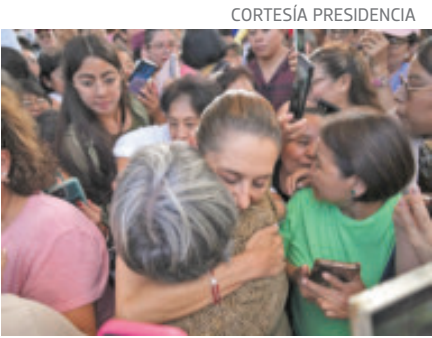
La presidenta Claudia Sheinbaum, ayer, de gira.

Cabe señalar que, hasta el momento, no hay certeza sobre el precio real de la gasolina regular en el país, luego de que en agosto la Presidenta informó de la renovación del acuerdo con el sector gasolinero para mantener el tope de 24 pesos por litro de gasolina magna.