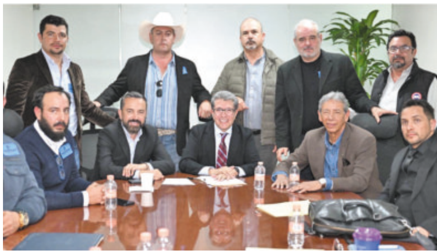
Ricardo Monreal, con líderes agrícolas, durante una reunión.

El funcionario detalló que, en colaboración con la Guardia Nacional y la Secretaría de Gobernación (Segob), se acordó “reforzar los mecanismos de coordinación, dar seguimiento a las carpetas de investigación en las fiscalías y fortalecer los operativos en los tramos con mayor incidencia”.