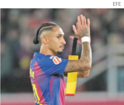
El brasileño puso dos asistencias para gol en la victoria del Barcelona.

“Es un momento muy especial para mí. Significa mucho, porque mi esposa sabe muy bien todo el tiempo dedicados. Fueron muchas horas. Se ha jugado para lograr estos resultados, y al final conseguimos el objetivo”, indicó Filipe.