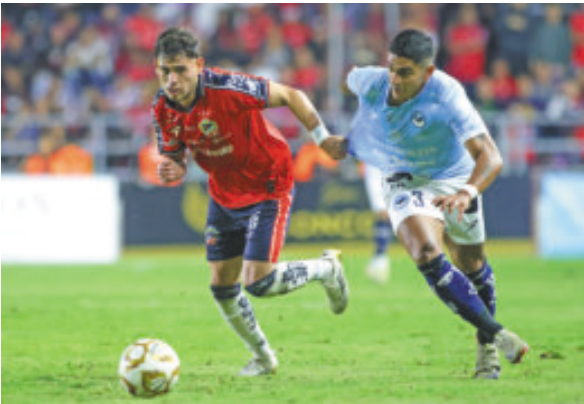
Fue un partido trabado, con pocas oportunidades reales de gol; Tampico Madero tiene ligera ventaja.