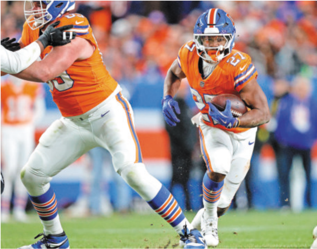
Broncos de Denver lideran la división Oeste de la AFC, con récord de 9-2.