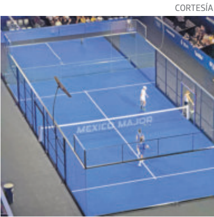
El México Major Premier Pádel ha demostrado ser un evento clave.