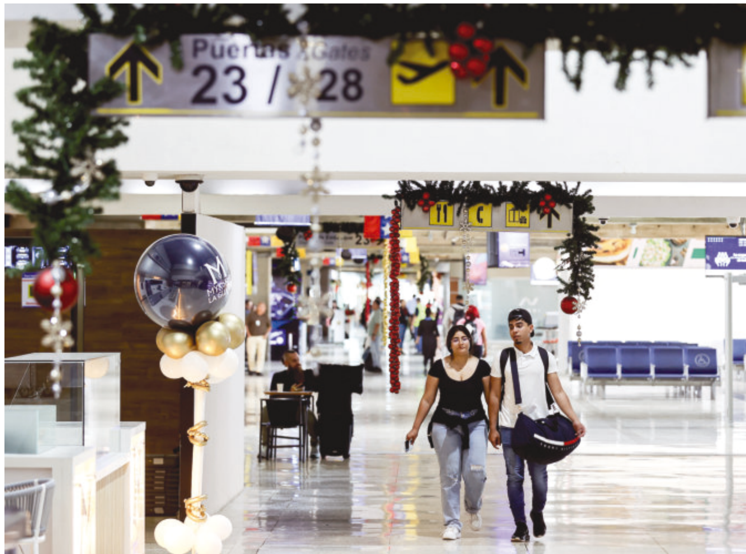
En el Aeropuerto de Maiquetía, el principal de Venezuela, aún hay actividad de aviones nacionales e internacionales.