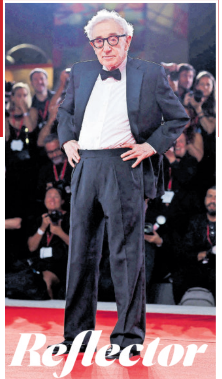
El director Woody Allen cumple hoy 90 años.

En 2002 recibió el Premio Príncipe de Asturias de las Artes, mientras que, en 2007, recibió el doctorado honoris causa por la Universidad Pompeu Fabra