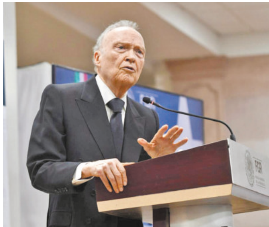
Alejandro Gertz Manero, exfiscal general de la República.

Un escándalo más de corrupción, ahora en el sexenio de Andrés Manuel López Obrador, fue lo ocurrido en Segalmex, la Seguridad Alimentaria Mexicana, donde persistieron desvíos de más de 15 mil millo-