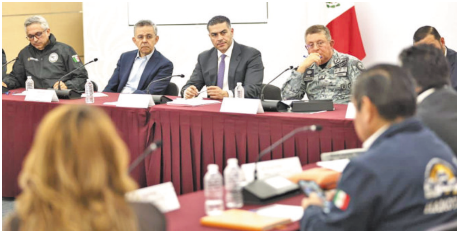
Omar García Harfuch, secretario de Seguridad, ayer, en una reunión con transportistas.