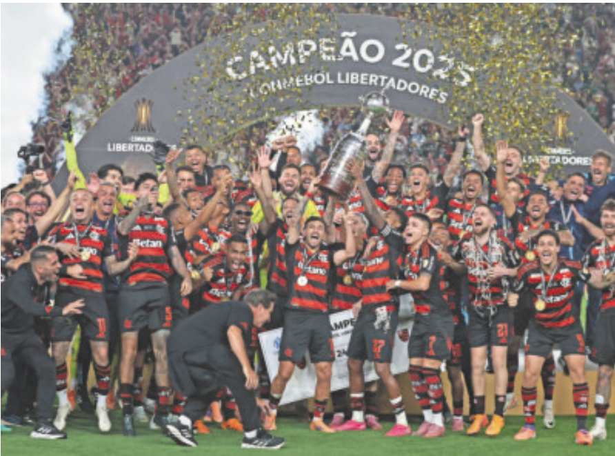
El Fla es el equipo brasileño con más títulos de Libertadores de América.

La primera oportunidad de gol clara llegó a los 14 minutos con un remate de Bruno Henrique que salió por encima del travesaño.