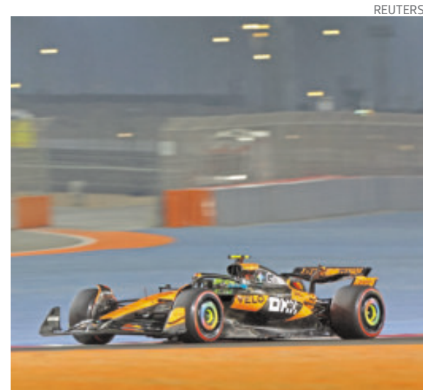
Lando Norris está cerca de su primer título mundial.

“Va a ser una carrera dura, con las dos paradas al límite de vueltas. Vamos a intentar ir a tope en una pista en la que se experimentan muchos Gs de fuerza. Intentaré repetir lo de la sprint, a ver si tenemos suerte”, destacó.