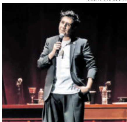
Se presenta el Auditorio Nacional.

También maneja temáticas que le atañen, como "responsabilízate de ti mismo, cómo la tecnología nos quita autoridad para pensar ciertas cosas, creo que es un conjunto temático congruente", agregó.