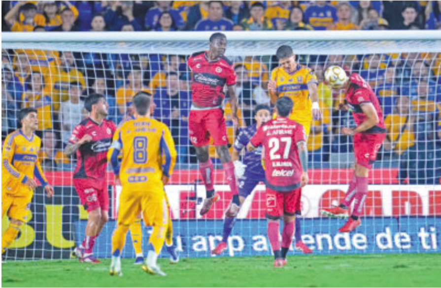
La defensa del equipo fronterizo tuvo mucho trabajo anoche y fue vulnerada.

El conjunto de la UANL se repuso fácilmente de una desventaja de tres goles en la ida, y golearon en casa para avanzar de ronda