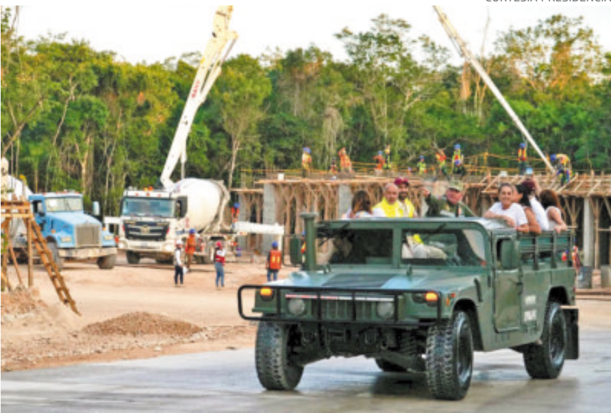
La presidenta Claudia Sheinbaum, ayer, durante supervisión de la obra.

“Hoy (ayer) en la tarde vamos a visitar la obra del Tren Maya de carga. ¿Para qué