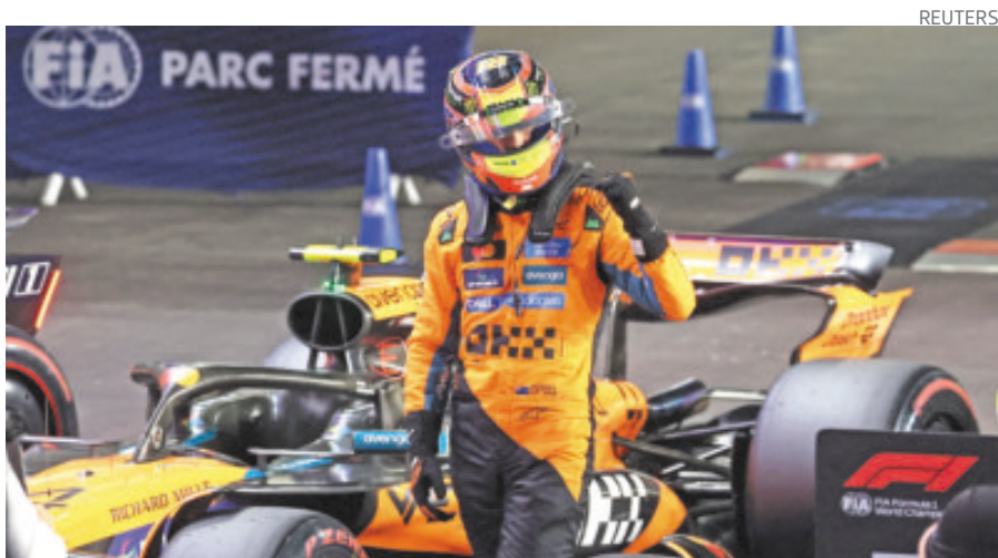
Oscar ahora está a 22 puntos del líder Lando Norris.