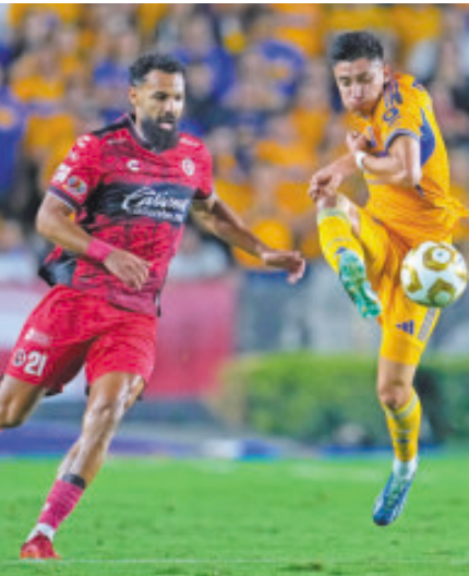
El conjunto de Tijuana fue otro completamente al del juego de ida.