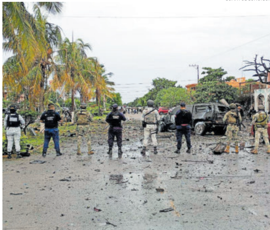
El auto que explotó en Coahuayana dejó seis muertos.

En entrevista con Ovaciones dejó en claro que tampoco se puede argumentar que no había una motivación ideológica en el ataque, porque “finalmente de lo que se trata es de crear un ambiente de terror entre la ciudadanía”.