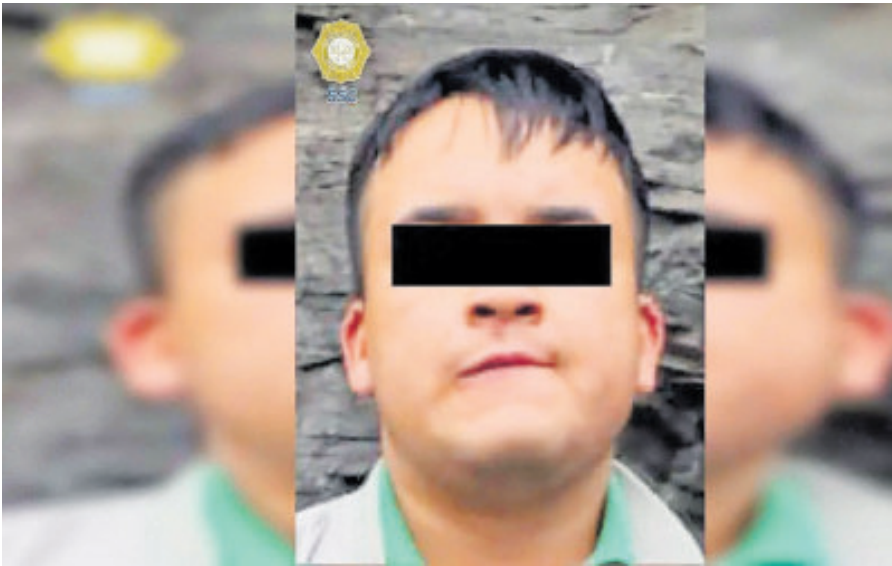
El sospechoso de las autoridades tiene 20 años de edad.

El lunes mismo, el vehículo fue localizado en el cruce de las avenidas Insurgen-