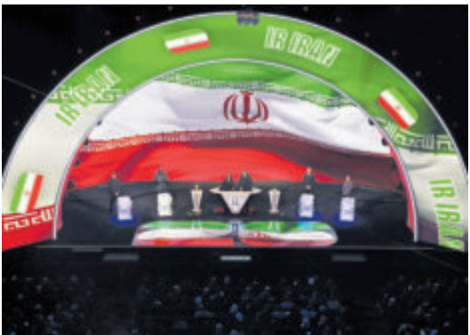
Los iraníes y egipcios protestan, ellos prohíben la homosexualidad.