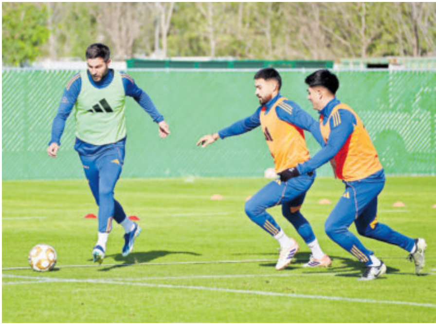
Los felinos tiene una plantel plagado de gente con mucha cancha recorrida.

Mientras que una decena tendría su segundo cetro con la institución (tras el