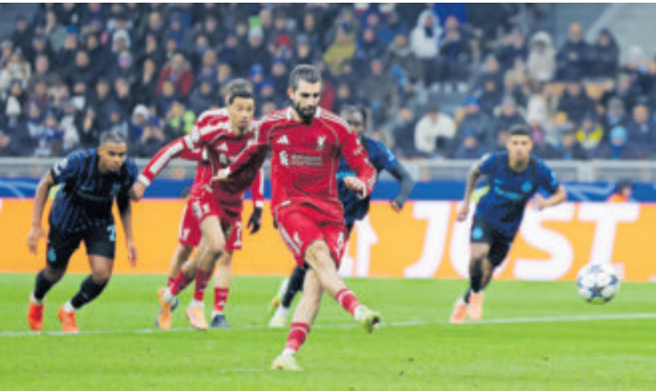
Liverpool logró un triunfo reconfortante frente al Inter de Milán.