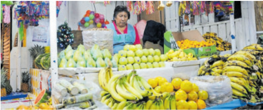
El precio de la fruta y verdura se fue por las nubes en noviembre.

La inflación general repuntó en noviembre pasado a 3.80% anual, desde 3.57% que se ubicó en octubre anterior, por encima de lo esperado por el mercado de 3.68 por ciento. Ello, toda vez que el Índice Nacional de Precios al Consumidor (INPC) se incrementó 0.66% mensual en el décimo primer mes de esta anualidad. Pero además, registró su mayor alza mensual en 16 meses, impulsada por mayores precios de frutas y verduras, servicios y ajustes en tarifas eléctricas. Además por el incremento al transporte público, jitomate y precios en fondas y loncherías, marcaron el alza de precios en el mercado, además de vivienda propia; chile serrano, servicios profesionales, restaurantes y similares, calabacita y hasta productos para el cabello.