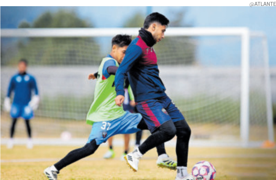
Los Potros disputarán su último torneo en la Liga de Expansión en 2026.