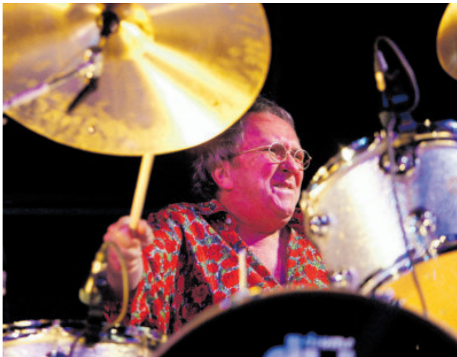
Mitch Mitchell, durante un concierto tributo a Jimi Hendrix.

Las grabaciones ayudaron a iniciar la era de la música psicodélica y convirtieron a Hendrix en una superestrella del rock antes de su prematura muerte en Londres en septiembre de 1970, a los 27 años. Cinco décadas después, la música de The Jimi Hendrix Experience sigue siendo popular y rentable.