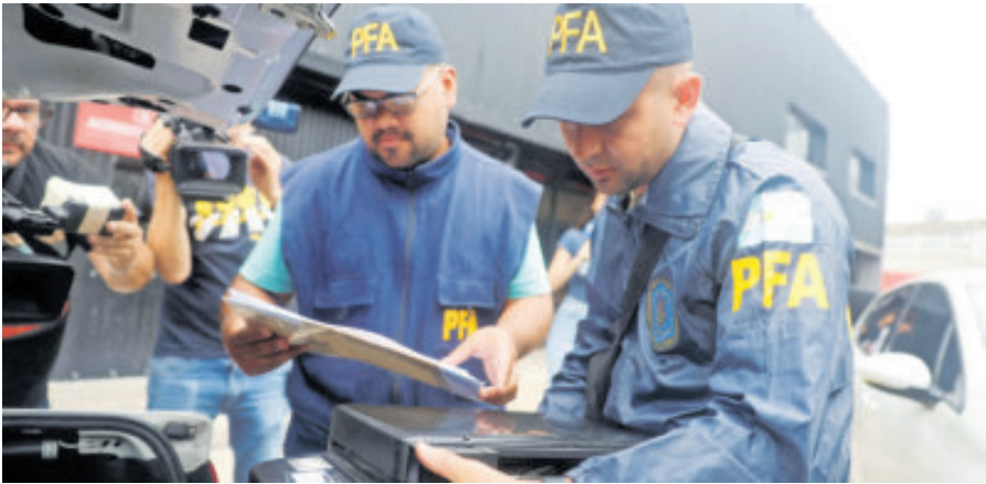
La policía de Argentina cateó la AFA y las instalaciones de clubes en cuestión.

La investigación alcanzó incluso al predio de entrenamiento de la selección argentina, en la localidad de Ezeiza (provincia de Buenos Aires), que lleva el nombre de Lionel Messi, donde los