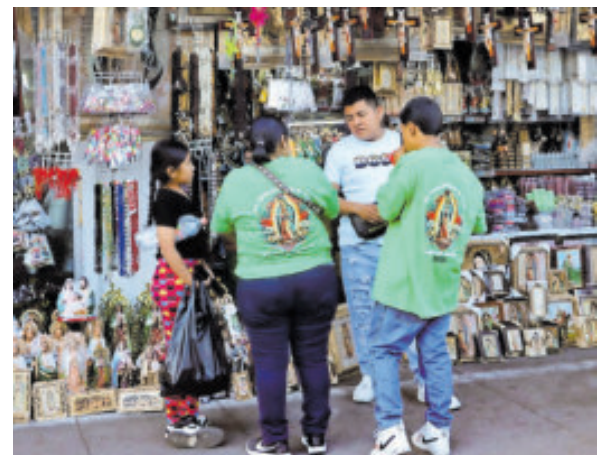
El comercio en la calzada de Guadalupe.