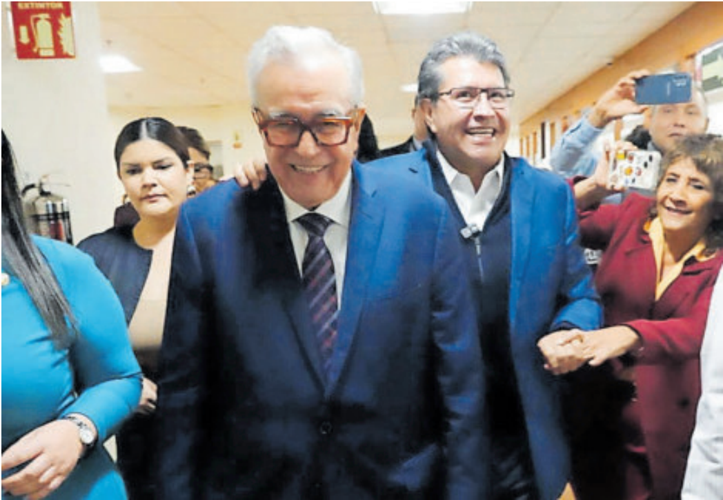
Rubén Rocha, gobernador de Sinaloa, y Ricardo Monreal, en la Cámara de Diputados.

El coordinador de los diputados de Morena, Ricardo Monreal, salió a la defensa del gobernador de Sinaloa, Rubén Rocha Moya, quien, dijo “ha sido un gobernador eficiente, eficaz, honesto y no hay nada que lo implique” (con el secuestro de Ismael el Mayo Zambada), y “con la declaración (de Joaquín Guzmán López, hijo de Joaquín el Chapo Guzmán., de que él se encargó del plagio) se confirma lo que él ha estado diciendo”. “Yo le creo a él, lo conozco bien y si ya (el hijo del Chapo ) declaró que él fue quien lo secuestró, que él fue quien lo sedó y que él fue el que lo trasladó, pues es él el responsable y no hay otros involucrados”, sentenció. Asimismo, cuestionado sobre la afirmación del presidente de Estados Unidos, Donald Trump, a un medio de comunicación de ese país, en el que amagó con acciones bélicas contra los narcos en México, Monreal Ávila consideró que él “puede hacer lo que él quiera, porque habla para su público, pero México nunca estaría dispuesto a ninguna invasión, injerencia o intervención de ningún tipo, que no sea de manera coordinada y de colaboración”.