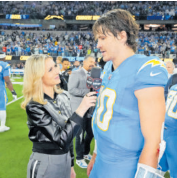
Al parecer quería celebrar y no dar entrevistas.