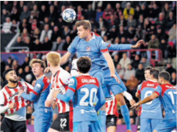
Atlético de Madrid se rehízo y ganó al PSV de visita.

PARA HOY: Qarabag-Ajax; Villarreal-Copenhague; Athletic-París Saint Germain; Bayer Leverkusen-Newcastle; Benfica-Nápoles; Borussia Dortmund-Bodo/Glimt; Club Brujas-Arsenal; Juventus-Pafos y, finalmente, Real Madrid-Manchester City.