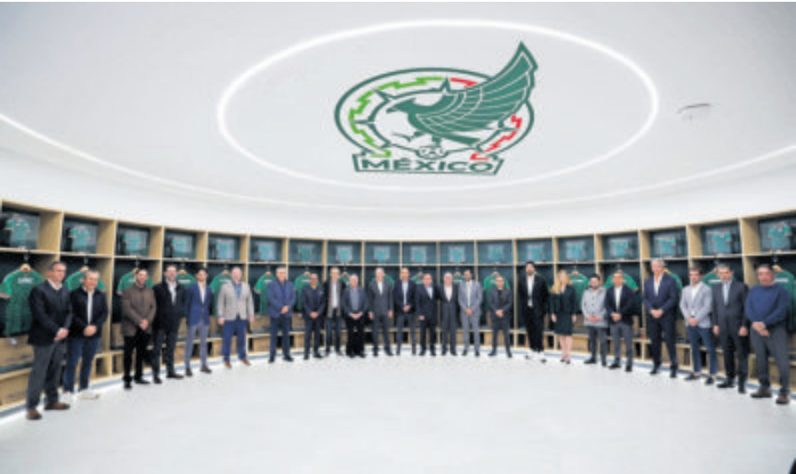
Los dueños se reunieron para tomar decisiones de cara al próximo semestre.