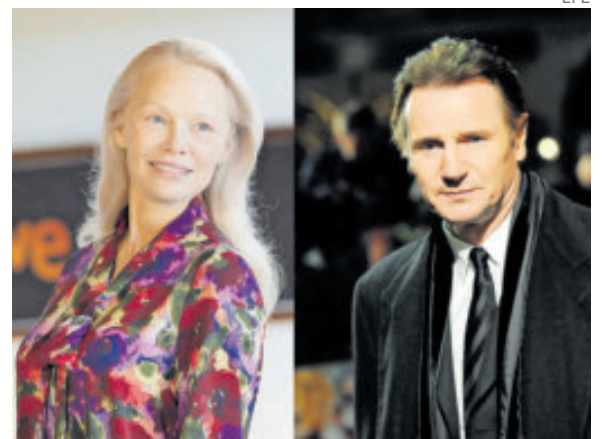
Generaron rumores sobre su romance.

Ambos generaron rumores de un romance tras su trabajo el verano pasado en The Naked Gun , aunque luego se supo que todo formó parte de un truco para promover el filme que protagonizan.