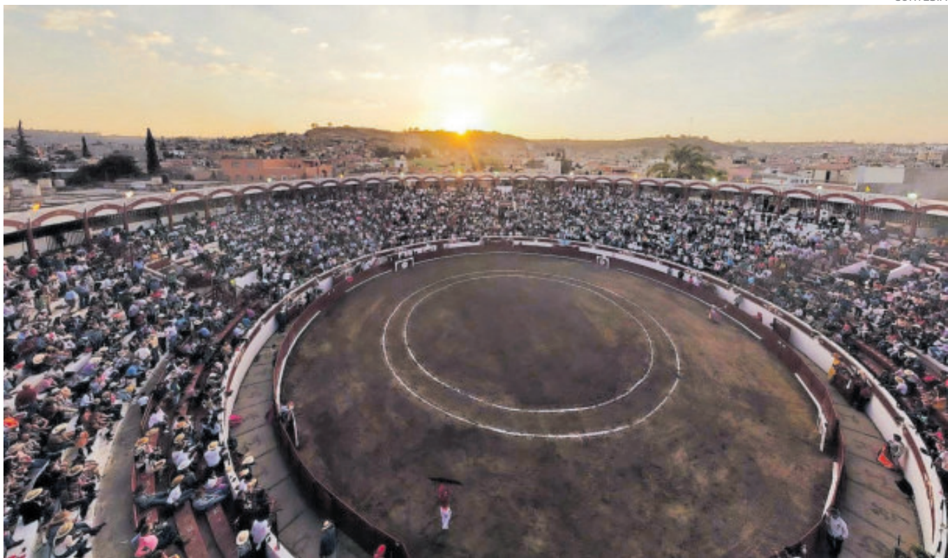
El Carnaval de Jalos no es un festejo más, ya que es un punto de referencia entre las plazas taurinas mexicanas.