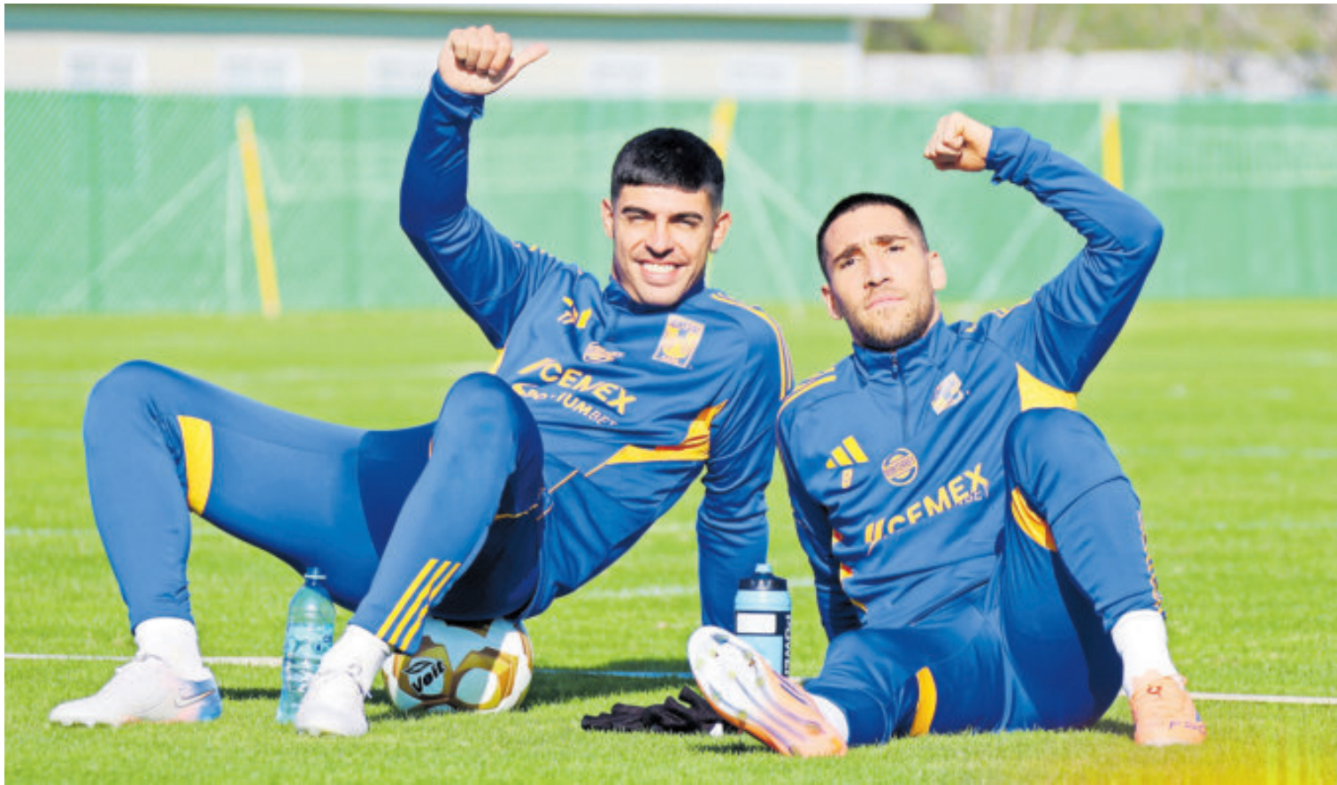
Los felinos ya antes ganaron títulos como visitantes frente a los primeros lugares y buscarán repetir ahora ante el Toluca.