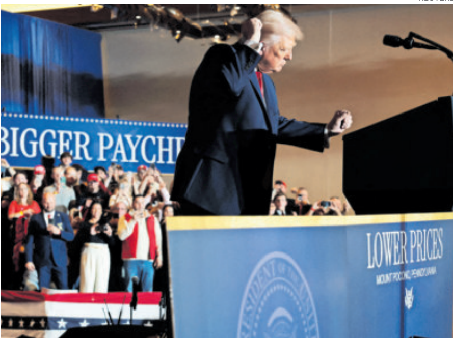
El presidente Donald Trump, al bailar en un evento en Pensilvania.

El secretario de Estado, Marco Rubio, sostuvo en aquel momento que su país descartó una intervención directa y que la relación con México se orienta al fortale-