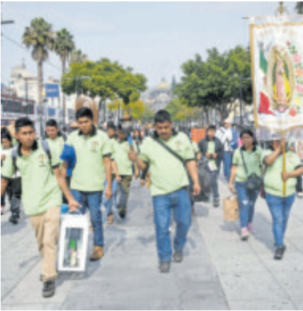
Vigilarán más de 5 mil policías.