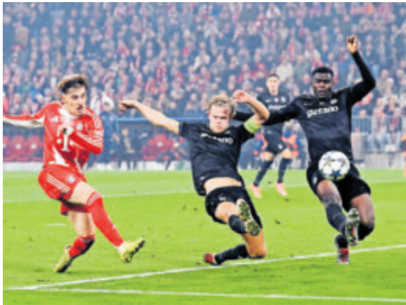
El Bayer se reencontró con la victoria ante Sporting.