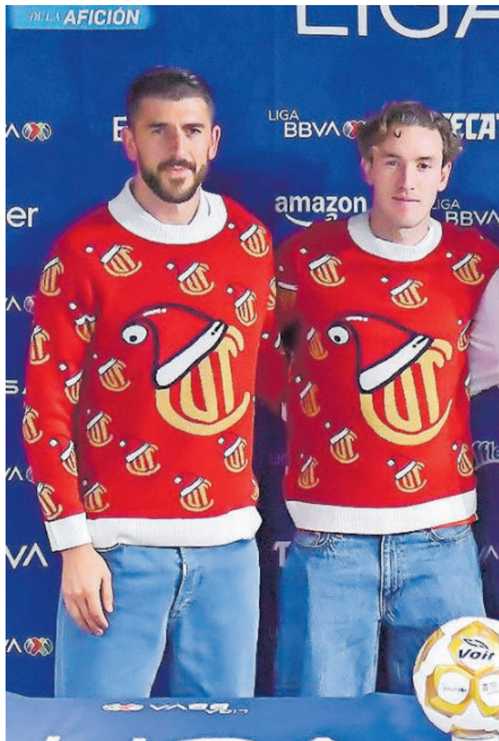
En el Toluca saben que es una final sin favorito ante Tigres, pero su motivación es grande para seguir cosechando títulos y firmar el anhelado bicampeonato.

"Hemos tenido un año espectacular con títulos, dos superlideratos, el mayor goleo y el que más ganó, nos queda este último esfuerzo y después vemos si nos alcanzó o no", remató.