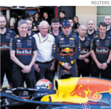
Los Toros Rojos le dedicaron un emotivo mensaje en redes.

“Para mí despierta muchas emociones. Mucha adrenalina, nervios, presión, creo que es algo muy natural porque somos mexicanos y somos muy apasionados por nuestros jugadores, nuestro orgullo y porque queremos representar a México”.