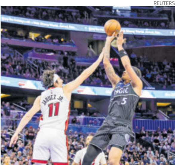
Triple J jugó 24 minutos y anotó 10 puntos.

Jamahl Mosley supo ordenar a sus hombres, que frenaron la hemorragia en ese primer cuarto. Desmond Bane, Paolo Banchero y Jalen Suggs tomaron las riendas en un segundo cuarto en el que Orlando anotó 39 puntos y pulverizó la ventaja de Miami había amasado, incluso llegándose a ponerse por delante en el marcador. Los de Erik Spoelstra aún disputaron los primeros minutos del segundo tiempo, pero con el paso del tiempo se desmoronaron y Orlando se llevó la victoria. El mexicano Jaime Jáquez Jr. salió de la banca para jugar 24 minutos en los que logró 10 puntos, 3 rebotes y 3 asistencias. Será el debut del Magic en semifinales de la NBA Cup, en una edición en la que aún no han perdido un solo partido. El año pasado también alcanzaron los cuartos de final, pero cayeron ante el que acabaría siendo el campeón, los Milwaukee Bucks.