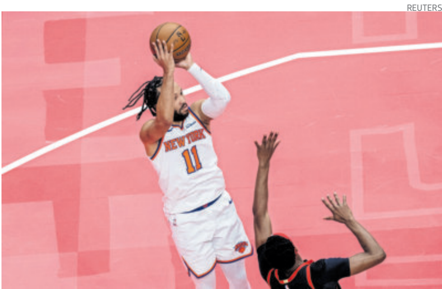
Jalen Brunson lideró el ataque de Knicks, con 35 puntos.