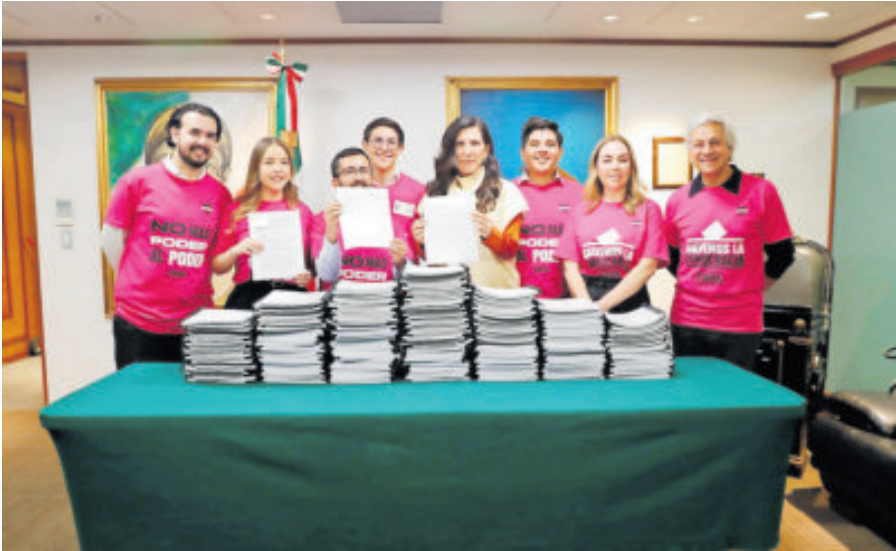
Salvemos la Democracia entregó ayer la iniciativa de reforma ciudadana.