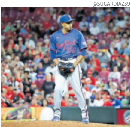
El puertorriqueño llega de Mets.

Los Angeles Dodgers llegaron a un acuerdo con el tres veces All-Star Edwin Díaz, hasta ahora cerrador de los New York Mets, según informó una fuente cercana a las negociaciones este martes. Díaz, de 31 años, activó la cláusula de rescisión que le quedaba en el contrato de cinco años y 102 millones de dólares que firmó con los Mets en noviembre de 2022, dejando atrás dos temporadas y 38 millones garantizados para probar el mercado de agentes libres. El diestro rechazó la oferta calificada de 22 millones 250 mil dólares, que le extendieron los Mets antes del plazo del 18 de noviembre.