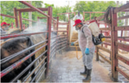
Ganaderos desinfectan animales en Hermosillo.

La entrevista exploró otros frentes de tensión que conforman la agenda de Trump, entre ellos su planteamiento de que Ucrania debe organizar elecciones pese a la continuidad de la guerra que se aproxima a su cuarto año.