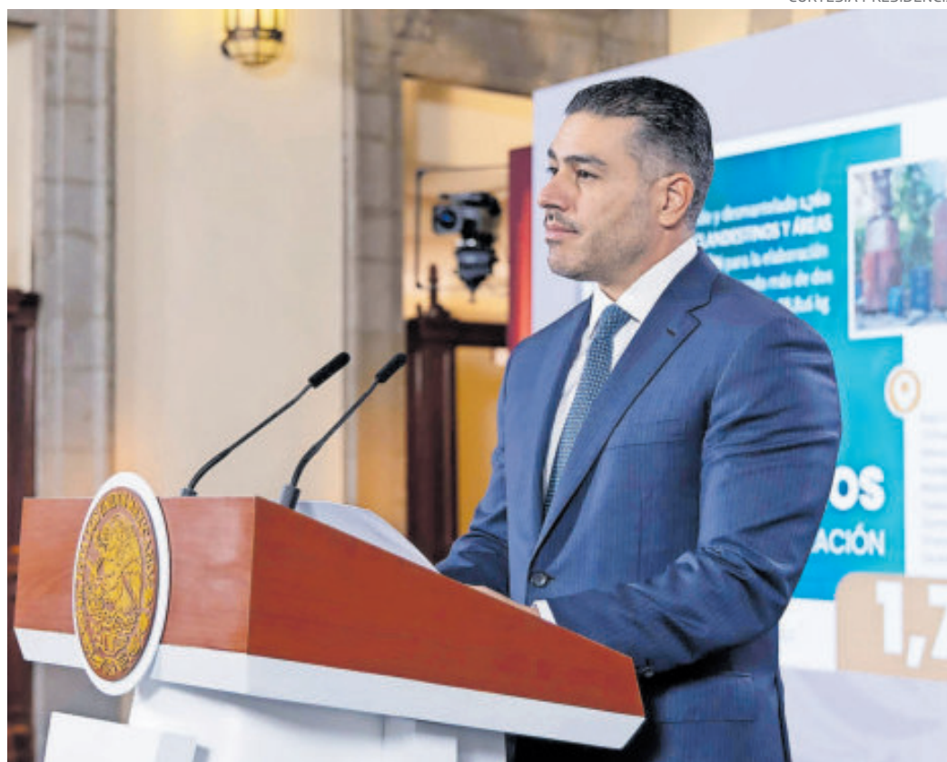
Omar García Harfuch, secretario de Seguridad y Protección Ciudadana.

Señaló que los artefactos explosivos improvisados operaron con alta inestabi-