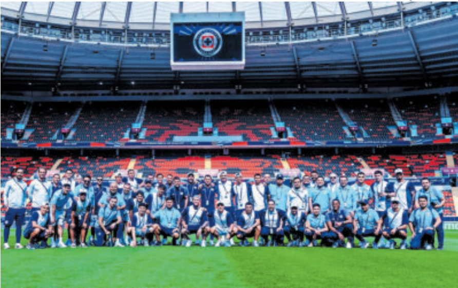
Los cementeros buscarán una victoria ante el Flamengo para resarcirse y no acabar este segundo semestre con las manos vacías, pero la misión es difícil.

Luego de lo sucedido en el partido de vuelta ante Tigres por las semifinales del Apertura 2025, en la que el estratega de los celestes quiso inventar al no poner de inicio a uno de sus mejores hombres, José