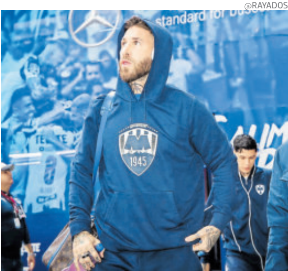
Ramos fue capitán desde que llegó al equipo.

A través de un extenso mensaje publicado en su cuenta de Instagram, el zaguero español Sergio Ramos se despidió de los Rayados del Monterrey y de la afición con palabras de agradecimiento y orgullo por haber vestido la playera albiazul. “Decir adiós nunca es fácil. Termina una etapa que arrancó llena de ilusión en febrero y que me ha permitido descubrir un país, una ciudad, un fútbol... y que me deja muchas experiencias nuevas y, sobre todo, muchos amigos”, escribió el central. El capitán durante gran parte de su estancia en el equipo norteno destacó su compromiso tanto dentro como fuera del terreno de juego: “Lo he dejado todo en la cancha y fuera de ella para poder dar mi mejor rendimiento. 34 partidos, más de 3 mil minutos, ocho goles y tantas emociones que no se pueden describir en cifras”.