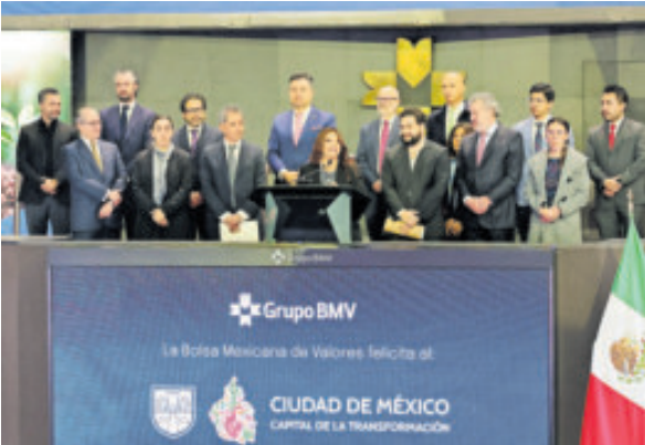
Momentos de la emisión del bono en la Bolsa Mexicana de Valores.