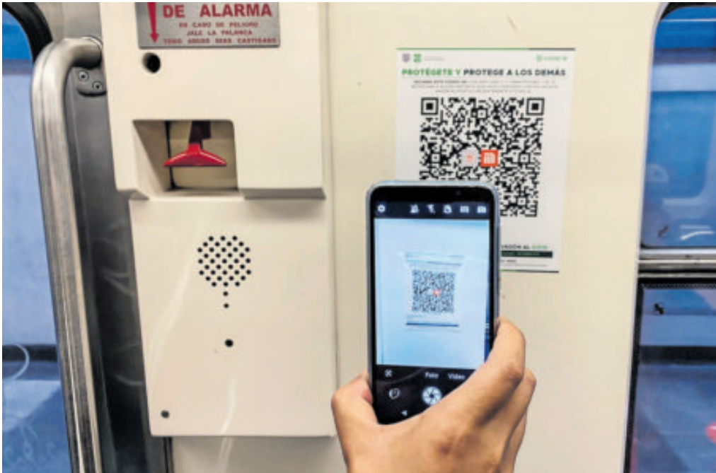
Se actualiza para orientar a visitantes y mejorar traslados en 2026.