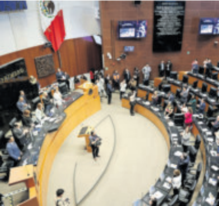
Senadores, ayer, en sesión.

a votación. Señaló que, por esa razón, el asunto no será abordado en las sesiones restantes del periodo actual.