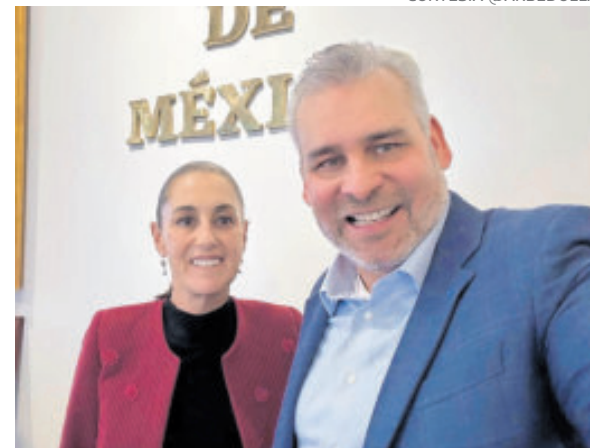
La Presidenta y Alfredo Ramírez Bedolla, ayer.

A la reunión se sumaron el secretario de Comunicaciones, Jesús Esteva, y el director del Instituto de Seguridad y Servicios Sociales de los Trabajadores del Estado (ISSSTE), Martí Batres, quienes participaron en la revisión de infraestructura estratégica, movilidad de personal federal y condiciones de despliegue en zonas donde se requieren ajustes logísticos para sostener operaciones.