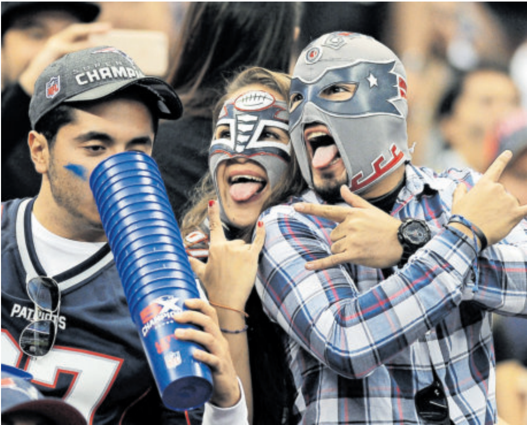
Hay un sector de fans que no les gustó que el Azteca cerrara sus puertas por el Mundial.