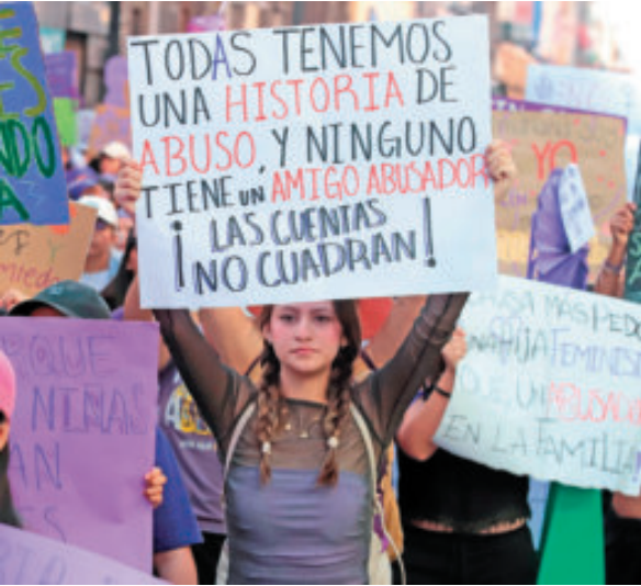
En México hay 4 casos de abuso sexual cada hora.

Violencia física, psicológica o verbal, la participación de varias personas o cuando existe una relación de autoridad agrava los castigos.