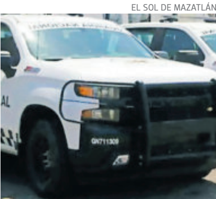
Son siete cuerpos hallados en al zona.

peritos de la Fiscalía General del Estado acudieron al lugar para realizar los peritajes correspondientes. UN MUERTO Y TRES HERIDOS Por otro lado, en la capital Culiacán, un enfrentamiento armado entre dos grupos antagónicos se registró ayer en la tarde en el cruce del bulevar Constelaciones y bulevar Santa Fe, dejando un hombre muerto y tres personas lesionadas. Según elementos de la Secretaría de Seguridad Pública, los atacantes sorprendieron a cuatro jóvenes que viajaban en una Mazda CX3 color tinto y abrieron fuego con fusiles de asalto. El conductor intentó escapar, pero el vehículo se impactó contra un árbol del camellón, quedando con daños en los neumáticos y múltiples impactos en la carrocería.