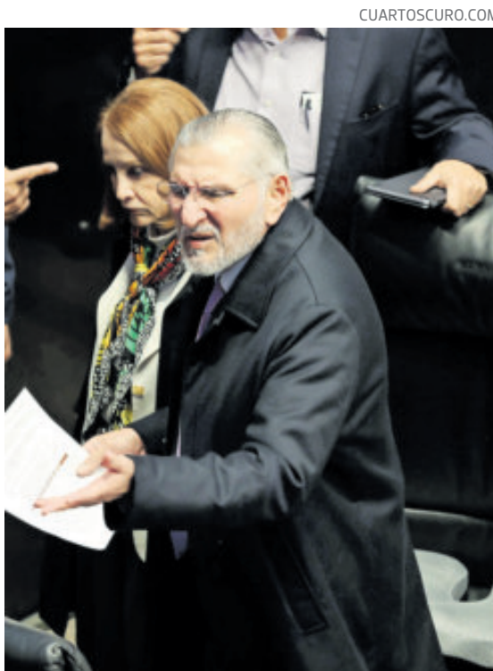
Adán Augusto López, ayer, en la sesión.

Asimismo, reafirmó que la explosión no constituye una afrenta al gobierno.