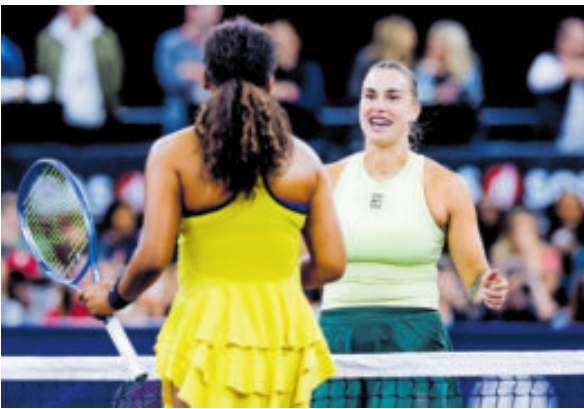
Las tenistas se vieron sorprendidas y suspendieron su partido para permitir al fan que bajara.

El público, en su mayoría, respondió con abucheos al improvisado tenista, que