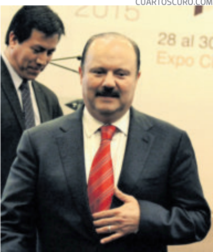
César Duarte está en el Altiplano.

gresó al penal de máxima seguridad cerca de las 23:00 horas y sostuvo que la orden de aprehensión no fue reciente, sino un mandato judicial pendiente que la fiscalía ejecutó tras retornar a territorio mexicano. La presidenta Claudia Sheinbaum puntualizó que la extradición se concretó después de resolver condicionantes impuestas por tribunales de Estados Unidos y afirmó que la FGR ya había informado públicamente sobre la existencia de la orden que sustentó la captura. Añadió que el Sistema Penitenciario