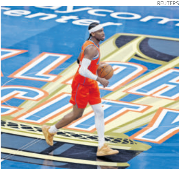
OKC ya está instalado en las semifinales de la Copa.

Prácticamente invencibles desde que ganaron su primer anillo, los Thunder se tomaron esta eliminatoria de NBA Cup como el escenario ideal para mandar un mensaje intimidante: su reinado no está en discusión.