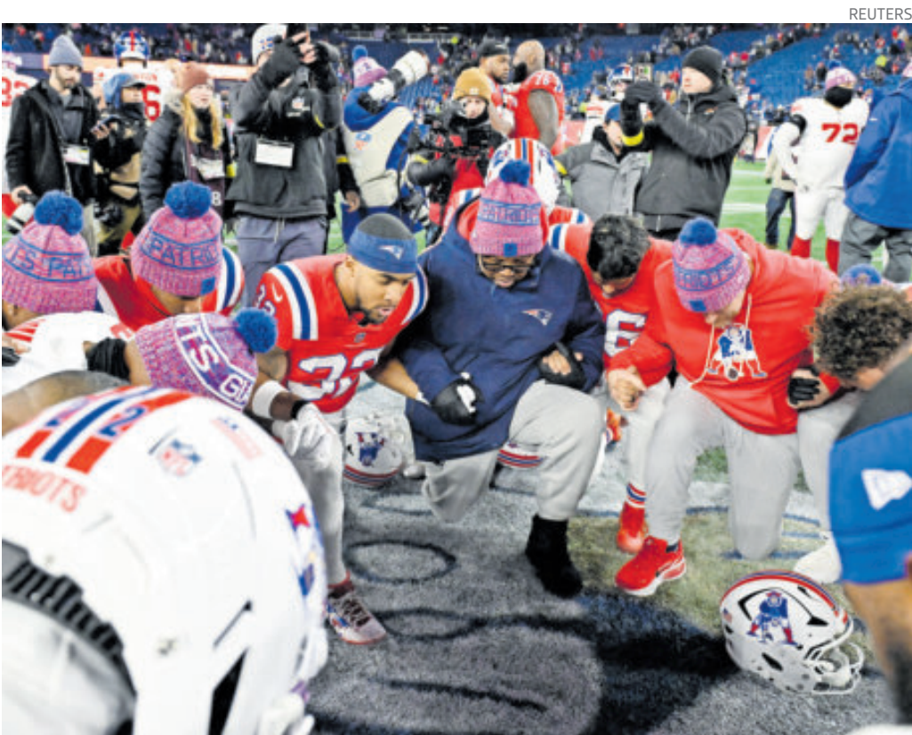
Los Patriots podrían conseguir el título divisional este fin de semana si vencen a Bills.