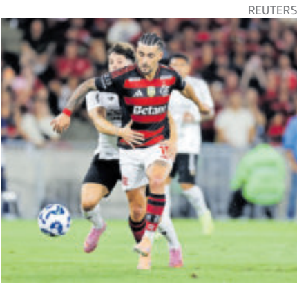
Giorgian de Arrascaeta. Es el favorito para llevarse el premio, junto a Messi.