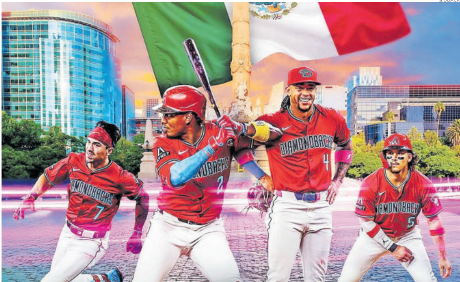
Los Arizona Diamondbacks serían locales en la casa de los Diablos Rojos del México.