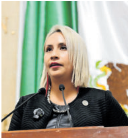
Diputada Ana Buendía pide atiendan salud mental de jóvenes.