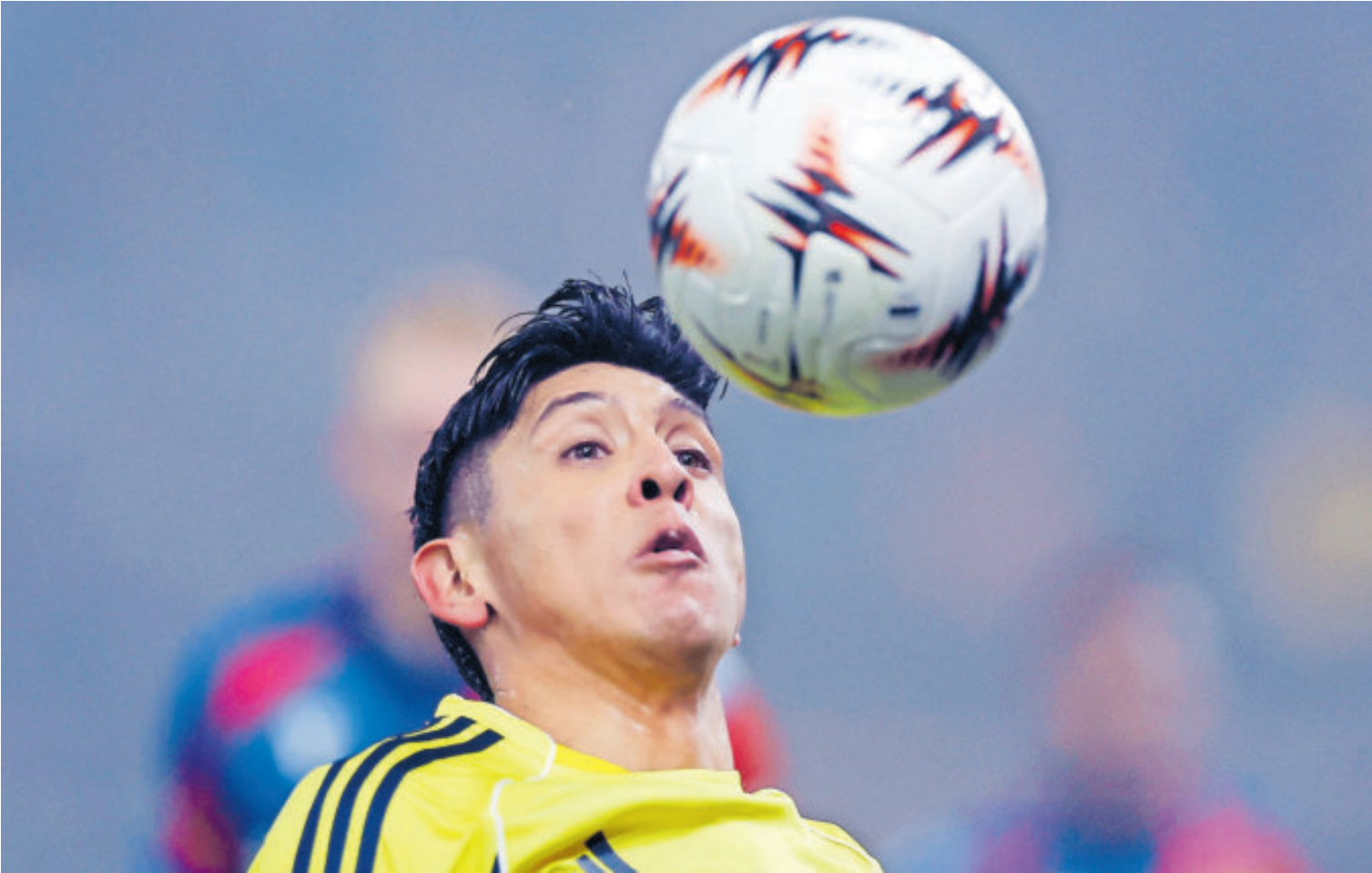
Édson Álvarez. Fenerbahce está obligado a sumar de tres para tratar de escalar posiciones o al menos seguir en zona de calificación.