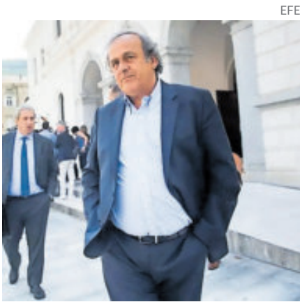
Michel Platini arregla cuentas contra tres exdirigentes de la FIFA.

Los títulos y las grandes actuaciones tanto de ellos como de otros futbolistas que defienden a equipos de la región fueron recordados por el periódico local El País, encargado de organizar cada año la tradicional encuesta ‘América le responde a El País’. De acuerdo con esto, apuntó en una nota que Flamengo saca “cierta ventaja” por ganar la Copa Libertadores.