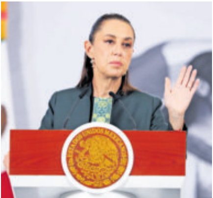
La presidenta Claudia Sheinbaum, ayer, en su conferencia.

México sostuvo que la conversación con Estados Unidos continúa abierta y que cualquier acuerdo deberá respetar la soberanía nacional. El tono de la respuesta apuntó a contener la presión sin romper el canal diplomático.