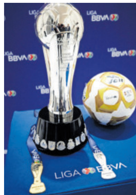
El trofeo y las medallas que están en disputa a partir de esta noche.