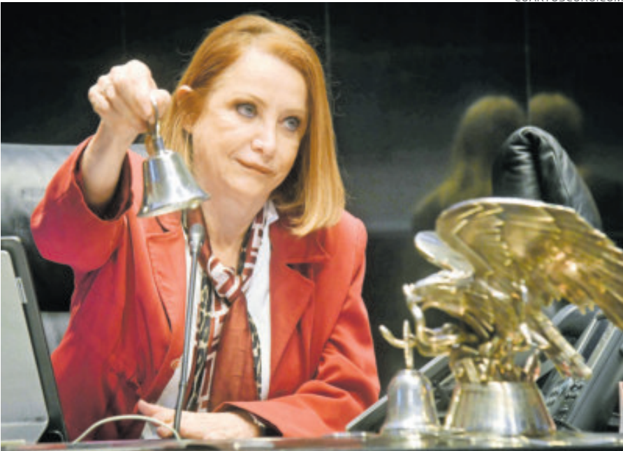
Laura Itzel Castillo, presidenta del Senado, estará en la Permanente.