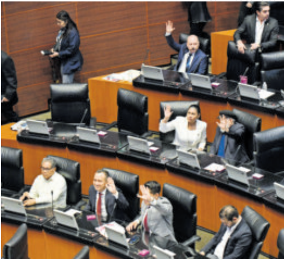
Legisladores, ayer, durante la votación.

La nueva ley crea el Sistema Nacional de Economía Circular, por lo que los tres órdenes de gobierno coordinarán acciones, programas y políticas, y será la Secretaría de Medio Ambiente y Recursos Naturales la responsable de elaborar el Programa Nacional de Economía Circular, que tendrá carácter obligatorio.