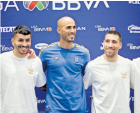
El Conde estuvo en el Día de Medios de Tigres, acompañado por algunos de sus jugadores.