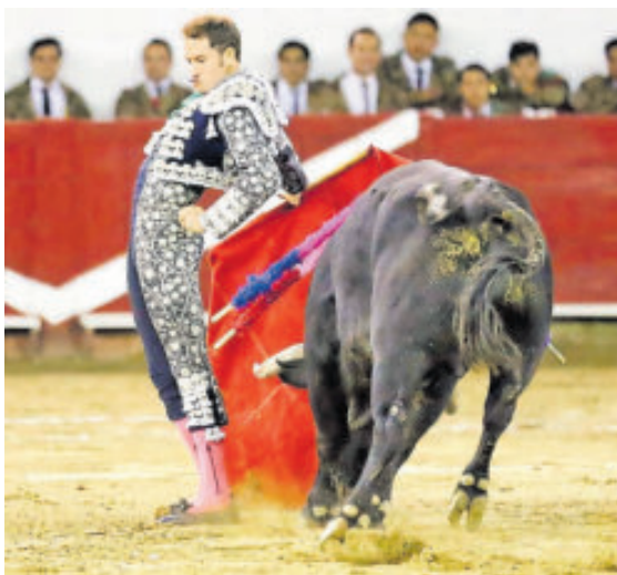
El mexicano pudo salvar su actuación.