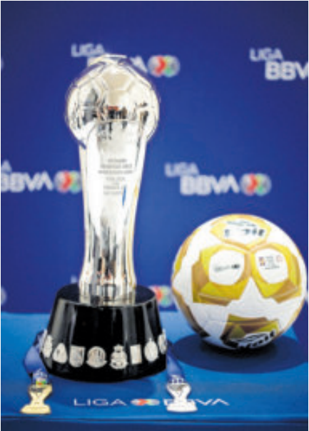
El preciado trofeo que estará en disputa a partir de este jueves.