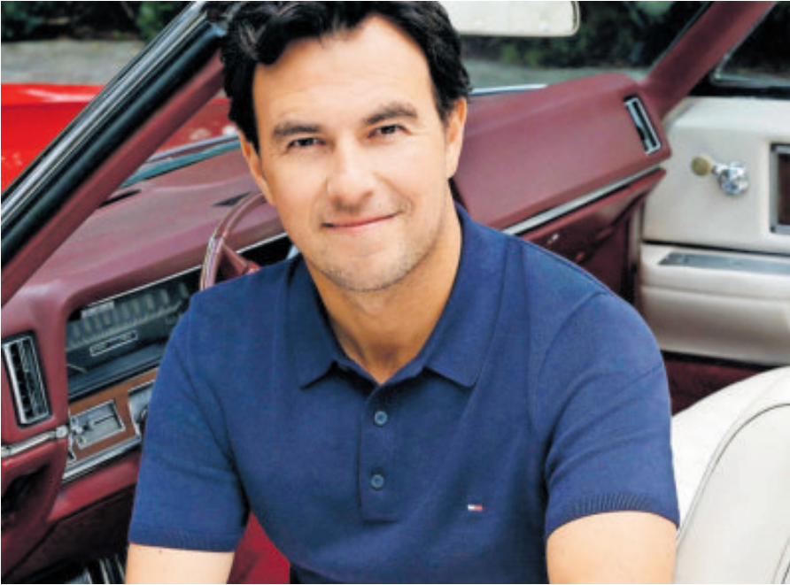
El tapatío ya posó con ropa de dicha marca para empezar la promoción.

“Tommy llevó estilo al paddock y les dio a los pilotos la confianza para mostrar quiénes son fuera de la pista. Él siempre