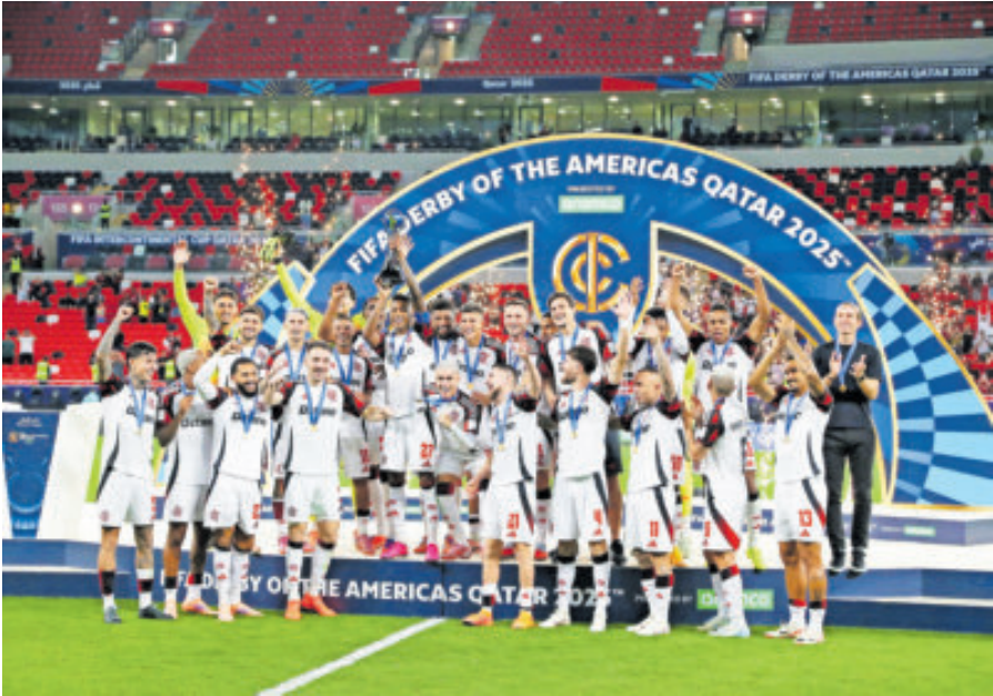
Flamengo fue justo ganador, porque cuando pisó el acelerador fue dominador y supo capitalizar las fallas del adversario para ganar el Derbi de las Américas.