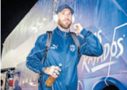
Sergio Ramos. Es claro que por algo ya no quiso renovar con los Rayados.

Y Alan Pulido también se iría, aunque Chivas tendría que pagar parte de su alto sueldo al equipo donde vaya. Pero con los demás, quiere hacer caja el Rebaño.