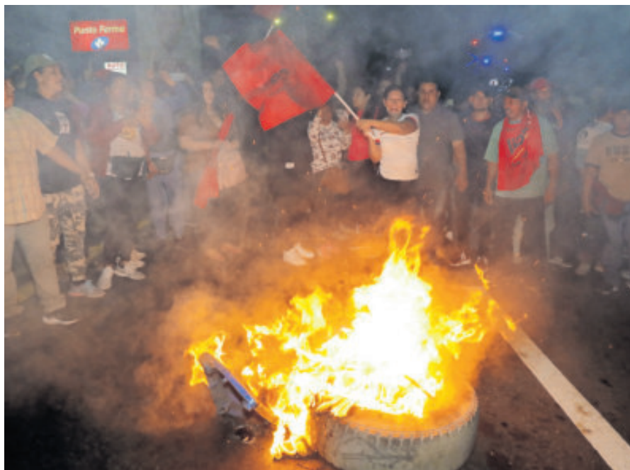
Simpatizantes del partido gobernante Libre denunciaron vicios en el conteo.

Cientos de manifestantes ataviados con el color rojo de LIBRE protestaron ayer cerrando un puente que une Tegucigalpa con la vecina