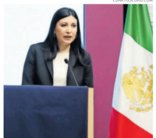
La gobernadora de Banxico, Victoria Rodríguez.

“No representa de ninguna manera un fenómeno generalizado. En conjunto estas instituciones tienen una baja participación dentro del sistema financiero y esto no constituye un riesgo para la estabilidad del sistema. A la fecha no hemos visto tampoco señales de contagio hacia otras instituciones y tampoco hay evidencia que nos muestre que hay o existan procedimientos adicionales de la misma naturaleza que se estén dando contra otras instituciones financieras de nuestro país. El sistema financiero sigue mostrando condiciones sólidas”.