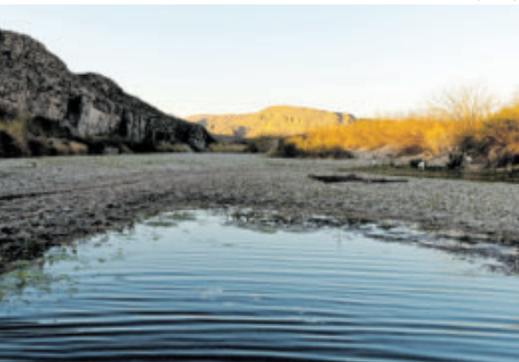
Paso del río Bravo, entre México y Estados Unidos, a la altura de Texas.

La Casa Blanca trata de “romper” el Tratado de Aguas entre México y Estados Unidos suscrito en 1944, para lo que recurre a la amenaza de imponer 5 por ciento de aranceles por los 986.4 millones de metros cúbicos que, según Trump, le debe el país vecino por la deuda acumulada de los últimos cinco años, indicó.