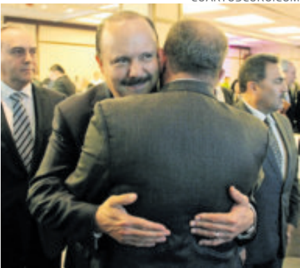
César Duarte, exgobernador priista de Chihuahua.

Por otra parte, César Duarte, a través de su representación legal, solicitó la duplicidad del término constitucional para que se defina su situación jurídica, por lo que la audiencia quedó agendada para el sábado 13 de diciembre.