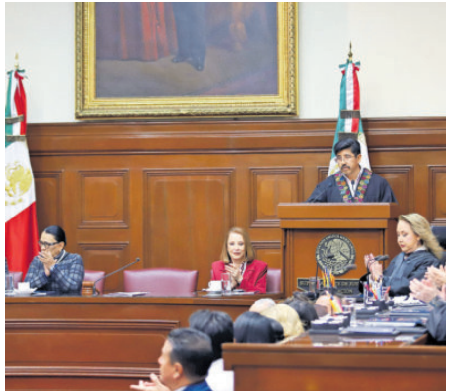
El ministro presidente de la Suprema Corte, Hugo Aguilar, ayer, en el pleno.

Ante integrantes del Tribunal Electoral del Poder Judicial de la Federación, con excepción de la magistrada Mónica Soto, jueces, magistrados e invitados especiales,