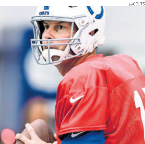
El veterano sabe que será una duro partido.

Pero el caos más hermoso reside en la NFC Oeste. Los Rams (10-3), Seahawks (10-3) y Niners (9-4) ocupan puestos de playoffs, y quedan dos duelos directos de alto voltaje, con los Rams en Seattle en la Semana 16, y Seahawks en San Francisco en la 18.