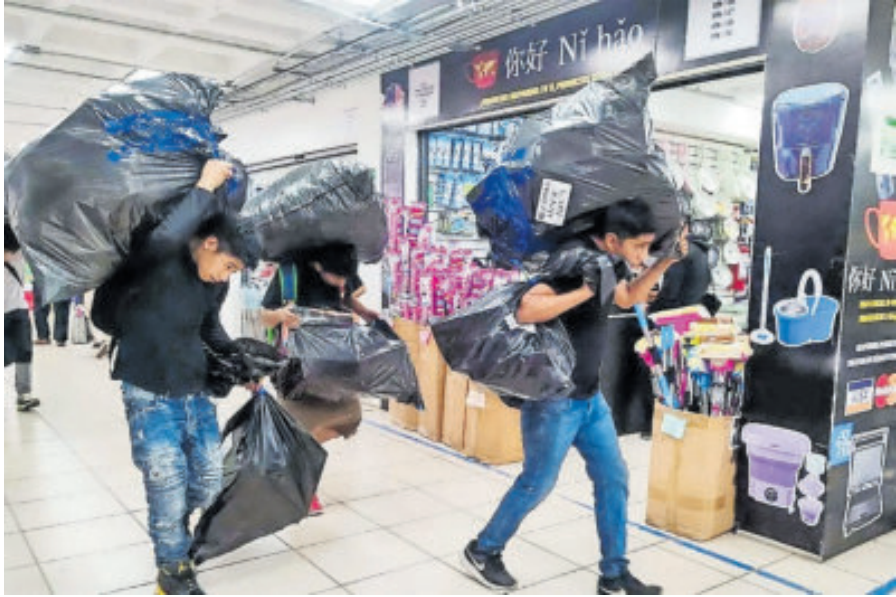
Los ajustes arancelarios forman parte del Plan México.

SON LOS aranceles que se impondrán a los artículos de países con los que México no mantiene un convenio comercial.