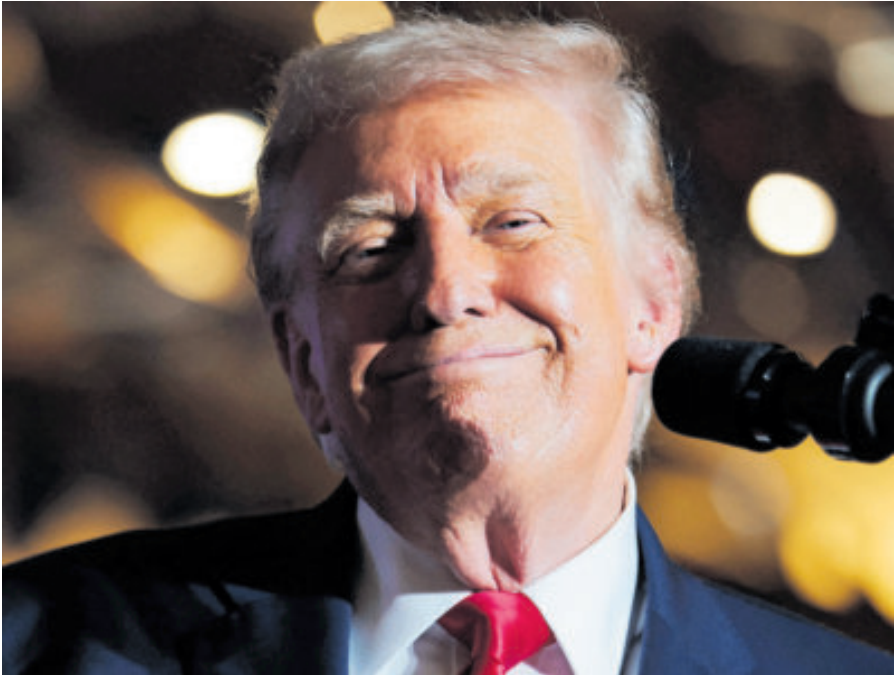
El presidente de Estados Unidos, Donald Trump, durante una gira por Pensilvania.

El mandatario insistió en que México incumplió el Tratado de Aguas de 1944 y condicionó cualquier avance bilateral a la entrega puntual de los volúmenes comprometidos. Según su postura, México arrastró rezagos que rebasaron los 986 millones de metros cúbicos acumulados en cinco años, lo que impactó a agricultores y ganaderos de su país.