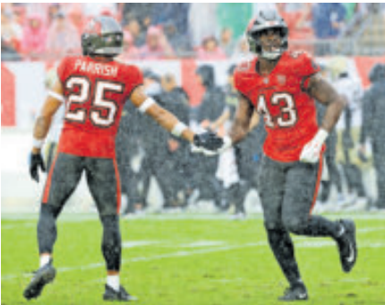
Tampa Bay tiene marca de 7-6.