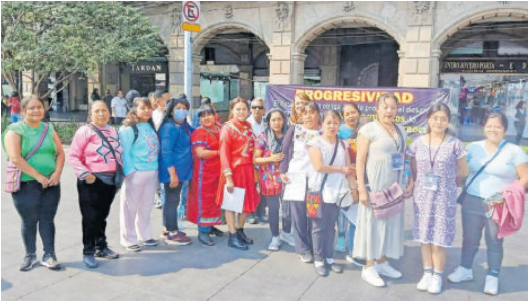
Artesanos buscan que les den un lugar digno de venta de mercancías.