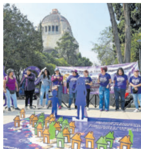
Dan a conocer casos de violencia y buscan que les den seguimiento.