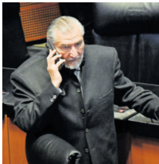
Adán Augusto López, presidente de la Jucopo en el Senado, ayer.

postura definitiva por parte de las bancadas respecto del alcance de la reforma electoral, recordó que algunos legisladores han manifestado que no habría cambios, pero precisó que él no ha escuchado una posición concluyente del Partido del Trabajo o del Partido Verde. Sostuvo que el Senado continúa trabajando conforme al calendario y que se mantiene la expectativa de recibir la iniciativa en las fechas anunciadas.