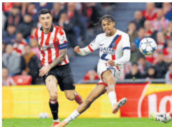
Athletic de Bilbao amargó al PSG con un empate.

Resultados: Qarabag 2-4 Ajax; Villarreal 2-3 Copenhague; Athletic 0-0 PSG; Bayer Leverkusen 2-2 Newcastle; Benfica 2-0 Napoli; Club Brugge 0-3 Arsenal; Dortmund 2-2 Bodo/Glimt; Juventus 2-0 Pafos; Real Madrid 1-2 Manchester City.