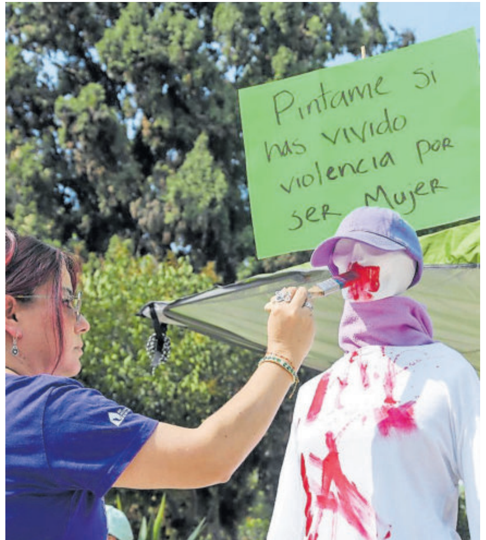
Activistas alzaron la voz para exigir apoyo de las autoridades.