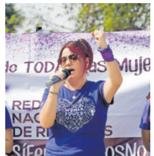
Los abusos deben darse a conocer en busca de crear conciencia.