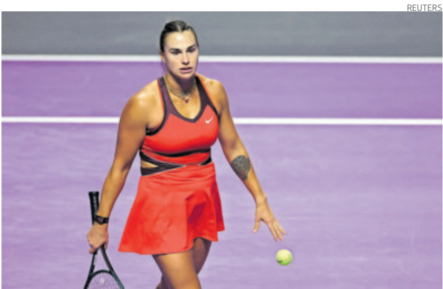
Aryna enfrentará a Kyrgios en una nueva versión de La Batalla de los Sexos.