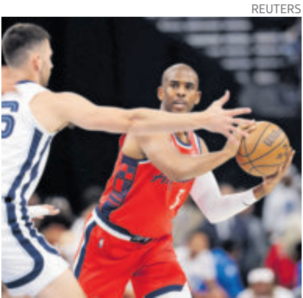
Chris Paul ahora está sin equipo.

“Ha habido un poco de locura en los últimos días, como mínimo”, reconoció