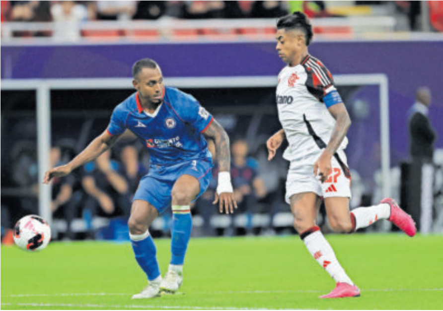
Los defensas de la Máquina cometieron fallas que ante un rival como el Mengao son imperdonables y vaya que las pagaron muy caro: le costó la eliminación.

“Entramos en una ventana de receso en la que obviamente hay un montón de aspectos a analizar en el rediseño del plantel, en la continuidad de algunos jugadores”, remató Larcamón, quien al menos en este primer semestre al frente del equipo quedó a deber, porque no ganaron nada bajo su tutela.