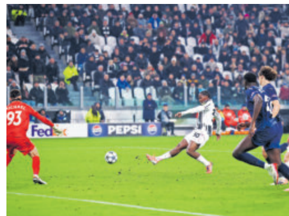
La Juventus ganó y mantiene la velita encendida.