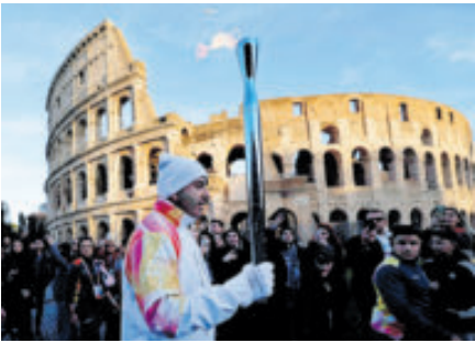
La antorcha olímpica recorre los lugares emblemáticos de Italia.