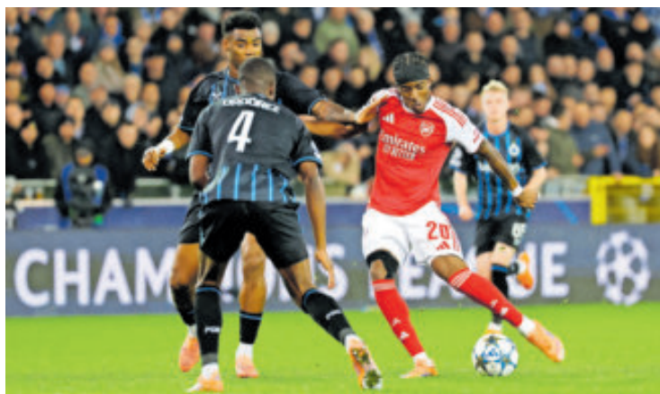
Arsenal se impuso al Brujas y virtualmente firmó su pasaporte.