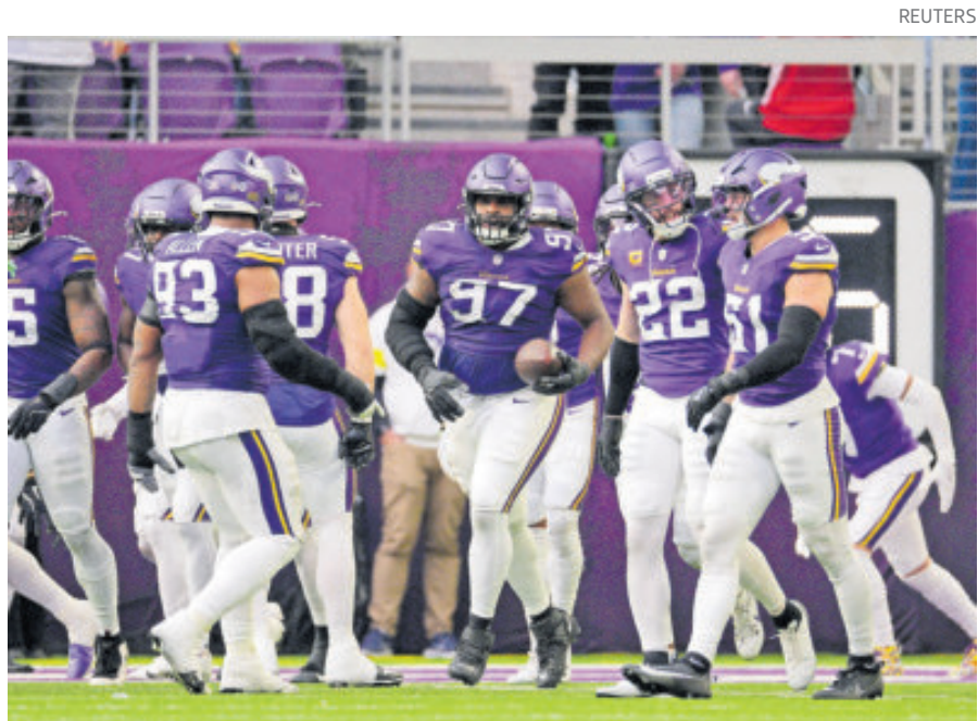
De perder, los Vikings podrían quedar eliminados de toda posibilidad.