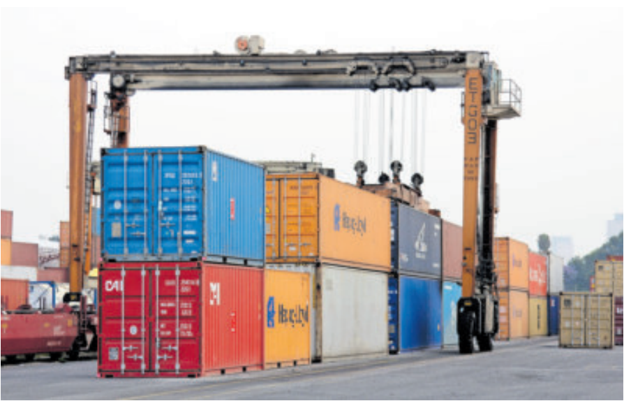
El incremento arancelario comenzará a aplicarse a partir del 1 de enero.