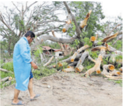
Daños causados por Erick en Oaxaca, en junio pasado.

En el Pacífico nororiental se contabilizaron ocho tormentas tropicales, siete huracanes de categoría 1 y 2, y tres huracanes mayores. Entre los eventos registrados se encuentra el ci-