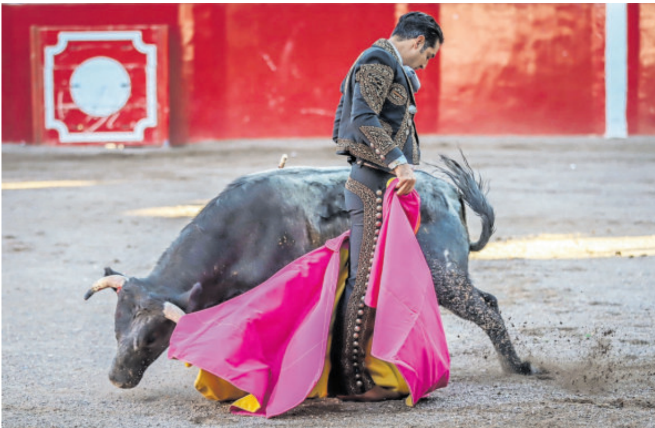
La corrida tiene un carácter de defensa de la tauromaquia.