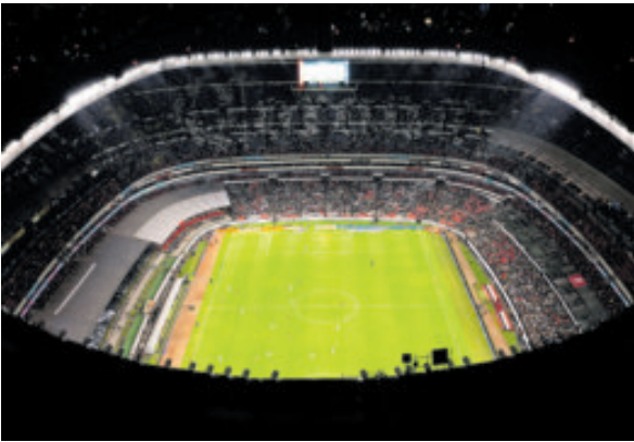
Habrà lleno total para la reapertura del estadio Azteca con el México ante CR7 y los portugueses.

dejaron sus testimonios de que el sistema jamás funcionó adecuadamente. Ante las constantes críticas, Fanki optó de nuevo por bloquear todas las respuestas a sus posts en redes sociales, en un intento por controlar los malos comentarios y que el nombre de la empresa se vea más manchado, aunque ya quedó muy mal parada en nuestro país. “Boletos agotados. Miles de aficionados ya tienen su boleto asegurado para México vs. Portugal. Gracias por su confianza”, escribió la boletera, sin posibilidad de replicar de los aficionados. Si bien Fanki bloqueó los comentarios