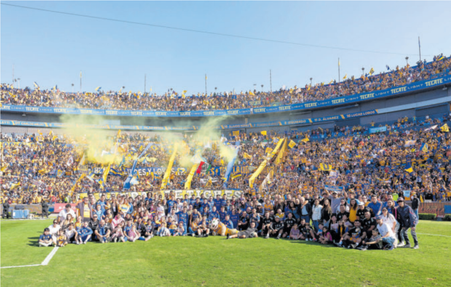
El fervor por los Tigres de la UANL en Nuevo León es impresionante y así quedó demostrado con el estadio lleno para ver la práctica.