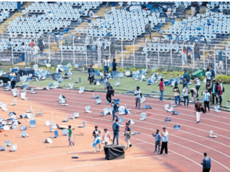
Al parecer, el astro argentino se fue del lugar al sentirse inseguro.

130 DÓLARES habría pagado un aficionado por entrar al evento y ver a Messi en la India.