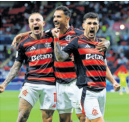
Se impusieron 2-0 al Pyramids.