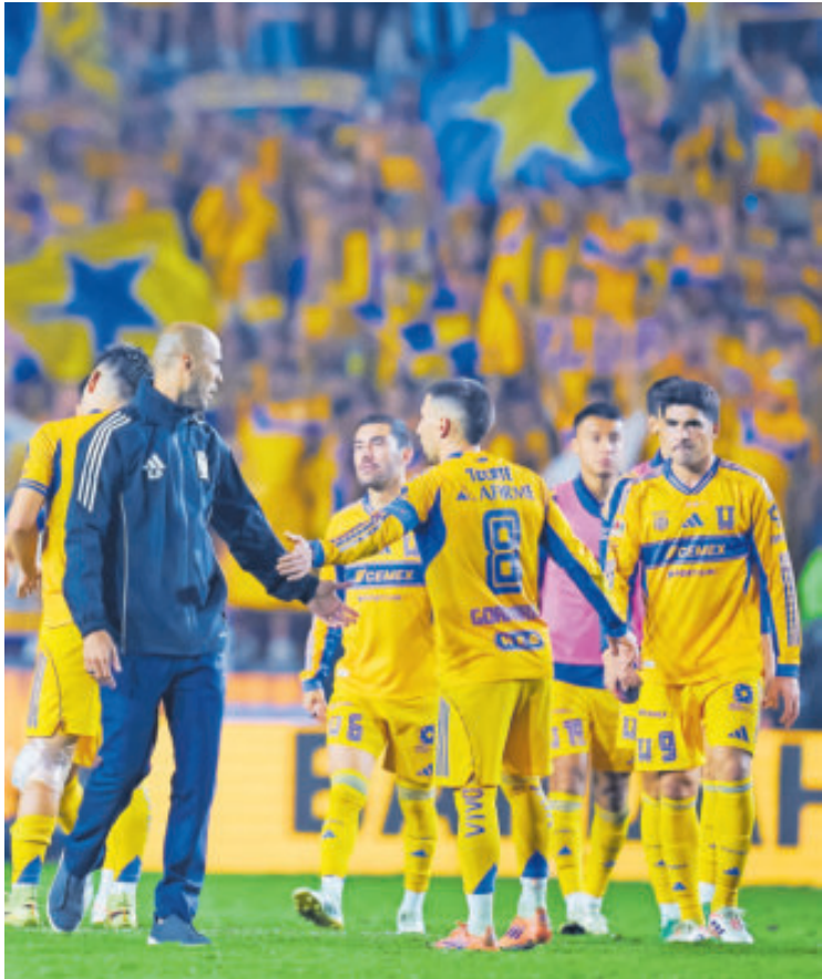
Tigres vencieron al Toluca en el torneo regular, en la J3.

3 SI GANA Tigres empatará a Cruz Azul con nueve títulos, algo que sin duda lo encumbraría aún más en la historia contemporánea de nuestro balompié.