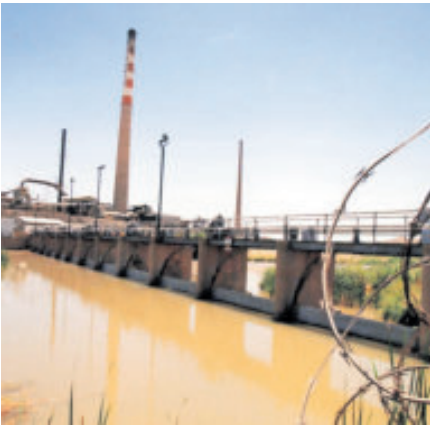
El agua del río Bravo alimenta a ambos lados de la frontera.