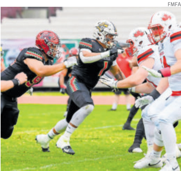
Los mexicanos no se achicaron y jugaron al límite.

De esta forma, México frenó la racha positiva de Canadá, que venía de lograr dos triunfos consecutivos.