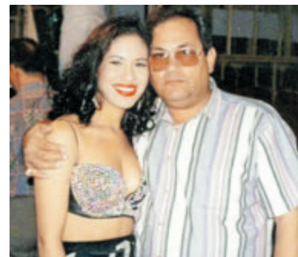
Fue el padre y manager de Selena.