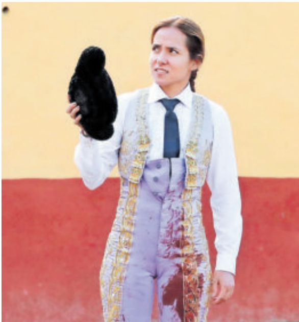
Se lesionó en la corrida de Tlaxcala.