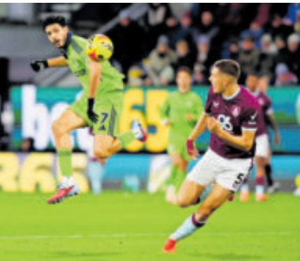
El mexicano se fue en blanco.

Flamengo, campeón de la Copa Libertadores y del torneo Brasileirão, avanzó a la final de la Copa Intercontinental tras derrotar 2-0 a Pyramids de Egipto en la Copa Challenger gracias a los goles de los zagueros Léo Pereira y Danilo, y una doble asistencia del uruguayo De Arrascaeta. En la final, el club brasileño enfrentará el miércoles al Paris Saint-Germain de Francia. “Todos los partidos son diferentes, nos vamos a enfrentar al mejor del mundo, pero nosotros, con humildad, intentaremos hacer historia”, dijo el director técnico Filipe Luis a la transmisión oficial.