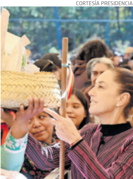
La presidenta Claudia Sheinbaum, ayer, en Chihuahua.

En ese contexto, durante el diálogo con las comunidades, autoridades tradicionales, mujeres y jóvenes expusieron la necesidad de mejorar la seguridad en la región,