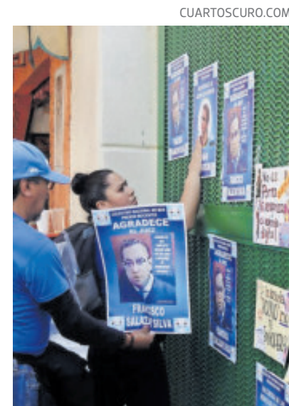
Mujeres, al protestar contra actos de violencia digital en el IPN.

De acuerdo con ONU Mujeres, el anonimato y el alcance de los espacios en línea han creado un marco propicio para el aumento de la violencia digital.