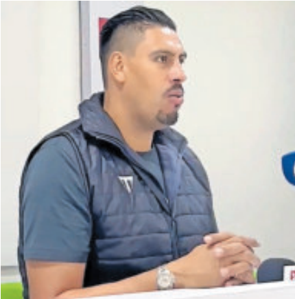
Participó en el Winter Camp.