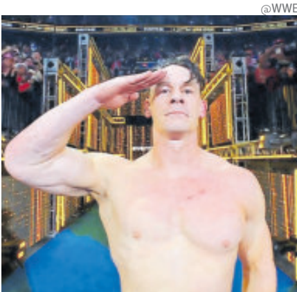
Cena es un gran ídolo mundial.

Pero el sueño se convirtió en una amarga pesadilla cuando Gunther, el General del Ring, arruinó la fiesta al forzar la rendición de John Felix Anthony Cena en un combate brutal, intenso y desgarrador, que puso a prueba los límites físicos de