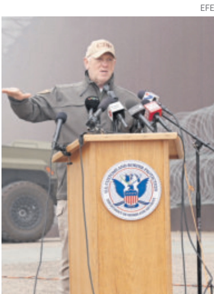
Tom Homan, el Zar de la frontera, ayer, en San Diego.

Homan criticó con dureza a las jurisdicciones con políticas diseñadas para proteger a las comunidades inmigrantes —conocidas como leyes santuario— que se niegan a cooperar con las autoridades fe-