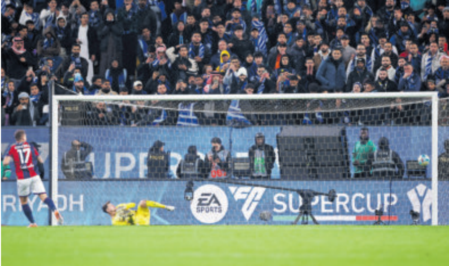
Bolonia dio la campanada al imponerse al Inter de Milán, que sufre un duro revés; ahora se medirá al Nápoles en busca del primer título de la temporada.

Bastoni llegó a la frontal del área con su gigante zancada y sacó un centro al segundo palo. Allí, como buen delantero con olfato, esperó Thuram. Su media volea superó a Ravaglia y puso contra las cuerdas al Bolonia, que además perdió a Bernardeschi en el minuto 40 por lesión.