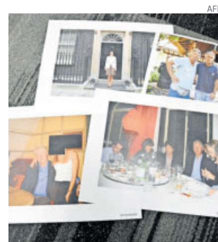
Varias personalidades aparecen en las fotografías.

EU acusa a Maduro de ser el jefe del Cártel de los Soles, organización vinculada a las fuerzas armadas venezolanas, para traficar con drogas.