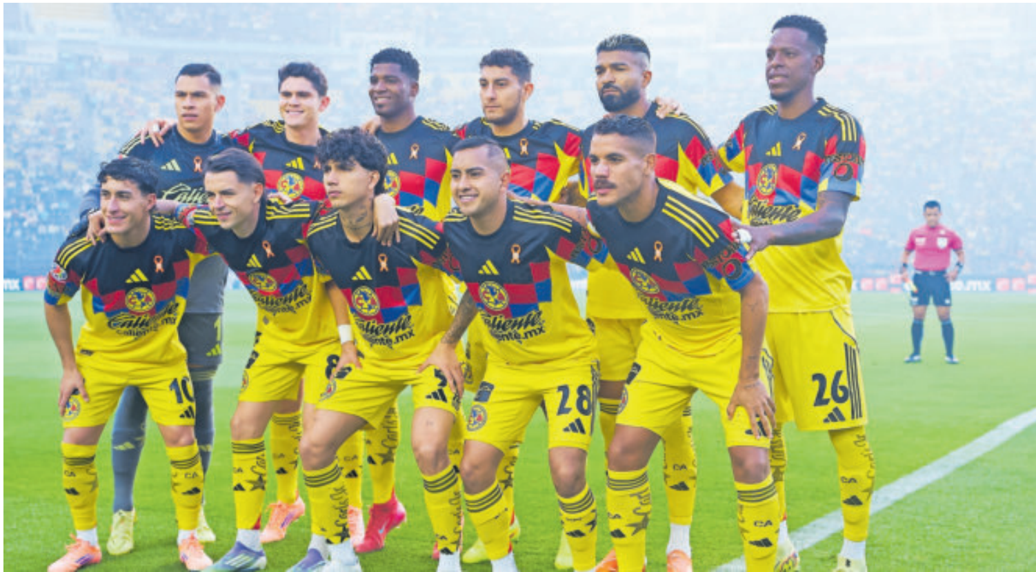
Las Águilas aparecen como el equipo de la Liga MX que más valor tienen en cuanto a las franquicia deportivas.