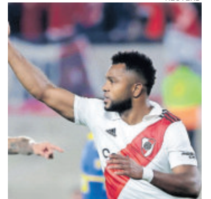
Miguel Borja. En Colombia dan por hecho que jugará con el Cruz Azul.