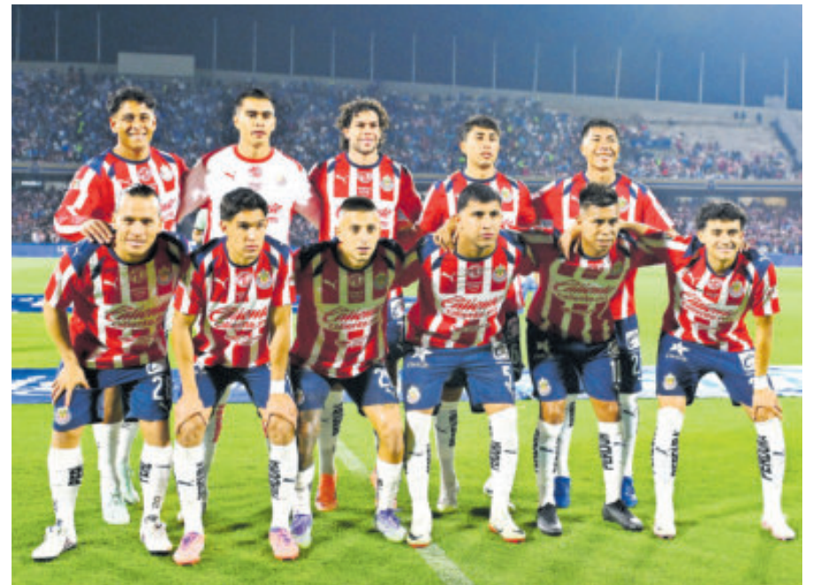
Chivas es el segundo representativo mexicano que aparece en la lista.

MLS, ARRIBA DE LA LIGA MX Sin embargo, aunque aparecen tanto América como Chivas en este listado, si se comparan con clubes de la MLS, los equipos estadounidenses rebasan a los mexicanos en valor e ingresos.