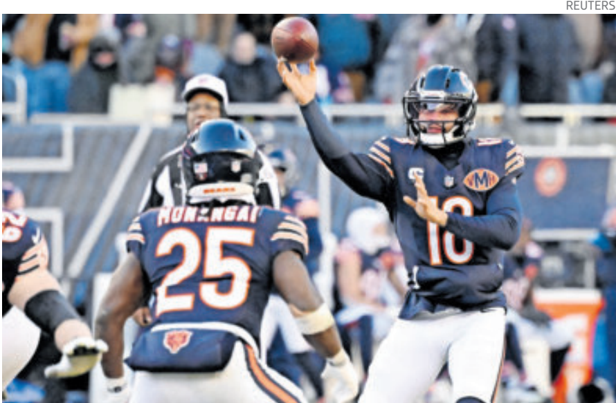
Los Bears tiene marca de 10-4.

Recién el vigente campeón del Super Bowl rompió una racha de tres derrotas consecutivas con una victoria convincente la semana pasada ante Las Vegas Raiders. Philly mostró señales de recuperación en su aparato ofensivo al acumular 387 yardas y 31 puntos. Con jugadores clave como Jalen Hurts, Saquon Barkley, A.J. Brown, DeVonta Smith y Dallas Goedert listos para actuar, la ofensiva de los Eagles espera festejar ante una defensa de Washington que se ubica en el puesto 31 en la liga, con rankings entre los cinco peores contra la carrera, el pase y en la zona roja. Para los Commanders, la temporada es un ejercicio de resistencia. Tras una campaña notable el año pasado, el equipo ha retrocedido dramáticamente, al perder ocho juegos seguidos antes de conseguir una victoria la semana pasada. Ahora juegan más por la mejor posición posible en el Draft que por los Playoffs. La situación se les complica aún más con la ausencia de su mariscal de campo titular, el novato Jayden Daniels, quien se perderá su octavo partido de la temporada y el resto del año debido a una lesión en el codo (no el de lanzar). Marcus Mariota tomará las riendas de la ofensiva nuevamente, privando a los aficionados de ver la esperada confrontación entre Daniels y la defensa de Philadelphia.