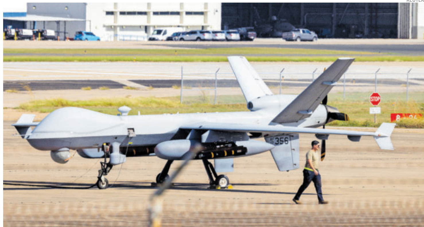
Drones de reconocimiento llegaron a Puerto Rico en medio de la crisis del Caribe.