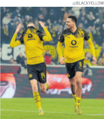
Dortmund obtiene valioso triunfo sobre el Borussia Monchengladbach.

La distancia pudo aumentar pero al Dortmund le faltó claridad en ataque, y desde el minuto 30 el Monchengladbach se estiró y empezó a hacer daño. Los de Kovak parecían más cansados de la cuenta. Dinámica que se prolongó tras el descanso y que dejó ver a un