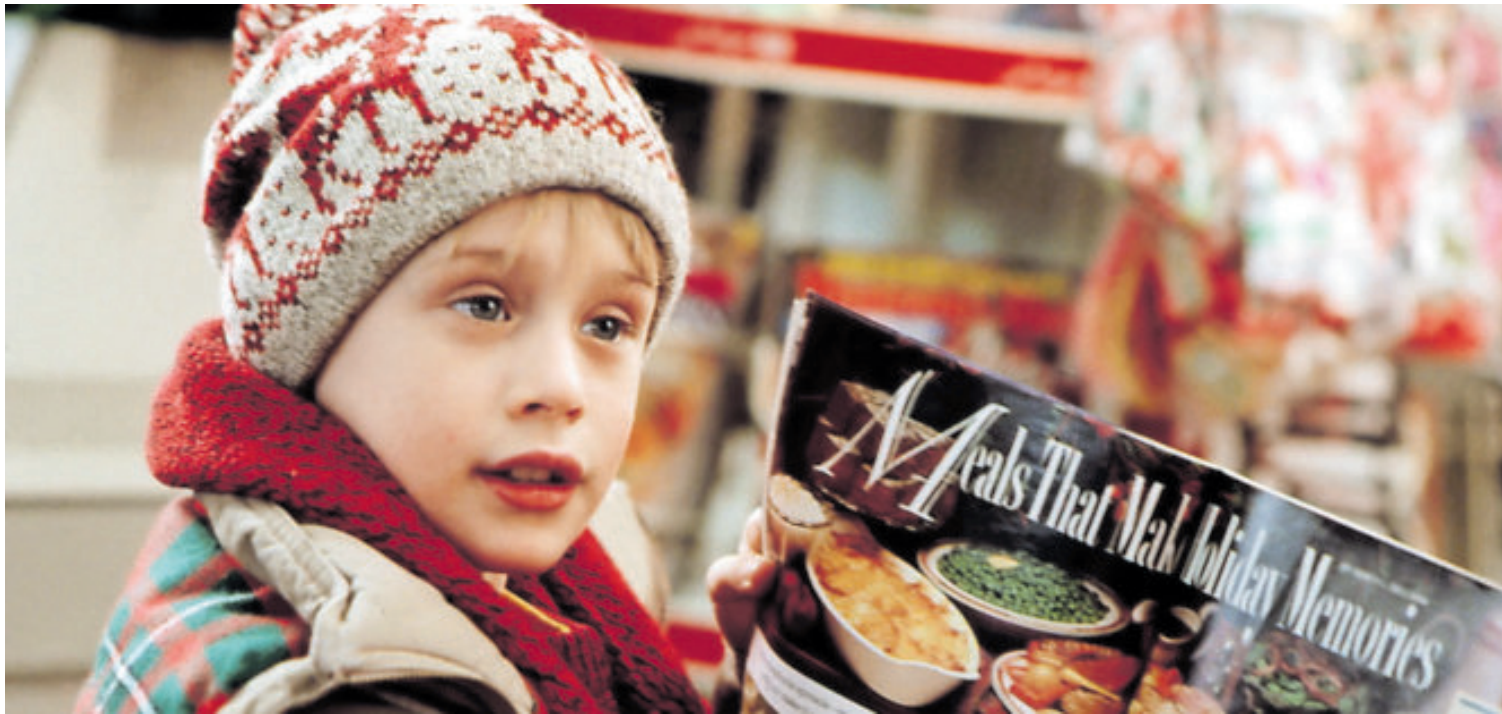
Macaulay Culkin protagonizó la película original y su secuela.