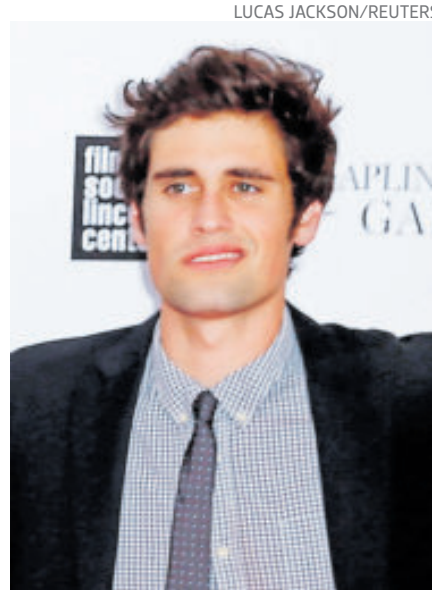
Podría enfrentar la pena de muerte.

El joven de 32 años compareció el pasado miércoles en una audiencia en