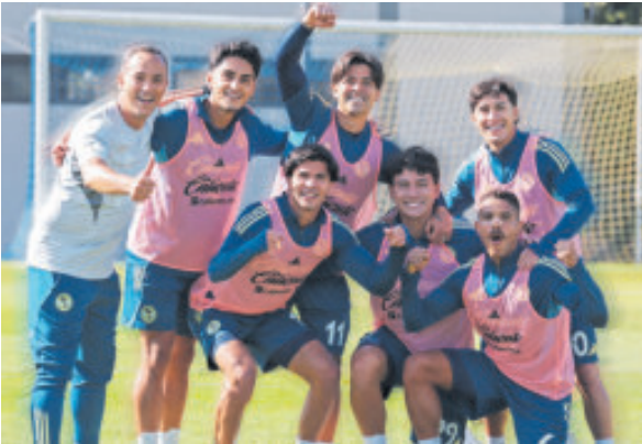
Las Águilas trabajan para hacer las incorporaciones que pide su entrenador, André Jardine.