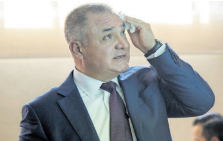
El exsecretario de Seguridad fue condenado por vínculos con el narco.