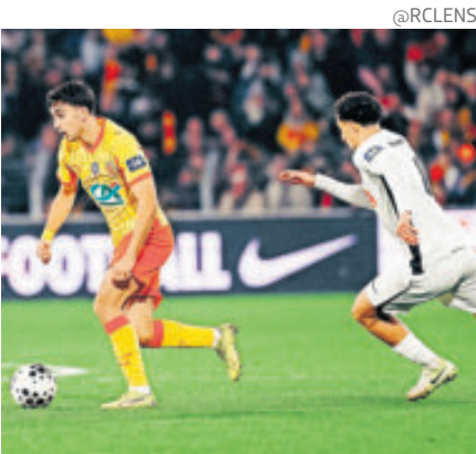
El Lens alarga su inspiración a la Copa; Brest, eliminado y Angers se salva.