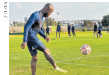
El artillero ecuatoriano espera mejorar su cuota goleadora el siguiente torneo.

La prensa turca asegura que todo se produce en medio de una lucha interna de poder dentro del gobierno islamista.