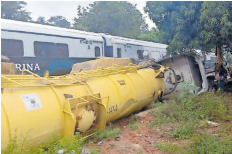
El tráiler quedó totalmente volcado a lado de las vías.