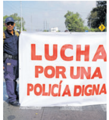
Protesta de policías, en Michoacán.