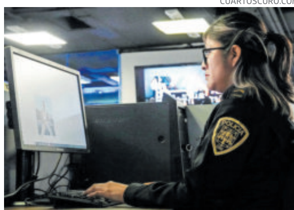
La Policía Cibernética mantiene un protocolo de atención.

Recomendó comprobar que los sitios de compra sean oficiales, cuenten con protocolos de seguridad y direcciones