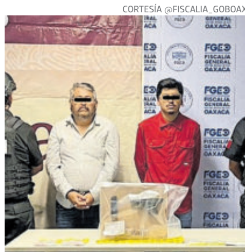
Fueron detenidos en Oaxaca.

También apuntó que, en la llamada Operación Sable, los elementos de seguridad arrestaron a una tercera persona.