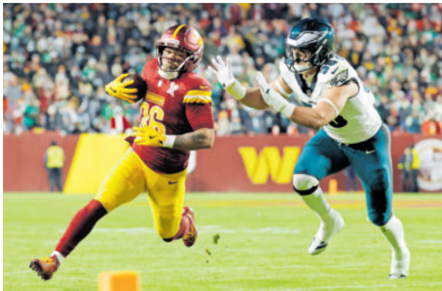
Los Commanders se quedaron sin posibilidades de clasificar a los Playoffs.