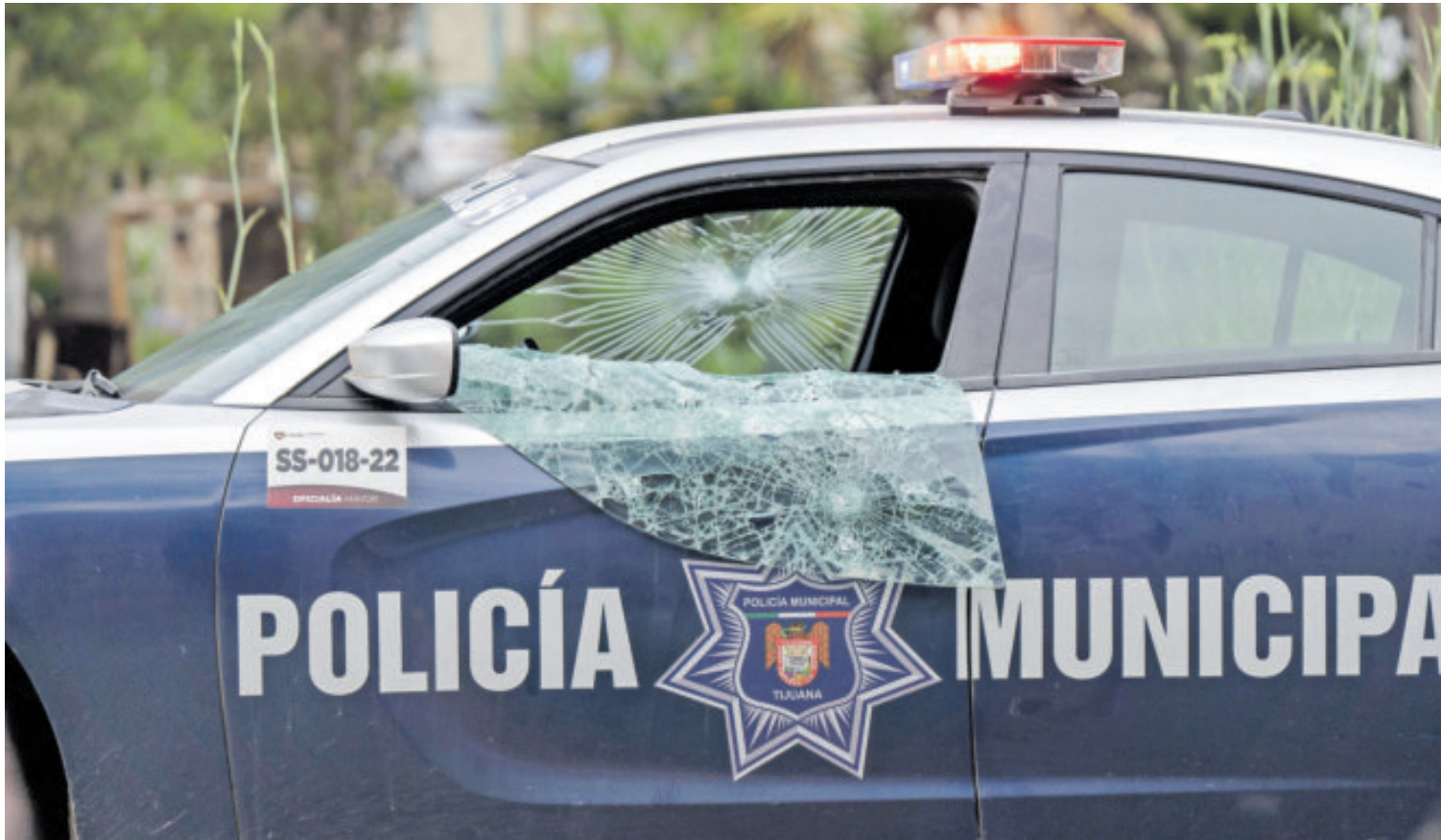
Una patrulla de la policía municipal de Tijuana, en junio del año pasado.