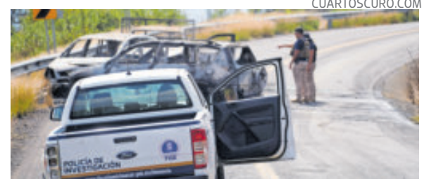
Autos calcinados en una carretera de Michoacán.

Las entidades con dichas evaluaciones negativas son Baja California, Sinaloa, Morelos, Guanajuato, Quintana Roo, Colima, Tabasco, Sonora, Baja California Sur, Chihuahua, Michoacán y Zacatecas.