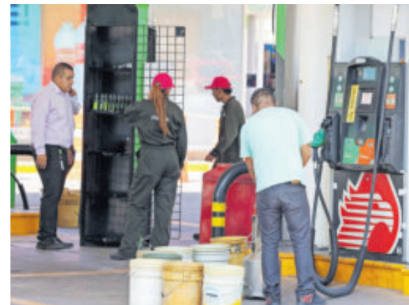
En el operativo verificaron 230 gasolineras.

Dentro de los casos más graves que se detectaron están el que en algunas estaciones de servicio no despachaban litros completos de combustible.