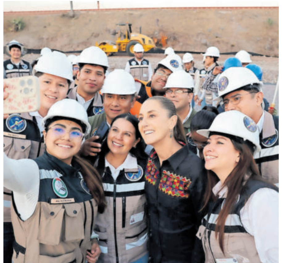
La presidenta Claudia Sheinbaum, ayer, al tomarse una selfie.

Sheinbaum Pardo afirmó que su gobierno impulsa la construcción de preparatorias cercanas a los hogares, la reconversión de secundarias que ya no cuentan con turno vespertino en planteles de Edu-