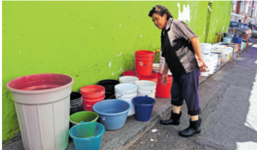
Ante escasez de agua, el instituto pide reformas que garanticen disponibilidad.

El análisis precisa que 11.53 por ciento de los recursos hídricos renovables de México provienen de fuera de sus fronteras, lo que evidencia la relevancia de los flujos transfronterizos en el balance hídrico nacional.