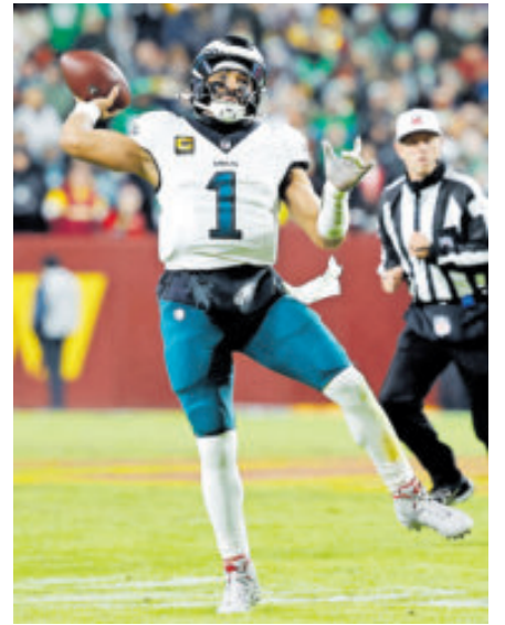
Campeón listo para defender el cetro.

Las Águilas son bicampeonas de su división y están más que listas para tratar de refrendar su título en la NFL.