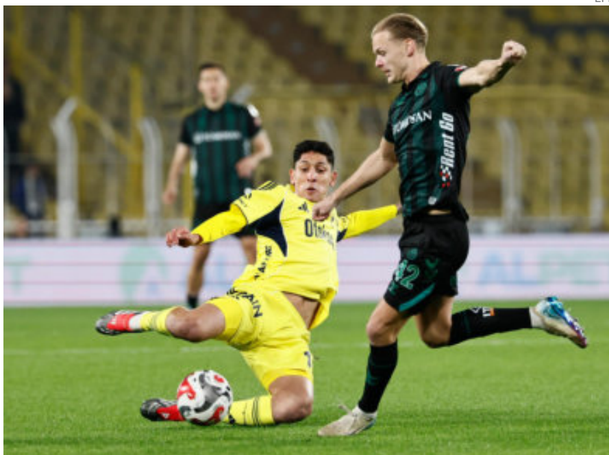
Las lesiones continúan dándoles dolores de cabeza a los jugadores mexicanos.

Claro, siempre y cuando, el mediocampista mexicano no tenga algún tipo de complicación, luego de que durante este