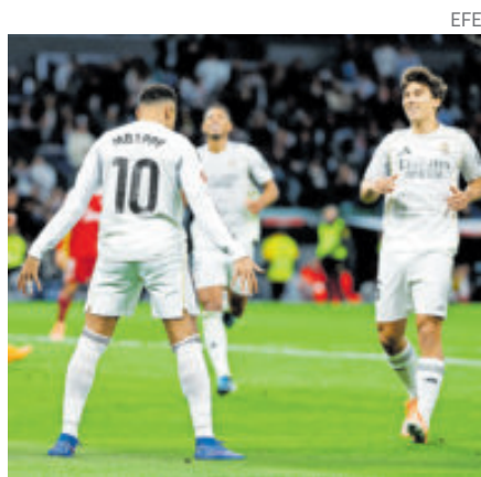
El francés celebró como su ídolo.