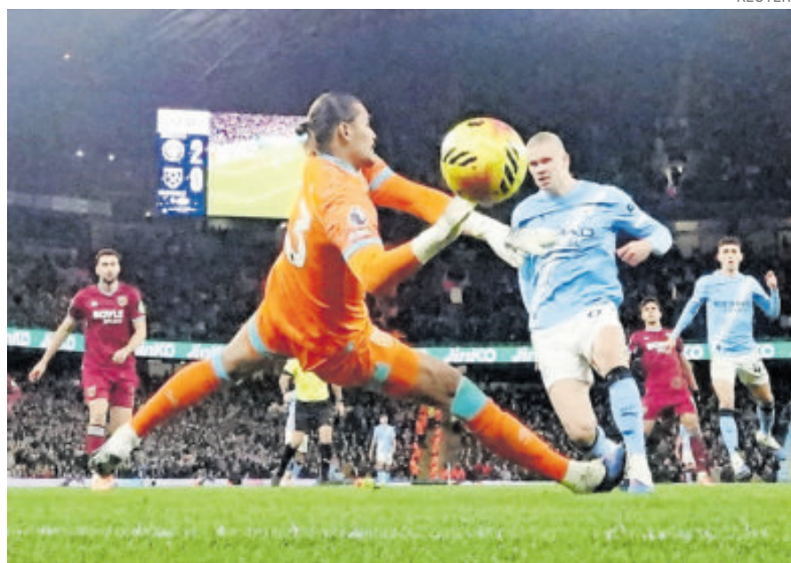
Erling Haaland sigue haciendo goles a destajo y hace olvidar la cifra de Cristiano

GOLES en la Premier League para Haaland, que supera los 103 goles que Cristiano Ronaldo anotó en su etapa en el fútbol inglés.