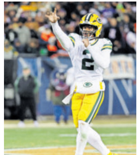
Green Bay todavía tiene chances.