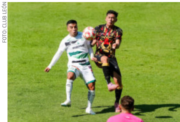
Los Esmeraldas fueron más fieras y se impusieron con autoridad a los Leones Negros de la UdeG.