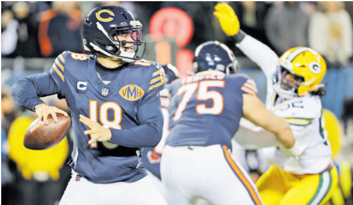
El abrazo del Oso. Chicago se impuso a los Empacadores y sigue en carrera para meterse a los Playoff.