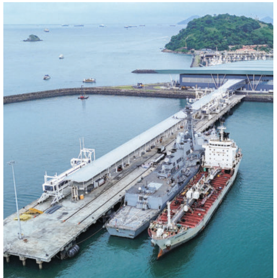
EU ha ordenado la incautación de buques petroleros venezolanos en el Caribe.

Aunque muchos buques que recogen petróleo en Venezuela están sometidos a sanciones, otros que