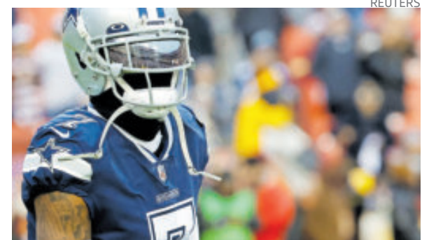
Trevon Diggs. Regresa luego de ocho partidos.

partir de la semana siete, algo que ha superado y está sano para volver al campo en el juego de la semana 16, antepenúltimo de la temporada de la NFL, contra Chargers. Su ausencia en la defensiva secundaria, que también se combinó con una lesión en la rodilla, influyó en la mala racha del equipo que recibió una media de 29.5 puntos por partido.