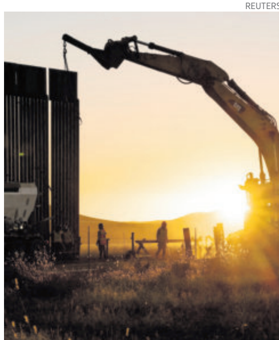
El DHS y la CBP adjudicaron cinco nuevos contratos por un total de 3.3 mmdd.

“Asegurar nuestra frontera es clave para proteger a nuestro país, mantener a nuestras comunidades seguras y garantizar que nuestro sistema de inmigración funcione correctamente. Un muro fronterizo con la tecnología adecuada, un muro inteligente, es una herramienta importante para detener la actividad ilegal y ayu-