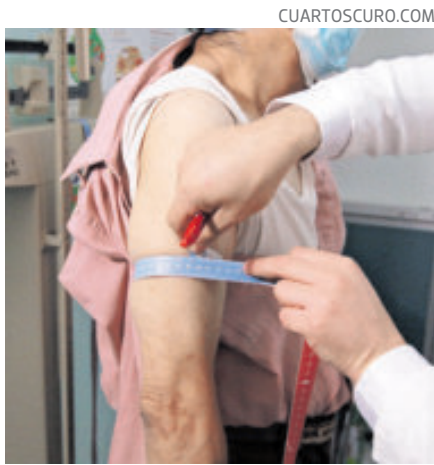
Diputados van por atención integral.