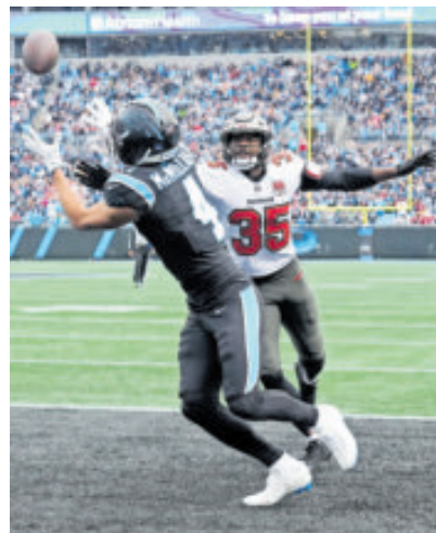
Las Panteras de Carolina pusieron un pie en la postemporada.

Y los Cincinnati Bengals apalearon 21-45 a los Miami Dolphins, los New Orleans Saints vencieron 29-6 a los New York Jets y los Minnesota Vikings le ganaron 13-16 a New York Giants, todos estos equipos ya eliminados.