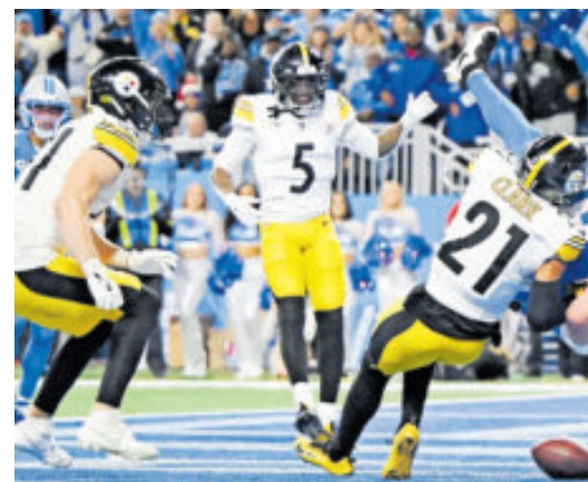
Los Acereros vencieron a Leones de Detroit, que están casi fuera.

También el domingo los Atlanta Falcons le ganaron 19-26 a los Arizona Cardinals, pero fue un resultado tardío porque ya los dos equipos están sin posibilidades de avanzar a la postemporada.