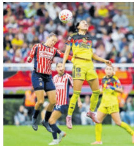
El clásico femenino sí fue el duelo más visto del certamen, encima de la final.

Y el Clásico Nacional de la Jornada 8 alcanzó 5.28 millones de audiencia.