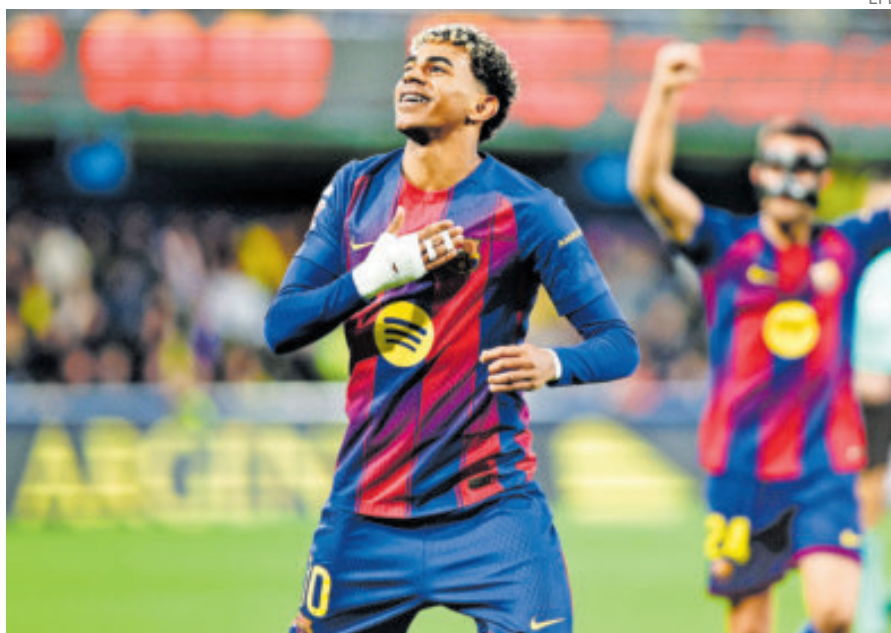
Barcelona mantuvo su buena racha en cancha del Villarreal y afianzó el liderato.

AÑOS sin perder en el campo del Villarreal y contando para los culés; tendrán feliz Navidad y Año Nuevo.