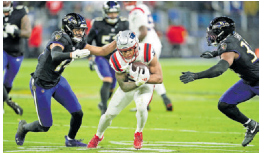
Patriotas tuvo los arrestos para recuperarse y rescatar una victoria que lo califica y lo mantiene en carrera para ganar la División Este.