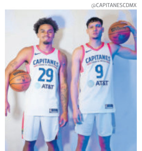
Capitanes CDMX debe hacer sentir la localía durante la temporada.

"En el Tip-Off no tuvimos los resultados que deseamos, pero nos enseñó mucho, fue desafiante; perdimos más de lo que ganamos y eso no me cayó bien,