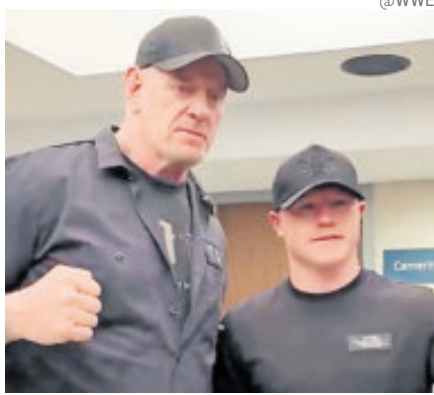
Saúl Álvarez se topó con la figura de la WWE, en Guerra de Titanes de AAA.