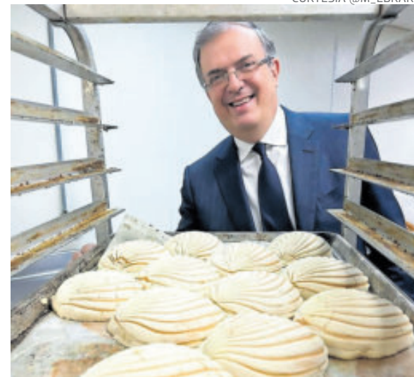
El secretario de Economía, Marcelo Ebrard.

"Somos un factor muy importante, nos necesitan, sí, para buena parte de sus actividades estratégicas", dijo Ebrard sobre Estados Unidos.