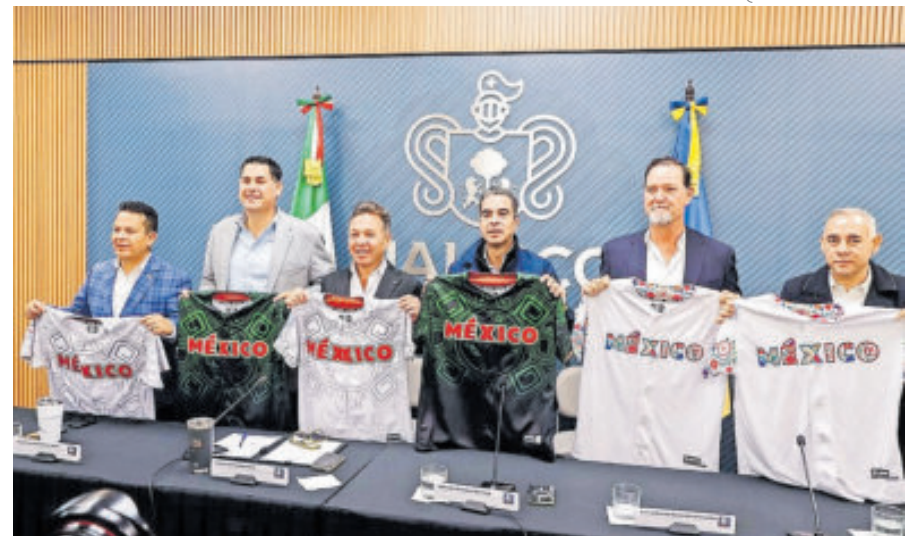
México, República Dominicana, Puerto Rico y Panamá confirmaron ya su participación hasta el momento en la Serie del Caribe 2026, en Guadalajara.

Asimismo, criticó que "esa entidad no ha sostenido comunicación alguna con la Federación Cubana de Béisbol y Softbol sobre una decisión tan importante, que