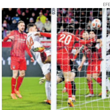
Los bávaros mandan en Alemania.