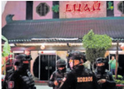
Policías ya investigan el caso.