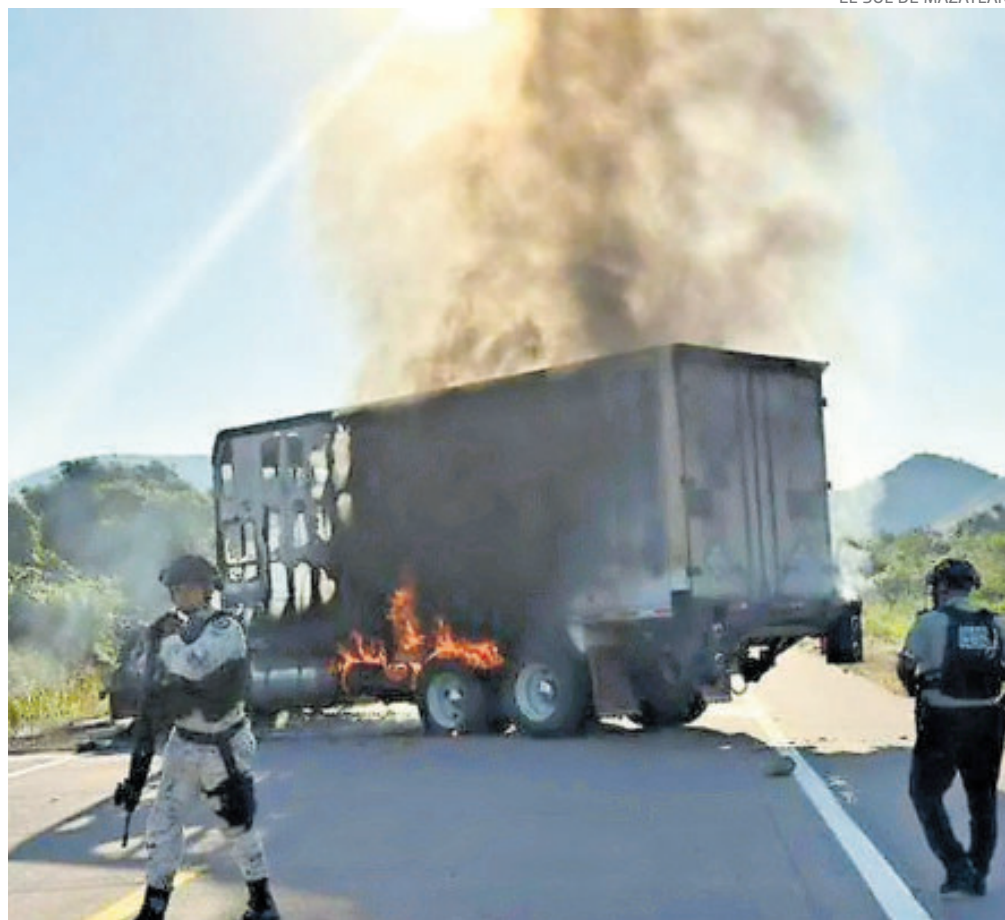
EL SOL DE MAZATLÁN

Las escuelas suspendieron clases y la actividad comercial y social se paralizó durante varias horas, hasta que las propias autoridades manifestaron que ya había pasado, pero que si debían salir de sus casas para realizar compras, que lo hicieran con precaución.