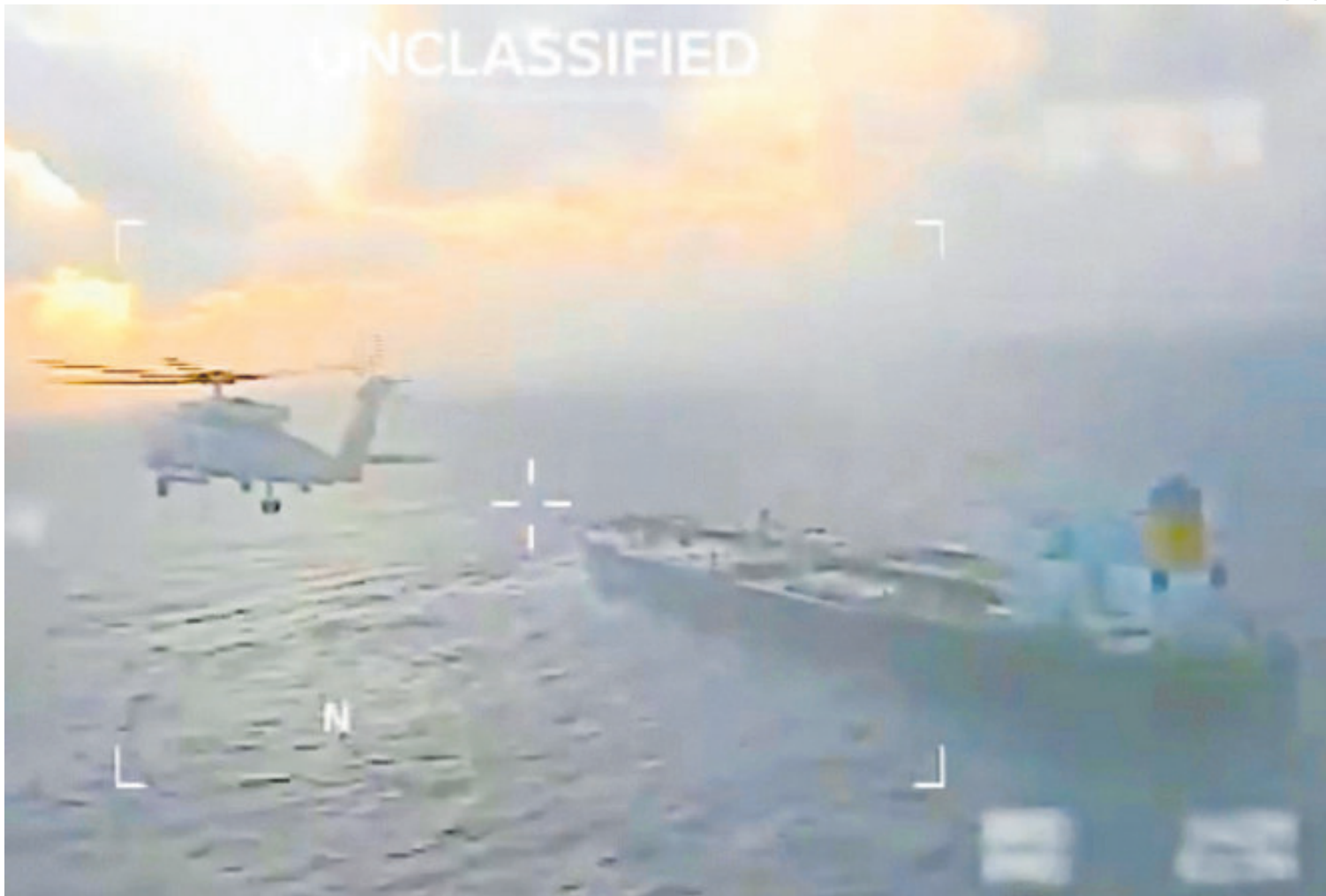
Una nave de la Guardia Costera de EU acosa un buque venezolano.