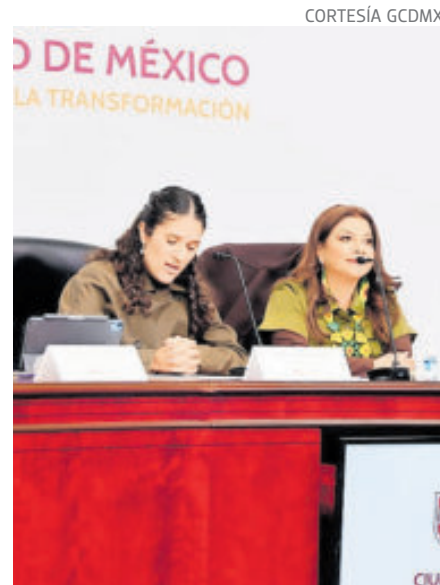
La fiscal de la Ciudad de México y la jefa de Gobierno, ayer.

Durante la presentación del informe sobre la explosión de una pipa de gas LP, en la que se registraron 32 personas fallecidas y 52 personas lesionadas que continúan en seguimiento médico, la jefa de Gobierno señaló que la aplicación permitirá conocer en tiempo real las rutas, la velocidad y las condiciones de operación de las unidades que transportan sustancias peligrosas, además de contar con un mecanismo para reportar irregularidades.