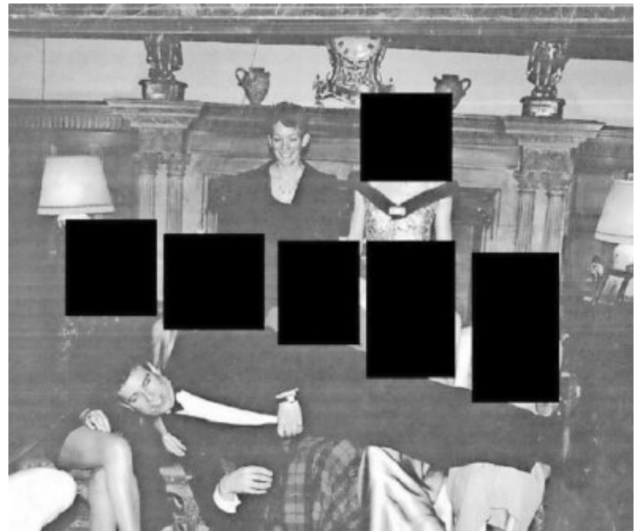
Gislaine Maxwell y el expríncipe Andrés, con varias mujeres.

Gran parte de los documentos tienen amplias secciones tachadas o con recua-