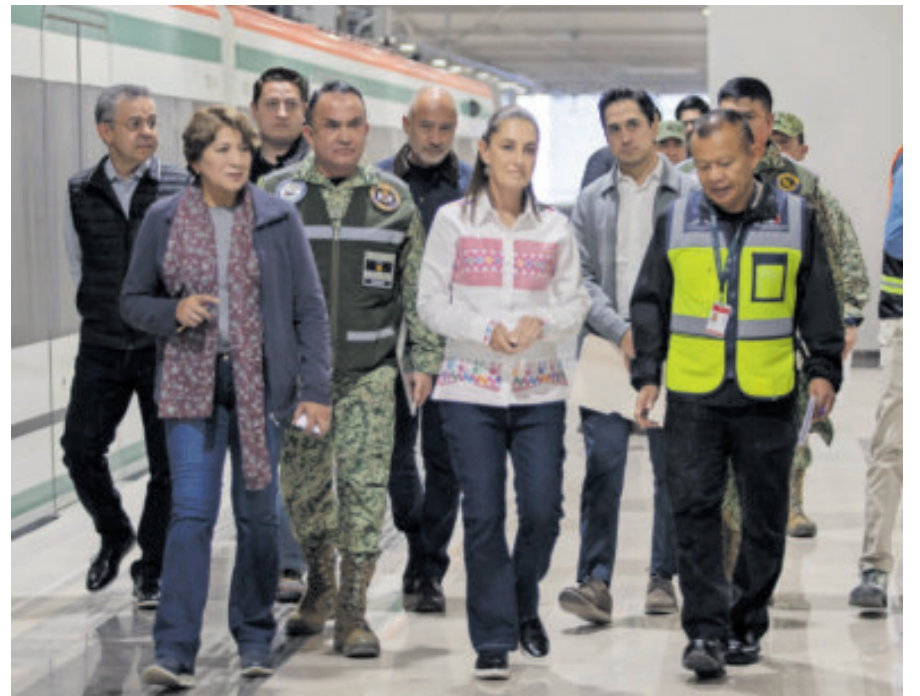
Claudia Sheinbaum, durante la supervisión de obras.

Recordó que este tren es parte del proyecto de rescate de trenes de pasajeros que inició su antecesor, así como el sistema que visitó este sábado el México-Querétaro, “increíblemente obras que se hi-