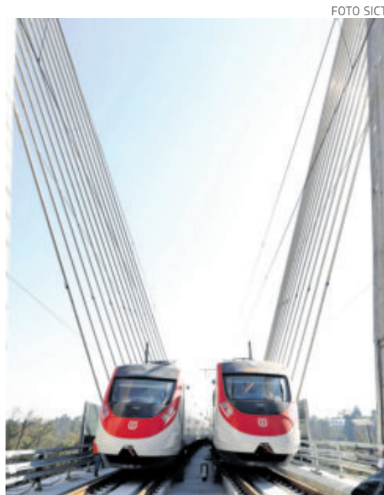
Tren México-Toluca será inaugurado a principios de 2026.

Actualmente, el sistema transporta en promedio 22 mil personas al día, y una vez concluido beneficiará a más de 100 mil usuarios, con tiempos de recorrido menores a 60 minutos. El Insurgente contará con siete estaciones y se integrará con otros sistemas de transporte como el Metro, el Cablebús Línea 3, el CETRAM y la terminal de autobuses foráneos, fortaleciendo la movilidad integrada en la zona metropolitana.