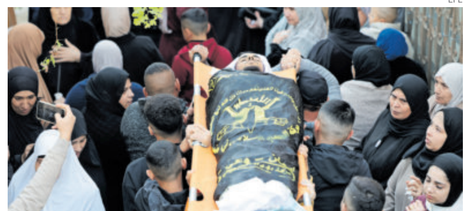
Funeral de un joven asesinado por Israel en Cisjordania ocupada.

Smotrich, colono y exponente de la derecha nacionalista religiosa, indicó que la iniciativa busca sabotear la creación de