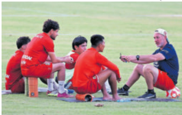
Duelo calentito. Guadalajara enfrentará al Atlas en el torneo que jugarán en el Estadio Jalisco.