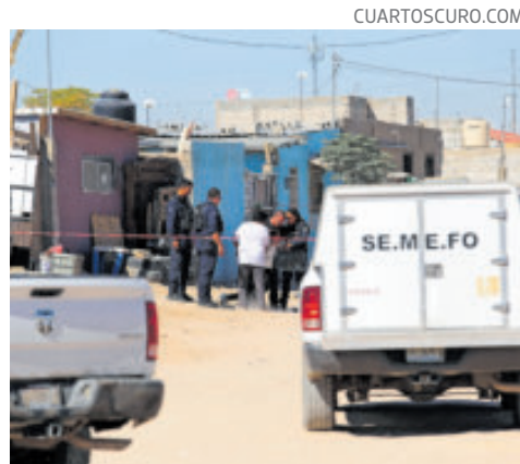
Autoridades y Semefo, en Ciudad Juárez, tras cuatro asesinatos.

La institución religiosa convocó a sus fieles en esta temporada decembrina a celebrar el significado de la Navidad a través de "la defensa de la dignidad humana" y del nacimien-