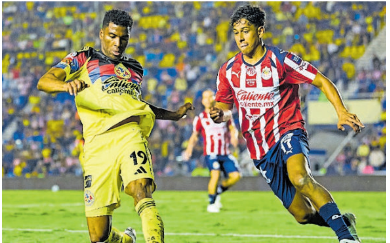
El Águilas-Chivas dominó la fase regular, aunque ya luego lo superaron en audiencia varios duelos de la Liguilla.

FUE EL QUINTO PARTIDO MÁS VISTO DEL APERTURA 2025