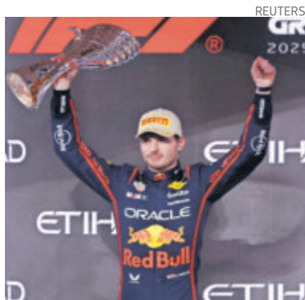
Red Bull quiere finiquitar el retiro de Max Verstappen en F1 en su escudería.

El Canelo y su familia estuvieron en primera fila. Pasó desapercibido al inicio al portar una máscara y La Parka y Octagón Jr., revelaron su identidad para provocar gran ovación. Y tras bambalinas, Saúl recorrió el backstage, donde coincidió con The Undertaker, referente de la WWE.