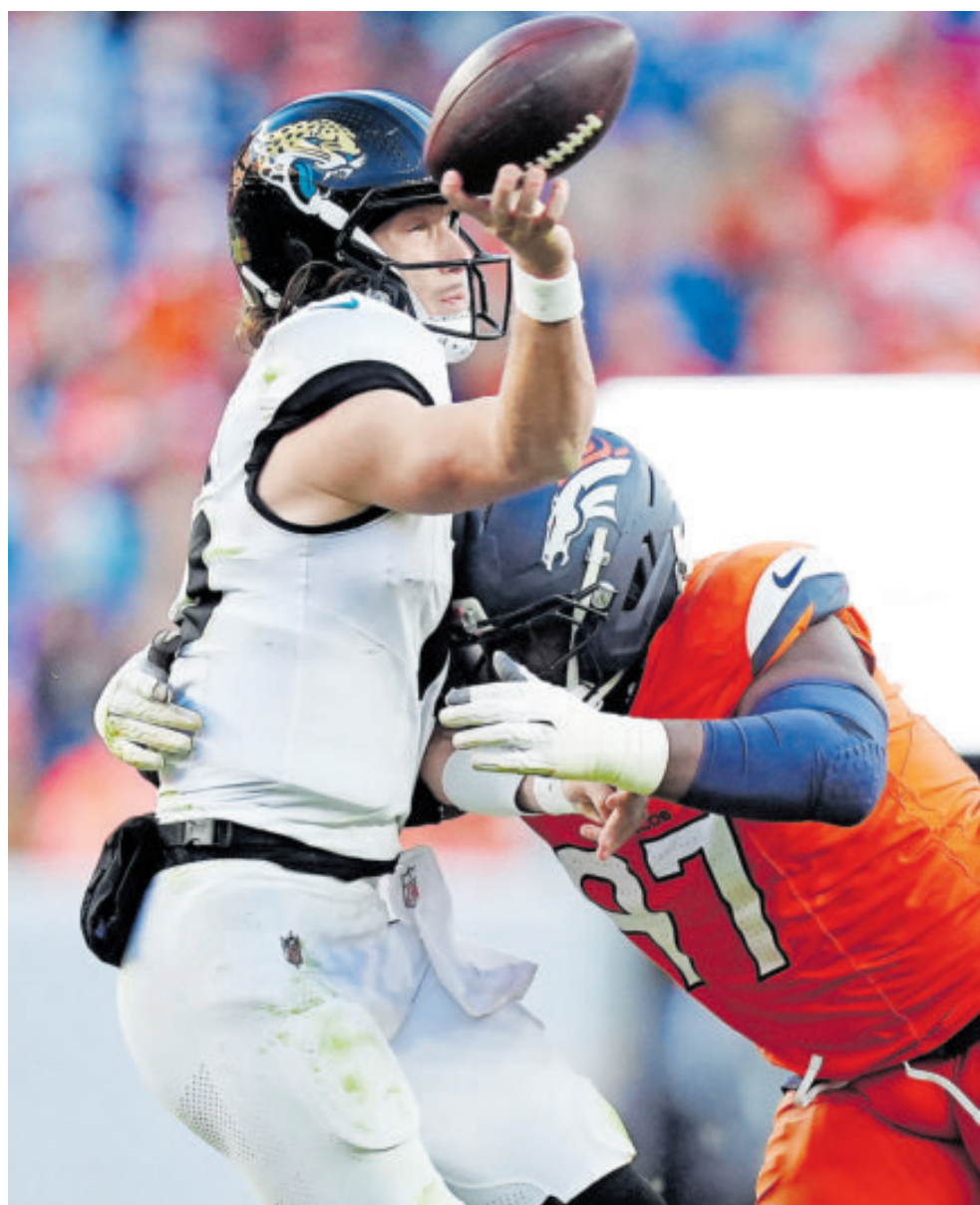
Jacksonville sacó las garras para imponerse a Broncos de Denver, con lo que se mantiene como primero de su sector y depende de sí para sellar su clasificación.

En otro partido, los Pittsburgh Steelers superaron 24-29 a los Detroit Lions para confirmarse como líderes de la división Norte de la AFC con marca de nueve ganados y seis perdidos, lugar que les clasificará a playoff si lo sostienen con par de victorias en el cierre del año.