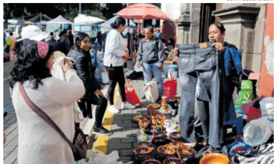
Entre 2018 y 2023, la mayoría de las nuevas empresas surgió en la informalidad.

El CEESP subraya que no han existido estrategias efectivas para impulsar la creación de empresas formales y empleos de calidad. Datos del Censo Económico del Inegi muestran que entre 2018 y 2023 se crearon 668 mil nuevas unidades económicas, pero más de 500