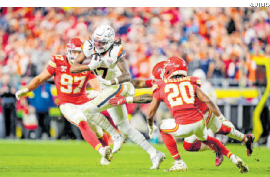
Denver batalló, pero al final supo liquidar a Kansas City para triunfar.