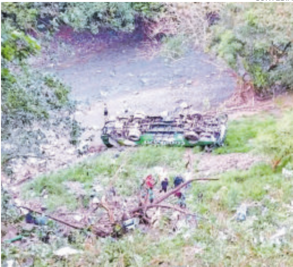
El camión cayó a un barranco.

contepec, en Veracruz. Pero en la comunidad Rancho Nuevo, ubicada en el municipio, en la zona norte del estado, en los límites con Hidalgo, perdió el control y se precipitó por una cañada. La autoridad explicó que, tras la llegada de los cuerpos de emergencia, se atendió a 19 personas lesionadas, quienes fueron trasladadas a hospitales de las localidades Chicontepec y Huayacocotla. Según versiones de lesionados y cuerpos de emergencias, el autobús circulaba por un tramo difícil cuando se desbarrancó, volcó y llegó hasta un río en el citado municipio de Zontecomatlán; tras la volcadura, varios pasajeros quedaron atrapados con el referido saldo de víctimas y lesionados.