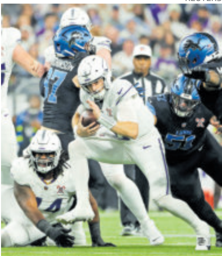
Minnesota hizo la travesura a Detroit.

La defensiva de Minnesota tuvo una destacada actuación. Capturó cinco veces a Jared Goff, QB de Detroit, a quien interceptó dos veces, además, provocó cuatro balones sueltos. La primera mitad del duelo fue dominada por las defensivas. La de Minnesota capturó dos veces a Goff; la de Detroit capturó en cuatro ocasiones a Max Brosmer, siete veces en todo el juego.