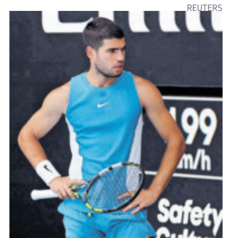
Carlos Alcaraz tomó la decisión de tomar caminos separados.

De los 7 años juntos, Ferrero reconoce que de los momentos más bonitos fue la etapa de los 15 a los 18 años, por el crecimiento.