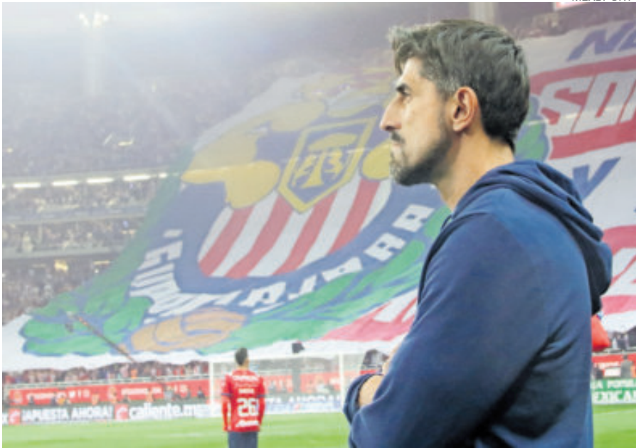
Veljko Paunovic entiende hoy que no debió renunciar a Chivas, pero ya es tarde.

Veljko Paunovic fue el último técnico que estuvo a nada de que Chivas saliera Campeón, pero terminó por perder la Final del Clausura 2023 ante Tigres en tiempo extra.