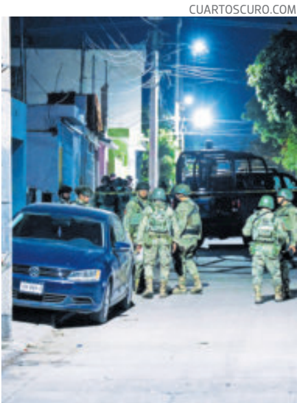
Un asesinato registrado en Culiacán, durante la noche.

Este año, Chihuahua, Jalisco y Estados de México fueron los estados más violentos, con seis, cinco y cuatro homicidios, respectivamente, registrados en dichas demarcaciones, de acuerdo con las cifras oficiales.