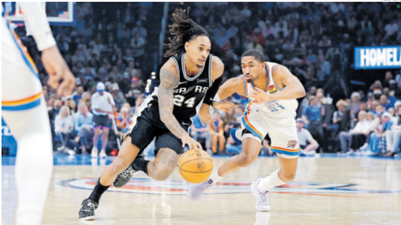
Los texanos ya le tomaron la medida al campeón Oklahoma y de pronto saltan como el posible caballo negro.