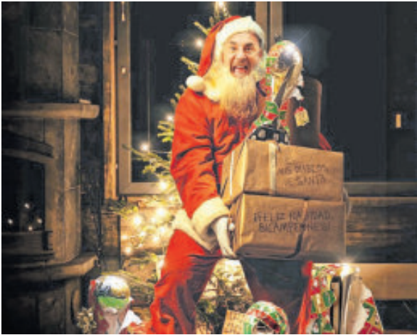
Los Diablos Rojos siguen disfrutando de su título y renovarán objetivos e ilusiones para 2026.

En la previa de la Navidad, Antonio Mohamed concedió una entrevista en Argentina a TyC Sports, donde habló de