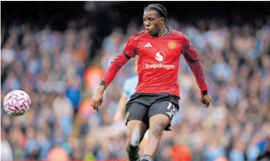
Los Diablos Rojos y las Urracas se miden en el único partido de este día, cuando años atrás en esta fecha se jugaban casi todos los encuentros de la Premier.

Aún así, la Premier se acentúa hasta el cierre del 2025, con partidos casi todos los días. La fecha 18 en este fin de semana que llega y la decimonovena, la última de la primera vuelta, entre el fin de año y el Año Nuevo. Arrinconado queda el Boxing Day, una celebración en la que gran parte de los partidos se jugaba a lo largo del 26 de diciembre, al día siguiente de la Navidad. Los campos se llenaban, invadidos por niños y jóvenes en medio de las celebraciones, plagados de colorido. En este caso la historia ha sido derribada por los intereses televisivos que han