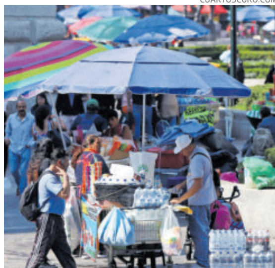
Aumentó el trabajo por cuenta propia.

La población ocupada sumó 59.8 millones de personas, equivalente al 97.3% de la PEA, con una caída anual de 163 mil, lo que equivale a un retroceso de 0.3 por ciento comparado con noviembre de 2024. La ocupación femenina disminuyó