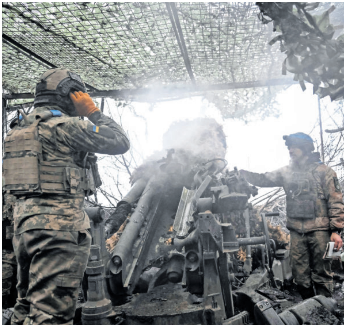
Fuerzas Armadas de Ucrania disparan un obús hacia las tropas rusas en la región de Dnipropetrovsk.

lado dos exigencias mayores de Moscú: la retirada de las fuerzas ucranianas de los territorios del Dombás aun bajo su control y un compromiso jurídico que obliga a Ucrania a no ingresar a la OTAN.