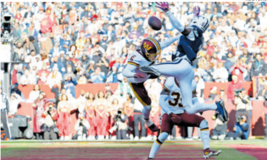
Los Vaqueros de Dallas rompieron una racha de tres derrotas en fila.

En el tercer cuarto Washington se acercó 20-27 en una carrera de 72 yardas de Jacory Croskey-Merritt, y un gol de campo de Moody; Dallas sumó con patada de tres puntos de 52 yardas de Aubrey. Y cerraron con goles de campo el 23-30.