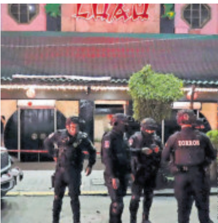
La fachada del restaurante atacado.