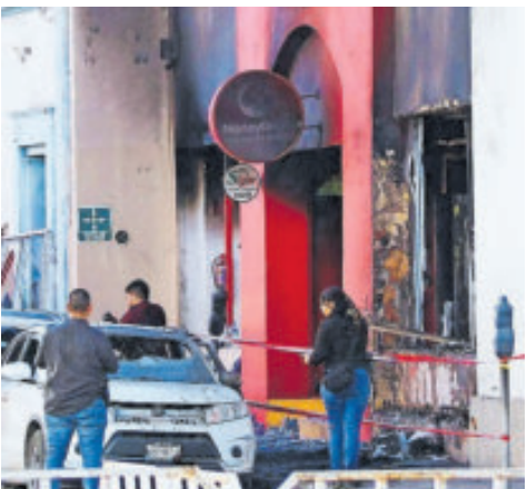
El incendio dejó 24 muertos y varios heridos.

El anuncio coincide con la realización de la primera audiencia formal del caso, que se llevó a cabo el miércoles, donde se iniciará el