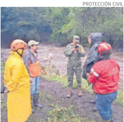
Catemaco, con severos daños.

Los municipios de Catemaco y Ángel R. Cabada, en el sur de Veracruz, han registrado severos daños derivados de las intensas lluvias que en las últimas horas han provocado el desbordamiento de ríos y arroyos, así como inundaciones en varias localidades. En la comunidad de La Palma, ubicada en el municipio de Catemaco, habitantes utilizaron plataformas digitales para solicitar el apoyo urgente de las autoridades, luego de que el río de esa localidad se volvió a desbordar, ocasionando graves afectaciones en viviendas y bienes familiares. Usuarios señalaron que la situación ya es “crítica”, con agua acumulada en zonas