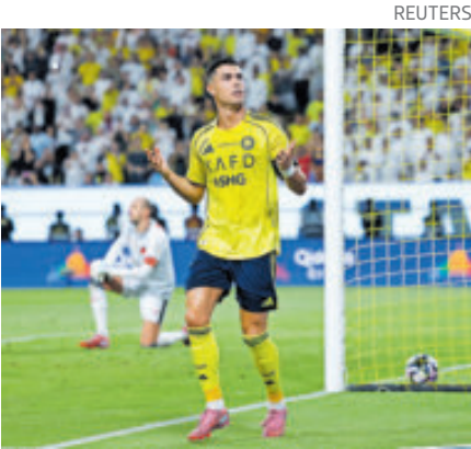
Cristiano Rolando sigue siendo un elemento clave para su escuadra.