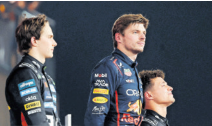
Max se quedó corto en la última carrera de la temporada 2025.