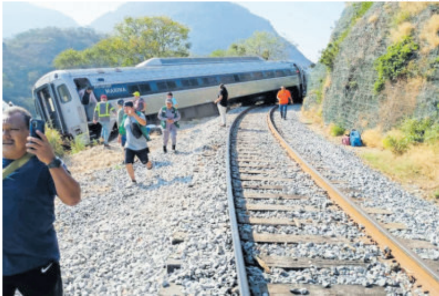
El de ayer domingo fue el mayor accidente registrado en la corta vida de la vía.

La dependencia federal precisó que, una vez que se cuente con datos confirmados y completos, se ampliará la información sobre las causas del incidente, mientras continúan las labores de inspección de la vía y de los equipos involucrados, en un tramo que forma parte de la Línea Z, corredor que enlaza Coatzacoalcos, Veracruz, con Salina Cruz, Oaxaca, y que inauguró su fase de operación en diciembre de