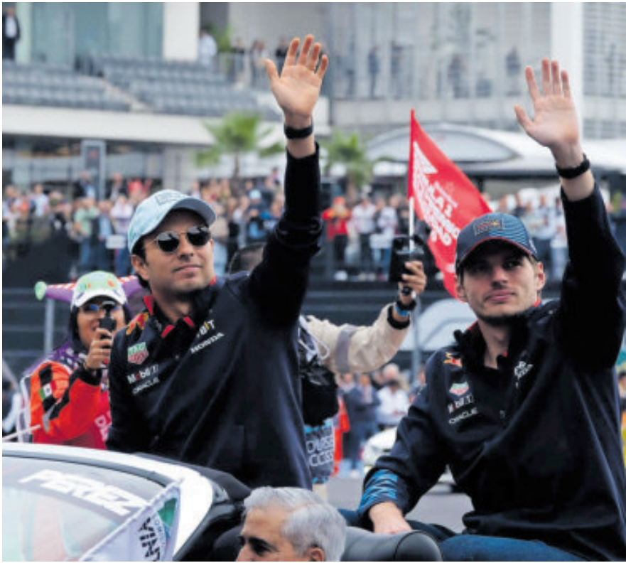
Sergio Pérez acompañó a Max Verstappen en Red Bull por cuatro temporadas, en las cuales el neerlandés logró quedarse con el título mundial.

Pero el camino del campeón estuvo lejos de ser lineal. Tras iniciar el año con victoria en Australia, Norris se vio superado en regularidad por su propio compañero, Oscar Piastri, quien lideró el campeo-