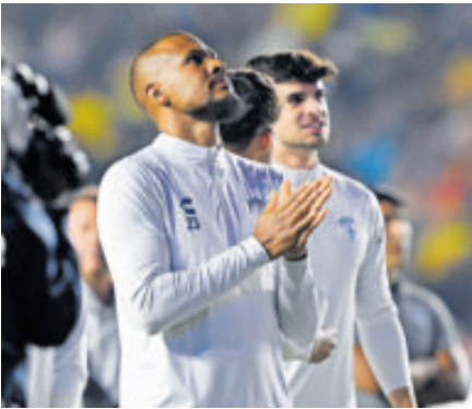
El venezolano tuvo un breve paso por la liga de España con el Oviedo.