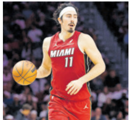
El mexicano se entrega en la duela cada vez que es requerido.

En este momento, nadie en la NBA ha anotado más que Juan Wick saliendo desde el banquillo, pues ha encestado un total de 491 puntos. Y lo ha hecho con confianza, energía y un don para encestar tiros importantes cuando importa.