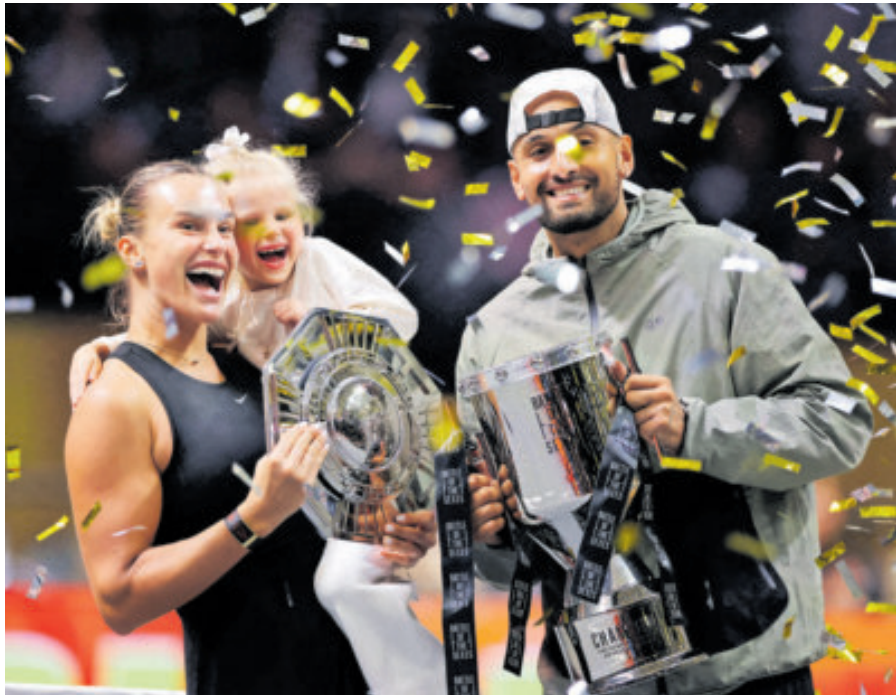
La bielorrusa y el australiano dieron una gran exhibición de tenis en Dubái.