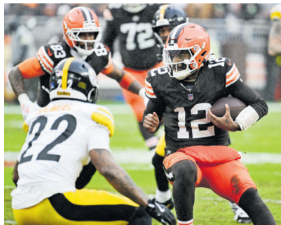
El mariscal de campo, hijo de Deion Sanders, tuvo una actuación discreta.