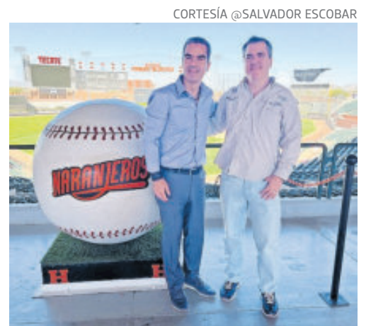
Los directivos están seguros del éxito del torneo de beisbol en febrero.

Escobar explicó que Venezuela no estará presente y la competición transcurrirá con Do-