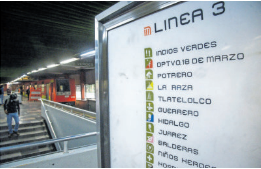
Solo una 'manita de gato' recibirá la Línea 3 previo al Mundial de fútbol.

En contraste, la Línea 2 (Taxqueña-Cuatro Caminos) fue identificada como una de las prioridades rumbo al Mundial, no por una reconstrucción estructural, sino por su relevancia en la conectividad con zonas de alta afluencia. En este caso, los trabajos previstos se concentran en mejoras de infraestructura eléctrica y de ca-