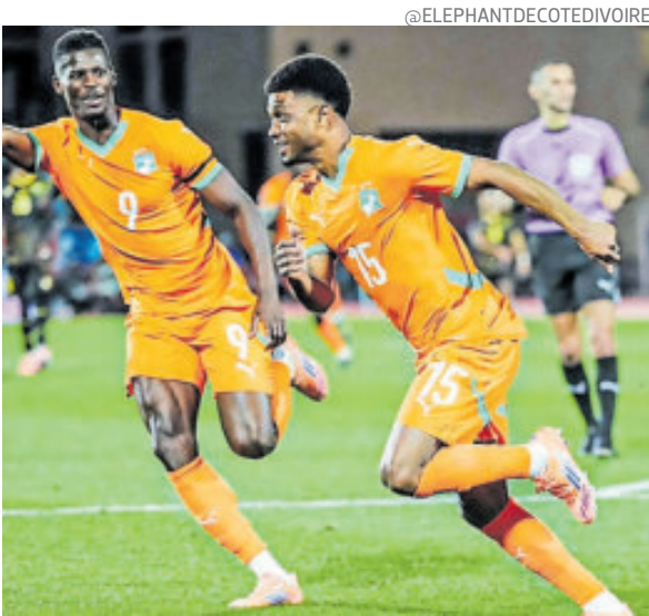
Los Elefantes tendrán que esperar su clasificación.

No se movió el marcador después y todo quedó pendiente de la última jornada en la que Camerún, cinco veces campeona, jugará contra Mozambique, en un pulso entre ambas por la clasificación, y Costa de Marfil frente a Gabón, sin nada en juego.