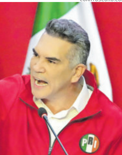
El PRI votará en contra de la reforma.

Advirtió que la reforma electoral no es un hecho aislado, sino parte de una estrategia más amplia de transformación del