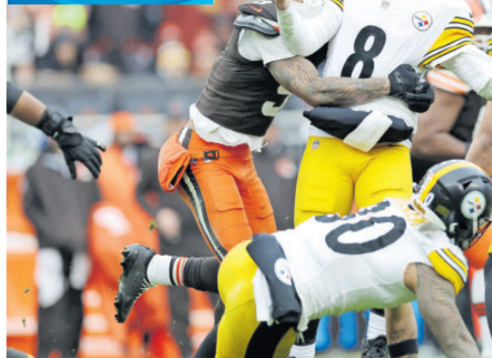
Aaron Rodgers no tuvo su mejor salida al ser capturado en dos ocasiones, además de que no pudo conectar pases de anotación.