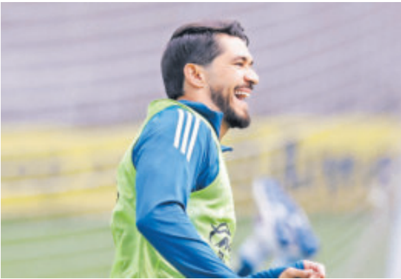
Martín sólo disputó tres partidos de la fase regular, ante Necaxa, Querétaro y Chivas.

Reinoso destacó que el mejor momento de Martín fue en el Clausura 2023, certamen en el que marcó 14 goles.