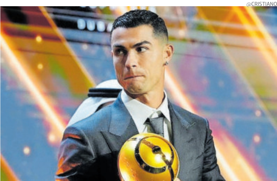
Ronaldo recibió el premio a mejor jugador de Oriente Medio en los Globe Soccer.