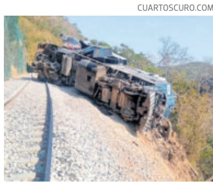
Hay cinco pacientes en estado de gravedad.