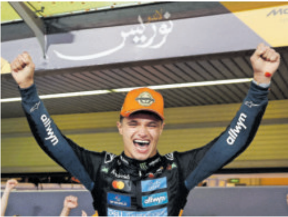
El nuevo rey de la Fórmula 1, el inglés Lando Norris.

La F1 del 2026 será un lienzo en blanco donde un campeón recién coronado como Norris deberá defender su título en un terreno desconocido, y donde un veterano con hambre de redención como Pérez tendrá una última oportunidad para escribir su epílogo soñado. Es el cierre de una era de dominio y el inicio de otra, definida por la incertidumbre, la sostenibilidad y la promesa de batallas donde la estrategia y la fortaleza mental serán cruciales.