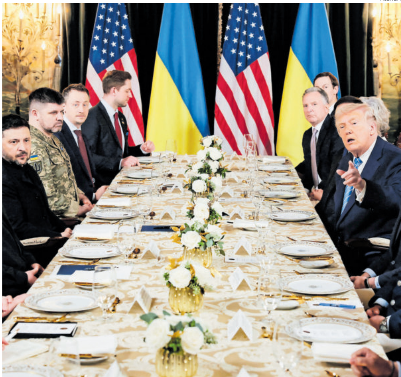
Trump, acompañado por los principales miembros de su equipo, se sentó cara a cara con Zelenski y sus negociadores.

Justo antes de que Zelenski y su delegación llegaran a la reunión, Trump y