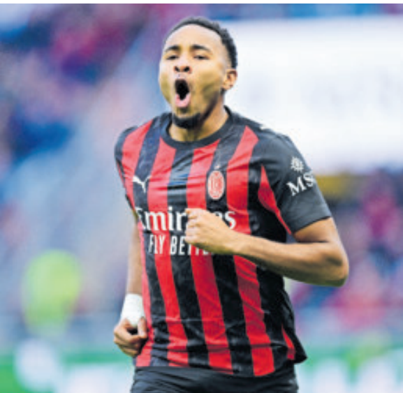
Christopher Nkunku consiguió un doblete.