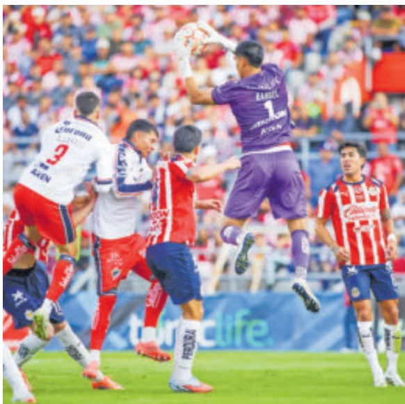
Irapuato tuvo pocas oportunidades de gol.

Ahora el equipo tapatío se prepara para un cuadrangular donde enfrentará a la UdeG, Atlas y Rayados de Monterrey.