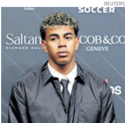
Recibió el premio a mejor delantero.

tado por quién es su referencia: “Mejor no compararse con nadie. Jugadores como Cristiano han sido lo que son por no compararse con nadie y querer ser ellos mismos”.