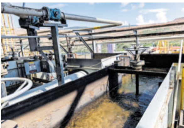
Nueva ley podría limitar o modificar significativamente el acceso al líquido, aseguran.

El sustento de alrededor de 3 millones de familias que dependen directa e indirectamente de la minería, en peligro, alertan.