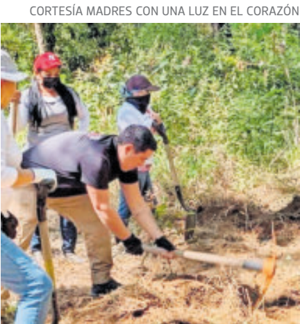
La búsqueda de sus seres queridos es incansable.

Refirieron que el caso ya fue turnado a la fiscalía general del estado para que se lleve a cabo el proceso de identificación a