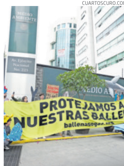
Una protesta contra el proyecto Saguaro, frente a Semarnat, en 2024.

El organismo multilateral señala que permitir el avance de estos proyectos sin evaluaciones ambientales completas, sin transparencia y sin la participación de las comunidades afectadas pondría a México en riesgo de incumplir el Acuerdo de París,