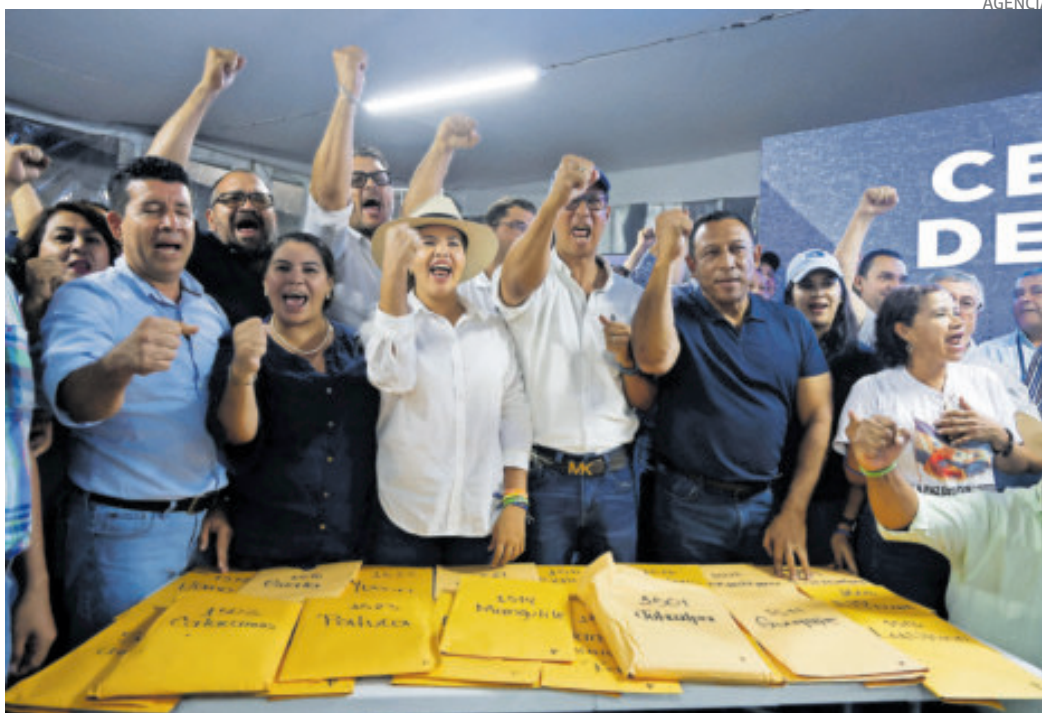
El equipo de Asfura muestra copias de actas que le dan el triunfo en una localidad.

LOS COMICIOS son un castigo a la izquierda por la polarización, que es secuela del golpe de Estado que derrocó en 2009 a Manuel Zelaya.