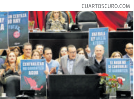
Diputados de oposición, ayer, al protestar contra la reforma.

Al caer la tarde, una parte del contingente en San Lázaro optó por retirarse. Para el cierre de la jornada, la explanada del Congreso quedó marcada por termos vacíos, motores apagados y un clima de espera que anticipó un 4 de diciembre dominado por bloqueos, caravanas y una reforma hídrica que puso al país en vilo entre el campo y la capital.