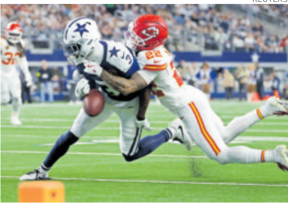
Además, el partido entre Vaqueros y Jefes no decepcionó, pues fue un resultado cerrado.

La combinación de que ambos equipos cuentan con dos de los mejores ‘quarterbacks’ de la NFL en Dak Prescott, por Cowboys, y Patrick Mahomes, Chiefs, sumado a la popularidad de Dallas como el equipo de América, y Kansas City, como la franquicia dominante de la reciente década, contribuyó a lograr estos números.