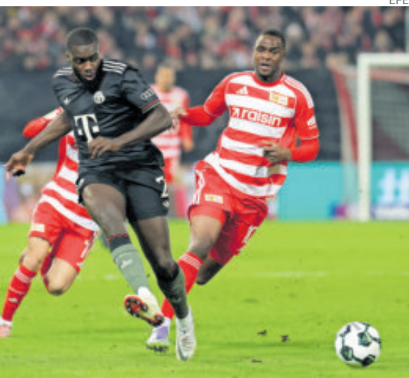
Bayern Múnich sudó frío al final del encuentro.

Resultados de la Copa Alemana: Bochum 0-2 Stuttgart; Friburgo 2-0 Darmstadt; Hamburgo 1-1 Holstein Kiel (2-4); Unión Berlín 2-3 Bayern Múnich.