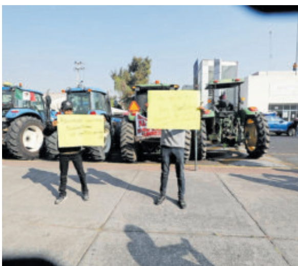
Afuera de la cámara protestaron contra la ley.