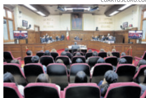
Los ministros de la Suprema Corte, en sesión.

Al resolver una contradicción de criterios, los ministros determinaron que el bloqueo, suspensión o limitación de los fondos en una cuenta, por parte de una institución de crédito, cuando se realiza con fundamento en las cláusulas del contrato celebrado con la persona usuaria, no constituye un acto de autoridad para efectos del juicio de amparo indirecto.