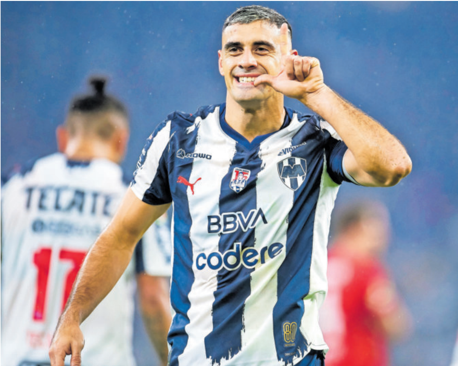
El seleccionado mexicano logró rematar de cabeza un centro que parecía pasado y pudo hacer el único gol del partido.