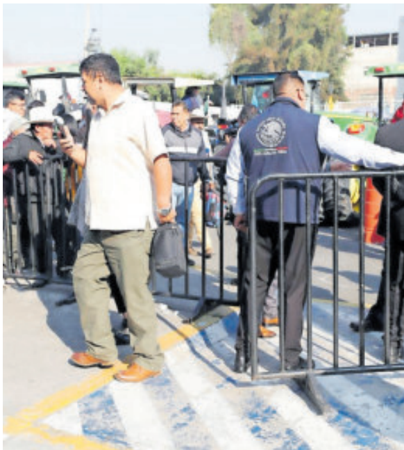
Campesinos ingresaron a San Lázaro.

Subrayó que el decreto "transforma el régimen del agua en México y garantiza de manera efectiva el derecho humano al agua para todas y todos, otorgando certeza jurídica a través de la conformación de