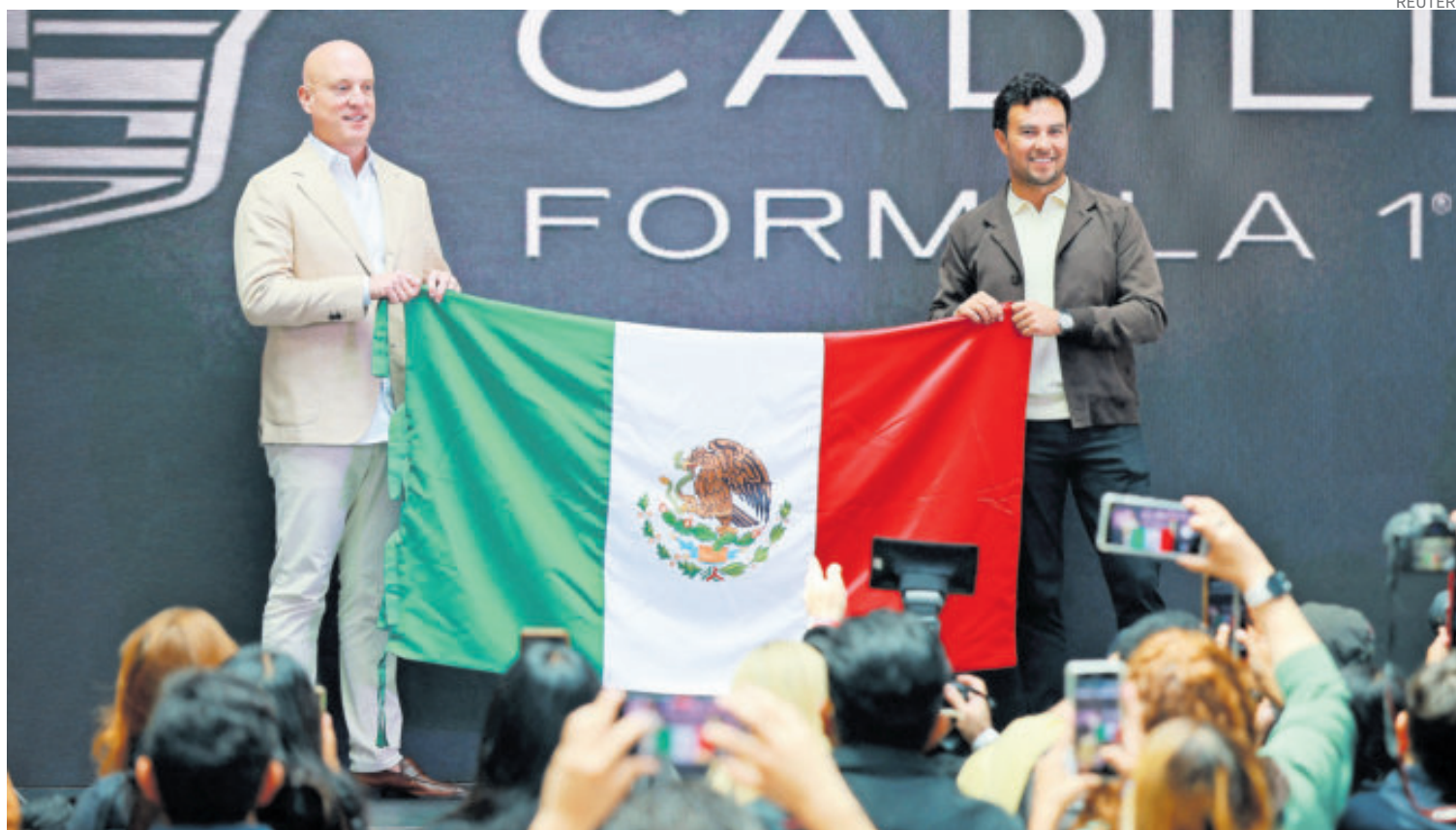
La imagen del auto del equipo estadounidense y de Sergio Pérez será vista por millones de personas alrededor del mundo.