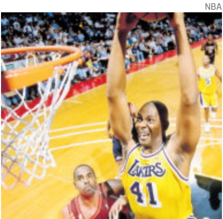
Campbell llegó a los Lakers en 1990.

En su año senior lideró a los Tigers hacia el único título de temporada regular de la ACC en la historia del programa, alcanzando posteriormente los Sweet 16, en los que cayeron ante UConn.