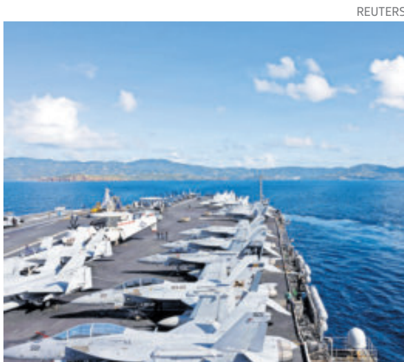
El portaaviones USS Gerald Ford, en Islas Vírgenes.