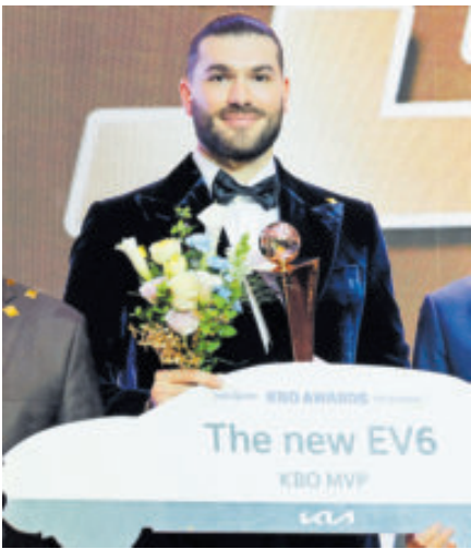
Conquistó el premio al Jugador Más Valioso en la KBO.

La contratación de Ponce se enmarca dentro del plan de Azulejos para fortalecer su rotación abridora.