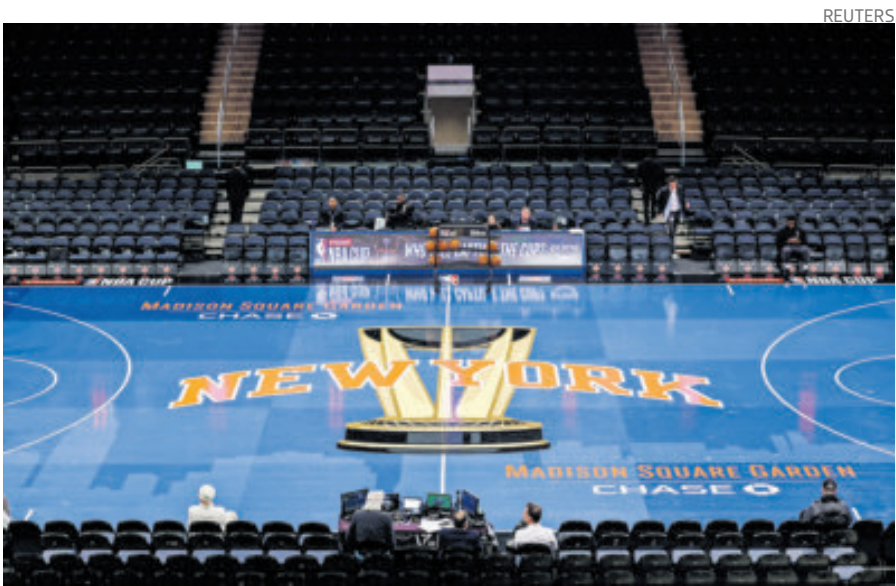
Los juegos de NBA Cup presentan novedosos diseños de las duelas.