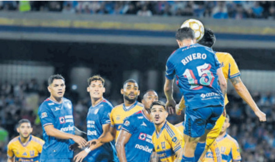
El duelo fue cerrado y, por momentos, tedioso. La Máquina no pudo acelerar porque Tigres se plantó bien en la cancha y le complicó su accionar.

muy retorcido enfrió la esférica. Y si la UANL tenía a su Gorri, La Máquina a su Charly Rodríguez y ese talento tan único para destruir y construir en un parpadeo era un vendaval que servía para romper con el yugo universitario en el ombligo del terreno de juego. Sólo a través de sus pies, el conjunto cooperativista lograba algo diferente a corretear al rival o perder la pelota, guion de los primeros 20 minutos de partido. Una pelota de Charly, quién si no él, dejó nuevamente mano a mano a Fernández con Nahuel, pero fue el guardameta quien ganó nuevamente la partida con ese manejo de área tan dominante. Y así, en un suspiro, pasó la primera media hora donde la desesperación comenzaba a ser el peor enemigo de la parte azul celeste. Si los felinos comenzaron el juego al borde del área cruzazulina, los últimos minutos del primer tiempo, se replegaron de tal forma, que sus elementos transitaban detrás de la media cancha con labores de marca. Pero sin renunciar al frente. Un contragolpe de Juan Brunetta provocó que Ditta lo cazara y le despojara la pelota, con el argentino llevándose la peor parte al caer de golpe en el piso. Pero finalmente, fue Nico Ibáñez el que salió por un problema físico y Ozziel Herrera entró en su lugar poco antes del medio tiempo.