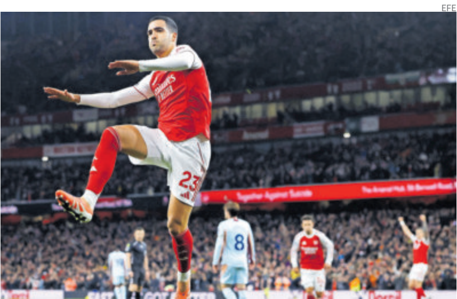
Los Gunners no quitan el pie del acelerador y suman y suman en liga.