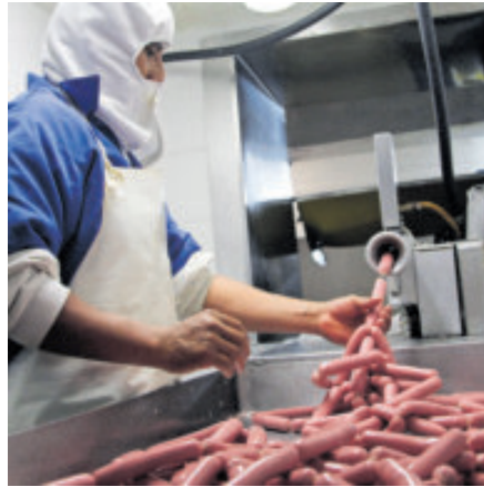
Tienen altos niveles de grasas y sal.