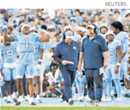
El veterano entrenador ganó seis títulos con los New England Patriots.

Un duelo de necesidades urgentes, con dos ofensivas explosivas y dos defensas que han mostrado versiones muy distintas a lo largo del año. El ganador dará un paso firme hacia enero; el perdedor se complicará seriamente la vida. Ya le estaremos comentando.