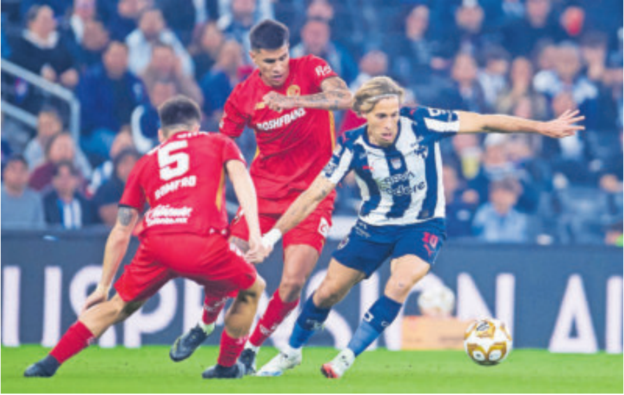
Rayados también contó con mucha fortuna, pues se salvó de por lo menos tres claras de gol del equipo de los Diablos Rojos.