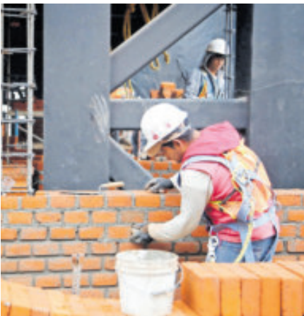
La construcción tuvo un retroceso mensual de 2.6%.

La inversión fija bruta permite conocer el comportamiento de la inversión en el corto plazo, según el Inegi, y está integrada por los bienes utilizados en el proceso productivo durante más de un año.