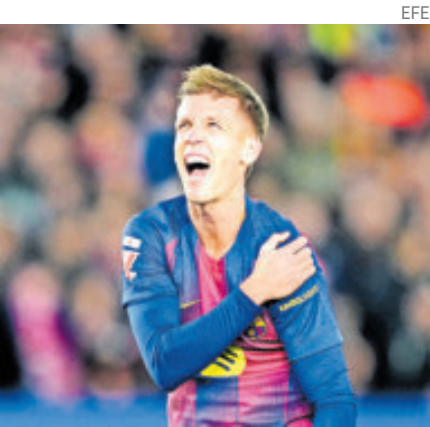
Olmo. Sensible baja para los culés.

Los árbitros de Portugal amenazan con convocar una huelga si la liga del país no adopta medidas para combatir la violencia verbal y la falta de seguridad hacia ellos en los partidos. Harán paro si la Liga no hace nada ante sus propuestas.