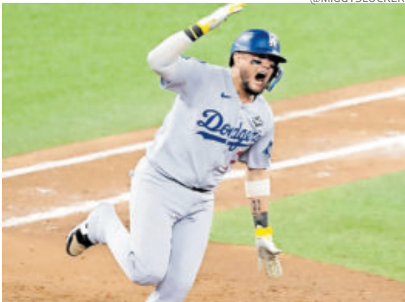
El venezolano fue héroe de la pasada Serie Mundial.

atrapada de un tiro desde el jardín izquierdo de Kike Hernández para completar una doble matanza que preservó la ventaja y mantuvo viva a Los Angeles. Apenas 24 horas después, en el Juego 7, Rojas empató el encuentro con un jonrón ante el cerrador de los Blue Jays, Jeff Hoffman, en la parte alta de la novena. En la parte baja de ese mismo inning ejecutó una difícil jugada defensiva para forzar el out en el plato, allanando el camino para el jonrón de Will Smith.