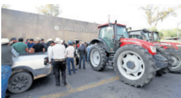
Cercaron el recinto con tractores.