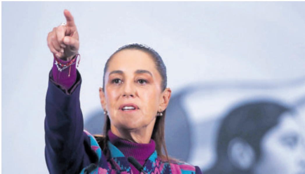
La presidenta Claudia Sheinbaum impulsa su segunda alza al salario.