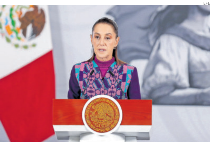
La presidenta Claudia Sheinbaum, ayer, en conferencia de prensa.