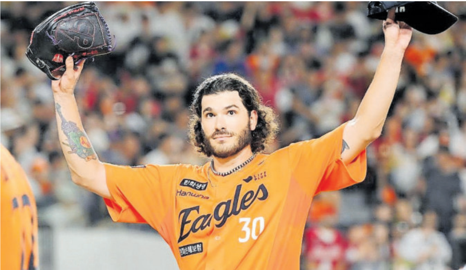
Ponce viene de lanzar en la KBO para los Hanwha Eagles, con quienes realizó 29 aperturas en las que registró una marca de 17-1.