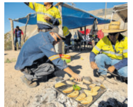
Nuevo salario, a partir de enero.