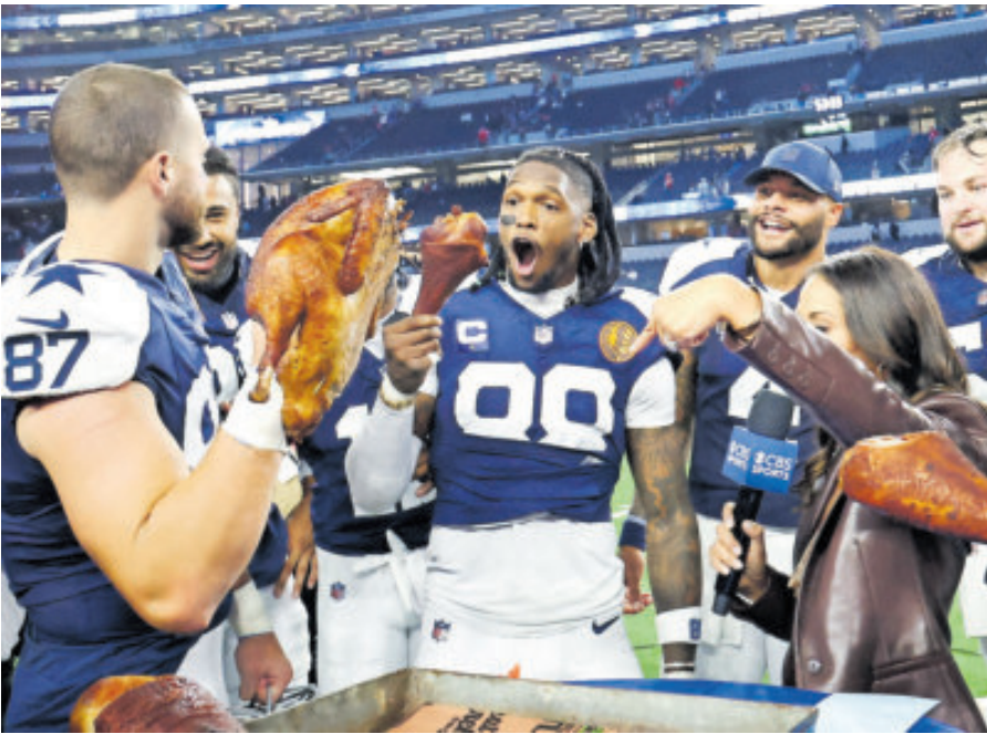
Los Vaqueros vienen de vencer a Chiefs en el Día de Acción de Gracias.

La gran duda local es Amon-Ra St. Brown (tobillo), quien no entrenó lunes ni martes y está listado como cuestionable. Su posible ausencia pondría aún más peso sobre los hombros de Jahmyr Gibbs, el corredor que ha marcado la diferencia esta temporada con 7.4 yardas por acarreo y 10 TD en victorias; solo 3.2 yardas y cero touchdowns en derrotas.