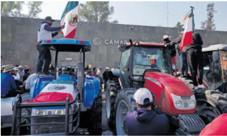
Campesinos se plantaron afuera de la Cámara de Diputados, ayer.

A la mitad del día, los contingentes de Tlaxcala y Puebla colocaron lonas a la sombra de los tractores, repartieron café y siguieron la discusión por radio, en un ambiente que mezcló vigilancia, desconfianza y la sensación de que todo depen-