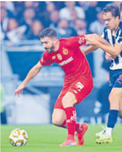
Ahora Toluca debe venir de atrás desde casa, lo que no luce complicado.

ga, quien de zurda envió la de gajos por abajo al poste de la izquierda.