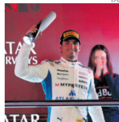
Sainz es noveno del campeonato general con 64 puntos.

"Quiero felicitar a todo el mundo y agradecerles a los aficionados por todo el apoyo que nos dieron en cada paso del camino. ¡Vamos!", indicó Sainz, en declaraciones difundidas por su propia escudería este martes.