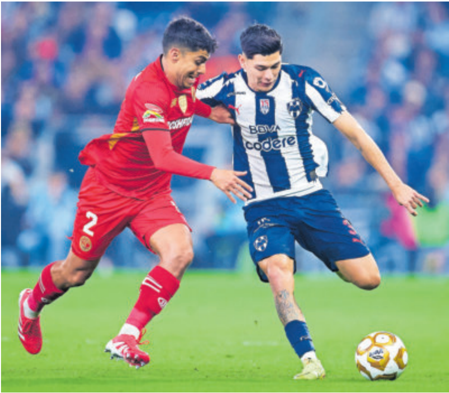
La última vez que Monterrey jugó en el Nemesio Diez terminó muy raspado, pues fue goleado 6-2, y eso ocurrió en el actual torneo.