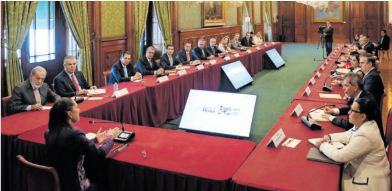
Las reuniones entre empresarios y el gobierno federal serán frecuentes.