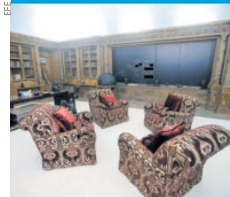
Vista inédita de uno de los salones.