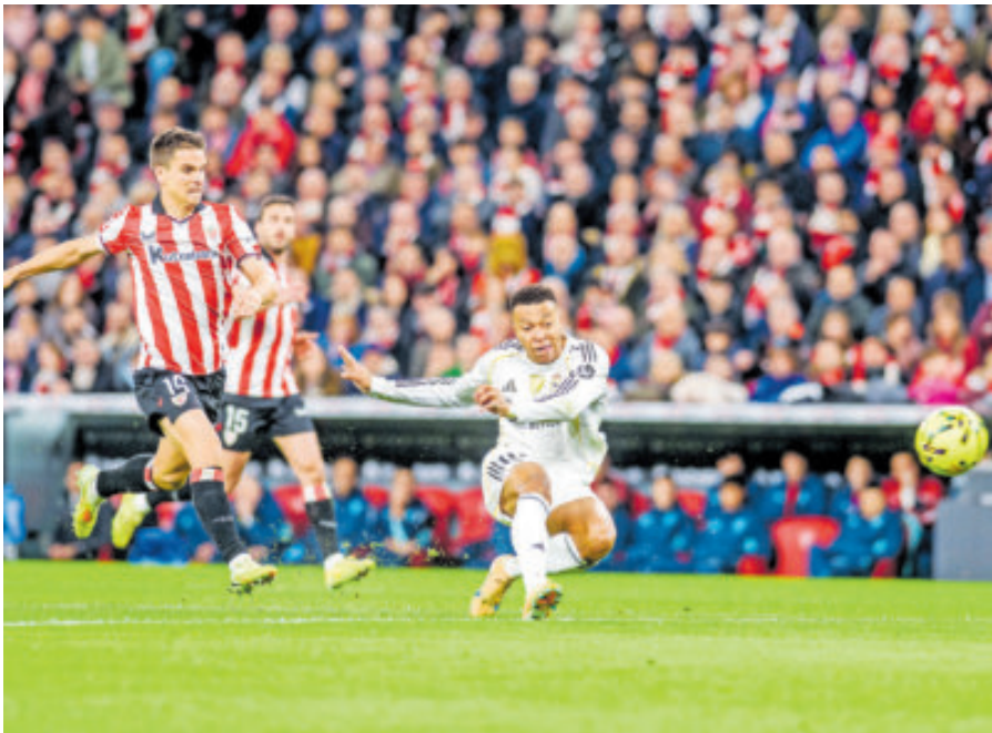
Kylian Mbappé sigue haciendo goles a granel y este resultado calma las aguas.

Además Valverde apostó por otro joven, Adama Boiro, en el lateral izquierdo ante las molestias durante esta semana de Yuri Berchiche; y Alonso salió con Trent y Carreras en los laterales.