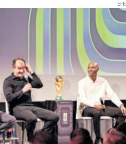
Leyendas del fútbol vislumbran un gran Mundial el próximo año. en 1986) y aseguró que su país va a ser "el mejor anfitrión" y México va a organizar "una gran fiesta" gracias a la alegría de los mexicanos, a la gastronomía del país y a la pasión que les despierta el fútbol. Balboa (EU) y Hutchinson (Canadá) destacaron lo mucho que ha avanzado el fútbol en sus países y que harán buen papel.

Washington, EU.- Cuatro exfutbolistas que fueron protagonistas en los Mundiales expresaron el miércoles su entusiasmo con el torneo que se disputará en Estados Unidos, México y Canadá en el verano de 2026 y cuyo sorteo será mañana. En un panel organizado por la FIFA en la capital estadounidense, dos días antes del evento en el que se conocerá la conformación de los doce grupos del próximo Mundial, Dunga, Marcelo Balboa, Luis Hernández y Atiba Hutchinson se mostraron emocionados por lo que será una cita para "unir al mundo" y en la que por vez primera participarán 48 selecciones. Dunga, campeón en el Mundial de EU 1994 con Brasil, considera que la participación de 48 equipos es "algo maravilloso", especialmente para países que no entraban en las quinielas para disputar la competición y que "ahora pueden cumplir ese sueño". Por su parte, Hernández, que hizo vibrar a los mexicanos con sus cuatro goles en la edición de Francia 98, destacó que el estadio Azteca de CDMX se convertirá el próximo 11 de junio en el primero que albergará tres partidos inaugurales de un Mundial (ya lo hizo en 1970 y