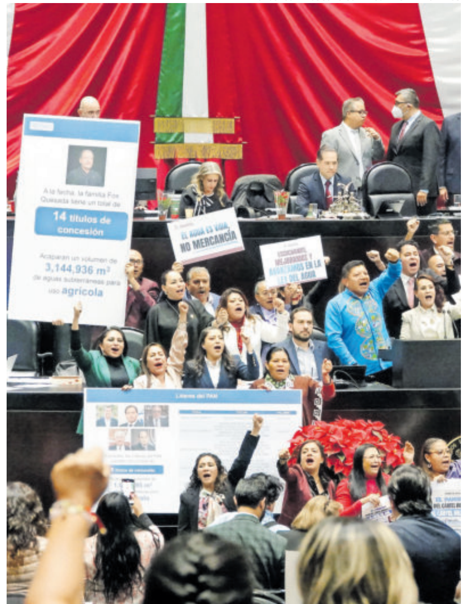
Diputados del oficialismo, ayer, al defender la iniciativa.

Se desahogaron más de 500 reservas, de las cuales sólo se aceptaron 18... de Morena y sus aliados.