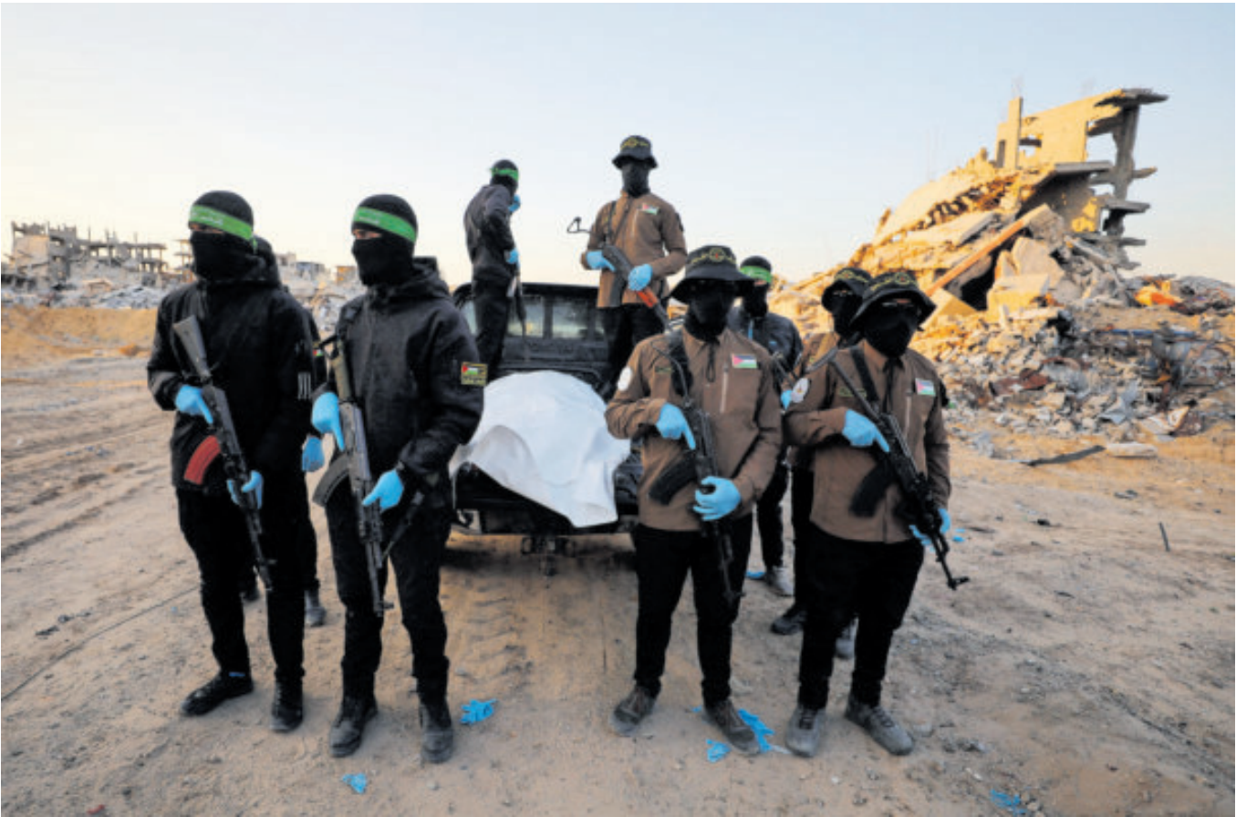
Militantes de Hamás y la Yihad Islámica esperan a que la Cruz Roja reciba el cuerpo de un israelí.