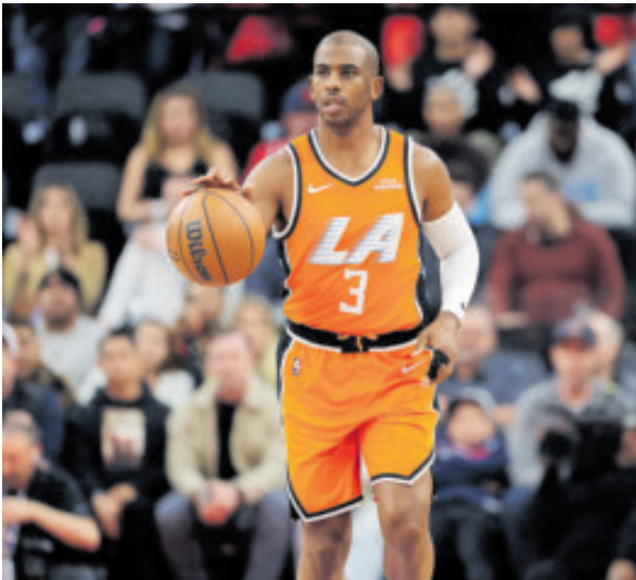
Especulan sobre mala relación de Paul con el coach.

A principios de noviembre también perdieron por el resto de la temporada a Bradley Beal, uno de sus fichajes estrella de la pretemporada, debido a una lesión de cadera.