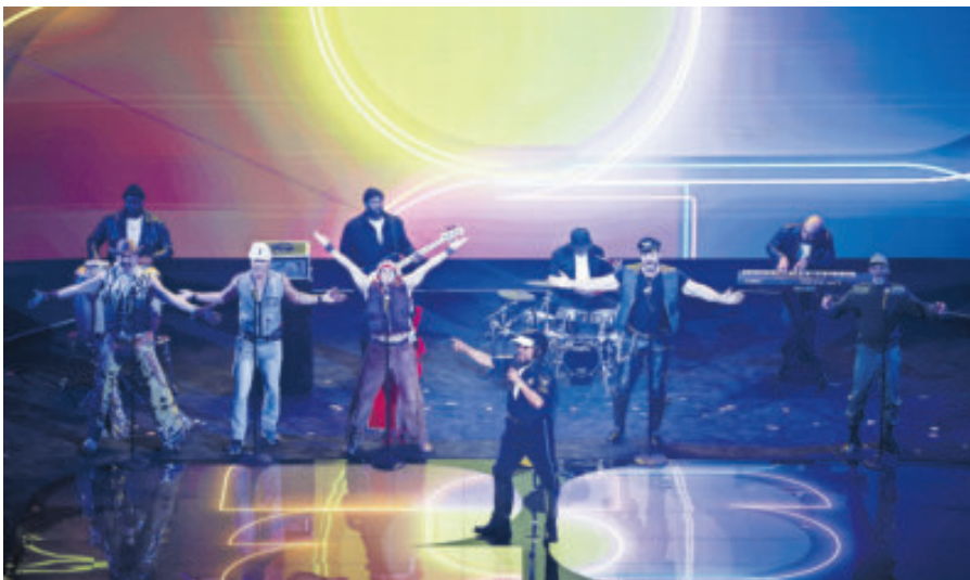
El grupo Village People animó el evento y hasta puso a bailar al presidente de Estados Unidos con el tema YMCA, el cual fue su himno de campaña.

DUELOS INDIVIDUALES Y en el terreno individual, hay choques que seducen, como el Kylian Mbappé contra Erling Haaland, dos artilleros que están en fuego; el de Jude Bellingham frente a Luka Modric o el de Mohamed Salah contra los fantasmas de Thibaut Courtois, son de los enfrentamientos individuales que más llaman la atención para la fase de grupos donde se encontrarán con viejas historias, presentes disputas y nostalgias no muy lejanas.