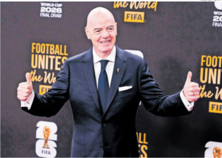
Gianni Infantino. Está seguro que la Copa del Mundo será todo un éxito.

SELECCIONES por vez primera jugarán el Mundial y se espera que sea una verdadera fiesta de fútbol y que los aficionados la disfruten.