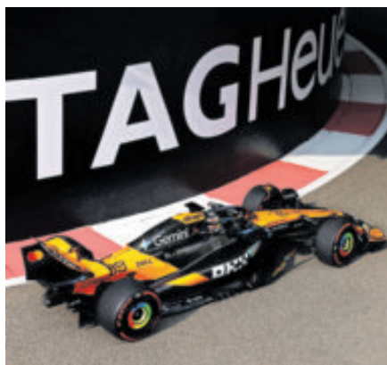
El martes vuelve a tomar un McLaren.