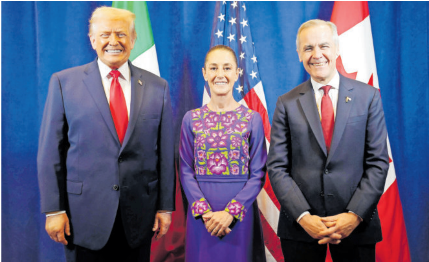
Donald Trump cumplió su reunión con Claudia Sheinbaum y Mark Carney, en el marco del sorteo del Mundial de Fútbol de 2026.