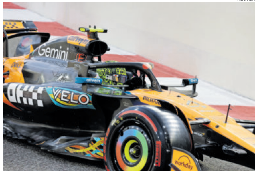
Marcó el mejor tiempo, tanto en la sesión vespertina como en la nocturna.

Sin embargo, la jornada no estuvo exenta de roce. Los comisarios señalaron a Verstappen por obstaculizar a Norris en un malentendido en pista, tras recibir el campeón información errónea de su ingeniero. "¿Qué hace este tipo? Casi me caigo", exclamó un Lando sorprendido por la radio. Aunque no hubo investigación, el incidente mostró la presión del momento.