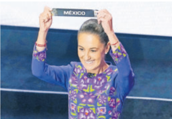
La presidenta Claudia Sheinbaum destacó el orgullo de ser el único país con tres Copas del Mundo.

El juego de la pelota aún se realiza en regiones mexicanas como Nayarit y Sinaloa, como símbolo de identidad cultural.