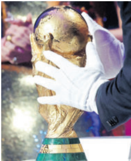
El codiciado trofeo. La Copa FIFA que estará en disputa el próximo año.