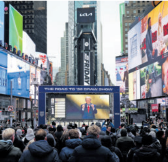
La expectación del sorteo fue en todo el Mundo. Aquí, aficionados de la Gran Manzana en Nueva York.