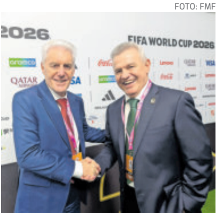
Broos y el Vasco. Amigos y rivales.

Con esa experiencia, 40 años después pero ahora como entrenador de Sudáfrica, volverá al Coloso de Santa Úrsula y su equipo disputará el primer partido del Mundial 2026, ante el Tricolor de Javier