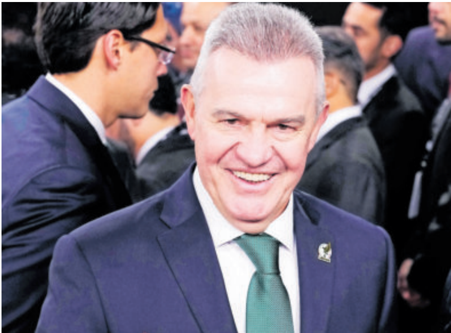
Javier Aguirre. No le agradó la duda sobre quién será el cuarto rival, pero...

por camino correcto, tengo una base del equipo, un 80 o 90 por ciento del equipo, hay que esperar a que tengan un buen semestre todos (los jugadores) y que surja alguna sorpresa”, adelantó.