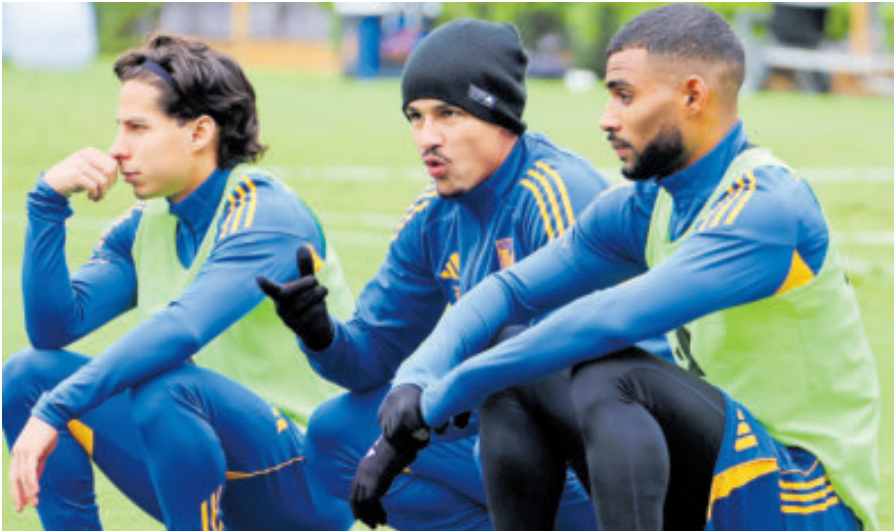
Los felinos apuestan a su condición de locales en el Universitario para sacar la victoria y el pase a la final, conscientes de la peligrosidad del Cruz Azul.