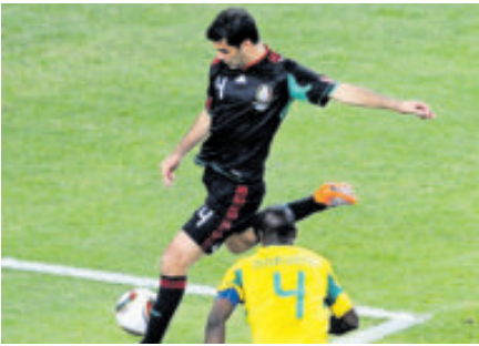
Rafael Márquez fue quien le anotó a Sudáfrica en la edición del 2010.