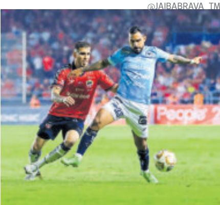
Hoy habrá campeón en Expansión MX.