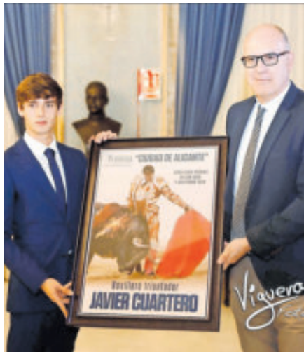
Es un novillero a seguir.