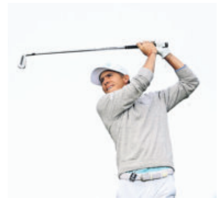
El mexicano era colíder.

PUNTOS DE ventaja tiene Lando Norris sobre Max Verstappen en el liderato de la F-1.