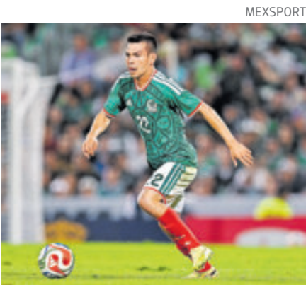
Hirving Lozano. Hay mucha confianza.

Los jugadores de la Selección mexicana emitieron comentarios luego de conocerse los rivales del Tricolor. Raúl Jiménez dijo que será importante imponer la localía y acabar como primeros de grupo para seguir jugando en México. En charla con TUDN dijo: “Es un grupo en el que se pueden sacar cosas positivas, pero primero es ganar y quedar primeros... Te da una cierta ventaja estar en el Bombole, vas a enfrentar la fase de grupos, la otra ventaja es que estás en México, va a ser complejo, vi que lo dijo Javier también, será analizar a los cuatro rivales de aquí a marzo y luego será con el que te toqué, planear, trabajar bien”.