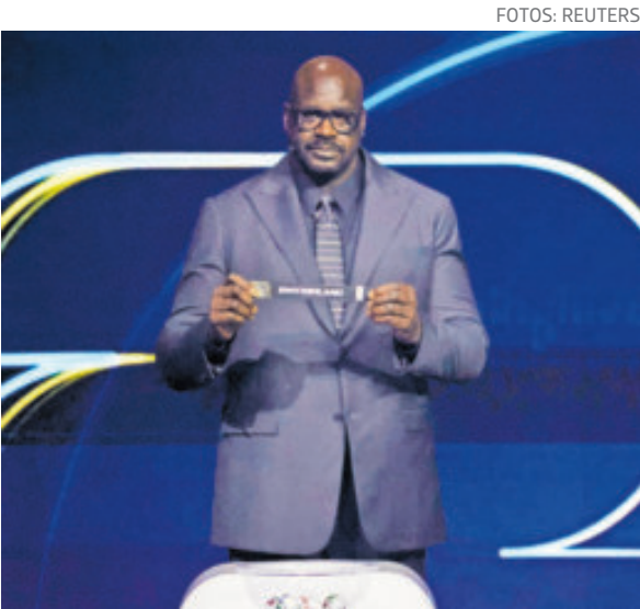
Shaquille O'Neal, de las figuras que fueron invitadas para sacar los nombres de los competidores.