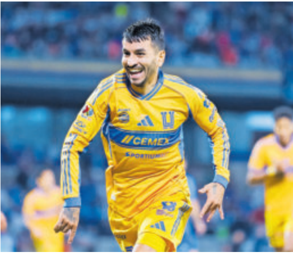
Tigres parece que tiene todo a favor, pero no debe confiarse porque si lo hace podría lamentarlo.

Aunque los Diablos en casa son letales y la prueba es que en el torneo regular le metieron 6-2 a los Rayados.