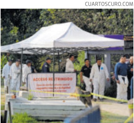
Cumplieron 8 jornadas de trabajo.

Tras alcanzar los dos metros de profundidad, localizaron diversos restos humanos que “podrían provenir de hospitales, así como fragmentos, microfragmentos y astillas de elementos óseos”.