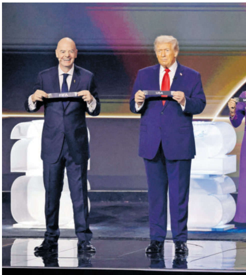
Infantino, Trump, Sheinbaum y Carney dieron el banderazo para sacar los nombres de las selecciones y armar los grupos para el Mundial del 2026.

El Grupo A disputará sus partidos en las sedes de Ciudad de México, Guadala-