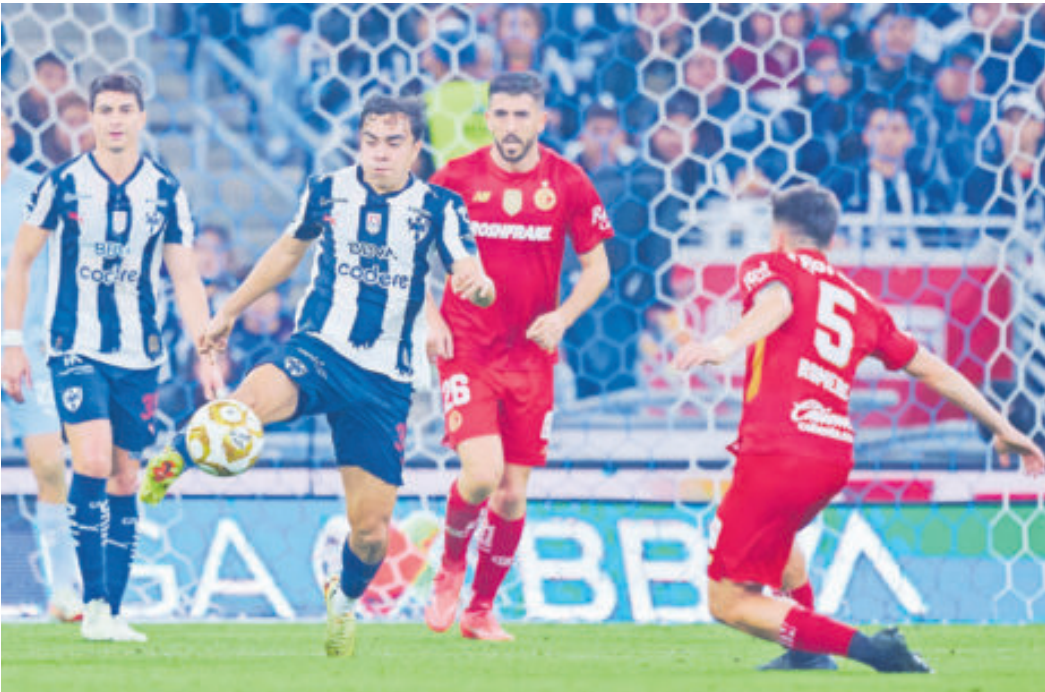
Toluca está en su casa y con apoyo de sus aficionados buscará derrotar a Rayados.