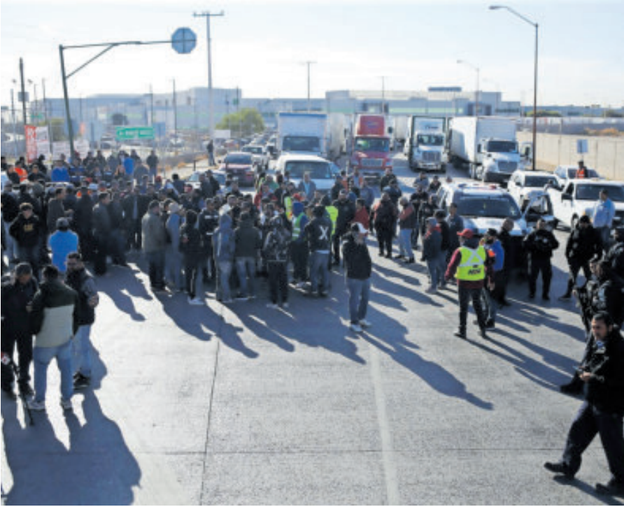
Durante 10 días, los manifestantes permanecieron vigilantes en el cruce.