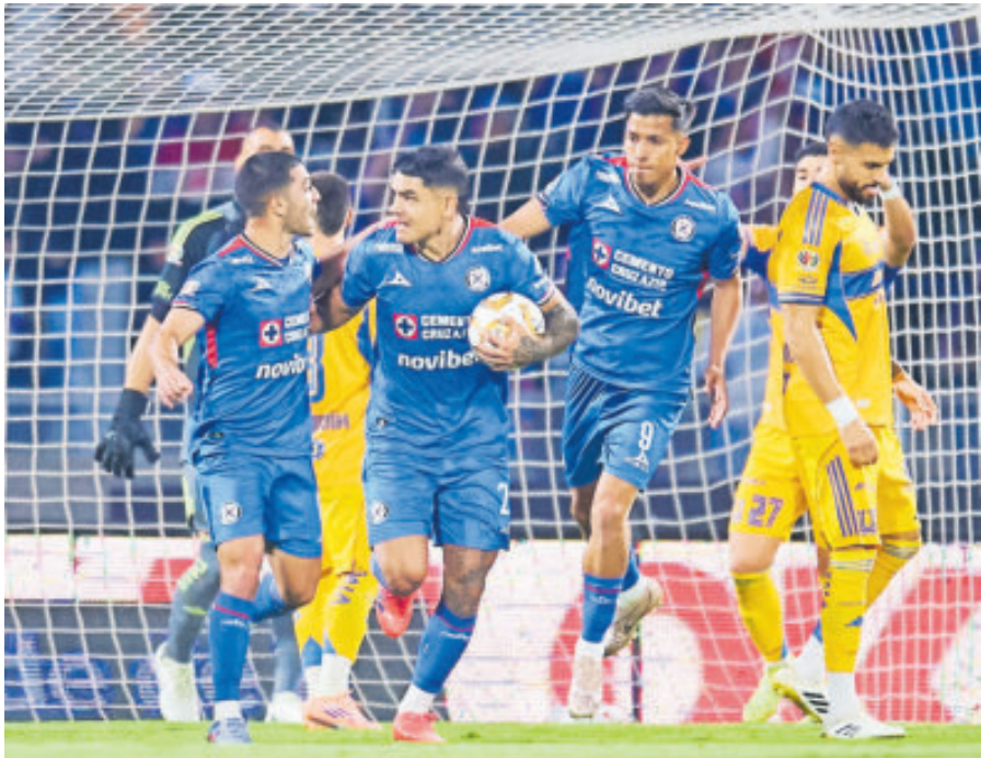
Cruz Azul no tiene de otra, debe ganar sí o sí en el Volcán para acceder a la final.