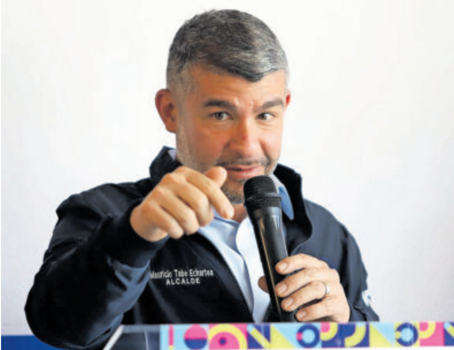
El alcalde de la Miguel Hidalgo dice no sentirse intimidado por el oficialismo.

SUBIERON LAS detenciones este año, según el reporte elaborado por la Fiscalía General de la CDMX y entregado al Congreso local.