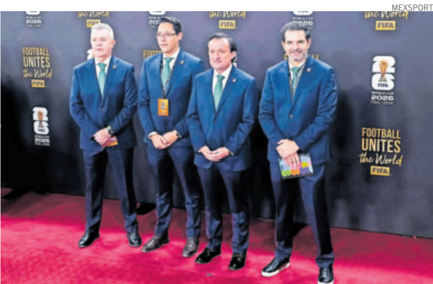
La delegación mexicana durante el sorteo mundialista. Salieron conformes.