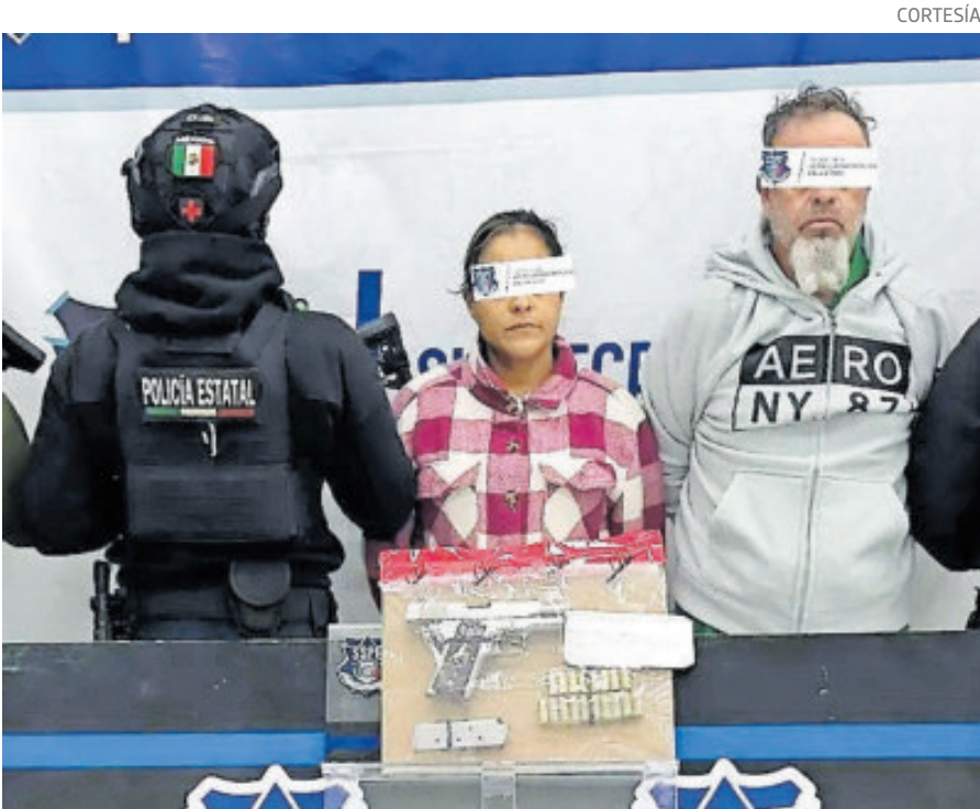
Era generador de violencia en el Valle de Juárez.

De acuerdo con las autoridades, la captura representa un golpe relevante a la estructura criminal que opera en el Valle de Juárez, ya que el Trini habría asumido el liderazgo del grupo tras la detención de