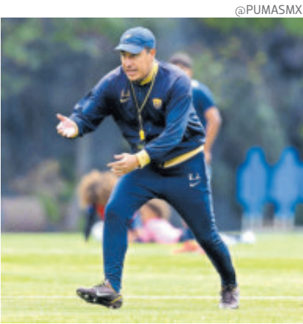
La calma volvió al cubil de Pumas.