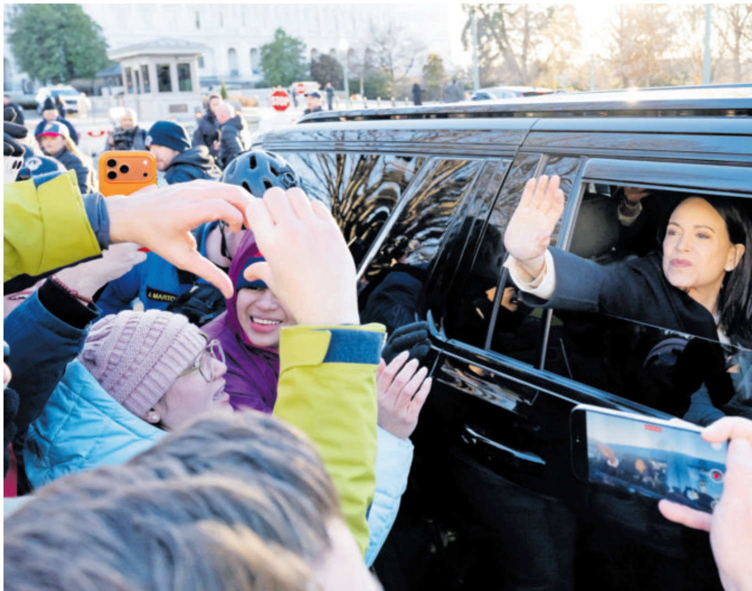
Machado saludó a sus simpatizantes al salir del Capitolio de Estados Unidos tras reunirse con senadores.