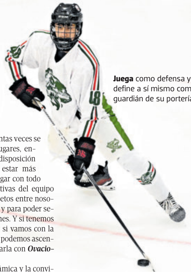
Juega como defensa y se define a sí mismo como un guardián de su portería.