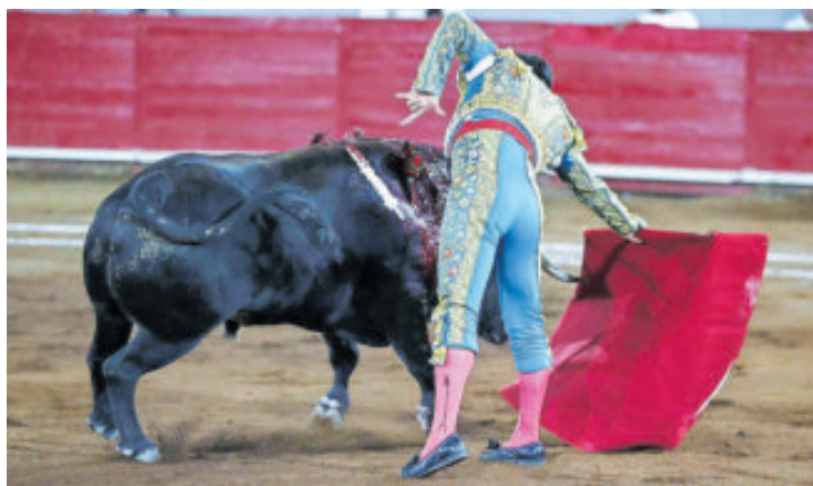
El Zapata se fue en blanco ante los dos toros que lidió.