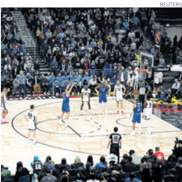
Uber Arena de Berlín albergó el Magic vs. Grizzlies.