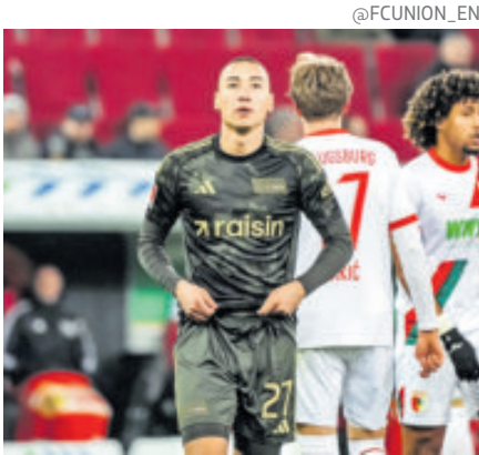
El Unión Berlín se quedó con amargo empate a un tanto frente a Augsburg.