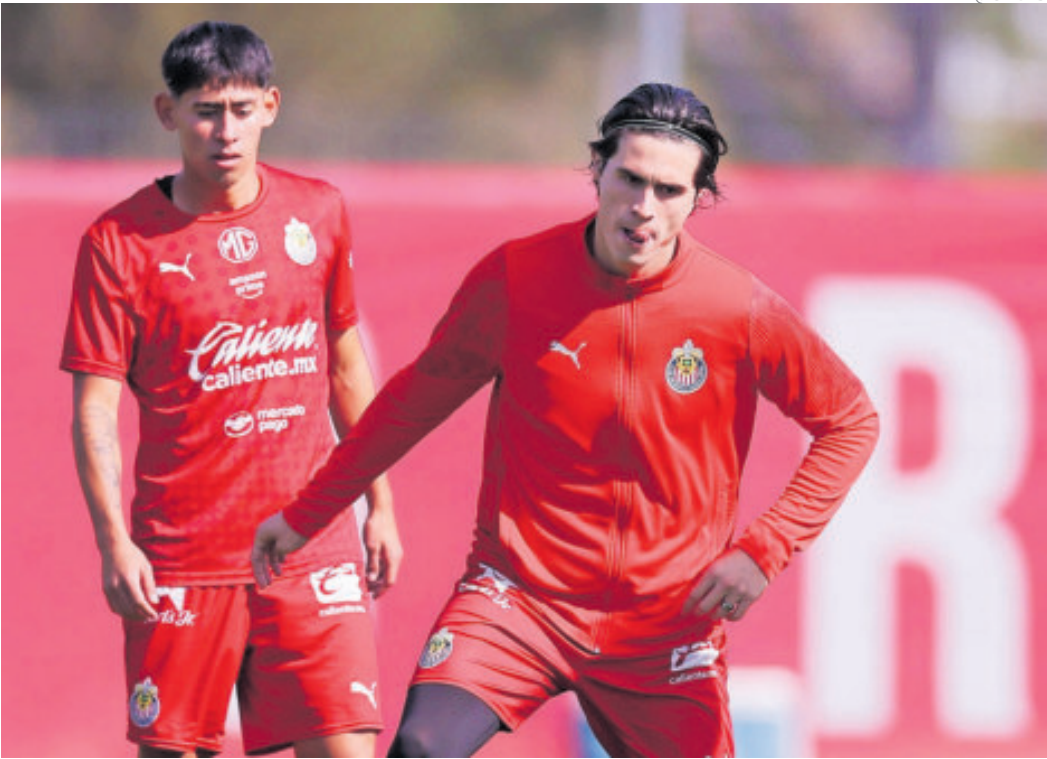
Guadalajara alista las armas para medirse a los Gallos Blancos y buscar su tercer triunfo.