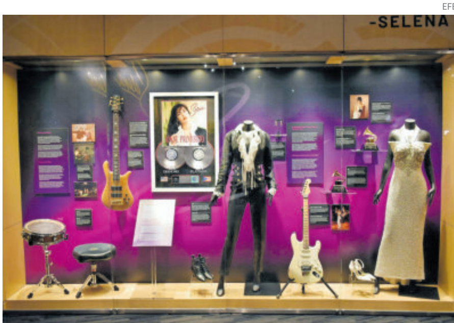
La exhibición abrió sus puertas al público ayer.

blico ayer y permanecerá disponible hasta el 16 de marzo.