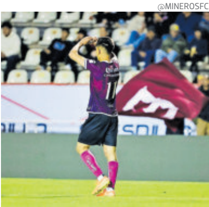
Zacatecas goleó a Tlaxcala en la J1.