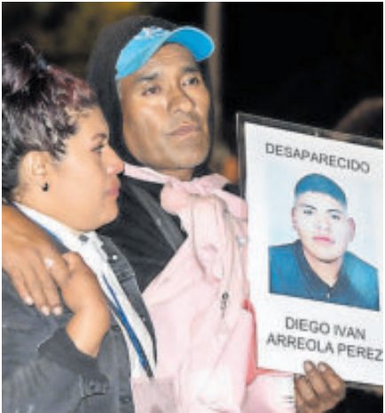
Familiares de desaparecidos piden justicia ante autoridades.