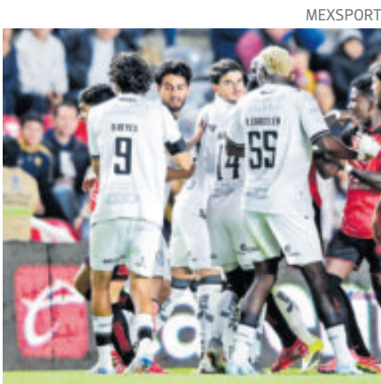
Querétaro cayó 1-2 ante Xolos de Tijuana el miércoles.