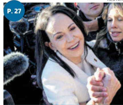
'Da' María Corina su Nobel a Trump