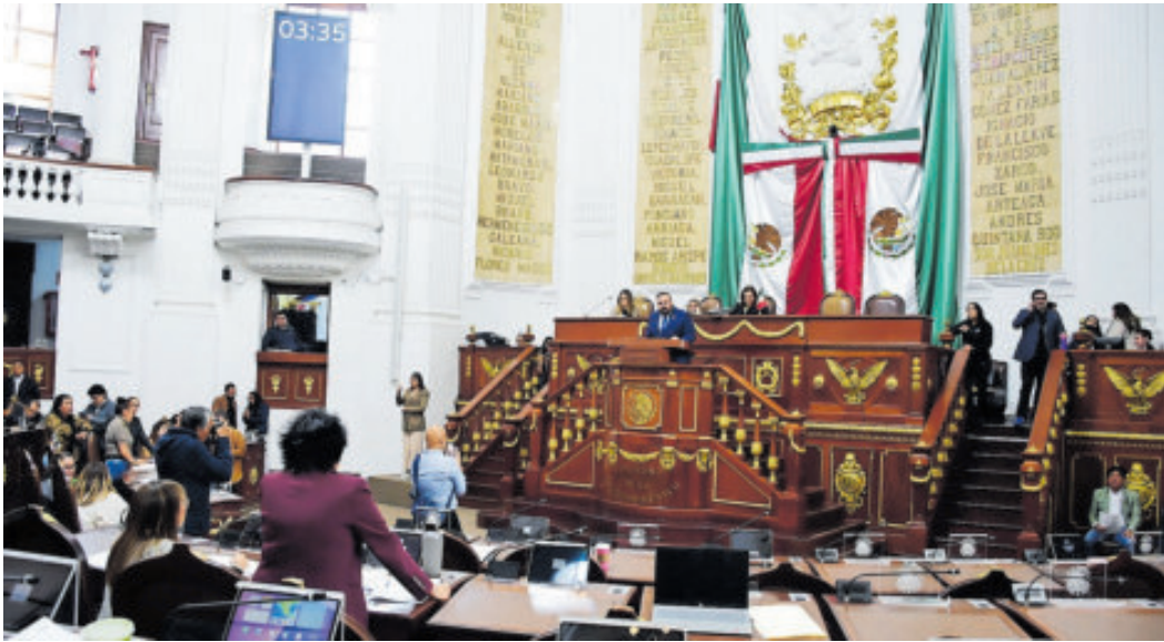
Desde el Congreso capitalino, legisladores critican el plan de desarrollo.