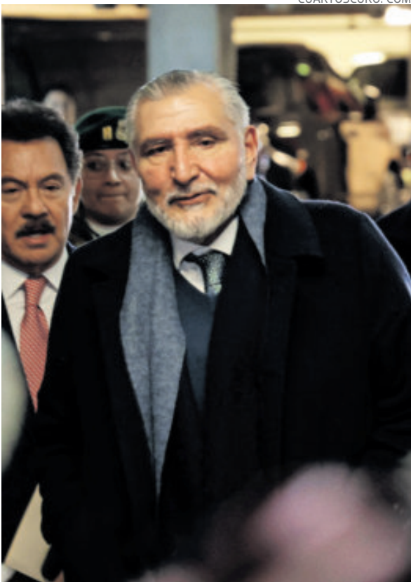
Adán Augusto vuelve al centro de la negociación.

Con la presentación de la iniciativa prevista para la primera semana de febrero, el desempeño del coordinador de Morena en el Senado de la República quedó sujeto a un escrutinio reforzado, no sólo por el contenido de la reforma electoral, sino por la forma en que se construyan los acuerdos y se eviten episodios que profundicen la desconfianza sobre el proceso legislativo.