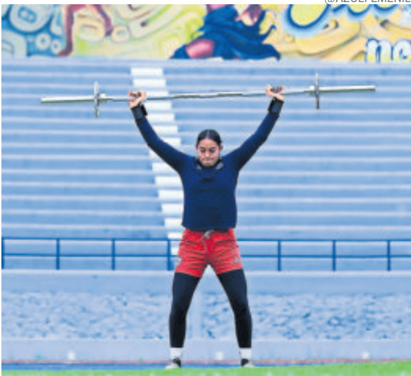
La Máquina recibe a las Tuzas del Pachuca.

Con la española, acompañada por Christina Burkenroad y la sudafricana Jermaine Seoposenwe, las regias tienen todo para superar a sus rivales, con una plantilla humilde, que viene de ser goleado 4-0 por Pachuca.