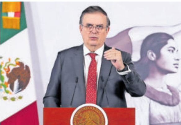
Marcelo Ebrard, secretario de Economía, ayer, en la mañana.

Ebrard precisó que actualmente 85 por ciento de las exportaciones mexicanas ya opera bajo el T-MEC, lo que refleja un ajuste de las empresas para evitar arance-