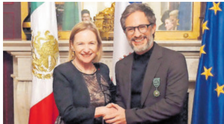
Es la distinción con mayor importancia que otorga la cultura gala.

El galardón no sólo reconoce su carrera, sino también su defensa de valores.