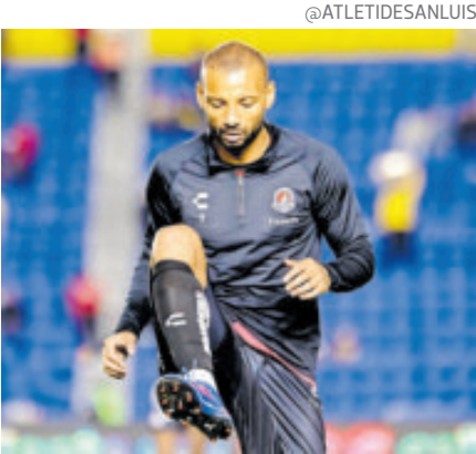
El brasileño fue campeón goleador el torneo pasado.