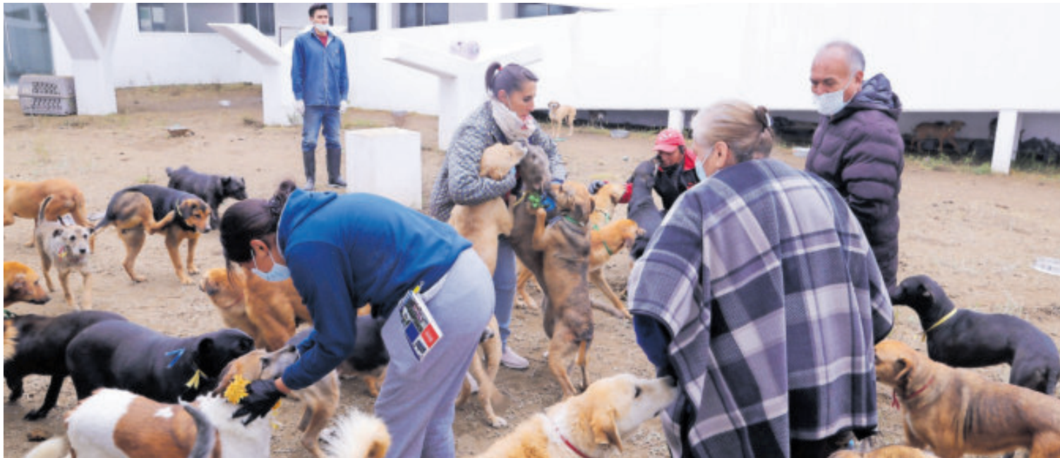
Momentos de la visita a los perros que se encuentran en un albergue temporal en el Ajusco.