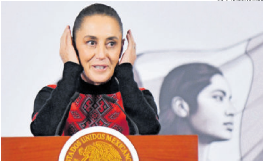
La presidenta Claudia Sheinbaum, ayer, en la mañanera.