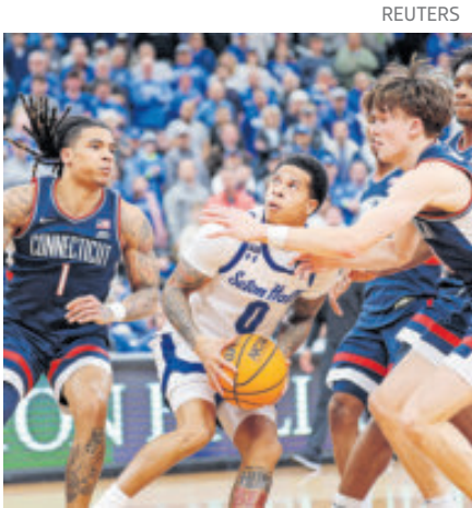
La NCAA está en el ojo del huracán.

Veinte hombres, incluidos 15 exjugadores de baloncesto universitario de la División I de la NCAA, han sido señalados en una acusación federal por participar en un esquema masivo de manipulación de resultados que involucró a 39 jugadores de 17 equipos y llevó a la alteración de 29 partidos, principalmente mediante point-shaving para fines de apuestas. La acusación fue revelada en el Distrito Este de Pensilvania, con cargos presentados ante un tribunal federal. El esquema comenzó alrededor de septiembre de 2022, inicialmente enfocado en partidos de la Asociación China de Baloncesto, y luego se trasladó al baloncesto universitario estadounidense. Los acusados ofrecían sobornos a jugadores que oscilaban entre 10 mil y 30 mil dólares para manipular encuentros, lo que permitía a los implicados ganar apuestas millonarias en casas de apuestas deportivas y defraudar tanto a estas como a apostadores individuales. “Este fue un esquema masivo que abarcó el mundo del baloncesto universitario”, afirmó el fiscal federal David Metcalf en una conferencia de prensa.