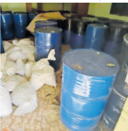
Fueron cuatro bodegas encontradas con precursores químicos.

En un comunicado aparte, la SSPC detalló que el aseguramiento ocurrió en dos acciones diferentes, durante un recorrido terrestre en el que se localizó la bodega con aproximadamente 24 mil 920 litros y