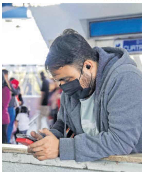
El tricolor acusa que los datos personales de millones están en riesgo.

Asimismo, rechazó que este tipo de registros tenga un impacto real en la disminución de delitos como la extorsión o el fraude. Por el contrario, advirtió que la