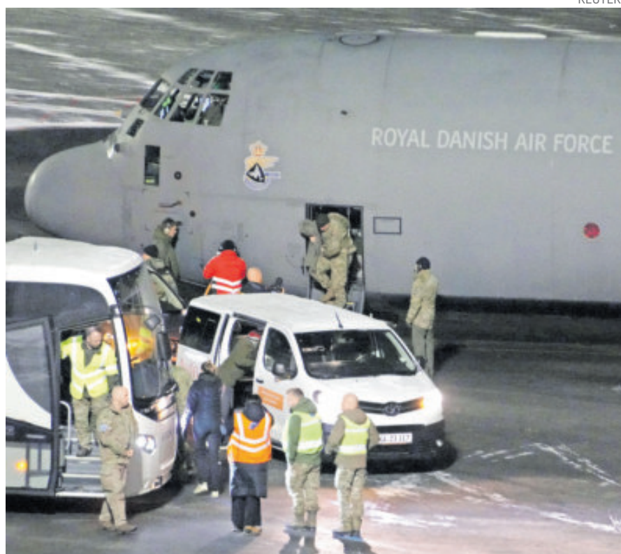
Un avión de la Real Fuerza Aérea Danesa aterrizó en el aeropuerto de Nuuk.

“La ambición estadounidense de apoderarse de Groenlandia está intacta”, dijo la primera ministra danesa, Mette Frederiksen, describiendo un “desacuerdo fundamental”.