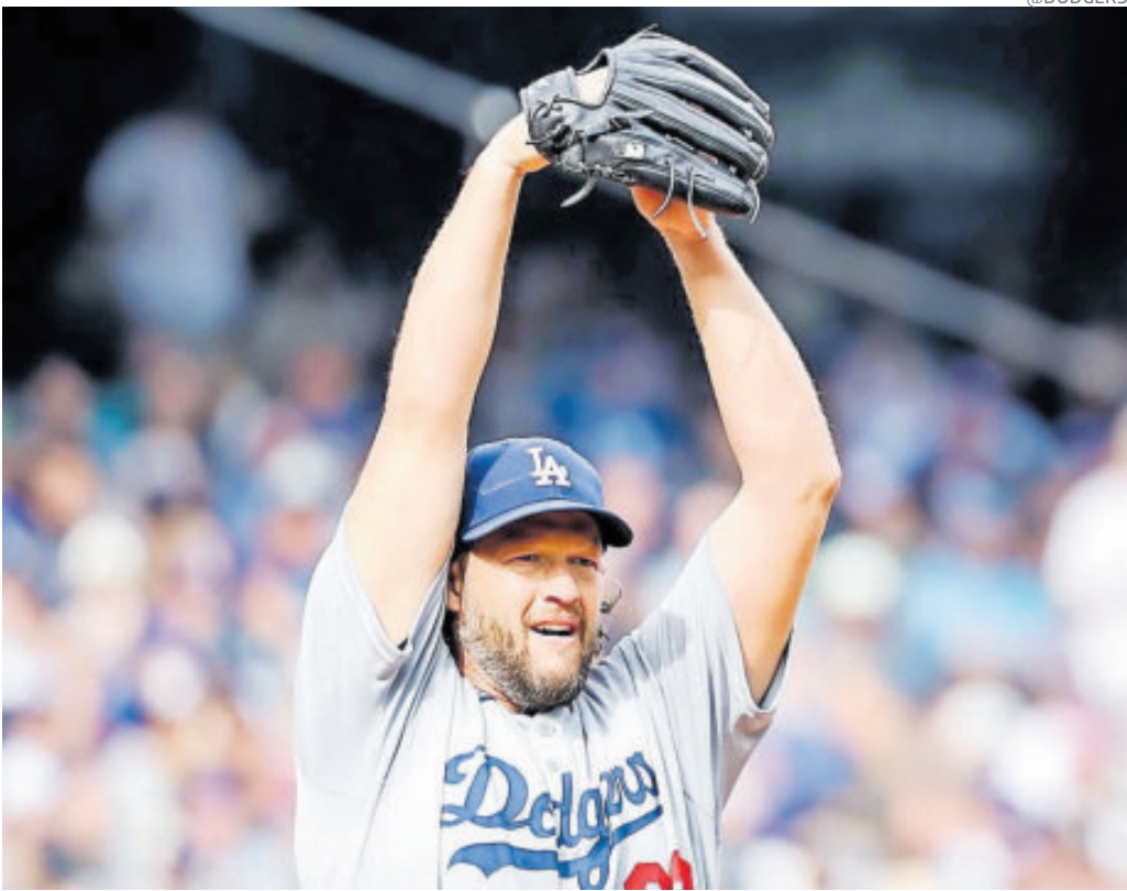
Kershaw sólo lanzó 2.1 entradas como relevista con Dodgers en los pasados playoffs.