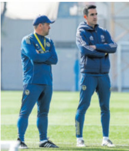
André Jardine. Les urge un triunfo.

Está claro que América necesita más plantel, lo cual se confirmó tras la derrota 0-2 ante San Luis en casa. Porque entre jugadores que se la pasan lesionados y los que están activos tienen un bajo nivel, las Águilas han tenido un desastroso inicio de