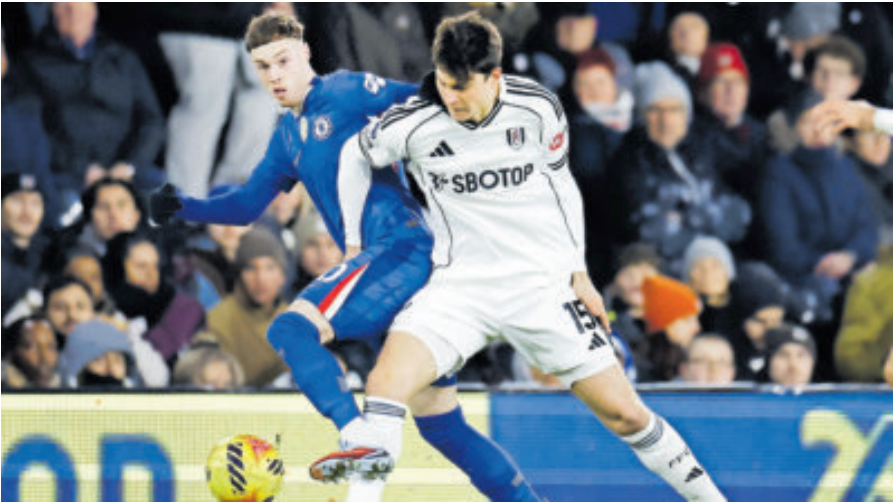
El fútbol inglés utiliza líneas más grandes y eso lo hace más flexible que ligas como las de España, Alemania o Italia, que hacen más estricto un señalamiento.