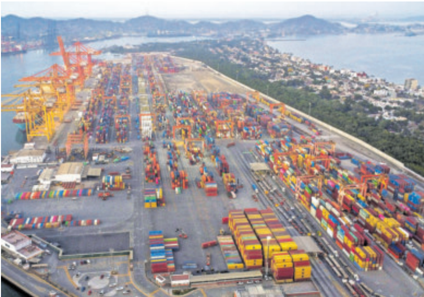
Aduana de Manzanillo, a donde llega una gran parte de artículos extranjeros.

En el desglose, el Instituto indicó que el desempeño del consumo de bienes y servicios estuvo impulsado por el importado,