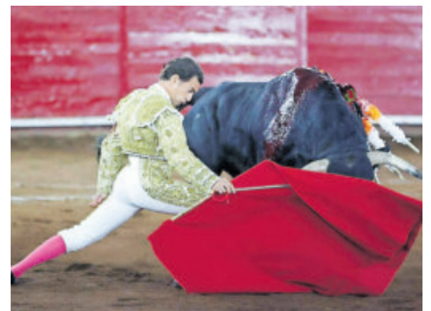
La corrida cumplió en la plaza Alma Barragán.