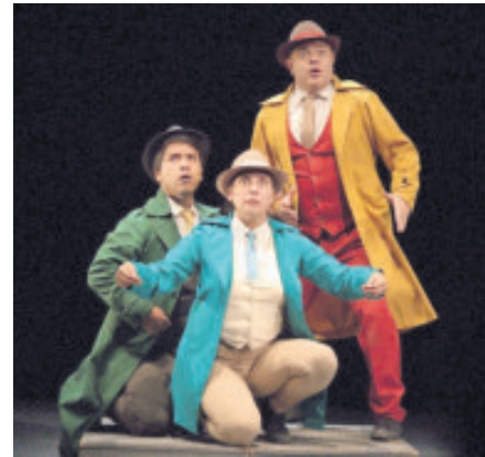
La obra es gratis en el Teatro Hidalgo.

La exposición rinde homenaje a una de las figuras mexicoestadounidenses más influyentes de la historia de la música.