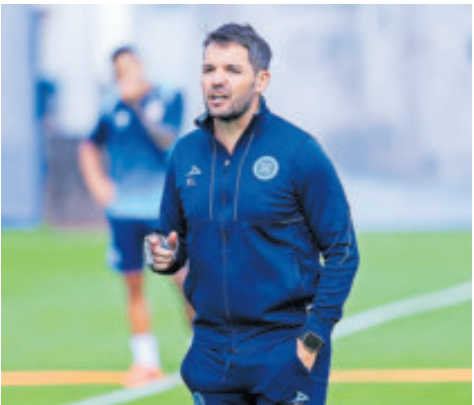
El técnico de la Máquina tiró para todos lados tras su primer triunfo del torneo.

Porque su compatriota, el charrúa Alonso,