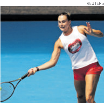
La bielorrusa va ante Rakotomanga.

jueves en el Melbourne Park, Novak Djokovic, 10 veces campeón y cuarto cabeza de serie, quedó encuadrado junto al español Pedro Martínez (71) para la ronda inicial que comienza el domingo.