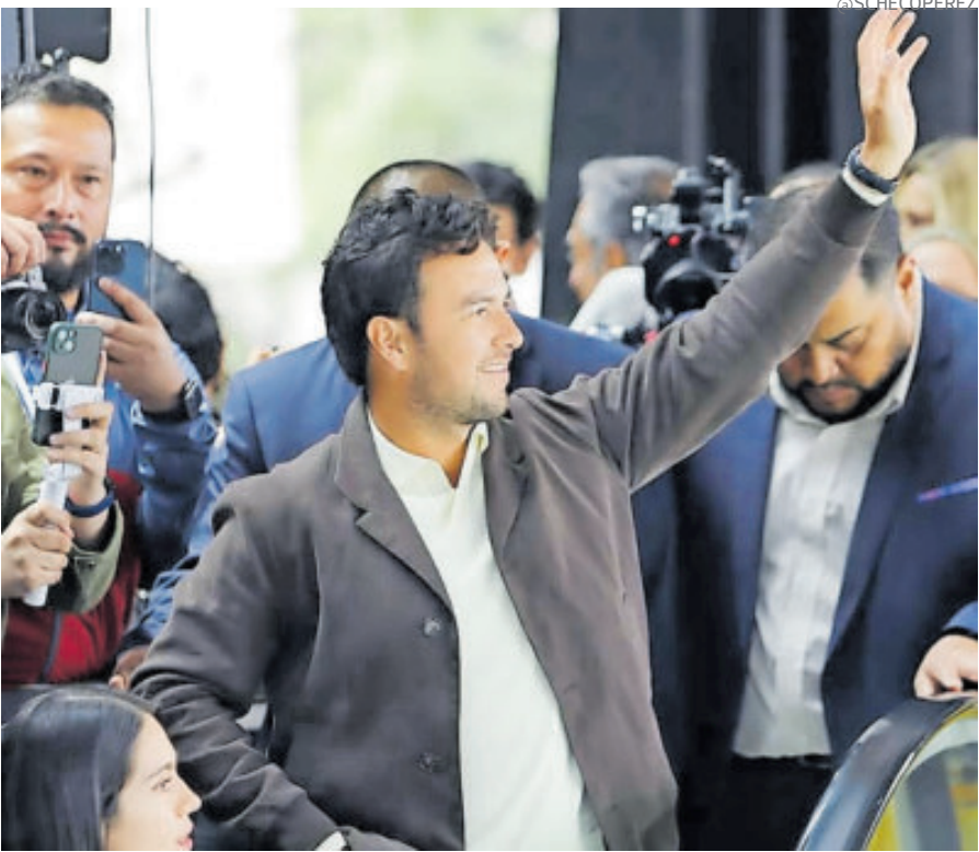
Está emocionado por la nueva oportunidad que tiene en la Fórmula 1.