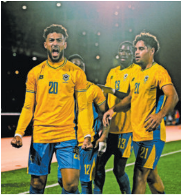
Las Panteras se despidieron del torneo africano con tres descalabros y siete goles en contra.

Mozambique, que nunca había pasado una fase de grupos en el torneo, se ade-