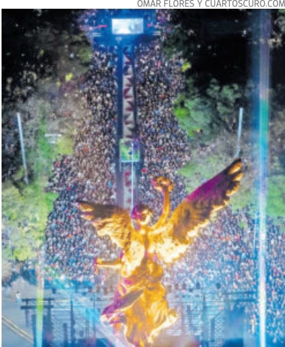
Una gran pista de baile fue Paseo de la Reforma.

El análisis territorial revela diferencias significativas entre demarcaciones territoriales. Las de mayor participación fueron Benito Juárez, con 76.41%; Coyoacán, con