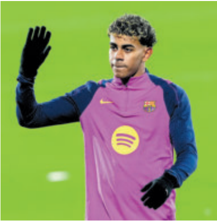
Al parecer tuvo algunos malestares.