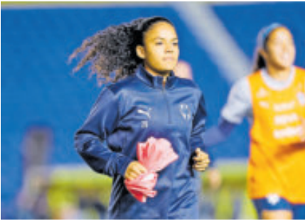
Bosch tuvo un buen Apertura 2025, pero se lesionó en la Liguilla.

Las próximas horas serán determinantes en un movimiento que elevaría la calidad del plantel americanista.