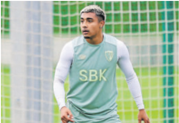
El mexicano ha tenido poca actividad con Bournemouth y busca minutos de cara al Mundial 2026.

El defensa mexicano quiere aprovechar la proyección que podría darle firmar contrato con el Celtic, toda vez que es el conjunto más grande de aquel país al lado del Rangers FC, ambos empatados con la mayor cantidad de títulos ligeros