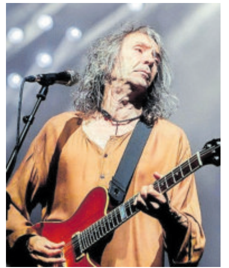
Fue figura central del rock español desde finales de los años ochenta.

El verano trajo un respiro breve, interrumpido en agosto por el fallecimiento de Xava Drago, vocalista de Coda, ocurrida el 21 de ese mes. Su despedida resonó con fuerza entre quienes crecieron en los años noventa, cuando el hard rock encontró nuevos públicos y escenarios. El anuncio de un homenaje póstumo confirmó la dimensión colectiva de la pérdida.