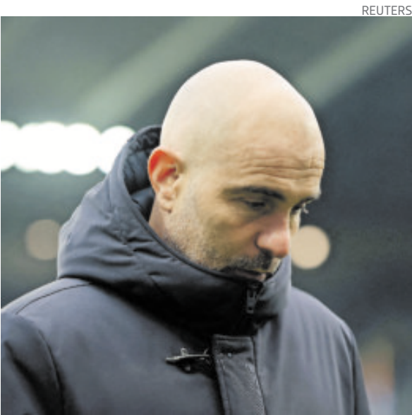
Los resultados no se le dieron en el último mes.

Cada presión, cada pérdida que provocó por su intensidad, fue celebrada en la grada como prácticamente un gol. El público en pie, entusiasmado con la fuerza con la que se desplegó su equipo sobre un rival 'superior' No se notó en la primera parte. Es fútbol. Incluso, el Sunderland dispuso de las mismas ocasiones que el City, aplacados muchos de sus hombres más diferenciales por el conjunto local: Cherki, Foden, Haaland... Y eso merma mucho a su equipo. Haaland, tan desaparecido como Cherki en la primera parte, tuvo su oportunidad, pero Roefs se cruzó acertado a su remate. No es un gol que suela fallar el atacante noruego.