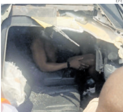
Anthony Joshua se salvó de milagro después del choque del lunes pasado.

El accidente ocurrió el pasado lunes en la autopista Lagos-Ibadan (que conecta Ogun y La-