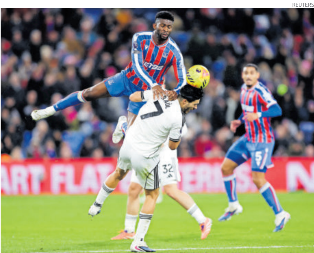
El Lobo de Tepeji recibió varias faltas durante el desarrollo del partido.