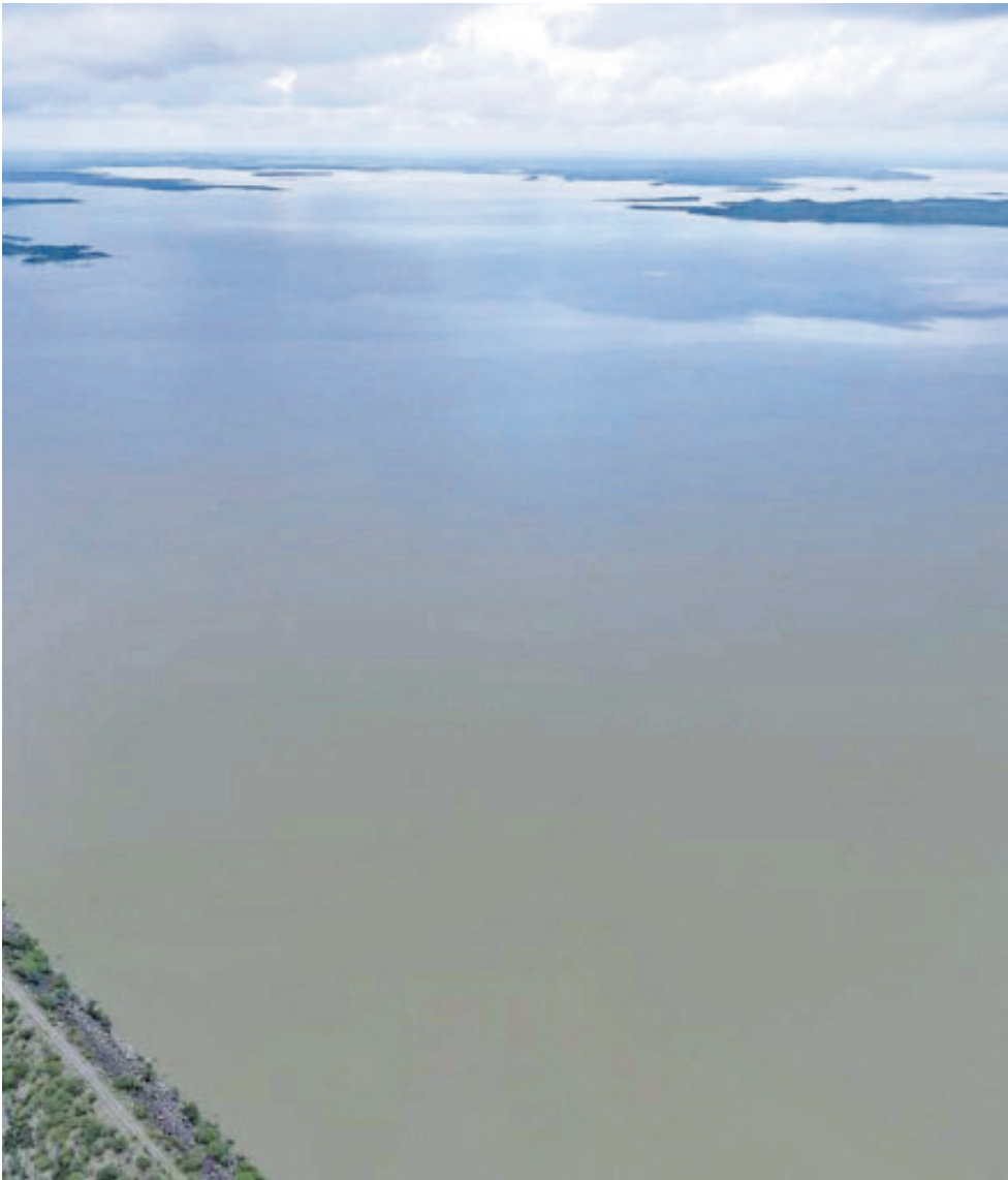
La presa el Cuchillo, a su máxima capacidad semanas atrás.

De manera paralela, Donald Trump apareció como catalizador del conflicto con un libreto reconocible, basado en el emplazamiento público y la amenaza discursiva, al acusar a México de incumplir el Tratado de Aguas de 1944 y al insinuar consecuencias comerciales si los volúmenes pendientes no fluían antes del cierre del año. El discurso del mandatario estadounidense se combinó cifras, imágenes de ríos contaminados y referencias sanitarias para construir una narrativa de urgencia dirigida a su base política, en un contexto donde el tratado binacional establece ciclos quinquenales de entrega y contempla ajustes ante sequías extraordinarias. Frente a esa presión, la postura mexicana se sostuvo sobre el terreno técnico y jurídico, con una Cancillería que colocó el tratado como único marco válido de diálogo y una Presidencia que condujo la negociación desde la premisa de la disponibilidad real del recurso y la protección del consumo humano y agrícola en la frontera. El acuerdo anunciado a mediados de diciembre abrió la puerta a la liberación de poco más de 249 millones de metros cúbicos de agua a partir del día 15, volumen respaldado por las lluvias recientes y alineado con las capacidades de infraestructura, bajo un calendario que extendió plazos y ordenó la gestión