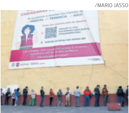
Las ventanillas están abiertas.