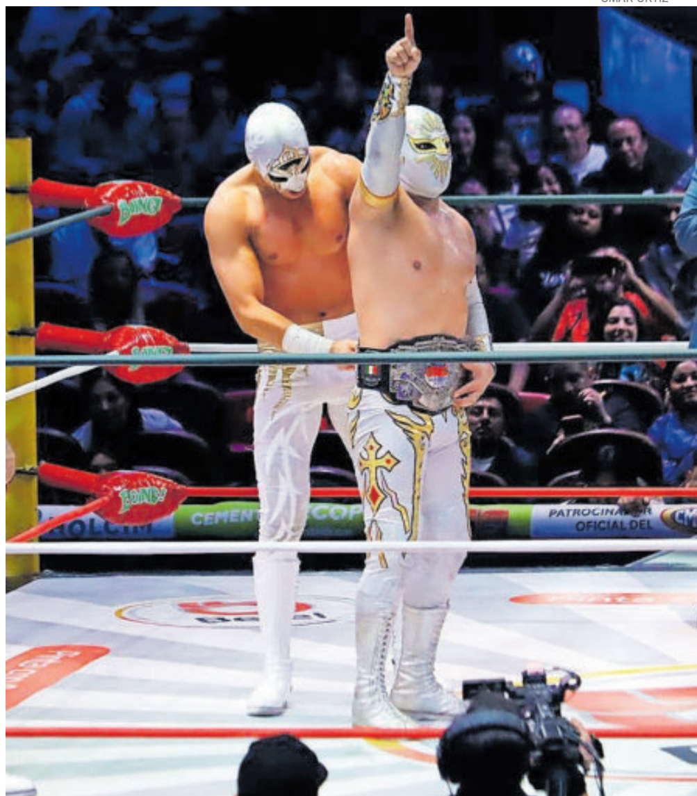
Místico atrae multitudes en cada arena en la que se presenta.

“Soy un luchador que ama la lucha libre día a día. Los días que descanso en lugar de hacerlo vengo a entrenar. Ha sido