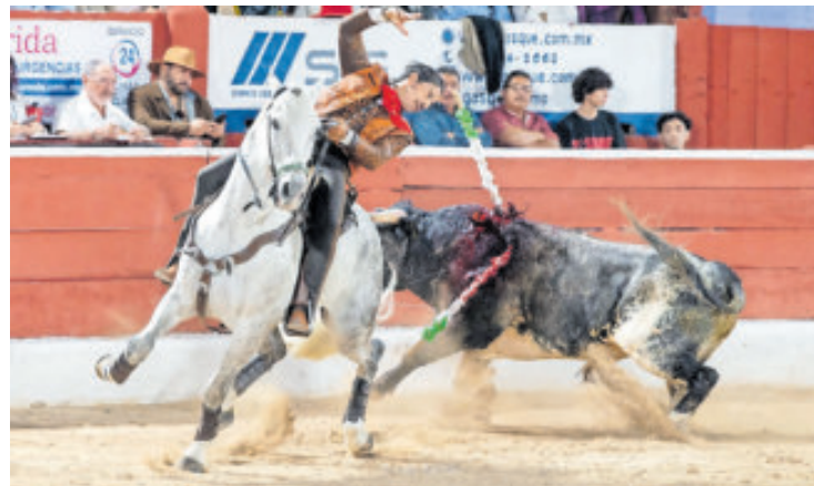
El rejoneador mostró temple, con pasajes de buen gusto.