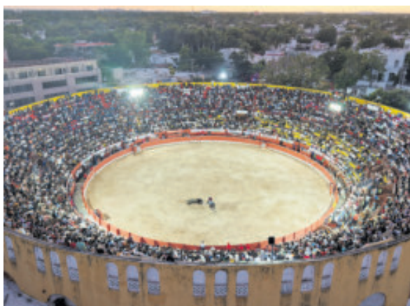
Lleno hasta las lámparas registró la plaza de Mérida.

Emiliano Gamero, vuelta al ruedo en su lote. Cuauhtémoc Ayala, vuelta al ruedo y oreja. Guillermo Hermoso de Mendoza, vuelta al ruedo en su lote.