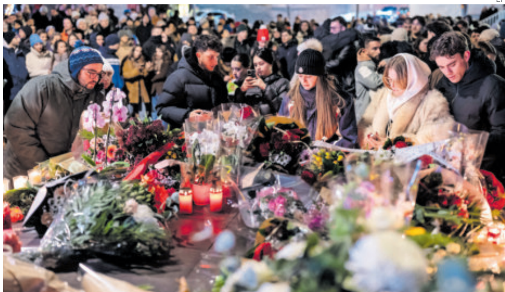
Cientos de personas dejaron una ofrenda.

El presidente suizo, Guy Parmelin, describió el desastre como "una de las peores tragedias que ha conocido nuestro país" y dijo que la mayoría de los muertos eran jóvenes.