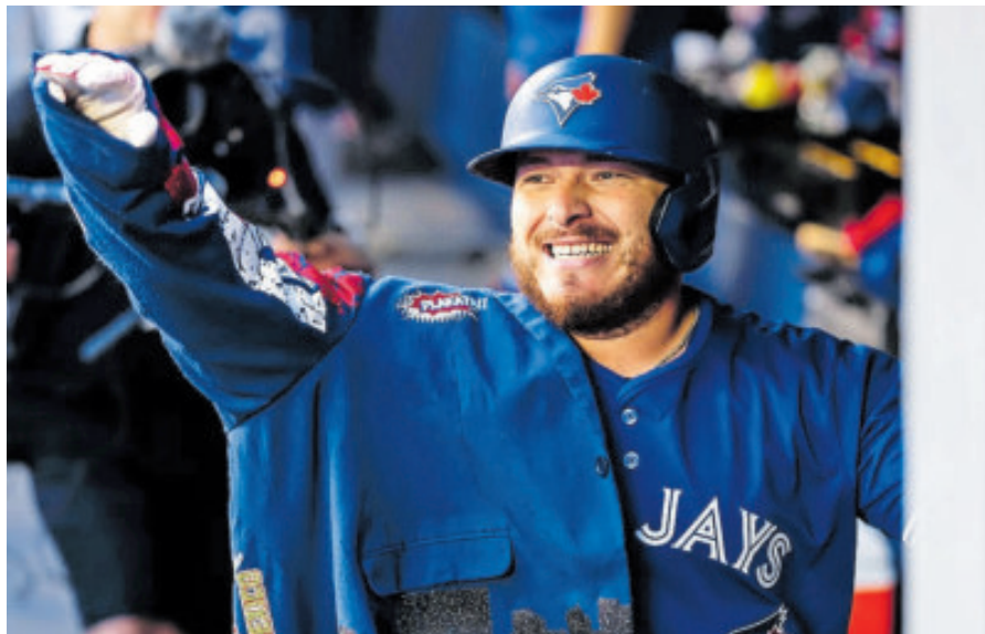
El receptor Alejandro Kirk disputó la última Serie Mundial de la MLB.

La novena mexicana comienza a armarse de cara al Clásico Mundial de Beisbol 2026 y por los pronto ya aseguró a estas tres estrellas