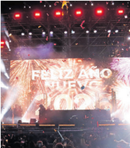
Ambiente de primera le dio la bienvenida al 2026.