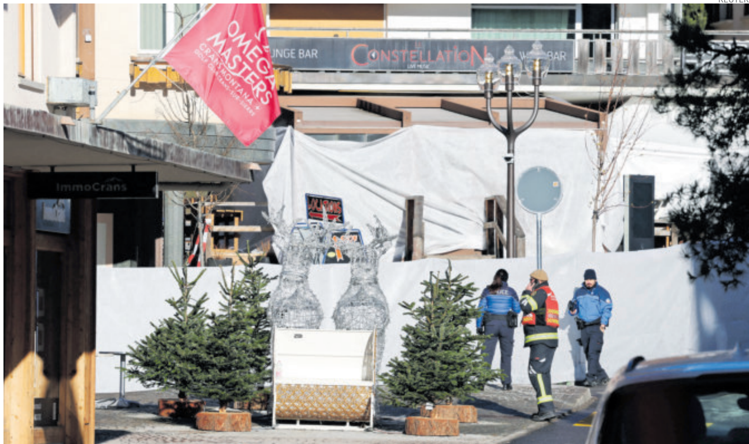
Autoridades descartaron un ataque dentro del bar donde se celebraba la llegada del 2026.

PERSONAS resultaron heridas; muchas de ellas se encuentran en estado grave, según autoridades.