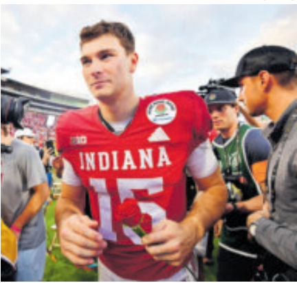
El mariscal de campo se lució en la victoria sobre Alabama.