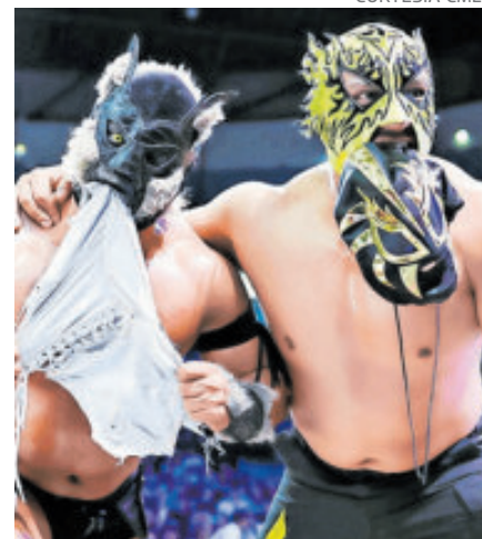
Después de 17 años, ahora tiene más experiencia para volver a este torneo.