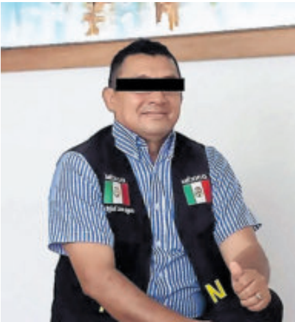
Debe permanecer un año en prisión domiciliaria.