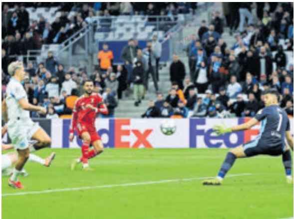
Liverpool logró un triunfo que confirma su mejora.

Un gol en la última jugada del partido de Bahlul Mustafazada arrima al Qarabag (3-2) a las eliminatorias por la continuidad en Champions y deja fuera al Eintracht Fráncfort, en caída libre tanto en la Bundesliga como en el torneo europeo.