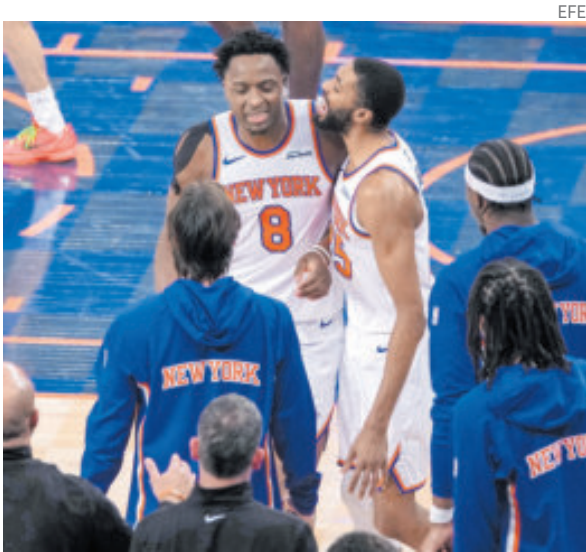
La victoria apaciguó una crisis de malos resultados.

EL CAMPEONATO 2026 comenzará el próximo domingo 1 de marzo en el circuito callejero de St. Petersburg.