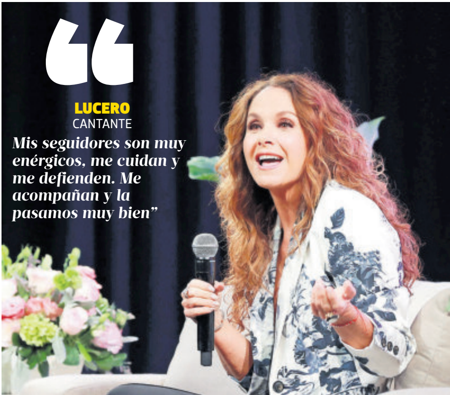
Ganan los buenos momentos a los malos.

La cantante y actriz mexicana Lucero vive “muy ilusionada” por llevar 46 años en los escenarios, fecha que celebrará el próximo marzo con un concierto en Ciudad de México que consistirá en un “viaje hasta sus inicios” para repasar las décadas que lleva componiendo canciones. “Es un viaje a través de la música, recordando literalmente desde que era yo una niña, cuántas canciones y cuántas historias hemos compartido”, afirmó ayer en la rueda de prensa para presentar el show Siempre Contigo , que tendrá lugar el próximo 27 de marzo en el Auditorio Nacional. Conocida como la Novia de América , la artista adelantó que su próxima actuación será “muy especial”, una manera de “refrescar” a sus seguidores con todo su repertorio, desde baladas y música pop hasta temas de mariachis. Lucero, quien empezó desde niña trabajando en programas infantiles en la televisión, destacó que Siempre Contigo es una oportunidad para “poder estar cerca de la gente” y sentir su “enorme cariño”. “Mis seguidores son muy enérgicos, me cuidan y me defienden (...) Me acompañan y la pasamos muy bien, así que tengo mucha emoción e ilusión de que esto sea como una fiesta para todos”, dijo. La autora de canciones como El privi-