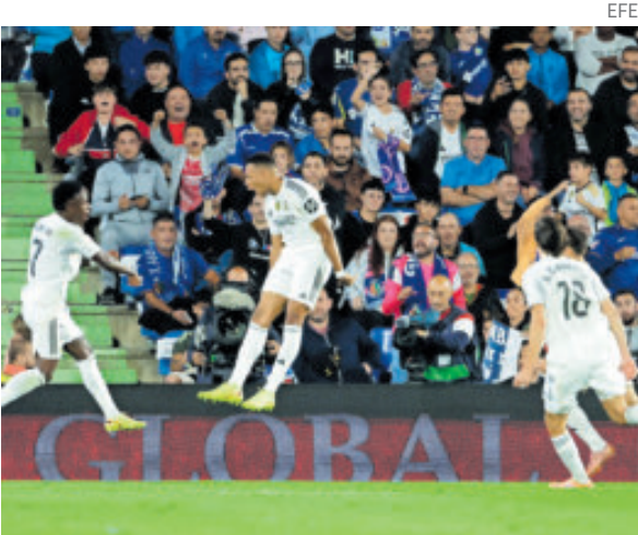
El Real Madrid lidera la lista de equipos con mayores ingresos durante la temporada 2025-2025.

Los capitanes del Manchester City, Rúben Dias, Rodrigo Hernández, Erling Haaland y Bernardo Silva decidieron reembolsar el precio de la entrada, alrededor de 25 libras (28 euros), a los aficionados que se desplazaron a Noruega para presenciar su derrota contra el Bodo/Glimt. Estos cuatro jugadores se han comprometido a abonar 9 mil 357 libras a los 374 aficionados que viajaron a Bodo. Esto supone unas 25 libras por persona por el coste de la entrada y no considera desplazamientos ni alojamientos.