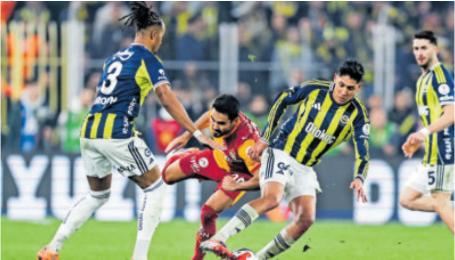
Edson Álvarez tendrá un buen duelo cuando reciban al Aston Villa, un rival de mucho peligro, y buscará ayudar a su escuadra a buscar su calificación.

El presidente de Senegal, Bassirou-Diomaye Faye, premió a los jugadores de su selección, los Leones de la Teranga, con el pago de 75 millones de francos CFA (cerca de 115 mil euros) y la entrega de terrenos a cada uno por conseguir el domingo en Marruecos su segunda Copa de África, una victoria que ha desatado la euforia en el país.