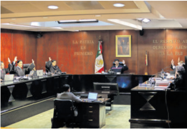
Los ministros de la Suprema Corte, ayer, durante la sesión.

Esto implicaría una reducción de condena y, por ende, la liberación