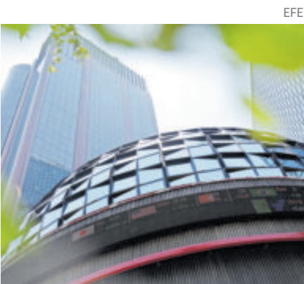
La de este miércoles fue una jornada histórica en la Bolsa Mexicana.

Entre las 35 emisoras que integran el Índice, 22 cerraron en terreno positivo, y los avances destacados correspondieron a Megacable, BanBajío y la aeroportuaria OMA; mientras que Peñoles, Inbursa y Grupo México registraron los retrocesos más relevantes. El lunes 19 de enero, el índice S&P/BMV IPC de la Bolsa Mexicana de Valores ganó 0.49% y se ubicó en 67 mil 467.82 puntos.