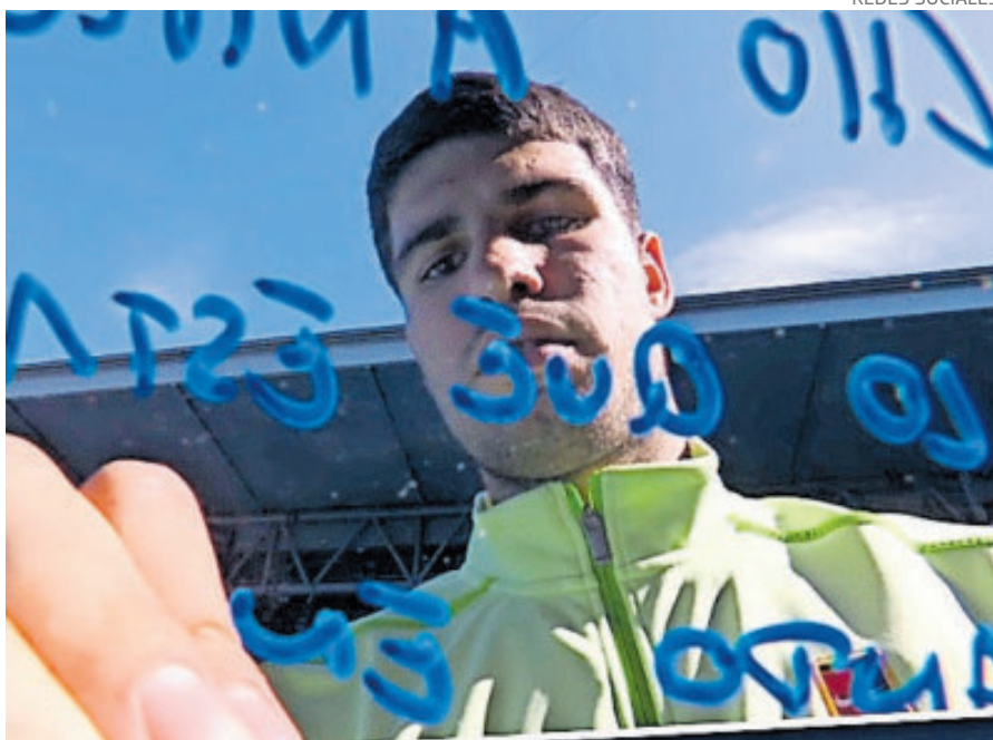
Carlitos no dejó pasar la oportunidad de escribir un mensaje de aliento.