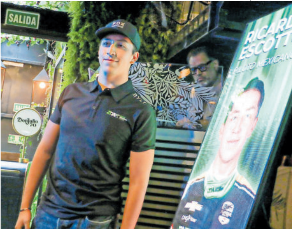
Para Escotto será su segunda etapa con el equipo de origen argentino.