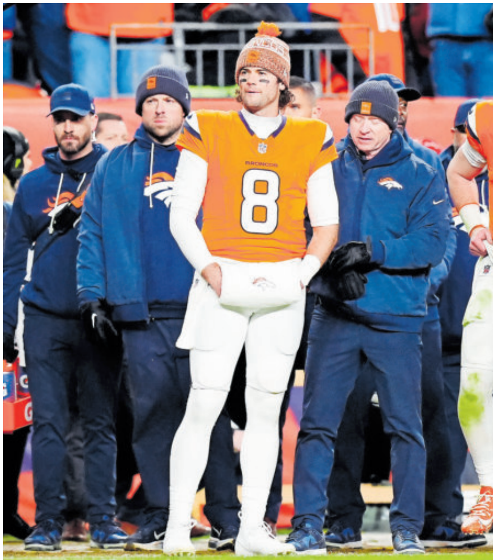
Stidham primero tiene la dura tarea de ganar la final de la Conferencia Americana a New England el domingo en el Empower Field at Mile High.

Aunque el desafío es monumental, la historia de la NFL demuestra que en 10