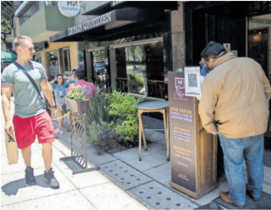
La aceleración que observaría la economía estaría apoyada por la industria del comercio y servicios.

EL 82% de la exportación de tequila se fue a Estados Unidos el año pasado.