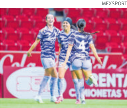
Buena victoria de las Amazonas del Norte en patio ajeno.