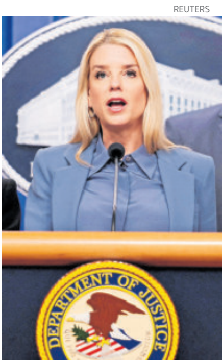
Pam Bondi, fiscal general de Estados Unidos.

miembros de organizaciones terroristas extranjeras que han pasado años acosando al pueblo estadounidense”, declaró la fiscal general estadounidense, Pam Bondi, en un comunicado. La funcionaria agregó que esta transferencia de presos es “otro logro histórico en la misión de la administración de Trump para destruir a los cárteles”. Para el director del FBI, Kash Patel, la noticia es “un ejemplo más del trabajo incansable y las alianzas del FBI en Estados Unidos y en México”. Por otra parte, el titular de la Agencia antidrogas (DEA), Terrance Cole, señaló que “la importancia de esta transferencia es innegable” y agregó: “Agradecemos al Gobierno de México su apoyo”. Esta fue la tercera entrega de presos del crimen organizado a Washington bajo el gobierno de Sheinbaum, que enfrenta fuertes presiones por parte de Trump, quien, aunque ha expresado respeto por la Presidenta, ha insistido en que México “no hace lo suficiente” para combatir a los carteles.