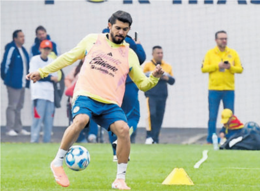
En el entrenamiento de este miércoles se vio a Henry Martín trabajar al parejo.

La principal, Alejandro Zendejas, quien se mantiene por separado y es fecha que aún no tiene minutos en el Clausura 2026,