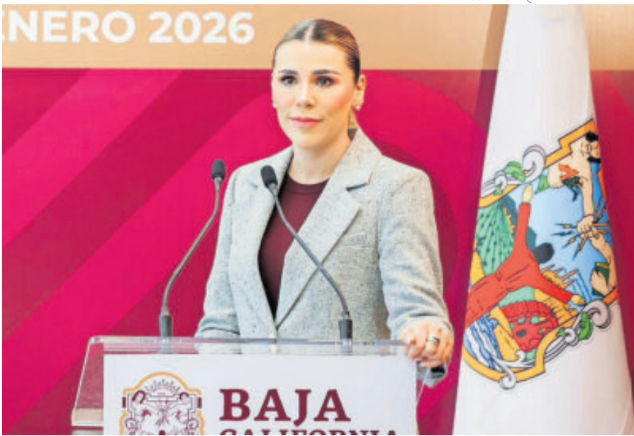
La gobernadora de BC, Marina del Pilar Ávila, en conferencia.

EMPRESARIOS pidieron aumentar la seguridad ante el temor del ingreso de pandilleros por el sur.