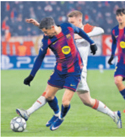
Robert Lewandowski cerró la cuenta y se sacó la espina de un autogol.

Al Barça le costó casi media hora controlar el choque y empezar a vivir en campo contrario. Y Eric García, con un disparo desde la frontal, puso a