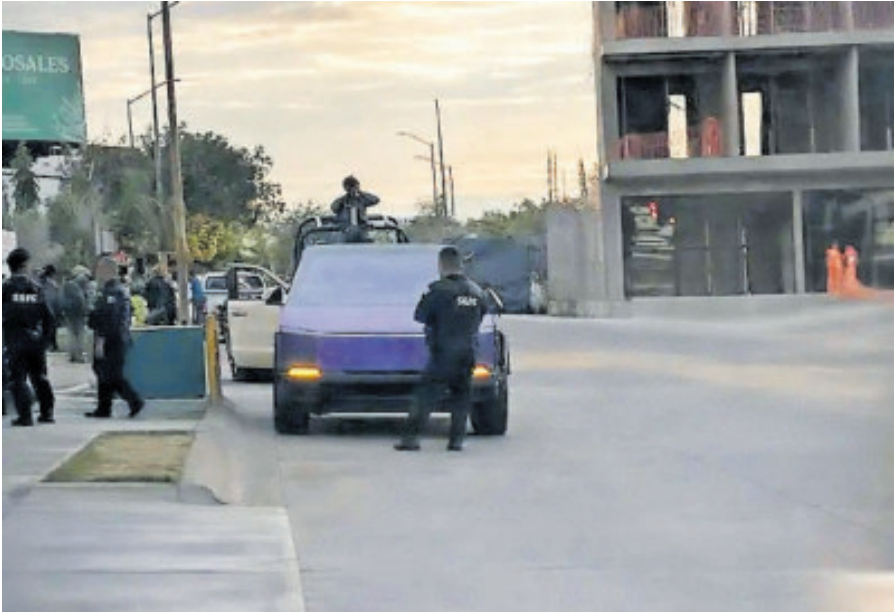
La joven manejaba esa camioneta Tesla al momento del plagio.

La desaparición de la joven ha generado inquietud en redes sociales y en la comunidad local, especialmente por la difu-