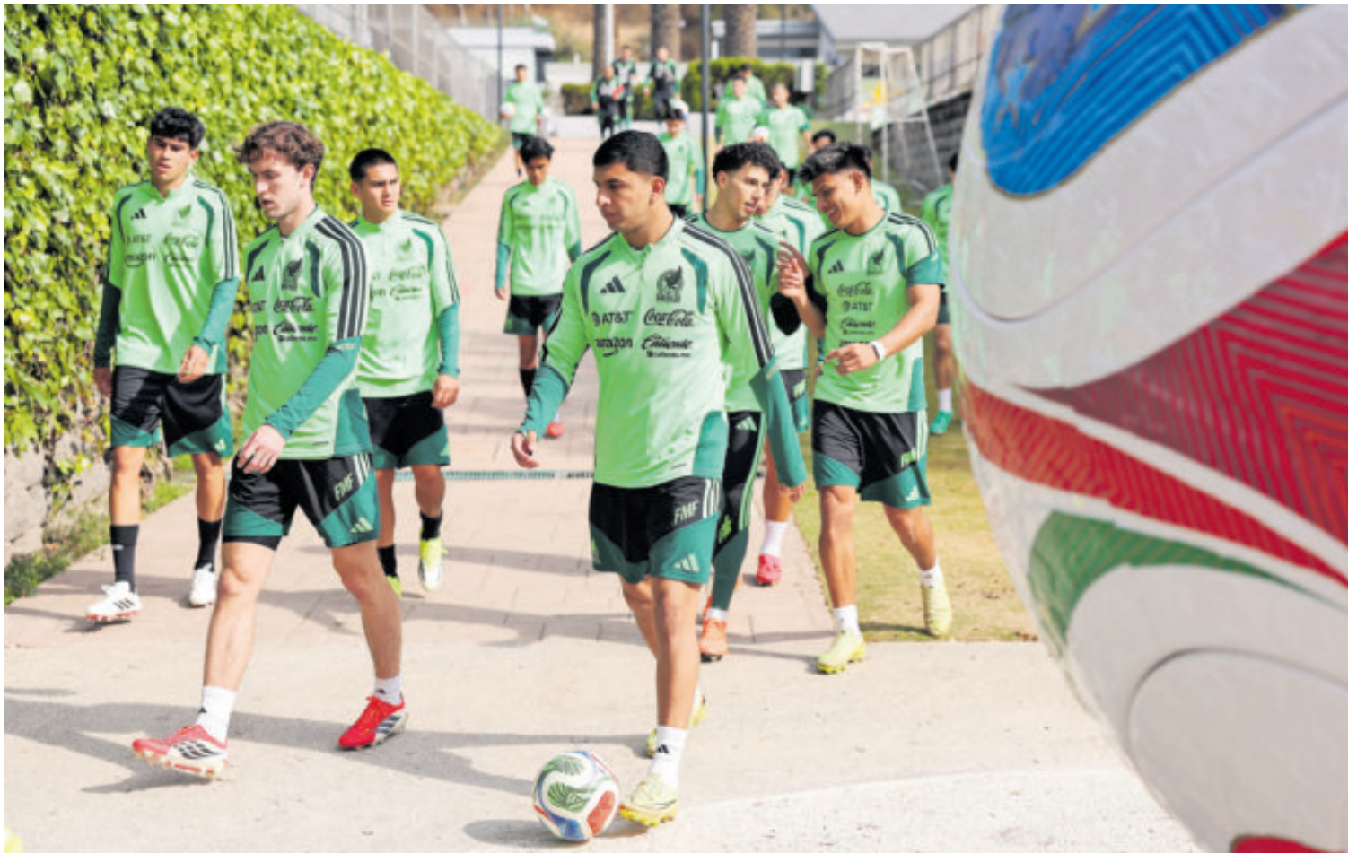
Los jugadores convocados al Tricolor saben que esta puede ser la última oportunidad de subirse al camión que va al Mundial del 2026.