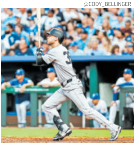
Bellinger se queda cinco años más.

New York Yankees y el jardinero Cody Bellinger llegaron a un acuerdo para extender su vínculo laboral por cinco años y 162.5 millones de dólares con lo que culminaron meses de negociaciones durante la temporada baja para mantener al jugador en el equipo tras su sólida campaña en el Bronx. El pacto incluye un bono por firmar de 20 millones de dólares, opciones de salida (opt-outs) después de la segunda y tercera temporada, y una cláusula completa de no traspaso (full no-trade clause). No hay salarios diferidos en el acuerdo, que promedia aproximadamente 32.5 millones anuales, con pagos más altos en los primeros años. Bellinger, quien rechazó una opción de jugador de 25 millones para 2026 y se convirtió en agente libre, regresa como jardinero izquierdo titular. En la temporada 2025, disputó más juegos (59) en esa posición que en cualquier otra, desplazando al prospecto Jason Domínguez, a quien los Yankees habían promovido públicamente como su titular a pesar de sus limitaciones defensivas y dificultades contra pitchers derechos en su año de novato.