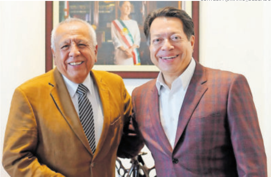
Francisco Garduño encabezó el INM cuando migrantes murieron quemados.