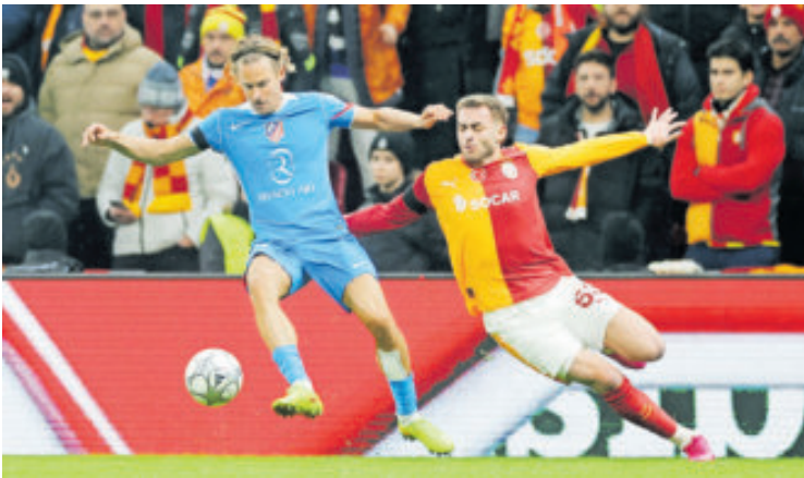
Atlético de Madrid debía ganar; empató y se complica la vida.