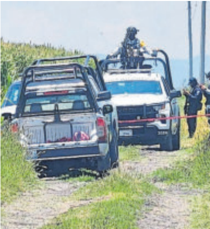
Fueron hallados en caminos de terracería.

Sin embargo, aún al fondo de dichos pozos se alcanzaban a apreciar restos óseos, por lo que continuaron con los trabajos en la zona y se presume que podría