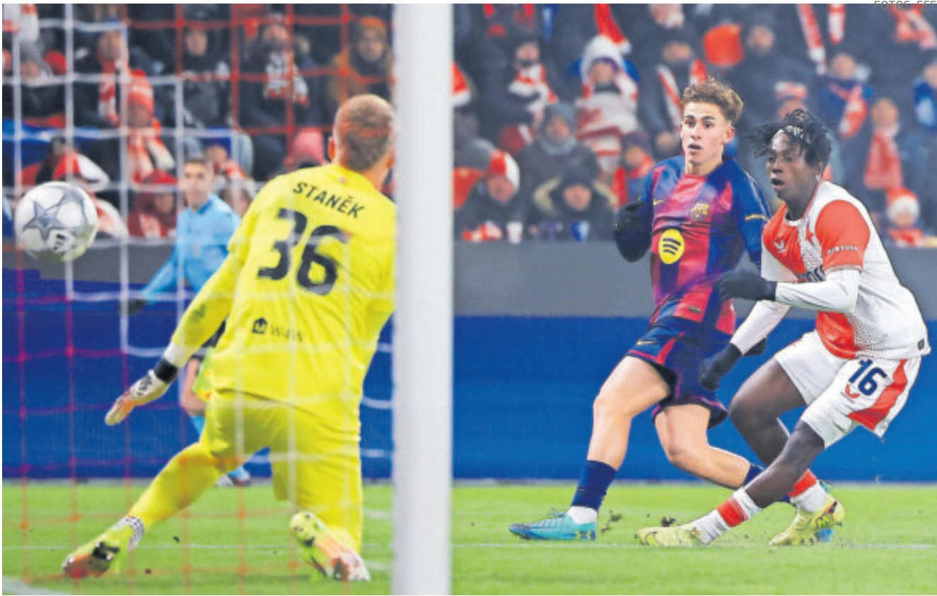
Barcelona batalló, pero al final acabó por imponer su mejor futbol y dependerá de sí en el cierre para meterse directo.