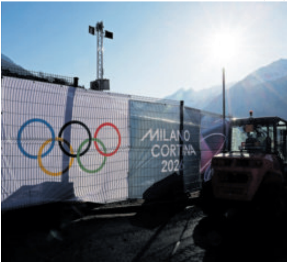
A días de la inauguración, hay obras incompletas.

Coventry abundó en que el Grupo de Trabajo del Programa Olímpico, creado tras la llegada de la zimbabuense a la presidencia en marzo de 2025, ya debate ese tipo de aspectos, porque parte de su cometido es revisar el programa, teniendo en consideración la sostenibilidad y dispersión, con el ejemplo de Milán-Cortina.