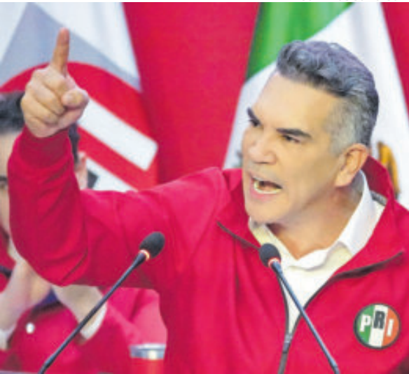
Alejandro Moreno, líder nacional del PRI.

Finalmente, el partido sostuvo que, con el actual gobierno, la impunidad de los delincuentes “está garantizada”.