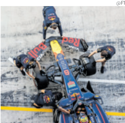
Red Bull estaría sacando ventaja.

Los fabricantes, los expertos en motores y la FIA tienen previsto reunirse el jueves en medio de un creciente debate sobre las relaciones de compresión y la