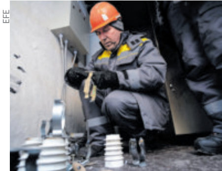
Reparación del sistema eléctrico.