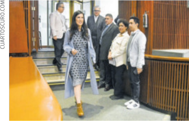
Kenia López Rabadán, presidenta de la Cámara de Diputados.

El también coordinador de Morena en la Cámara de Diputados explicó que actualmente las negociaciones se desarrollan en mesas encabezadas por la Secretaría de Gobernación, donde se busca construir consensos entre Morena, el PT y el PVEM.