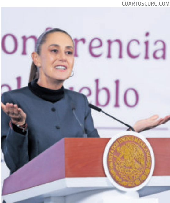
La presidenta Claudia Sheinbaum, ayer, en la mañana.

dente Donald Trump, al descartar que el tema se hubiera pactado durante la llamada telefónica que sostuvo recientemente con el mandatario estadounidense. La jefa del Ejecutivo federal explicó que la determinación se adoptó tras el análisis del Consejo Nacional de Seguridad, instancia encargada de revisar si cada caso contribuía a reducir la violencia. En ese contexto, señaló que la cooperación con Estados Unidos se mantiene bajo principios de coordinación, pero dejó claro que ninguna solicitud extranjera se atiende de forma automática, ya que cada decisión se somete a una “evaluación” que coloca a México “como prioridad”.