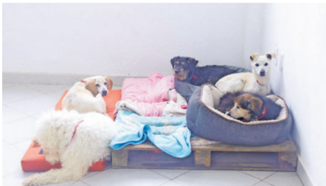
Treinta perros requirieron hospitalización especializada; algunos ya fueron dados de alta.

En el inmueble también se localizaron 39 gatos; dos murieron y el resto permanece bajo atención veterinaria.