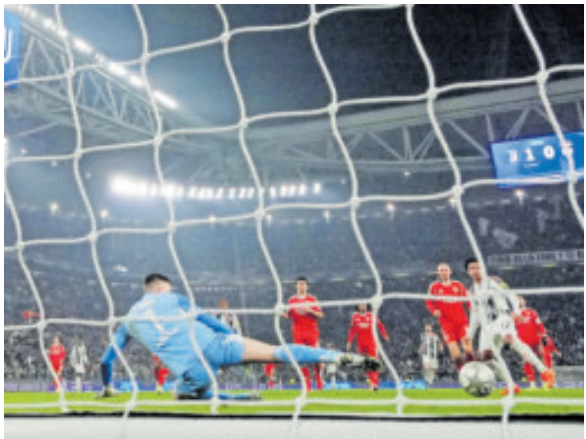
Juventus liquidó prácticamente al Benfica.