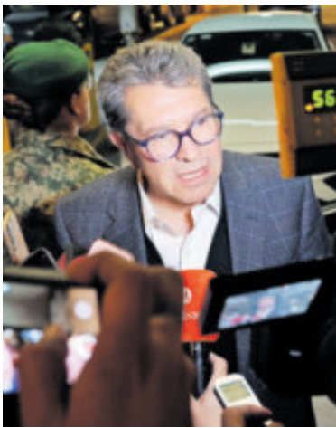
Ricardo Monreal, líder de Morena en San Lázaro.

Advirtió que una ruptura entre los partidos aliados “pondría en riesgo no sólo la reforma electoral, sino también la capacidad de enfrentar de manera conjunta los procesos electorales de 2027 y 2030, por lo que mantener la cohesión de la coalición es una condición estratégica y prioritaria”.