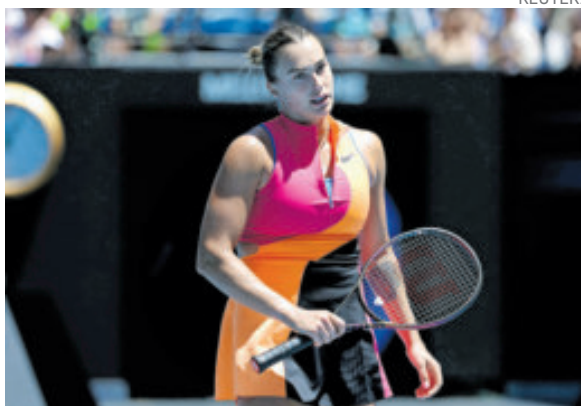
La bielorrusa ha defendido su postura de no querer hablar de política y sólo de lo deportivo.

El clima geopolítico también ha marcado la actitud de otras jugadoras ucranianas del circuito, como Elina Svitolina.