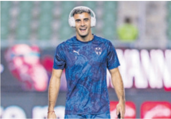
Parece que es inminente la partida del argentino, naturalizado mexicano, al Inter de Miami.