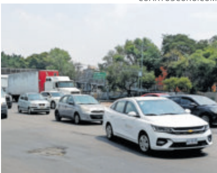
Priorizarán 18 mil kilómetros.

evidenció la magnitud del rezago en la red federal de carreteras libres de peaje, donde el desgaste estructural, los baches recurrentes y la pérdida de condiciones de seguridad obligaron a una intervención de gran escala para contener daños que se extendieron durante años.