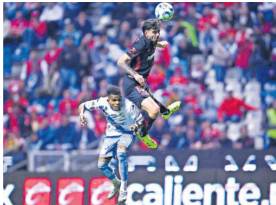
El campeón Toluca extravió el marco rival y sumó su segundo juego sin gol.