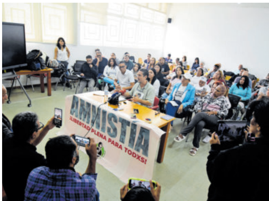
Familiares de presos políticos presionan por su liberación.

De acuerdo con El País , la medida llega casi un mes después del inicio de un proceso gradual de liberaciones, que comenzó tras la captura de Maduro por fuerzas de asalto estadounidenses, ocurrida el 3 de enero. Desde entonces, el chavismo asegura haber liberado a más de 600 personas, mientras que organi-