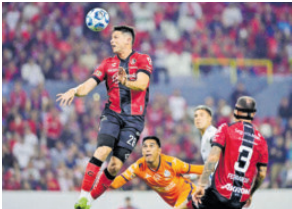
Atlas, a sumar de a tres cuando reciba al Mazatlán.