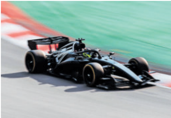
Sergio Pérez. Prefiere que sea hoy cuando surjan los problemas y no dentro de una carrera oficial.

El jalisciense de 36 años de edad admitió que el camino ha estado sembrado de