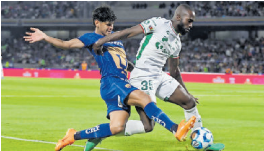
Preciso y certero, logró quitarle el balón.