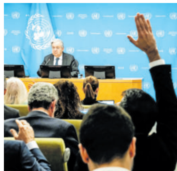
El secretario general envió una carta a embajadores.

"O bien todos los Estados miembros cumplen con sus obligaciones de pagar íntegramente y a tiempo, o bien los Estados miembros deben revisar fundamentalmente nuestras normas financieras para evitar un colapso financiero inminente", dijo, y advirtió de que el efectivo podría agotarse en julio.