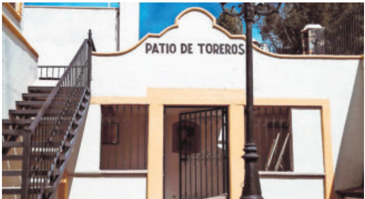
El cartel reunía a figuras consolidadas.