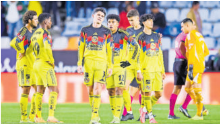
América busca terminar con su ayuno de goles y de triunfos.