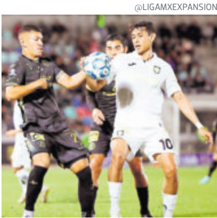
Atlético La Paz cazó a los Venados, alcanzó al Tepatitlán y es nuevo líder.

El Inter Miami anunció que Germán Berterame llega como "jugador designado" y que firmó un contrato hasta la temporada 2028/29, con la opción de extenderlo hasta 2029/30. Cifras extraoficiales dicen que salió por 15 millones de dólares.