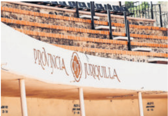
Por el momento, la actividad está suspendida.

Que esto ocurra en Juriquilla no es menor. Se trata de una plaza privada, moderna, con una vocación cultural clara y con un historial de cumplimiento normativo. La suspensión no castiga una ilegalidad; castiga la existencia misma del espectáculo.