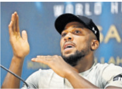
Habla tras un mes del fatal accidente.

Con esta victoria, Novak Djokovic no sólo reavivó su rivalidad con Alcaraz, a quien enfrentará el domingo con el trono en disputa, sino que se convirtió en el tenista de mayor edad en la era abierta en alcanzar la final en Melbourne, extendiendo sus propios récords históricos, pues será su undécima final en el mayor oceánico y su trigésima octava de Grand Slam en total. Y es el segundo jugador en alcanzar una final de Grand Slam con 38 años o más después de Ken Rosewall, que fue subcampeón en Wimbledon 1974 con 39 años.