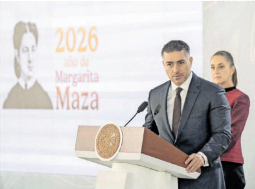
Omar García Harfuch en conferencia, ayer en Tijuana.

El secretario confirmó que los legisladores permanecen bajo resguardo, con custodia permanente en el hospital donde recibieron atención médica, como medida preventiva y de seguridad mientras continuaron los trabajos ministeriales.