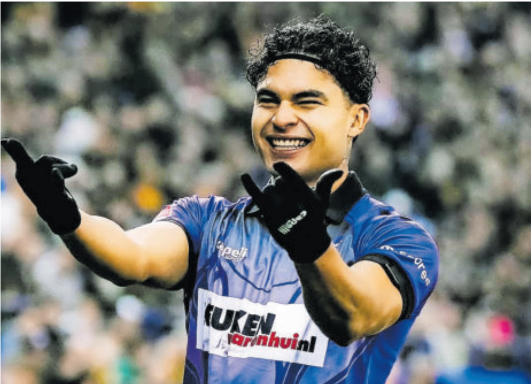
IN: FC DORDRECHT