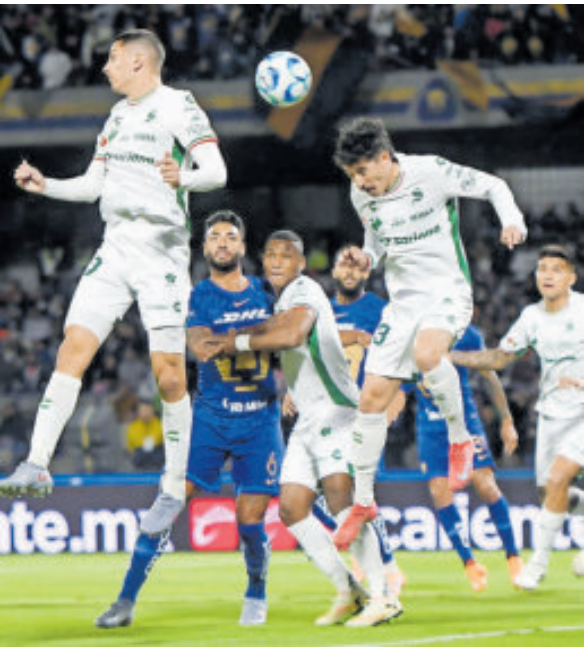
Sin pena ni gloria, Santos Laguna no levanta.