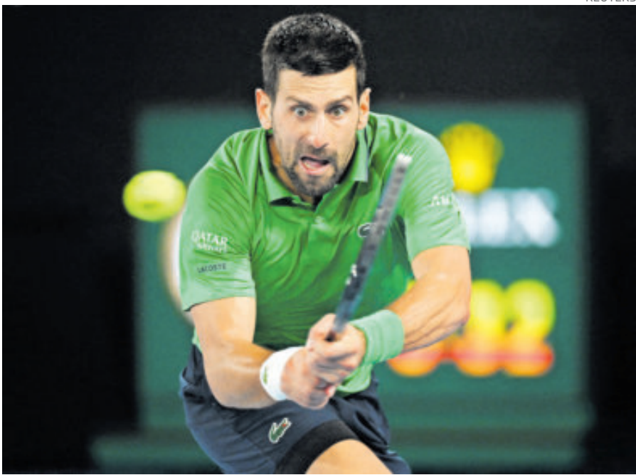
Djokovic cobró revancha de Sinner y lo derrotó en duelo que duró cuatro horas.

Pero el más grande campeón de todos los tiempos, que ha logrado tanto durante décadas, logró una de las mayores proezas de su legendaria carrera. El balcánico pudo sobreponerse a un déficit de dos sets a uno, y con todo y sus 38 años, derrotó al