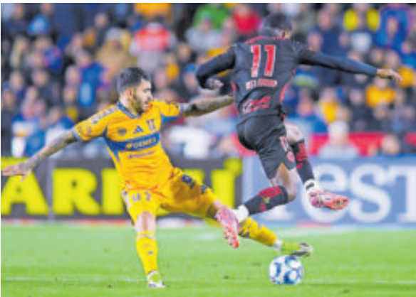
Tigres tiene una peligrosa visita frente al León.