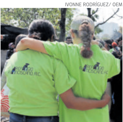
Las activistas recuperaron el terreno.

En un recorrido para inspeccionar las condiciones del inmueble, los franciscanos denunciaron que se encontraba una fogata recientemente apagada, aún caliente y con la presencia de humo, donde se observan objetos calcinados, además de una presunta fosa con cal, donde podrían haber animales muertos.