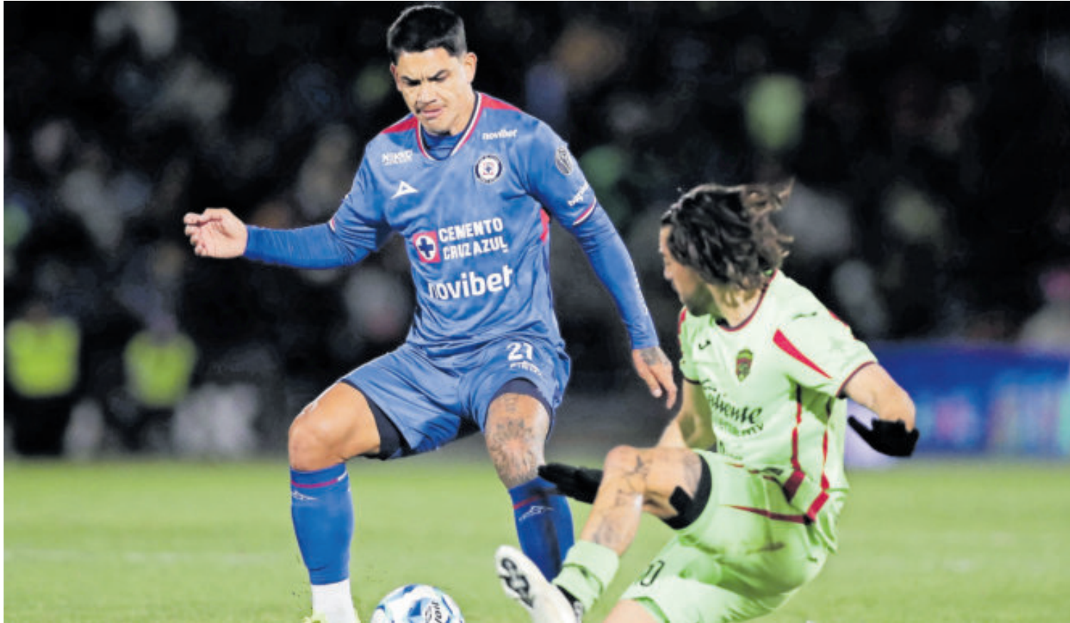
Cruz Azul fue a la frontera para imponerse a Bravos, aunque se complicó la vida.