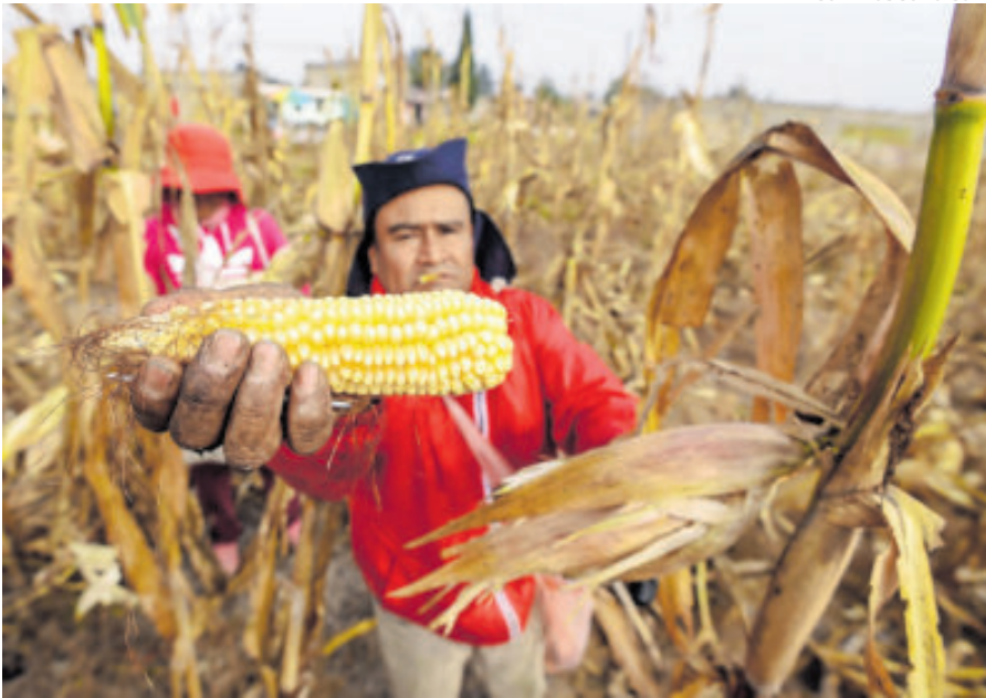
Las actividades agrícolas dan la cara por la economía mexicana.

Afirman que se implementa un sistema para adjudicar obras a empresas que comparten representante legal.