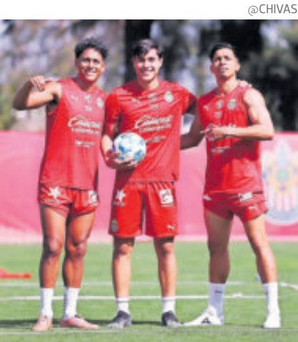
Chivas podrá utilizar a sus mejores elementos hoy ante los potosinos.

La novedad en la convocatoria de las Chivas fue el joven Ángel Chávez, quien subió del Tapatío y podría hacer su debut.