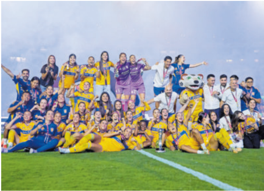
Tigres, el campeón defensor, será el rival a vencer en este Clausura 2026.