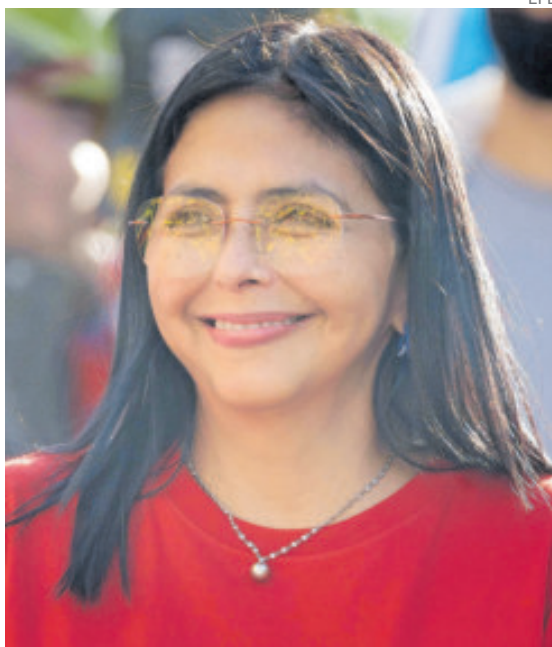
Delcy Rodríguez, vicepresidenta de Venezuela y ministra de Hidrocarburos.

Rodríguez, de 56 años, es la segunda al mando del gobierno venezolano desde junio de 2018. Además, desde agosto de 2024, es ministra de Hidrocarburos, lo que la ha convertido en una figura clave den-