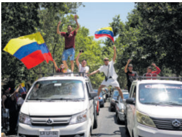
En Chile también festejaron.

“Saber que mi papá estuvo vivo para ver la caída de Nicolás Maduro es muy