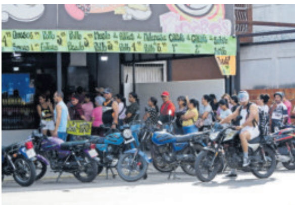
Se registraron compras de pánico en Caracas.