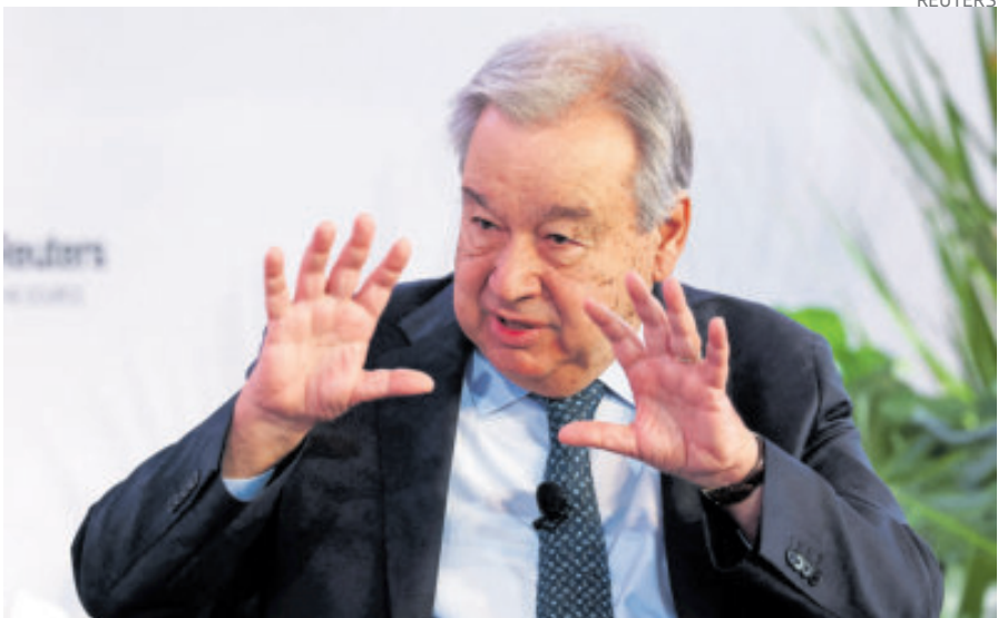
António Guterres, secretario general de la ONU.