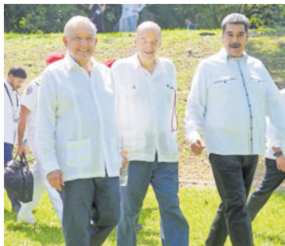
Andrés Manuel López Obrador y Nicolás Maduro, en Chiapas, en 2023.

condicional a la presidenta Claudia Sheinbaum y cerró con una posdata irónica dirigida a Trump: “Por ahora no le mando un