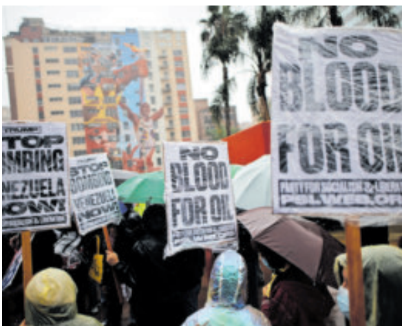
En Los Ángeles exigieron alto a los ataques.