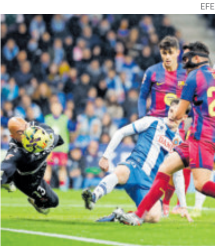
Barcelona camina firme y se consolida en la cima de la Liga en España.

Ferran Torres y Lamine empezaron tímidos. Raphinha y Rashford tampoco estaban enchufados. Así se fueron, con opciones y salvadas, y con el derbi en su punto álgido y con el reloj presionando, Dani Olmo mató el choque. En el minuto 86, Dani Olmo hizo el primero para los culés. Con el Espanyol grogui,