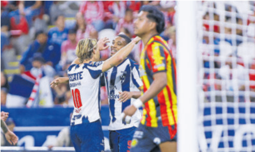
Al fin apareció Martial y aportó un gol, que le deba ayudar a tomar confianza.