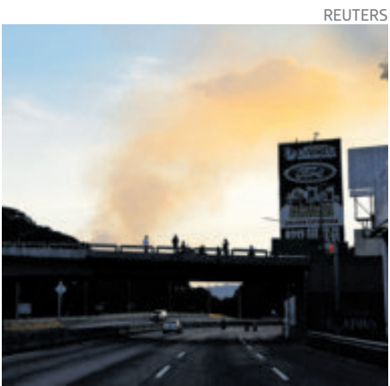
Ataque a instalación militar en Caracas.

La organización, presidida por el surinamés, Albert Ramdin, agregó que los actores venezolanos deben “actuar con unidad de propósito y a desempeñar un papel