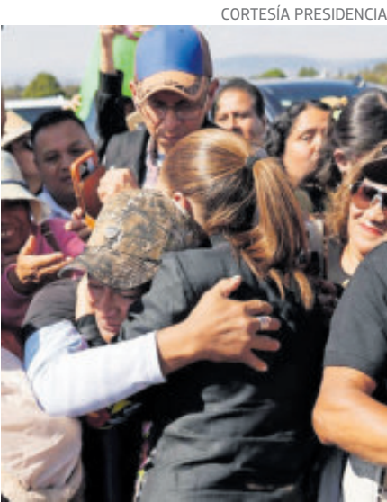
La Presidenta, durante una visita a Huamantla, Tlaxcala.

les de diálogo establecidos a través de diversas reuniones, lo que ha permitido mantener cooperación en temas clave. Las declaraciones de Trump se dieron luego de que afirmara que los cárteles gobiernan México y advirtiera que “habrá que hacer algo” contra el narcotráfico. En otro tema, la Presidenta señaló que su gobierno revisará, junto con la Secretaría de Relaciones Exteriores, cómo será la relación de México con Venezuela ante el escenario en el que Estados Unidos estaría gobernando ese país, siempre dentro del marco constitucional. Sobre la captura de Nicolás Maduro, reiteró la condena del gobierno mexicano y sostuvo que el hecho trasciende a la figura del mandatario venezolano, pues involucra principios de