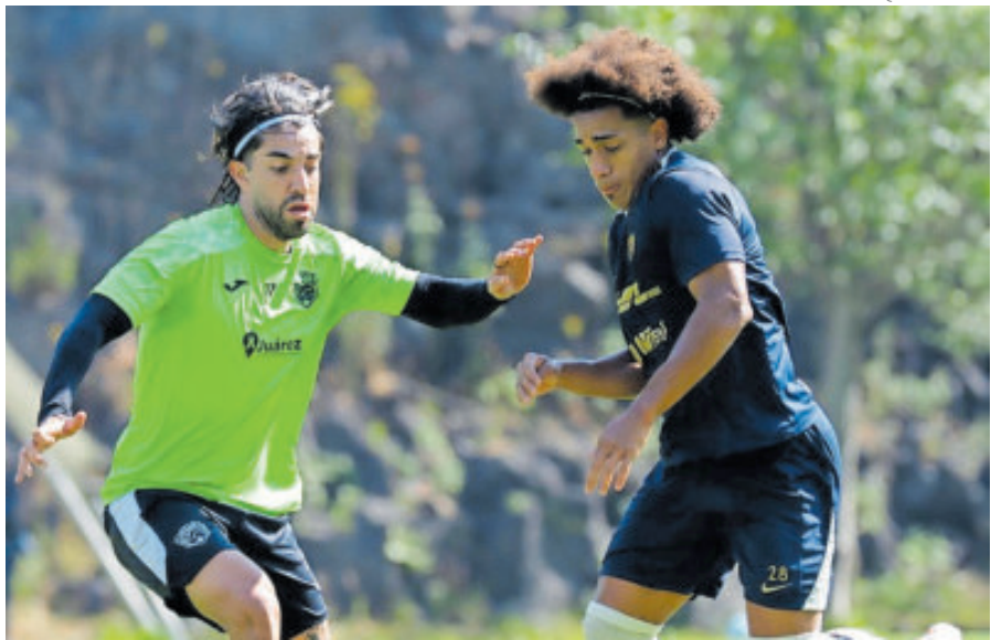
Los universitarios mordieron el polvo frente a Bravos, en duelo amistoso.