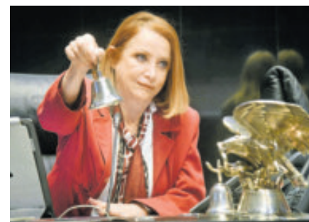
Laura Itzel Castillo, presidenta de la Mesa Directiva del Senado.

También exhortó a la Organización de las Naciones Unidas “a actuar inmediatamente para contribuir a la desescalada de las tensiones, facilitar el diálogo y a generar condiciones que permitan una solución pacífica, sostenible y conforme al derecho internacional”.