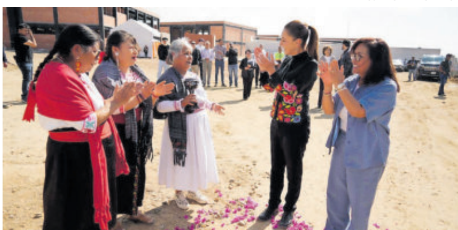
Claudia Sheinbaum, tras supervisar el Polo de Desarrollo Económico Tlaxcala.

Acusó que dicho acto del gobierno de Estados Unidos en Venezuela viola la Carta de la Organización de las Naciones Unidas, por lo que llamó a respetar el derecho internacional y “cesar cualquier agresión contra el pueblo venezolano”.