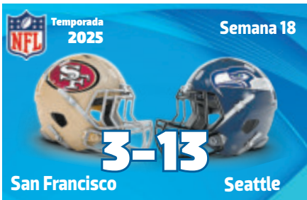
Los Seattle Seahawks le ganaron el duelo decisivo y la mano a san Francisco.