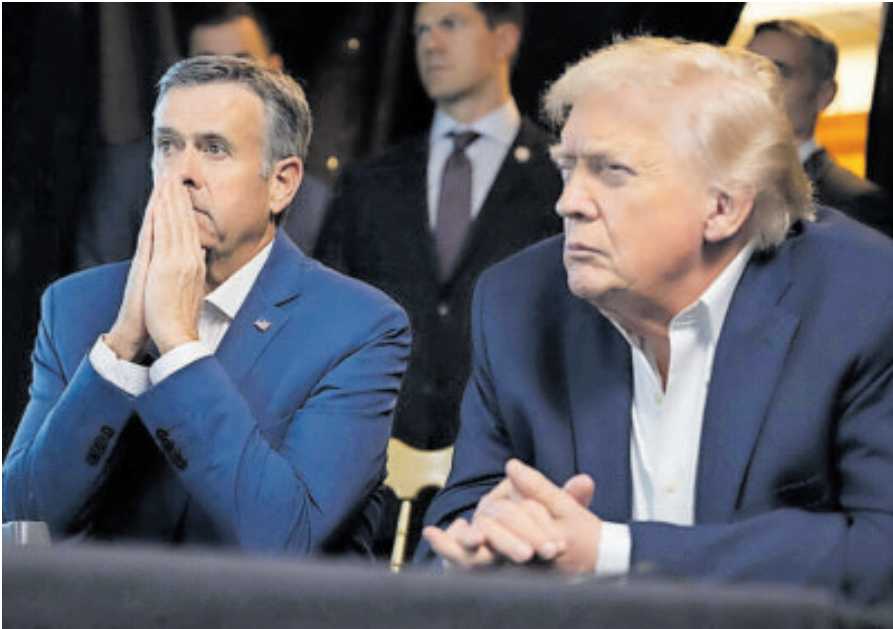
Donald Trump, junto con el director de la CIA, John Ratcliffe.

Washington, DC.- El presidente de Estados Unidos, Donald Trump, advirtió ayer de que habrá que “hacer algo” contra el narcotráfico en México, pues insistió en que los cárteles de la droga gobiernan el país. El mandatario dio estas declaraciones en una entrevista telefónica con la cadena Fox News después de la operación contra Venezuela que se saldó con la captura del presidente, Nicolás Maduro, a quien acusa de ser un líder del narcotráfico. Trump aclaró que la captura de Maduro no fue un mensaje para la presidenta mexicana, Claudia Sheinbaum, a quien definió como una “amiga” y “una buena mujer”, pero subrayó que “los cárteles gobiernan México; ella no gobierna”. Reveló que le ha ofrecido “muchas veces” a Sheinbaum la posibilidad de que el Ejército estadounidense acabe con el narcotráfico mexicano, pero la presidenta le