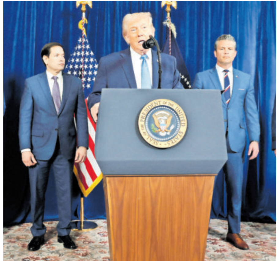
El presidente Donald Trump, junto con su gabinete de seguridad, ayer.

Trump dijo asimismo que hará que las grandes petroleras estadounidenses comiencen a operar en Venezuela, y sostuvo que los gobiernos del país sudamericano