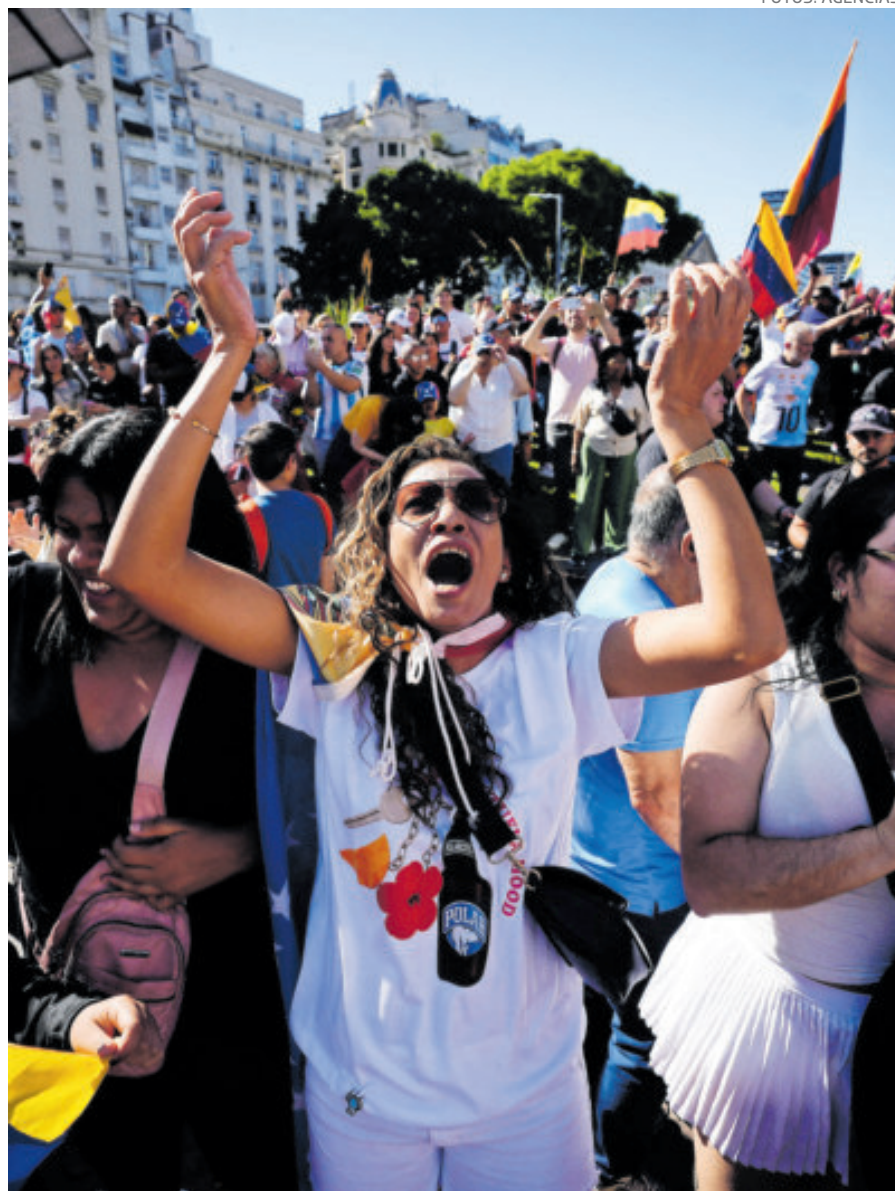
Miles celebraron la detención de Maduro desde Buenos Aires.

emotivo. Me gustaría ver su cara”, afirmó.