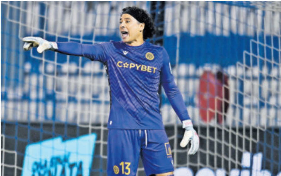
Guillermo Ochoa. Buen arranque de año, donde buscará buenas actuaciones y llamar la atención de Aguirre para acudir a su sexta Copa del Mundo.

En la Serie A de Italia, Pisa le dejó un sabor amargo al Génova, al empatarle 1-1 en