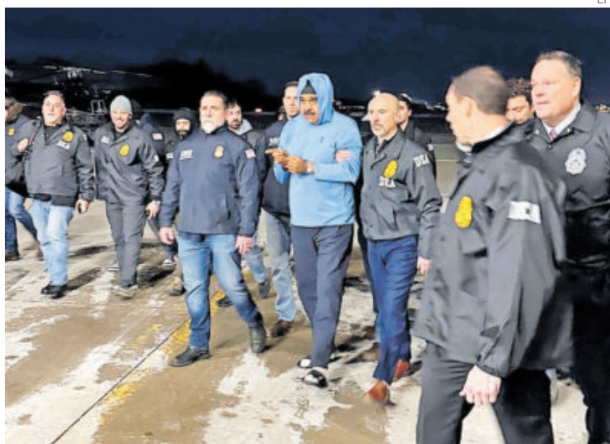
Nicolás Maduro, momentos después de aterrizar en EU.

LA NUEVA acusación agrega más cargos e imputados, incluyendo, por primera vez, a su esposa.