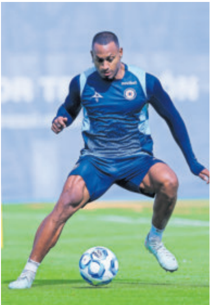
Los cementeros, aún con dudas en su plantel, chocan hoy contra el Tampico.

Decenas de aficionados fueron al aeropuerto de Tampico para recibir al Azul, pero salió por otra puerta y los dejó colgados.