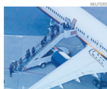
El mandatario venezolano fue trasladado a una prisión federal en Brooklyn.

dó a Maduro aterrizó en la base de la Guardia Nacional Aérea de Stewart, donde lo esperaban decenas de agentes de distintas agencias federales, entre ellas el Buró Federal de Investigaciones (FBI) y la DEA, con temperaturas cercanas a los dos grados centígrados bajo cero. Maduro descendió del avión esposado y fue trasladado en helicóptero hacia Manhattan.