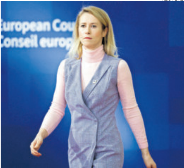
La representante de Exteriores de la UE, Kaja Kallas.

El presidente Donald Trump anunció que Estados Unidos llevó a cabo “con éxito un ataque a gran escala contra Venezuela” y dijo haber capturado al presidente venezolano, Nicolás Maduro.