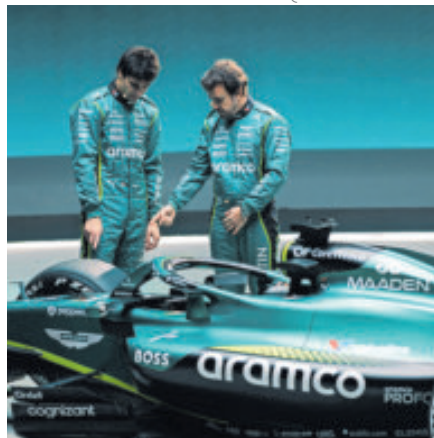
Stroll y Alonso listos para la F1.