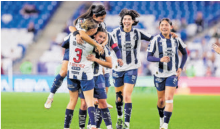
Las Rayadas son las nuevas líderes generales.