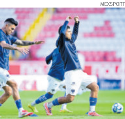
El Toro Guzmán se había perdido los últimos dos cotejos por una lesión.