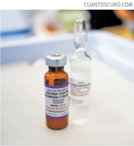
El país firmó un acuerdo.