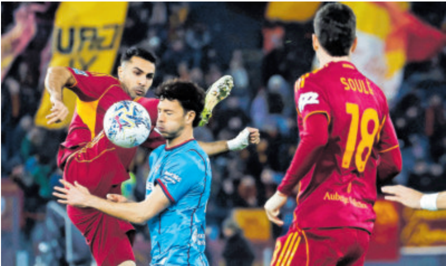
La Roma logró un triunfo importante, que la deja codo a codo con la Juventus, a la espera de un revés de ésta para alcanzar el último pase a Liga de Campeones.

Roma, Italia.- El español Bryan Zaragoza debutó el lunes como jugador del Roma en la victoria de los de Gian Piero Gasperini ante el Cagliari (2-0) con un doblete del neerlandés Donnyell Malen que mantiene las opciones de su equipo de entrar en puestos de Liga de Campeones. El extremo malagueño, recién llegado a la capital italiana procedente del Celta de Vigo, aunque pertenece al Bayern Múnich, saltó al campo en el minuto 57 del duelo y dejó buenas sensaciones en su estreno en el Estadio Olímpico como local. Y ya sabe lo que es ganar con la camiseta romanista. Desparpajo en la banda izquierda, regates, centros laterales y responsabilidad desde el saque de esquina. Estuvo cerca incluso de una asistencia, pero la chilena de Malen salió desviada. El delantero neerlandés fue el claro protagonista del duelo. Rubricó su primer doblete. Su primer zarpazo, en la primera mitad. Minuto 25, tiró un desmarque hacia adentro y sin tocar el balón se hizo el hueco perfecto para mirar puerta. Se gustó con sutil vaselina para superar a Caprile, meta del Cagliari. En el segundo, en el minuto 65, demostró que es también un gran jugador de área. Entre tres defensas consiguió empujar un pase atrás del turco Zeki Celik. Doblete para sellar la vuelta a la victoria de la Loba. ATALANTA, TAMBIÉN El italiano Giacomo Raspadori dio el lunes su primera asistencia como jugador del