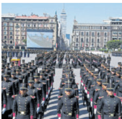
Integrantes de las FFAA, ayer, en el Zócalo.

El secretario de la Defensa evocó el episodio del 9 de febrero de 1913, cuando cadetes del Heroico Colegio Militar escoltaron al presidente Francisco I. Madero, del Castillo de Chapultepec a Palacio Na-