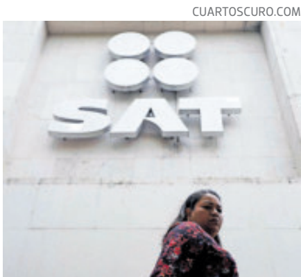
El SAT tiene la esperanza de obtener más recursos.

cursos que hayan tenido en el exterior. Dijo que en el SAT no se tenía “un pronóstico de cuánto dinero puede ser repatriado a México, pero en 2016 fueron repatriados 380 mil millones de pesos, de los cuales pagaron 25 mil millones de pesos de impuestos”, pero sostuvo que se revisó a detalle la repatriación de capitales “como una estrategia para captar más dinero para el gasto público”.