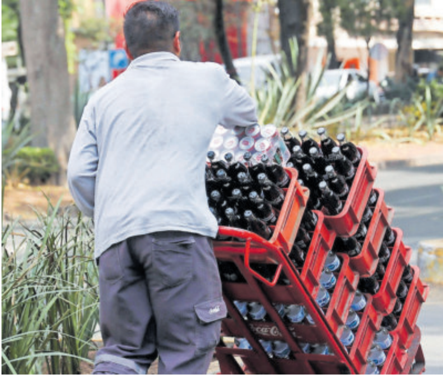
Pese a su aumento, la población sigue comprando refrescos.

UNA CENA de gama media para dos personas costará hasta $1,600, según la Anpec.