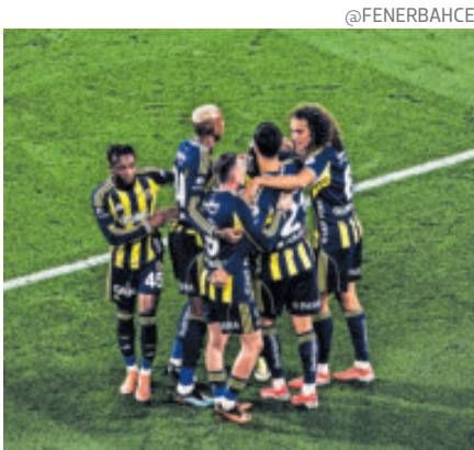
El Fenerbahçe derrotó al Genclerbirligi por 3-1 en casa. Ganó, goleó y gustó.