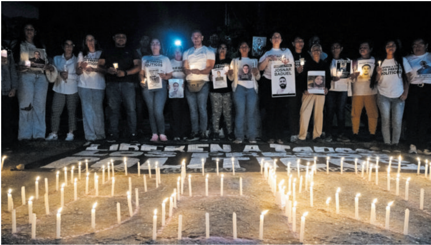
Vigilia para exigir la liberación de presos políticos, en Miranda.