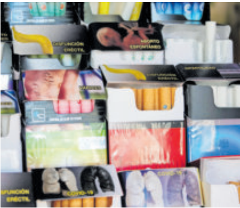
El crimen ha desarrollado una estrategia mixta de contrabando y fabricación, dicen.

Zambrano fue parte de un encuentro organizado por la Secretaría de Economía en coordinación con el Council of Americas, que reunió a diversas industrias afectadas por el contrabando y la informalidad, como el tabaco, bebidas alcohólicas, farmacéutica y texti-