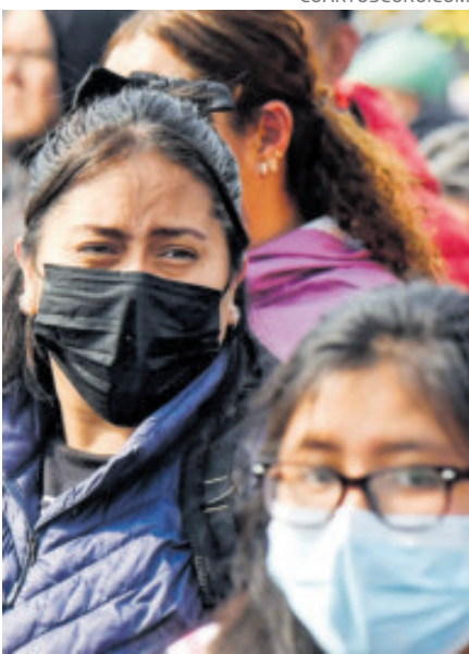
El nuevo brote hizo retomar hábitos del covid-19.

Desde ayer, el uso de cubrebocas es obligatorio en todos los niveles educativos de la entidad mexiquense, que, además, dispuso controles sanitarios en escuelas,