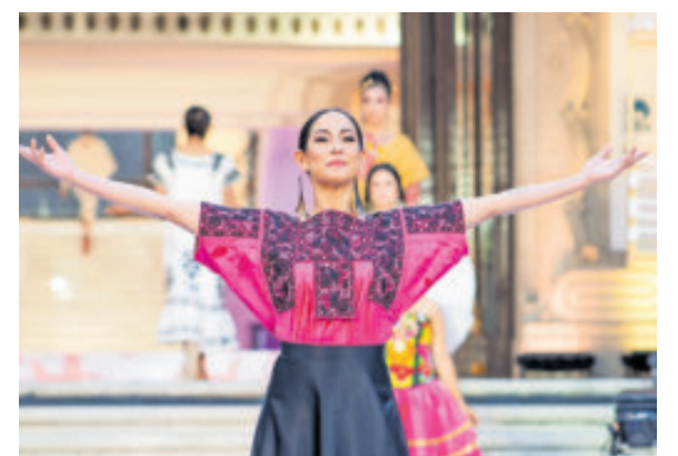
El mercado opera en precariedad.

Ramírez destacó que la próxima revisión del tratado comercial entre México, Estados Unidos y Canadá (T-MEC) es una “oportunidad clave” para reforzar la protección de este sector, así como la rendición de cuentas a las empresas.