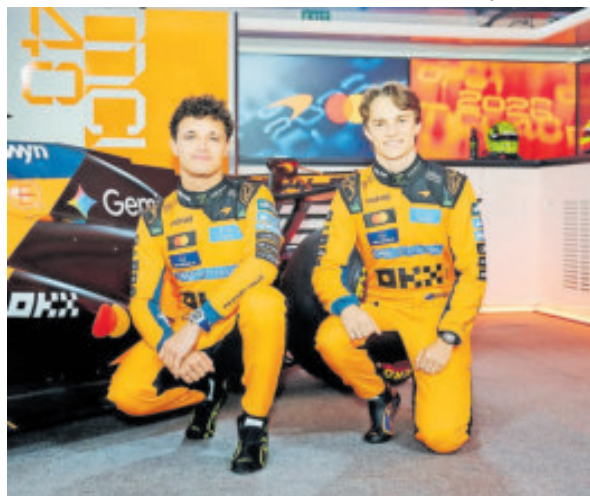
Los McLaren quieren revalidar el equipo.