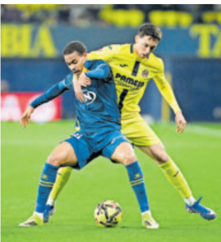
El Submarino Amarillo logró el triunfo luego de cinco juegos sin ganar.

Atalanta, en la victoria ante el Cremonese (2-1) que coloca a la Dea muy cerca de los puestos europeos. Ante el Cremonese, en este caso, fue el autor del centro lateral que en el minuto 13 terminó con el remate del montenegrino Nikola Krstovic y que encarriló la victoria de los de Raffaele Palladino, invictos en la Serie A desde el pasado 28 de diciembre, cuando cayeron ante el Inter de Milán. Sentenció el duelo Davide Zappacosta con un golazo en el minuto 25, en una jugada individual por el perfil derecho que terminó con un disparo al segundo palo. Solo en el último suspiro el Cremonese pudo recortar distancias por medio del noruego Morten Thorsby.