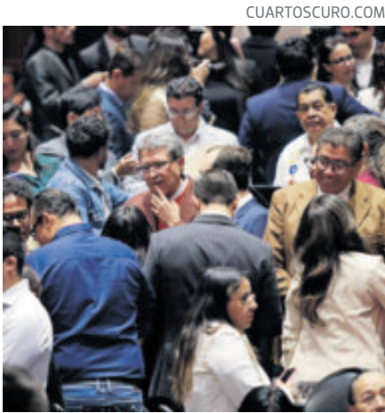
Diputados, durante sesión en la Cámara baja.

“Todos los partidos, con las distintas visiones ideológicas en este país, deben cuidar el Tratado Comercial de México, Estados Unidos y Canadá, que nos garantiza que millones de familias mexicanas