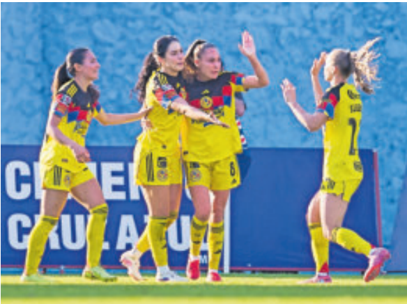
América fue a Cuernavaca a pegarle a Cruz Azul.

RUGE LEÓN EN CASA León Femenil fue profeta en casa después de vencer 3-1 a las Centellas del Necaxa, en batalla de la Jornada 8 del Torneo de Clausura MX, celebrado en la cancha del Nou Camp en la ciudad cuerera guanajuatense. Finalmente Querétaro y Mazatlán empataron a un gol.