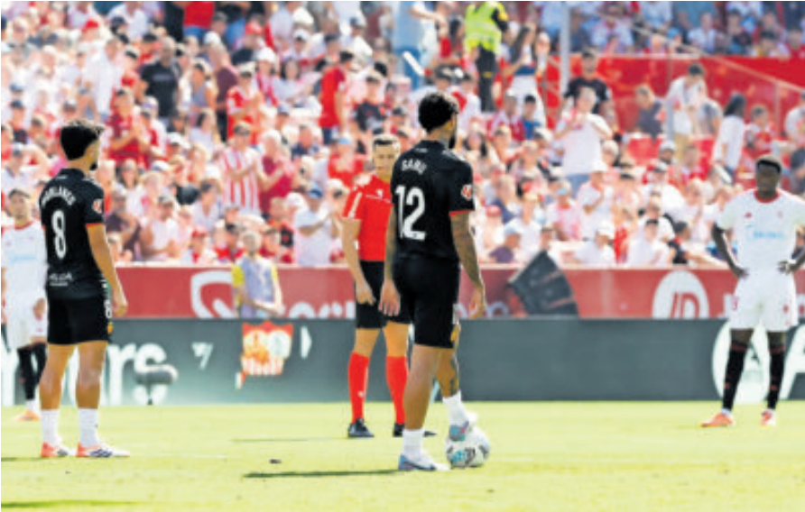
Esta es la segunda vez que el intento de LaLiga de llevar un duelo a EU se ve frenado y llega a tribunales. La primera le dieron la razón a los jugadores.