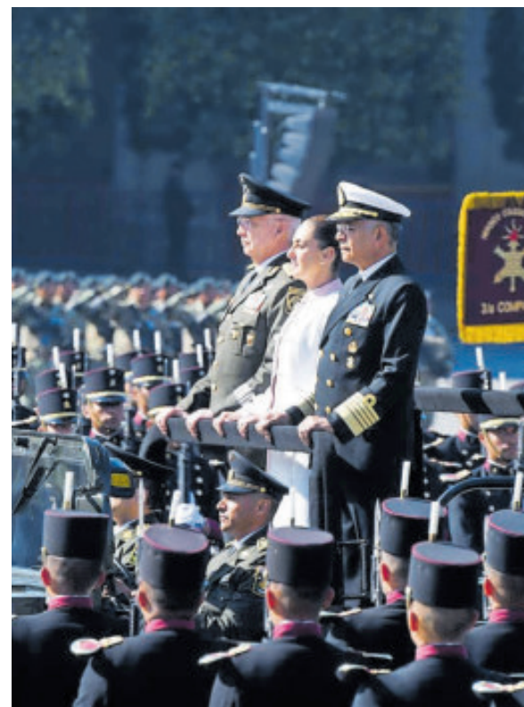
La Presidenta, flanqueada por los titulares de Sedena y Semar, ayer.

Al citar al historiador José Cayetano Valadés, el mando militar destacó que aquellos jóvenes defendieron no sólo el honor del soldado y la Constitución, sino el decoro del país y la jerarquía del presidente constitucional, una referencia histórica utilizada para reafirmar el sentido