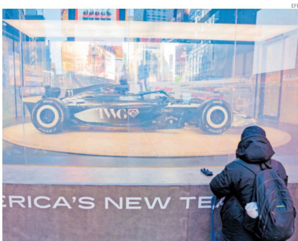
El auto de Pérez Mendoza estuvo en exhibición en Times Square de Nueva York.