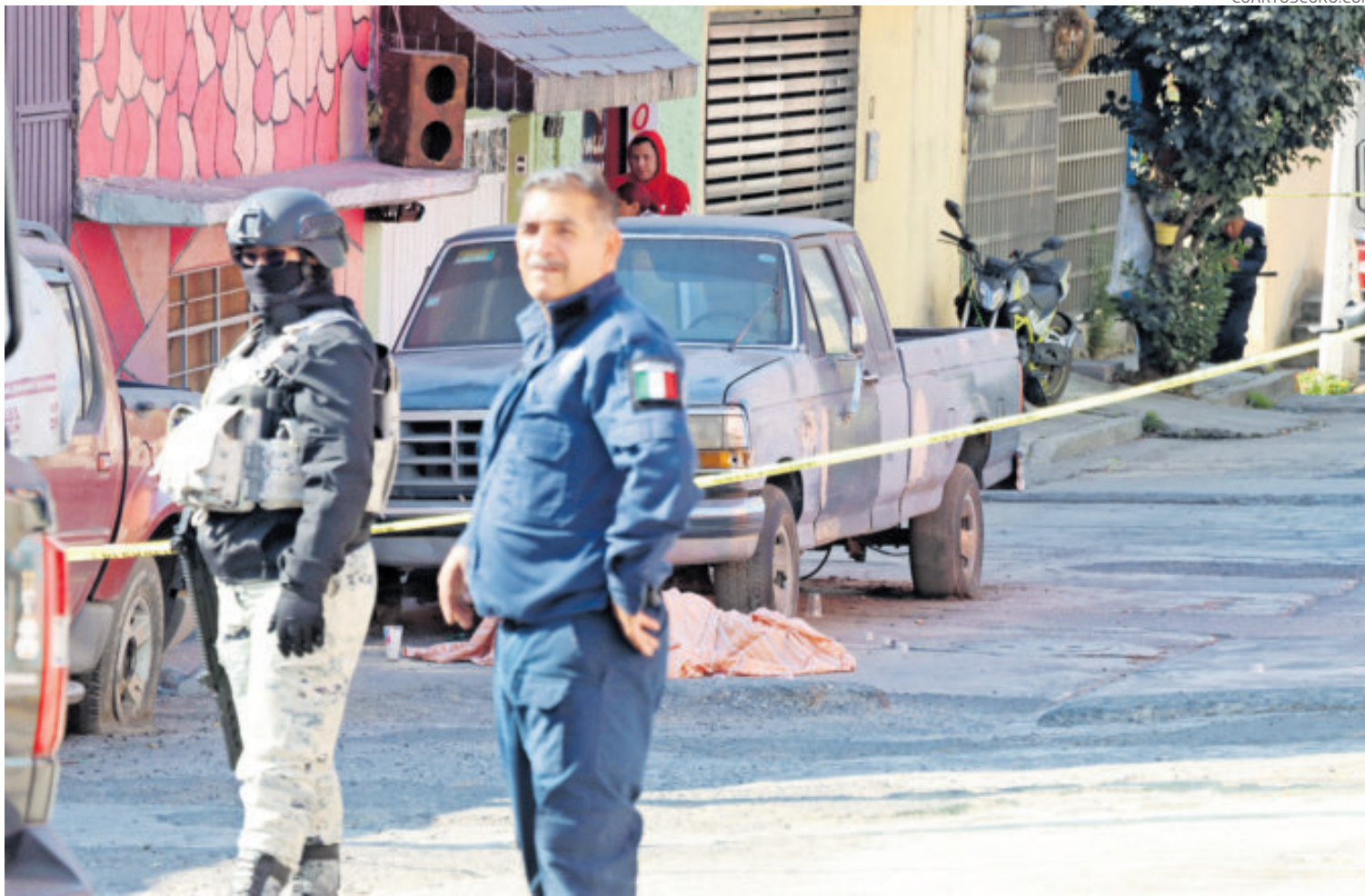
Un hombre fue asesinado con al menos 11 tiros mientras caminaba en calles de Naucalpan, la semana pasada.