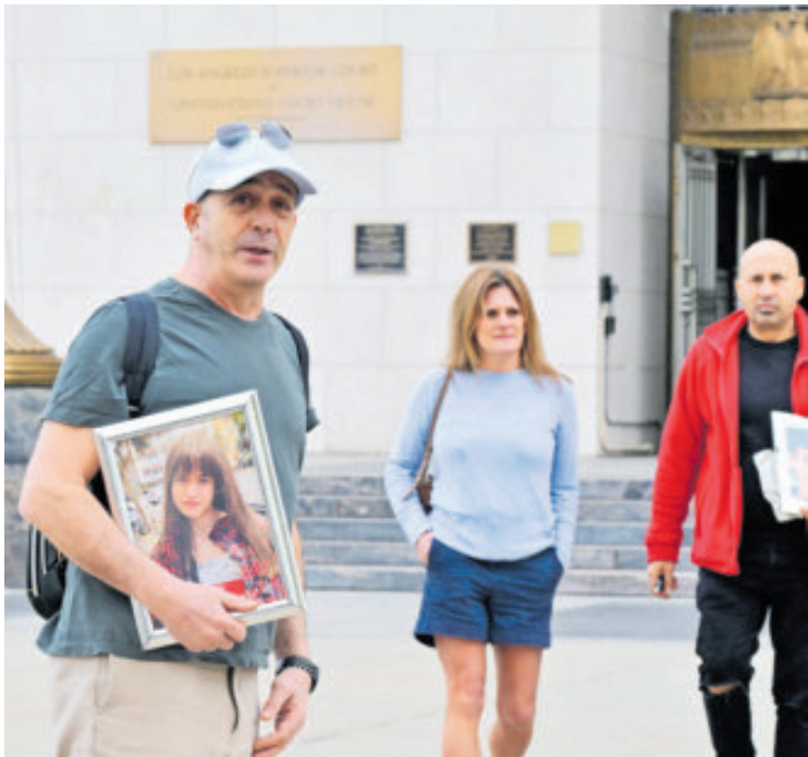
Padres de víctimas británicas fueron al tribunal de Los Ángeles.