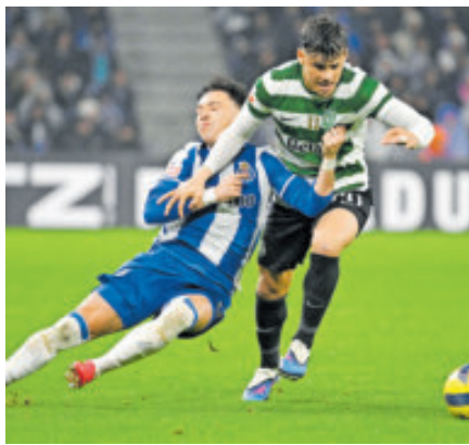
Porto no pudo mantener su ventaja ante el Sporting; al final lo empataron.