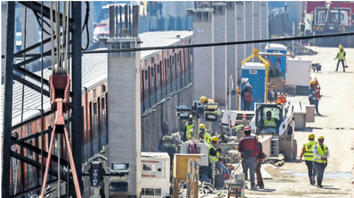
En el mes pasado el registro de empleos formales fue a la baja.