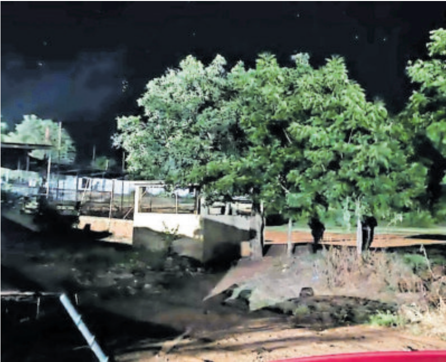
Este es el predio donde fue localizada la fosa clandestina.