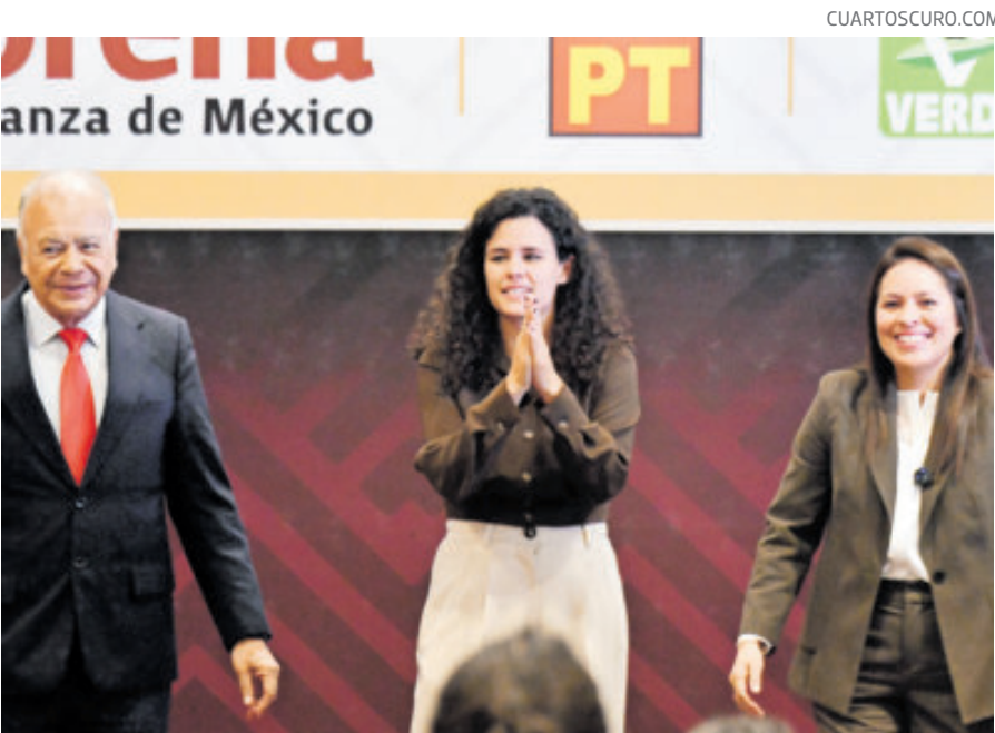
Alberto Anaya, Luisa María Alcalde y Karen Castrejón.