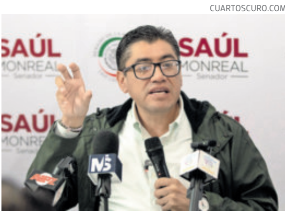
Saúl Monreal aspira a la gubernatura de Zacatecas.

La mandataria sostuvo que este tipo de prácticas no generan respaldo ciudadano y que, en su experiencia, la población no ve con buenos ojos que los cargos públicos se concentren en familias, por lo que consideró necesario fijar límites claros desde los propios partidos.