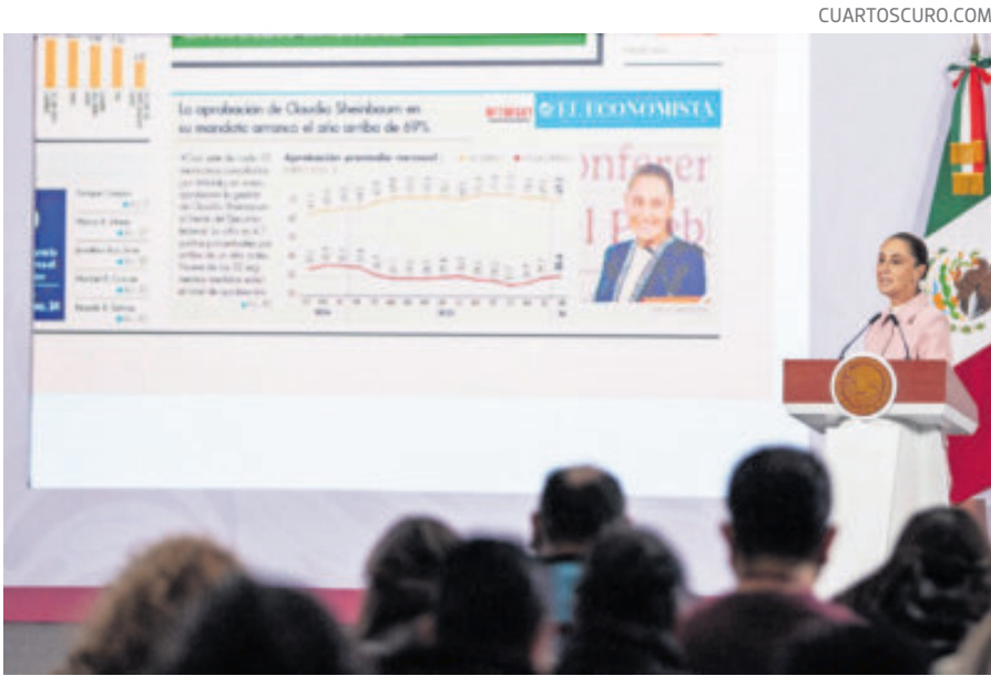
La presidenta Claudia Sheinbaum, ayer.

Sheinbaum afirmó que México mantuvo una política de solidaridad histórica con los pueblos que enfrentaron situaciones críticas, y subrayó que el apoyo a Cuba respondió a esa tradición, indepen-