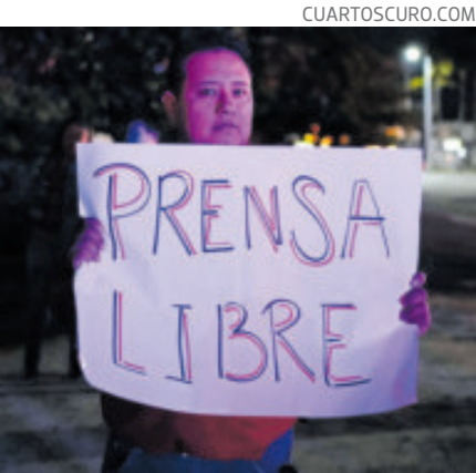
Denuncia que fue retenido 4 horas.

En la transmisión explicó que fue interceptado por policías estatales en moto-