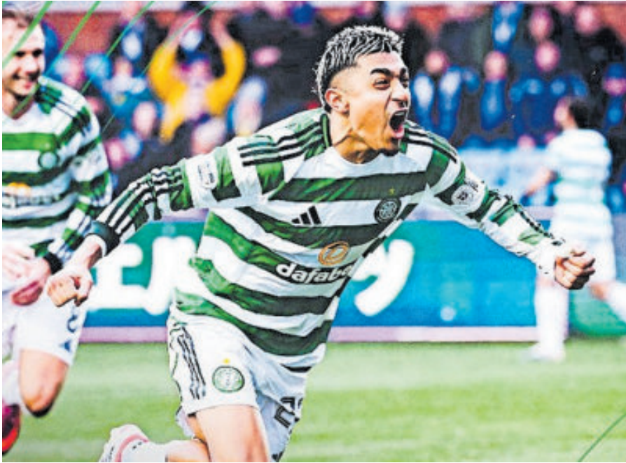
El jugador surgido de la MLS anotó su primer gol en al liga de Escocia.

El zaguero mexicano subrayó el gran esfuerzo colectivo: “Me he puesto en posi-