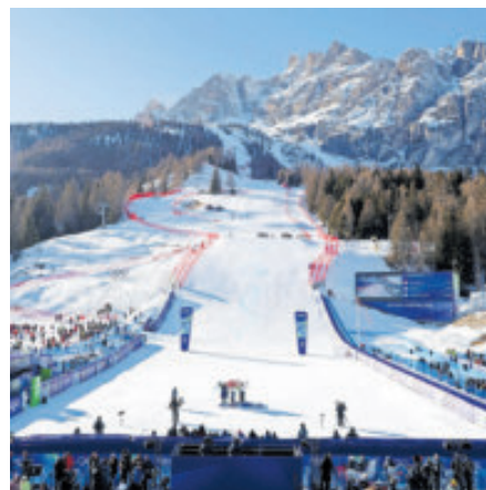
Hermosa postal de la sede olímpica.