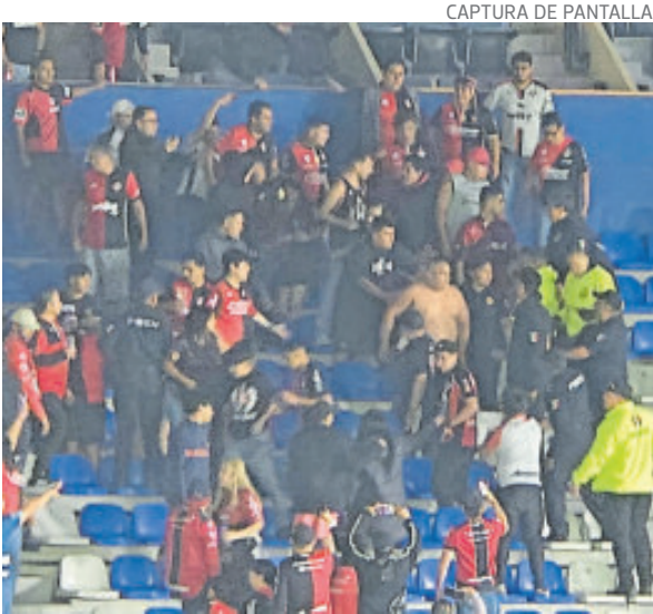
Los del Atlas se pelearon con la seguridad privada.

Al cierre de esta edición, ni la directiva del Atlas, ni la del Pachuca, ni la Liga MX (a través de la Federación Mexicana de Fútbol) han emitido un pronunciamiento oficial ni comunicado alguno respecto a los hechos. Este silencio contrasta con la gravedad del incidente.