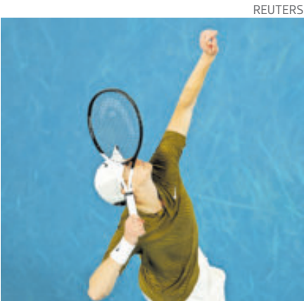
Ben Shelton fue segundo cabeza de serie y es noveno en el ranking ATP.

En otro resultado, la tercera fue la vencida para Francisco Cerúndolo porque luego de dos finales perdidas, ayer se impuso por 6-4 y 6-2 al italiano Luciano Darderi (22) y se quedó con el título del Abierto Argentina ATP 250 en el Buenos Aires Lawn