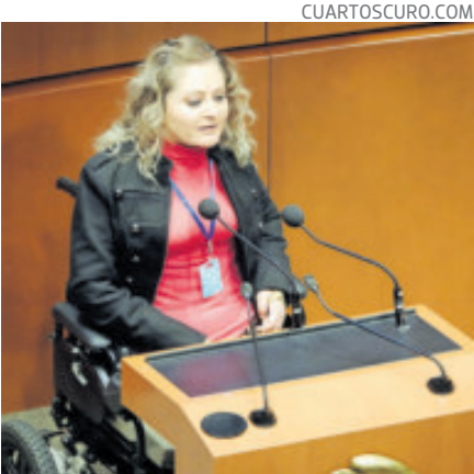
La senadora priista Claudia Anaya, en sesión.

Para revertir estas condiciones, la iniciativa plantea que la accesibilidad deje de ser opcional y se convierta en una obligación legal, mediante la incorporación de definiciones como accesibilidad universal, ajustes razonables, tecnologías de asistencia y diseño incluyente.