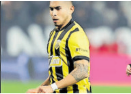
Pineda jugó los 90 minutos pero no pudo influir en el marcador.