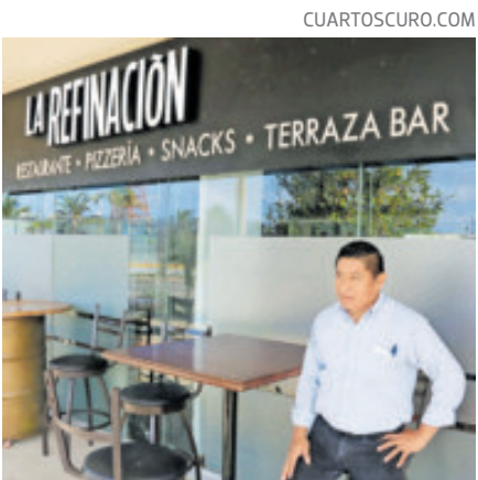
Evite las acciones abusivas de locales.

trató el servicio. En caso de que se haya pagado por adelantado, el proveedor no puede negar el servicio reservado. Esa negativa se considera una condición comercial abusiva. Asimismo, es importante señalar que tampoco pueden negar o condicionar la prestación del servicio por razones de género, nacionalidad, etnia, preferencia sexual, religiosa o cualquier otra particularidad.