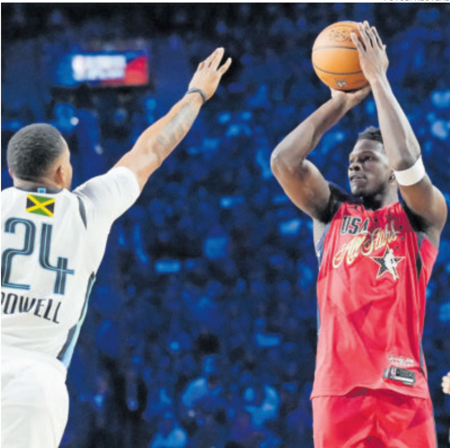
El guardia Anthony Edwards se convirtió en la gran figura del juego.

Más amargo se prestó el segundo partido para los de Booker, Edwards y compañía, quienes se vieron las caras ante un imponente LeBron James y Jaylen Brown,