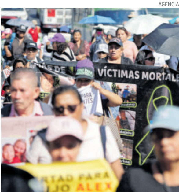
Familias de detenidos protestaron en San Salvador.

Los primeros están previstos para albergar entre 7 mil y 10 mil personas. Los segundos, entre mil y mil 500 personas, precisa el documento.