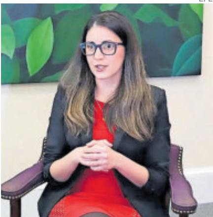
La opositora cubana Rosa María Payá.

La Cancillería sostuvo que, conforme al artículo 12 del Estatuto de la CIDH, las y los comisionados gozan de inmunidades reconocidas a los agentes diplomáticos y, por práctica institucional, deben informar sobre visitas oficiales o privadas y las ac-