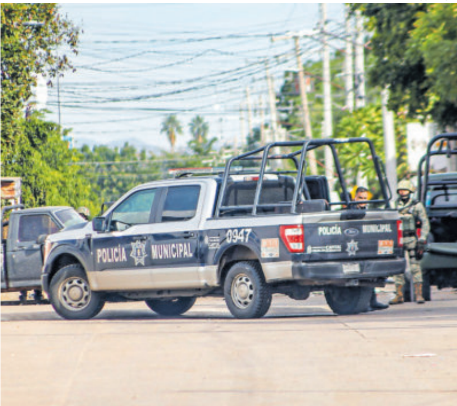
Pese a operativos de vigilancia, la violencia se vive todos los días en Escuinapa.

Escuinapa.- Tras una serie de enfrentamientos registrados entre la noche del sábado y la madrugada de ayer en el casco urbano y la zona sur de Escuinapa, dos personas fueron halladas muertas por disparos de armas de fuego. De acuerdo con la información de las fuerzas de seguridad que operan actualmente en la zona, las víctimas fueron localizadas en las comunidades Tecualilla y San Miguel de la Atarjea. Los fallecidos son hombres de entre 25 y 35 años, de acuerdo con el reporte de Servicios Periciales. Las autoridades locales han pedido a la población que eviten andar en las calles cuando se registren hechos de violencia. Esto, pese al despliegue militar que hay en la actualidad en Escuinapa. En la semana que recién terminó Tecualilla, una comunidad de 500 habitantes, registró detonaciones de armas de fuego y explosivos, lo que causó el pánico de sus habitantes y movilizó a la zona a policías y militares. De acuerdo con fuentes federales del área de seguridad, se registraron enfren-