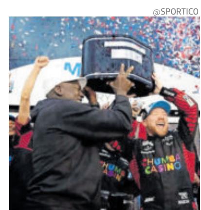
El festejo del exbasquetbolista, tras la victoria de su equipo.

Según 23XI y Front Row, los dos únicos equipos que se negaron a firmar los nuevos contratos de fletamento, el modelo de reparto de ingresos de NASCAR es injusto para quienes a menudo operan con pérdidas.