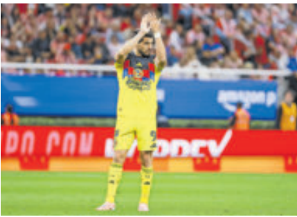
El atacante le echó la bolita al técnico con respecto a la falta de goles.

“Internamente el grupo tiene claro que todos los partidos son importantes y cada desarrollo de cada partido tiene su dificultad”.