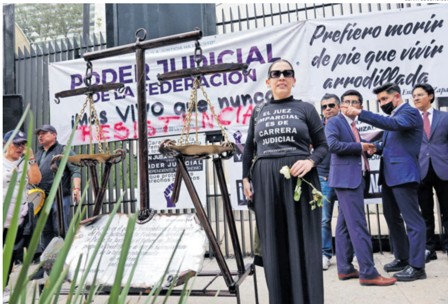
Protesta de trabajadores del Poder Judicial, durante el proceso de aprobación de la reforma.