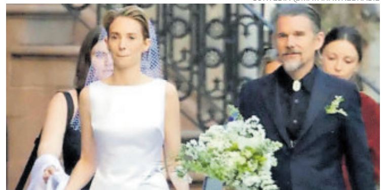
La relación de la pareja empezó en 2022.

empezó su relación a principios de 2022 y la han mantenido fuera de los focos.