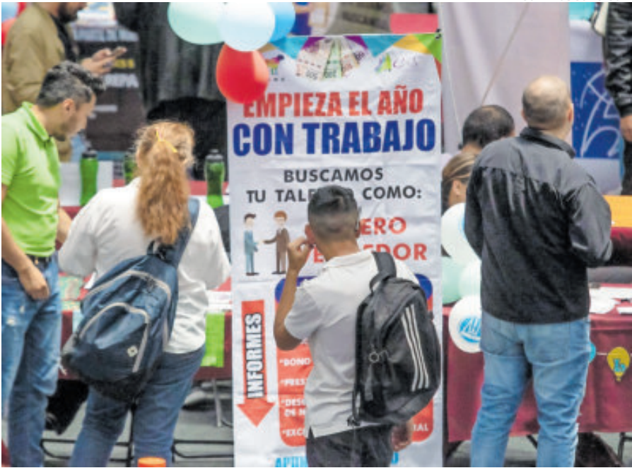
Las empresas deben generar mayores empleos, pero no es así por ahora.

ENTRE 9 Y 11% es el crédito hipotecario actual que se concede, de acuerdo con especialistas consultados.