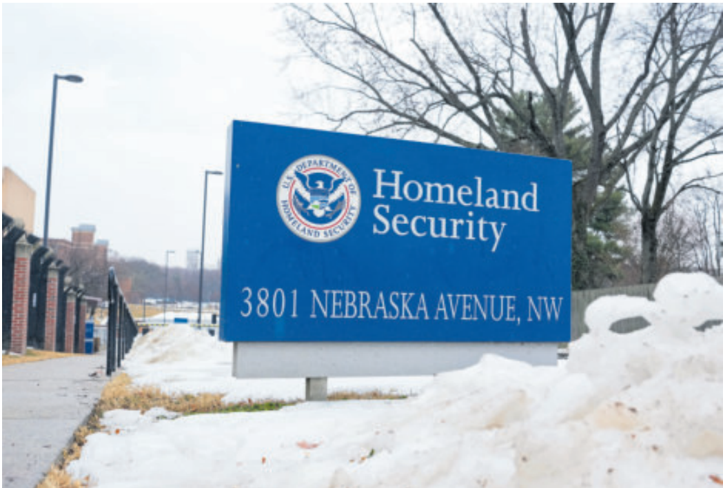
Oficinas del Departamento de Seguridad Nacional de EU en Washington, DC.

El costo total estimado del nuevo modelo de centros de detención asciende a 38 mil 300 mdd, dice una nota hecha por la gobernadora de New Hampshire, Kelly Ayotte.