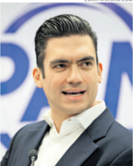
Jorge Romero, presidente nacional del PAN.

Asimismo, subrayó que este brote de la enfermedad, que se consideraba ya erradicada, no es un fenómeno accidental ni inevitable, “sino la consecuencia directa