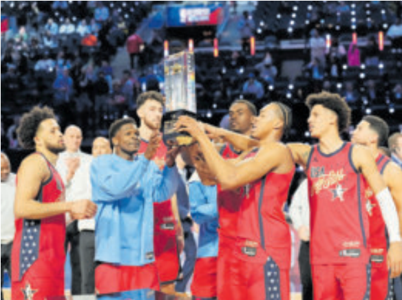
Edwards, de los Timberwolves, fue el mejor jugador.

“Fue una exhibición de baloncesto bastante buena. Mejor que el año pasado, en mi opinión. Fue divertido”, manifestó el pivot de San Antonio Spurs, quien lideró el conjunto Mundo, en rueda de prensa.