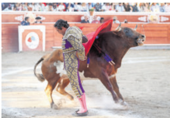
Sacó provecho en su actuación.

El ejemplar presentó poco recorrido y limitadas opciones, por lo que el torero optó por plantear una faena basada en la técnica y la suavidad, procurando no exigirle en exceso y ayudándolo en cada muletazo para mantener la continuidad de las embestidas. Aun así, logró construir pasajes de buen trazo y temple, destacando momentos de clase que conectaron con el público. La labor fue coronada con una estocada efectiva, ejecutada con verdad, lo que le permitió obtener una oreja como reconocimiento a su actuación.