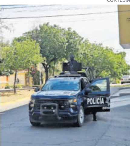
Tras una llamada al 911, se rescató a las dos personas.

policíacos arribaron al sitio, donde localizaron a una mujer de aproximadamente 25 años, quien se encontraba desorientada, con golpes visibles y lesiones en una pierna. La joven solicitó auxilio y señaló que había estado secuestrada, pero logró escapar minutos antes de la llegada de las autoridades. Mientras los agentes brindaban apoyo a la víctima, un sujeto armado salió de una vivienda cercana presuntamente en su búsqueda. Al percatarse de la presencia policial, intentó huir e ingresar nuevamente al domicilio, pero fue perseguido y detenido por los uniformados. Durante su captura se le aseguró un arma de fuego larga. Tras la detención, los policías revisaron el interior del inmueble, donde localizaron a otro hombre que también se en-