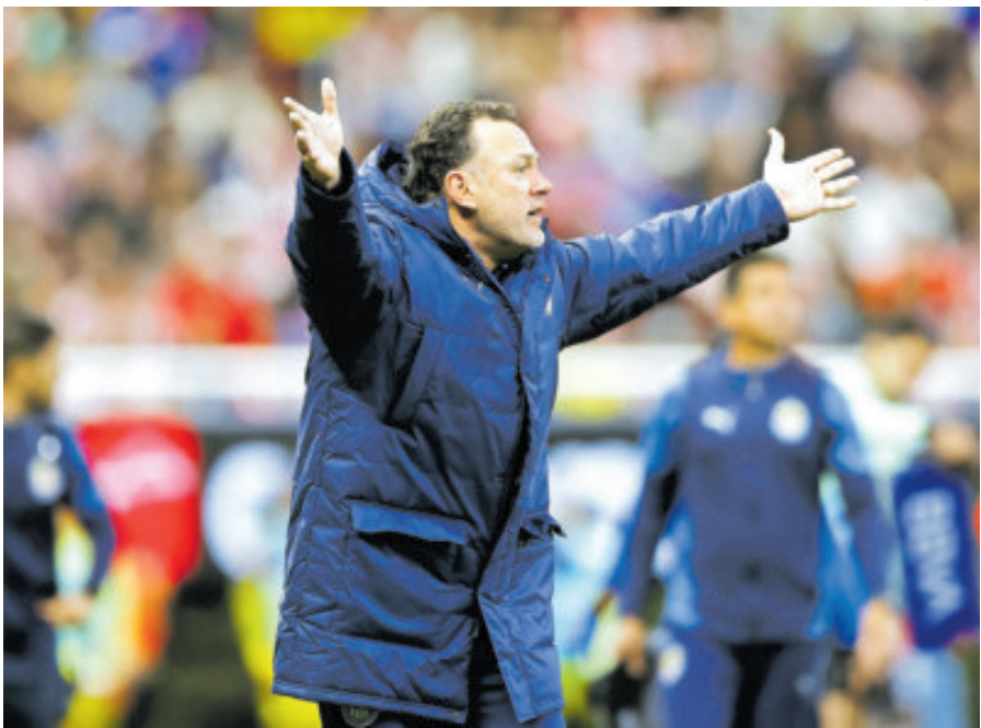
El técnico argentino reconoció la labor de los jugadores durante el Clásico.

A pesar de que ahora mismo todo es miel sobre hojuelas, el estratega sabe que el balompié de hoy es muy demandante y si no se mantiene el ritmo la caída puede ser estrepitosa, por lo que señala: “Nos