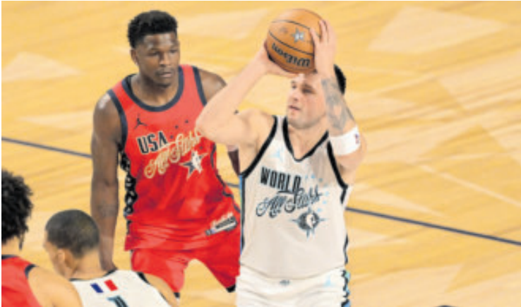
El equipo Resto del Mundo perdió sus dos partidos.