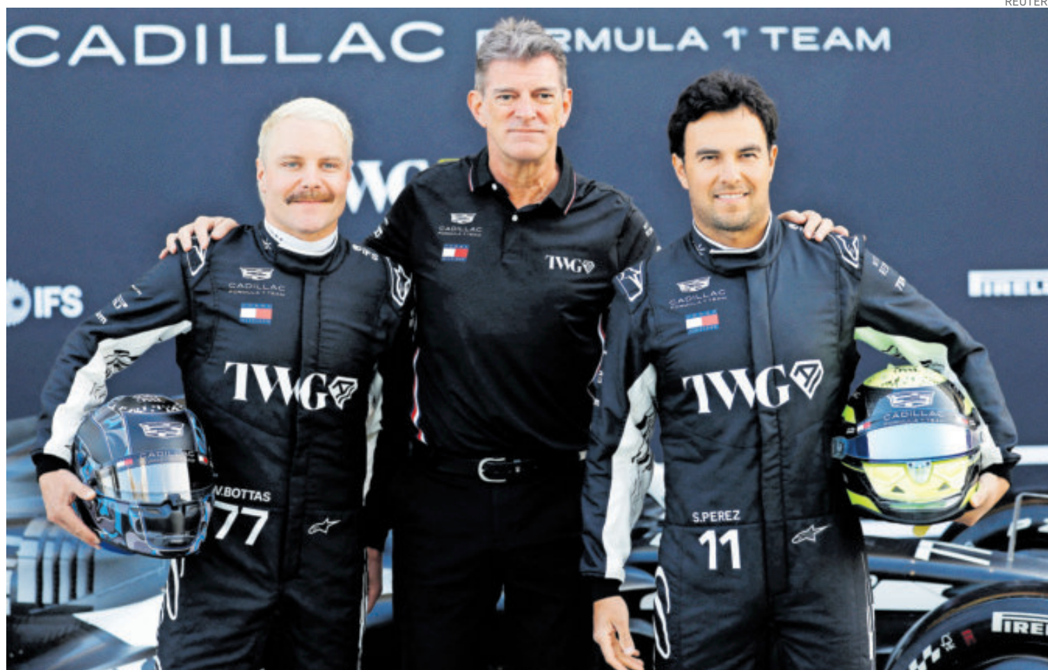
El equipo Cadillac trabaja fuerte en los entrenamientos para una mayor integración de cara a la apertura de la temporada de F1.