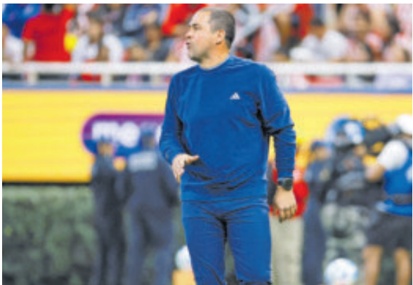
El brasileño dijo que tiene que trabajar más en el aspecto ofensivo, su talón de Aquiles en el torneo.

Sobre la falta de contundencia para mover las redes, compartió que: “Diría que nos ocupa, los momentos que sacamos a pensar y analizar, aseguro que el funcionamiento que quiero está lejos de lo que imagino. Tenemos que mejorar el nivel de Zende (Alejandro Zendejas), de Henry Martín, mejorar el funcionamiento de Veiga, que se adapta al ritmo y altitud,