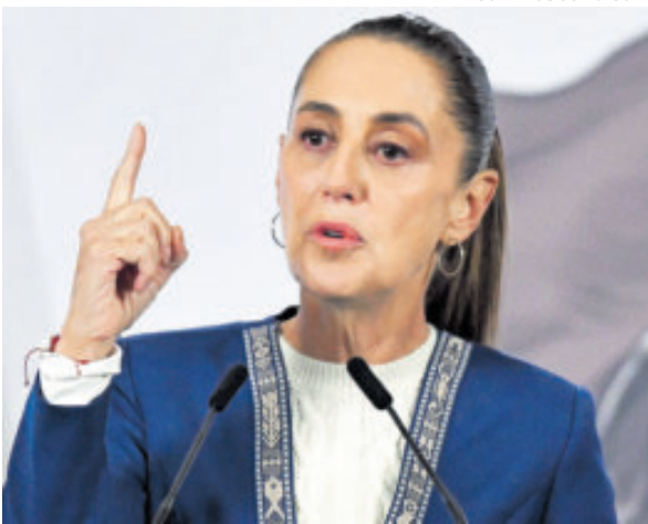
La presidenta Claudia Sheinbaum.

Ante ello, la Presidenta mexicana afirmó que el embargo “no tiene sentido” y defendió el apoyo energético por razones humanitarias, en medio de la crisis económica que enfrenta la isla y la escasez de combustible.