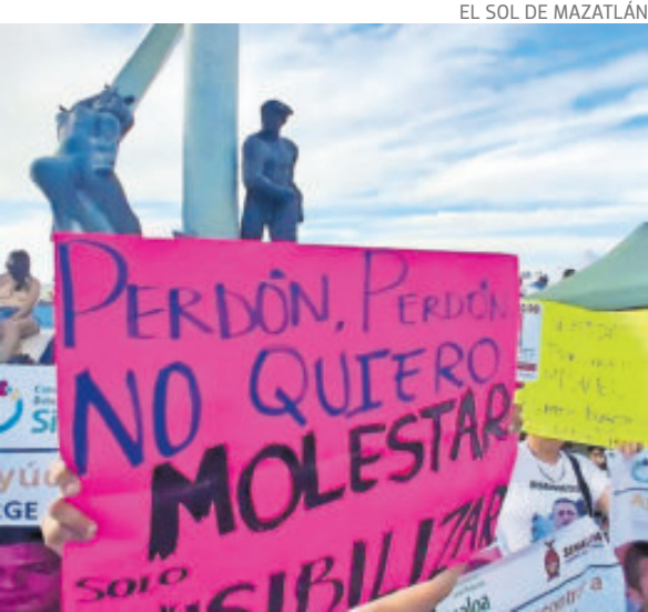
Cientos de personas marcharon ayer en Mazatlán.

La mazatleca recalcó que no se trata de una acción con mala intención y precisó que ella acudió de manera independiente, aunque en el contingente también participaron otras familias que se organizaron, así como integrantes de colectivos.