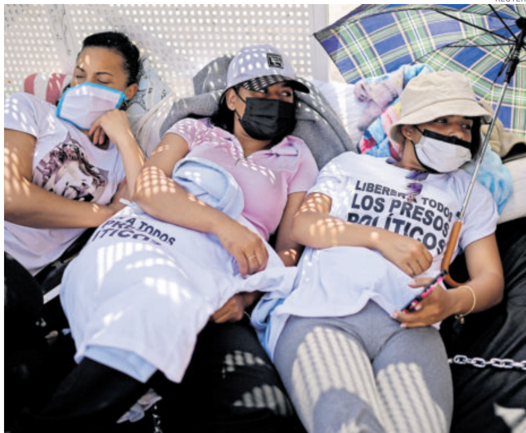
Familiares de presos políticos en huelga de hambre en Caracas sufren problemas de salud.

También se cierra la Fundación Misión Socialista Nueva Frontera de Paz, la Fundación Movimiento Bolivariano Revolucionario de la Reserva Activa