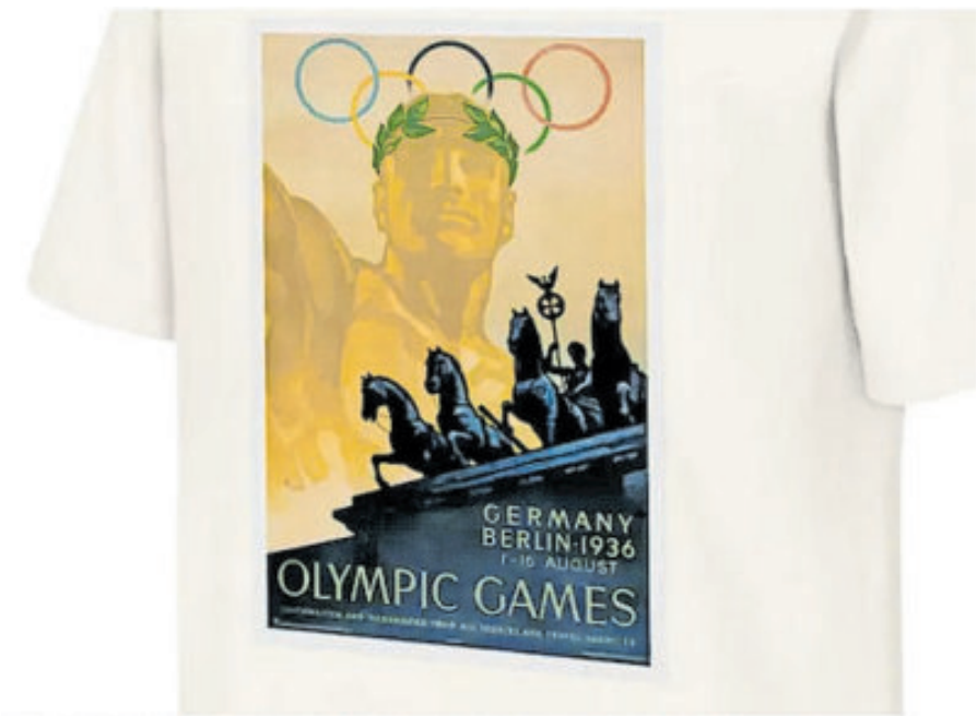
La camiseta de los Juegos Olímpicos de Berlín 1936 está disponible para su compra en el sitio web del COI (Tienda Olímpica).

Para el COI las marcas registradas también podrían perderse si no se utilizaran.