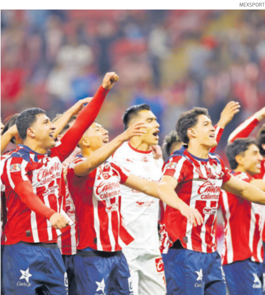
Había dudas sobre la racha del Rebaño por la calidad de los equipos a los que le había ganado, pero despejaron toda duda en el Clásico Nacional.