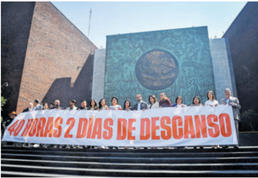
Legisladores de MC, afuera del Palacio Legislativo.