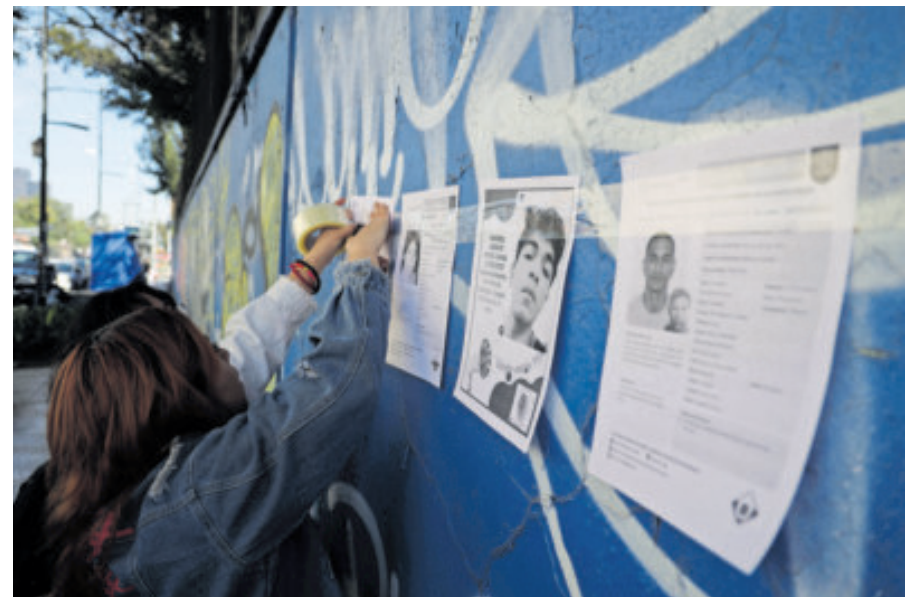
Colectivos en CDMX, al pegar fichas de desaparecidos.

La directora regional de Human Rights Watch señaló que, aunque en América Latina existen crisis extremas —como las dictaduras en Cuba y Venezuela o el colapso del Estado en Haití—, México “enfrenta otra forma de deterioro democrático, centrado en el desmantelamiento del