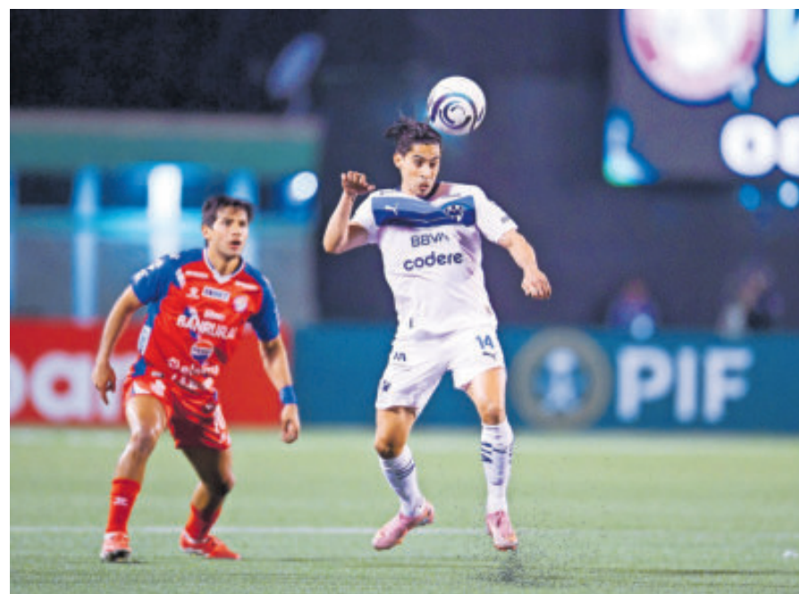
Ahora el equipo regio tendrá más margen para manejar el partido de vuelta.

En donde sí le atinó fue en meter a Corona al 60' y el alguna vez seleccionado