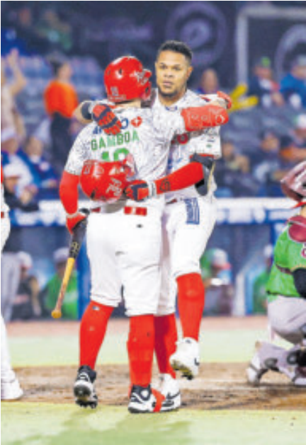
Con lo justo, la victoria de los Charros.

del Escogido derrotaron a los Federales de Chiriquí 16-15, en un encuentro que estableció un récord de carreras anotadas y les permitió alcanzar su tercera victoria en la Serie del Caribe Jalisco 2026, que se celebra en el Estadio Panamericano, casa de los Charros de Jalisco. Las 31 carreras combinadas entre ambos equipos superaron la marca previa de 28, establecida el 6 de febrero de 1990 en Miami, cuando los Naranjeros de Hermosillo vencieron 20-8 a los Senadores de San Juan. El partido de este miércoles en Jalisco fue una verdadera batalla ofensiva, en la que ambos equipos utilizaron 15 lanzadores y se conectaron 34 imparables, quedando a solo tres del récord histórico. La victoria fue para Emailín Montilla, la derrota recayó en Enrique Saldaña y Jimmy Cordero se apuntó su tercer salvamento del torneo. En el encuentro se conectaron cuadrangulares de los panameños Luis Castillo, José Ramos y Jhonny Santos, así como del dominicano Franchy Cordero. Con este triunfo, los dominicanos quedan prácticamente clasificados a las semifinales, mientras que Panamá enfrentará este jueves a Puerto Rico en un duelo que podría resultar decisivo para sus aspiraciones.