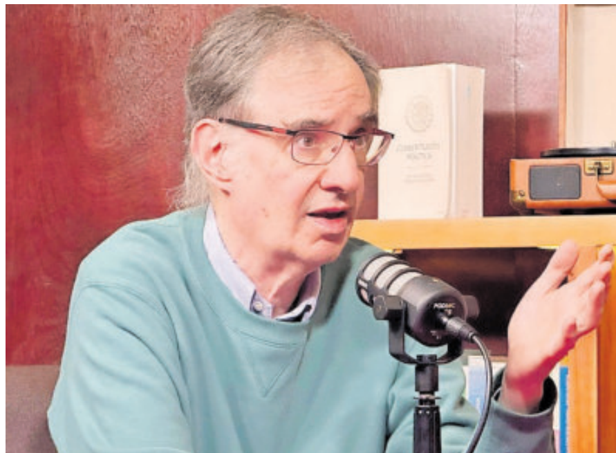
José Woldenberg, exconsejero presidente del IFE, es uno de los impulsores de la iniciativa.