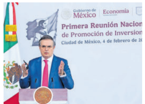
Marcelo Ebrard busca aumentar el portafolio de inversión.

El funcionario también resaltó que México es actualmente el principal socio comercial de Estados Unidos, con el arancel más bajo entre sus principales socios. A esto se suma un récord histórico de inversión extranjera directa registrado en 2025.