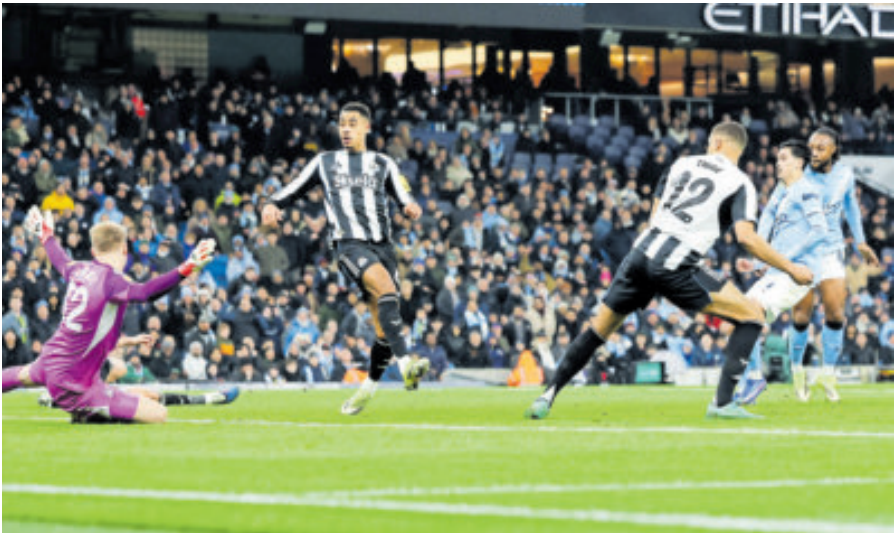
Manchester City no tuvo el menor problema para liquidar al Newcastle, con un global de 5-1, y ahora deberá definir frente al Arsenal al monarca del torneo.

El Manchester City avisó desde los primeros compases, y en apenas siete minutos, se adelantó en el marcador por medio de Marmoush, que tras una pared con Nico O'Reilly, se aprovechó de un despeje de