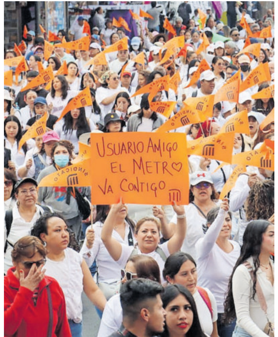
Participaron 12 mil trabajadores de diferentes secciones.