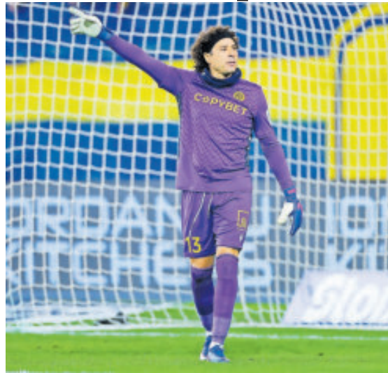
Guillermo Ochoa sonríe en el futbol de Chipre.