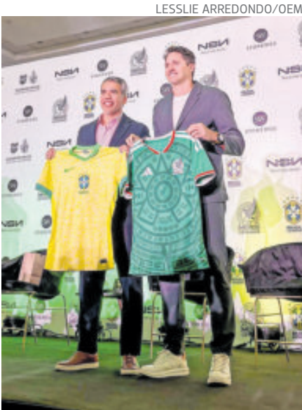
Pável Pardo y Edmílson prometieron un buen duelo en el estadio Azteca.

"Tener un partido de leyendas ante un rival tan prestigioso y con el que hemos tenido partidos increíbles es sensacional. México y Brasil son dos pueblos apasionados del fútbol, que se juega en las calles de cada ciudad y es un placer llevarlo a este estadio tan histórico que por tercera vez va a ser sede de un Mundial", apuntó