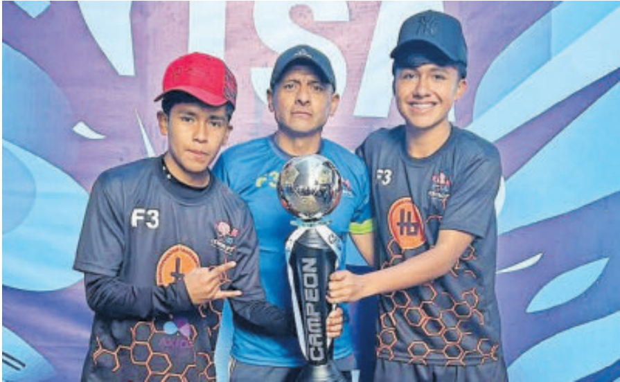
Los monarcas celebraron su triunfo y la clasificación al torneo internacional.