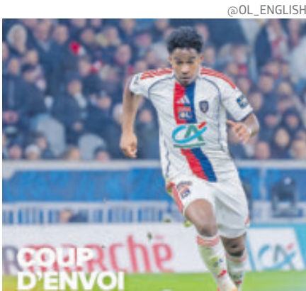
El delantero brasileño nuevamente fue clave para el triunfo del Lyon.