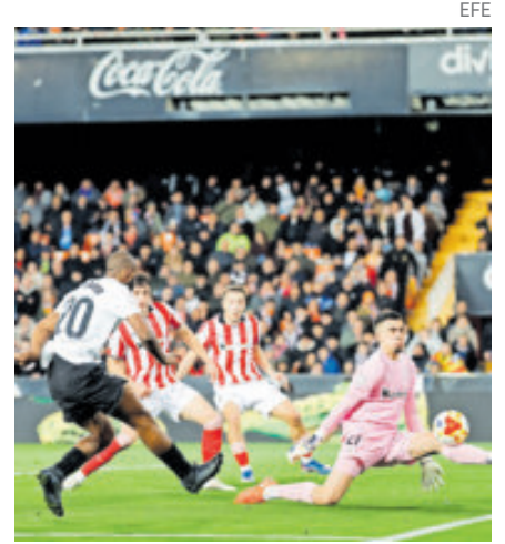
CALIFICAN A SEMIS DE LA COPA DEL REY