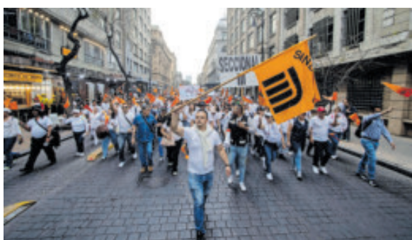
Protestaron por abandono de los trenes.