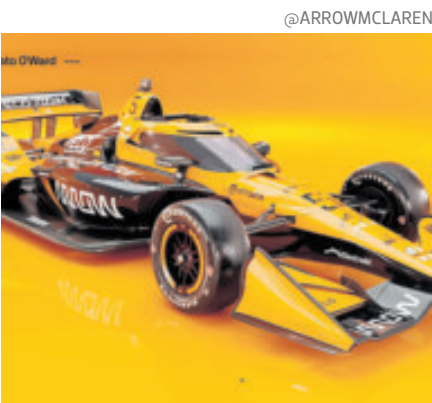
Tiene un más intenso color papaya.

El piloto mexicano Sergio Pérez, pieza fundamental en la flamante escudería Cadillac, que este año debuta en la Fórmula I, aseguró que ni siquiera se dejará ganar la pelea por su compañero Valtteri Bottas. Ambos pilotos, de probada experiencia, tratarán de agenciarse el puesto de primer piloto dentro del equipo estadounidense, por lo que entre ellos mismos, considera Pérez, saldrán a pelearse los puntos. “Disfrutar de este regreso no significa pasearme los domingos, para mí es crucial tener esa motivación para asegurar que progresamos mucho. Será una competencia interna muy buena”, dijo el tapatío.