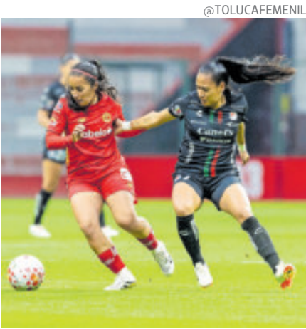
Las escarlatas impusieron su localía.