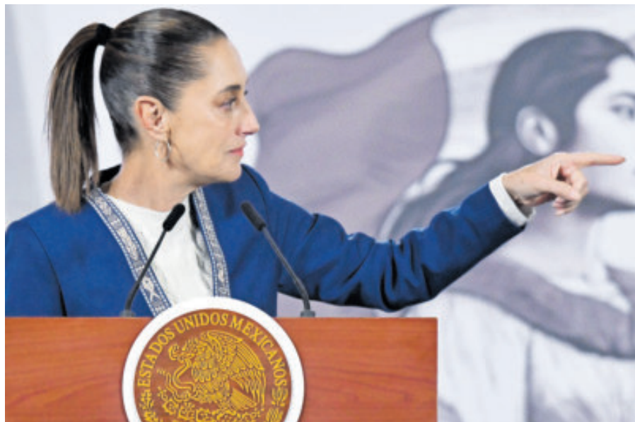
La presidenta Claudia Sheinbaum, ayer, en la mañana.