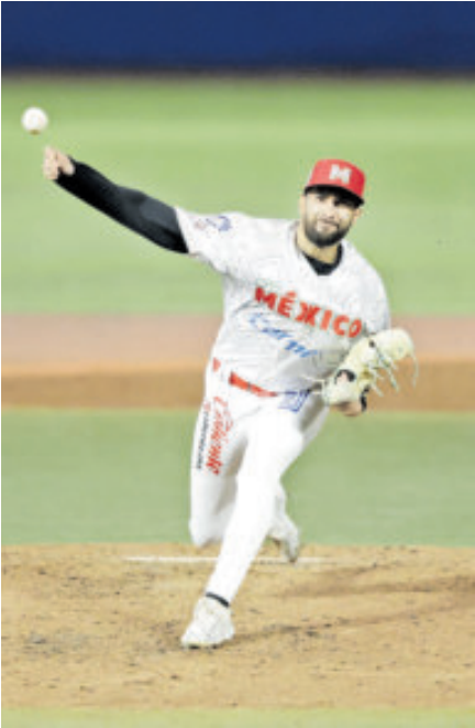
La novena jalisciense se pone 3-1 en la Serie del Caribe.

DOMINICANA, A SEMIFINALES En el primer juego de la jornada, Leones