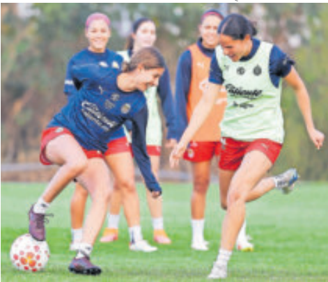
El Rebaño va de visita ante las Centellas, en busca de su sexto triunfo del torneo.

Las rojiblancas ocupan el tercer lugar de la clasificación general con 16 puntos y buscan un triunfo que las lleve a la cima general.