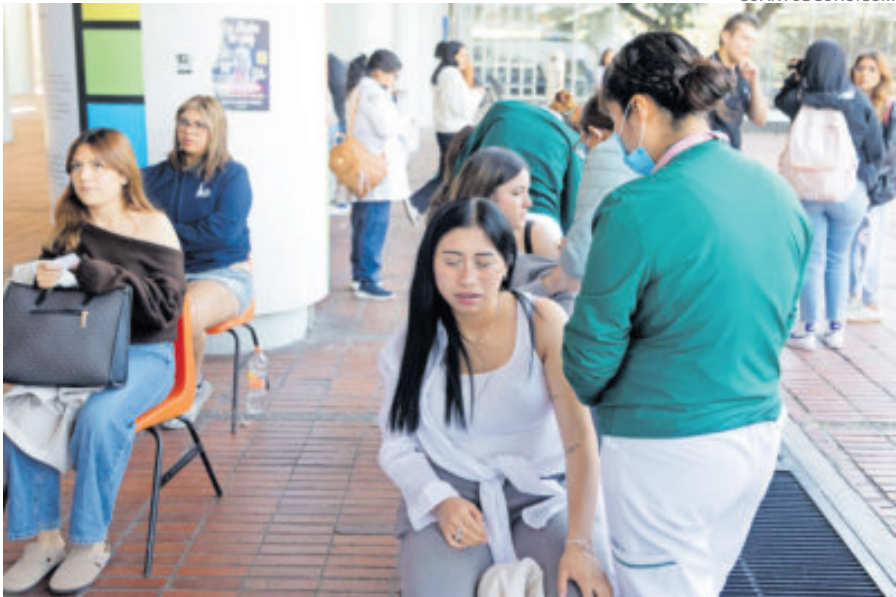
Jornada de vacunación en la Facultad de Medicina de la UNAM.

La OPS subrayó que el caso mexicano resulta relevante por su impacto en la dinámica regional, ya que la magnitud de los contagios incrementa el riesgo de propagación transfronteriza, circunstancia que reforzó la necesidad de intensificar la vigilancia epidemiológica de cara a la Copa Mundial de Fútbol de 2026 y otros encuentros masivos con alta movilidad de personas.