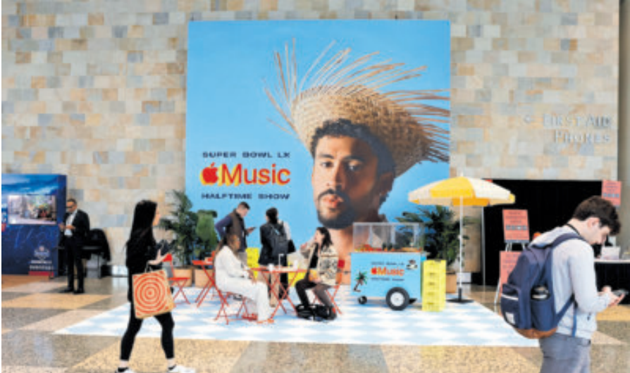
La imagen del 'Conejo Malo' con su sombrero de paja está por todos lados.

"Creo que se merece el respeto el artista y lo que ha representado para la música. A mí me encanta, creo que cuando tienes la oportunidad de presenciar este tipo de eventos en vivo, por la tele, es otra cosa, yo siempre aprovecho y tomo ese descanso para ir al baño rápido y no perderme el medio tiempo. En esta ocasión voy a tratar de estar ahí siempre porque sé que va a ser un gran espectáculo y qué bueno