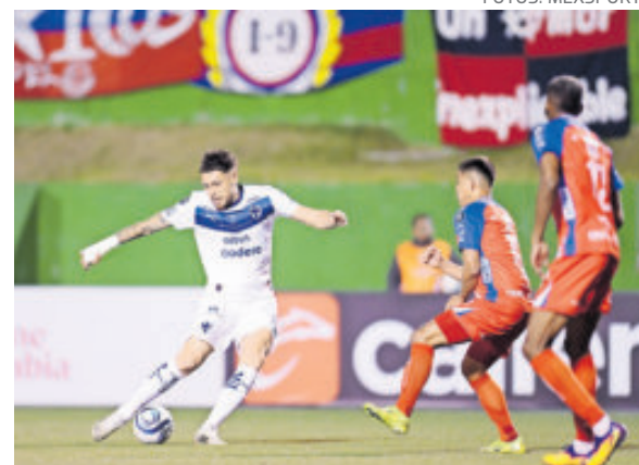
Monterrey sufrió durante el partido ante el sorprendente equipo guatemalteco.