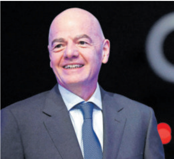
Gianni Infantino. Nadie respalda su propuesta.

Los equipos rusos y bielorrusos, así como las selecciones nacionales de ambos países, fueron excluidos de las competiciones internacionales a raíz de la invasión de Ucrania a principios de 2022. "Este veto no ha conseguido nada, solo ha creado más frustración y odio. Que los niños y niñas de Rusia puedan jugar al fútbol en otras partes de Europa podrá ayudar", señaló Infantino. Estas palabras fueron rechazadas por el comisario europeo, que recordó que la seguridad pública, la claridad y los símbolos "importan". "Permitir que los agresores regresen al fútbol mundial como si nada hubiera pasado ignora los verdaderos riesgos de seguridad y el profundo dolor causado por la guerra. Banderas, uniformes e himnos representan estados, acciones y valores. La normalización es inaceptable", subrayó Glenn Micallef.