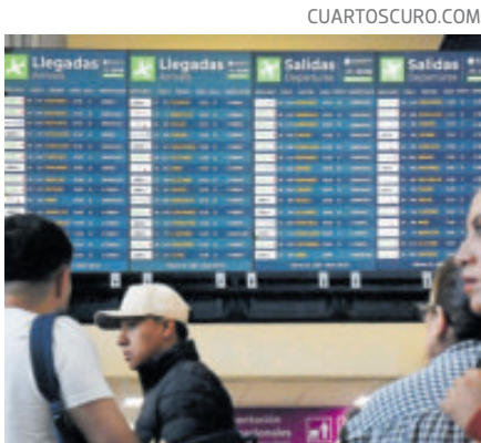
La operatividad del aeropuerto está a cargo de la Marina.

Este es el segundo año consecutivo en que el AICM es reconocido por su puntualidad en la tercera posición dentro de los aeropuertos globales. Este logro se dio pese a la caída en usuarios registrada en 2025 y las obras de remodelación previas al Mundial de FIFA 2026.