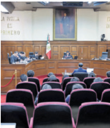
El pleno de la Suprema Corte, ayer, en sesión.

Así, en los casos en que una persona menor de edad se encuentra en acogimiento preadoptivo, “la expedición de un