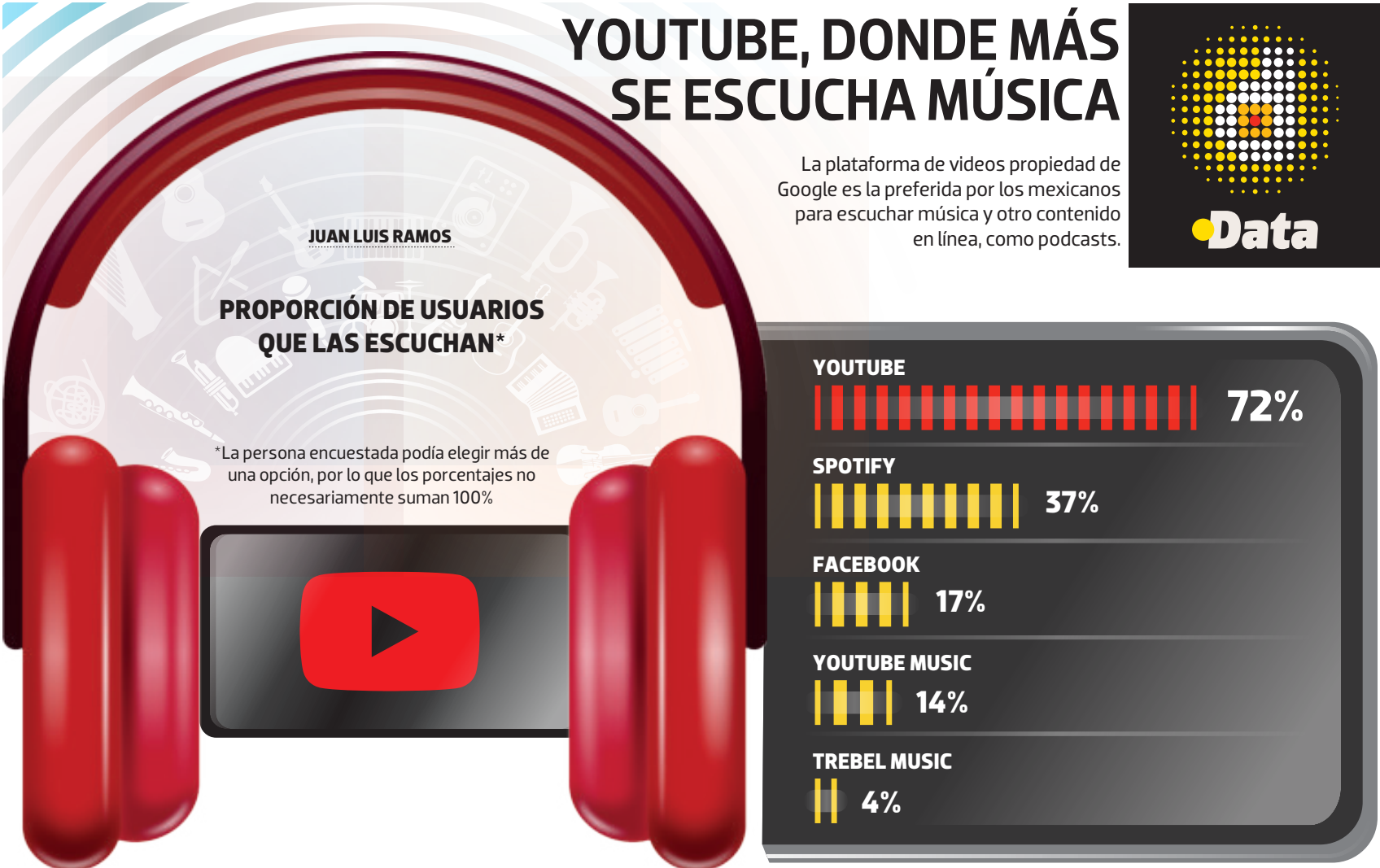
Gráfico: Daniel Rey