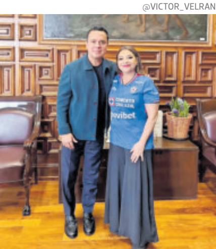
Parece que ahora sí va en serio la edificación de la nueva casa celeste.