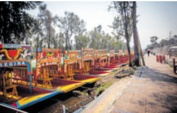
Operan alrededor de 216 trajineras.

Explicó que la obra consiste en la rehabilitación prácticamente total del embarcadero, con equipamiento sustentable, instalaciones construidas principalmente