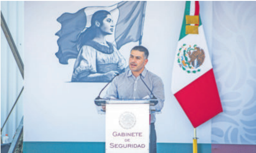
Omar García Harfuch, secretario de Seguridad y Protección Ciudadana.

La Presidenta reiteró que su administración “evita el enfrentamiento militar