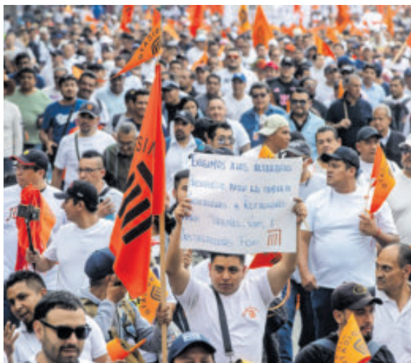
Presentaron diversos carteles con peticiones.