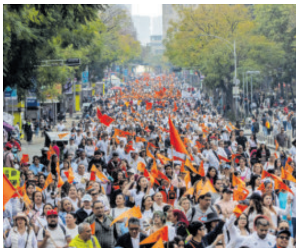
Partieron de Balderas al Zócalo capitalino.

La marcha partió del cruce de Balderas y Chapultepec y avanzó de manera organizada hasta llegar al Zócalo capitalino, donde, al encontrarse el perímetro resguardado con vallas, el dirigente sindical explicó que la movilización fue acordada desde el pasado 29 de enero, luego de que