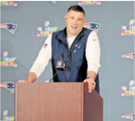
Vrabel sabe lo difícil que es la semana previa al gran juego.