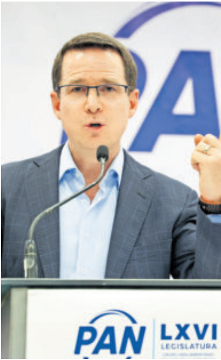
Ricardo Anaya, coordinador del PAN en el Senado.

manera integral, se advierte que no existe un cambio real en la carga laboral y que, además, su implementación será gradual, por lo que, en la práctica, prácticamente no habrá modificaciones para las personas trabajadoras.