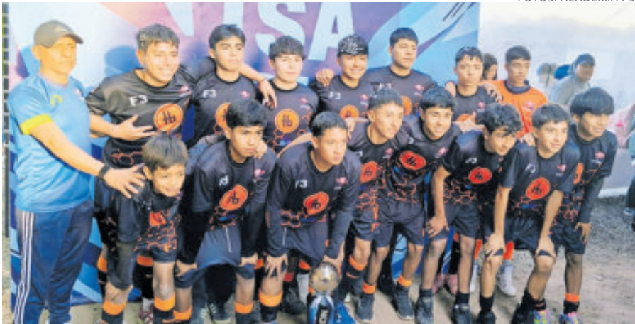
Los monarcas celebraron su triunfo y la clasificación al torneo internacional.

García es el titular indiscutible en el Barça para Hansi Flick. Sin embargo, tras completar el segundo encuentro con su nuevo equipo, este nuevo contratiempo pone en entredicho su participación en el torneo de selecciones que se disputará en Canadá, México y Estados Unidos, que supone una gran oportunidad en su carrera después de años como suplente de Manuel Neuer. La trae chueca Marc-André ter Stegen.