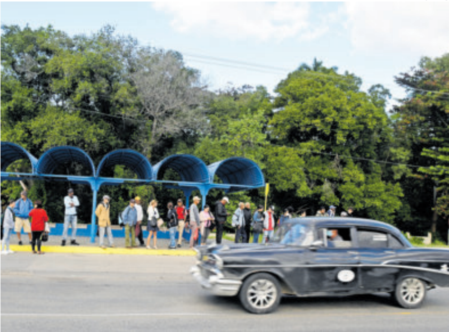
Decenas de personas en La Habana hacen fila a la espera del transporte público.

A LOS OBJETIVOS planteados con antelación por el Ejecutivo y exigen una discusión de fondo.