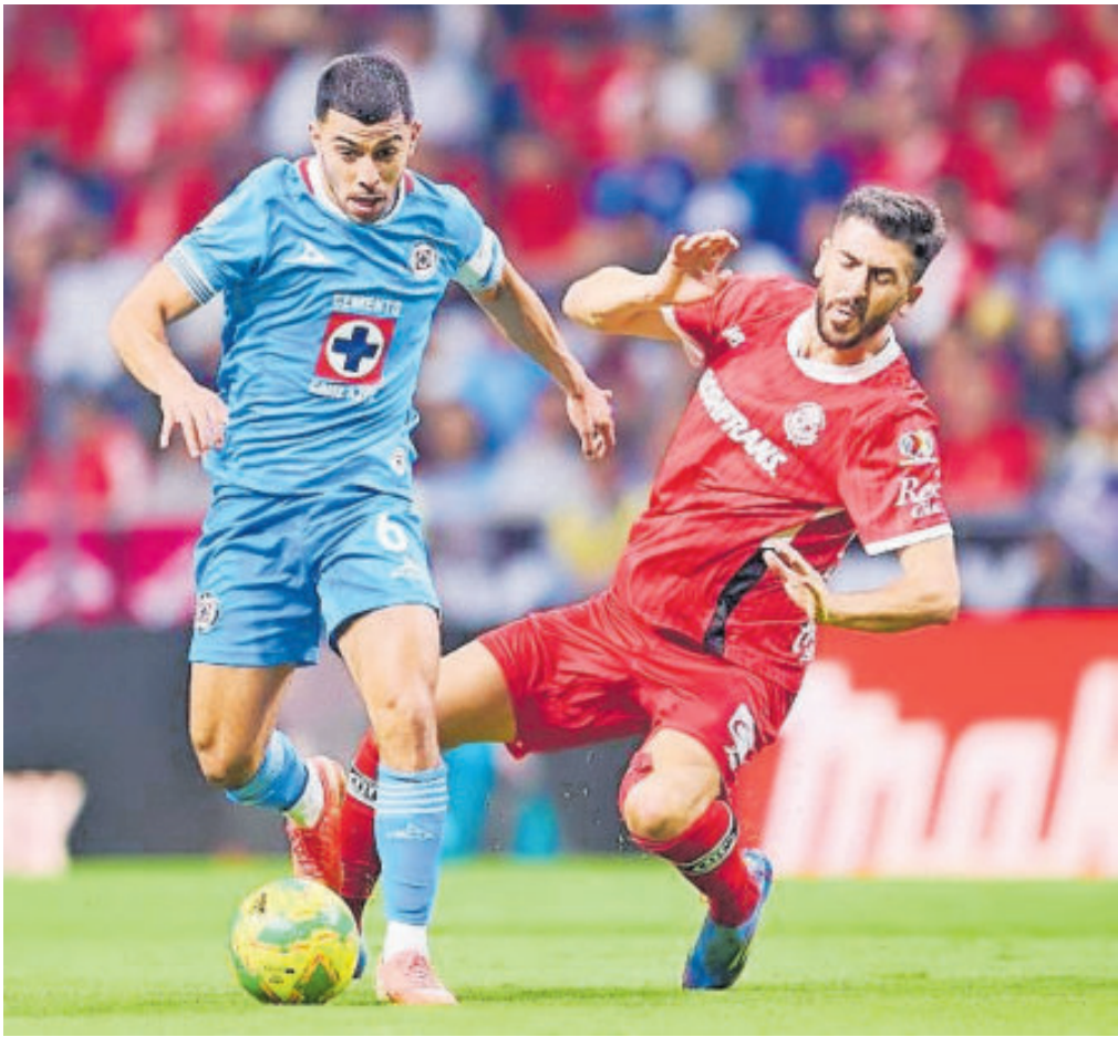
Los cementeros visitan al Toluca en un duelo que sin duda va a sacar chispas.