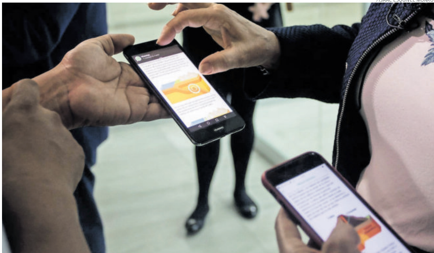
/ISAAC ESQUIVEL MONROY

El usuario tiene como límite para registrar su teléfono hasta el 30 de junio de este año.