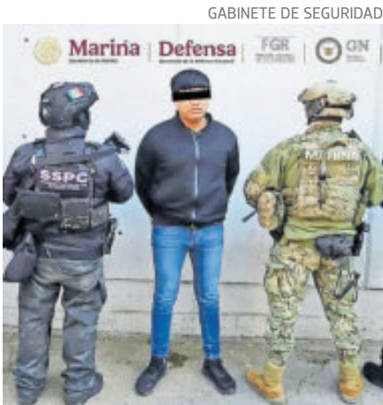
Coordinaba la venta de drogas.

Este arresto se dio en un operativo de las fuerzas de seguridad tras cuatro meses de investigación, añadió, en el que también