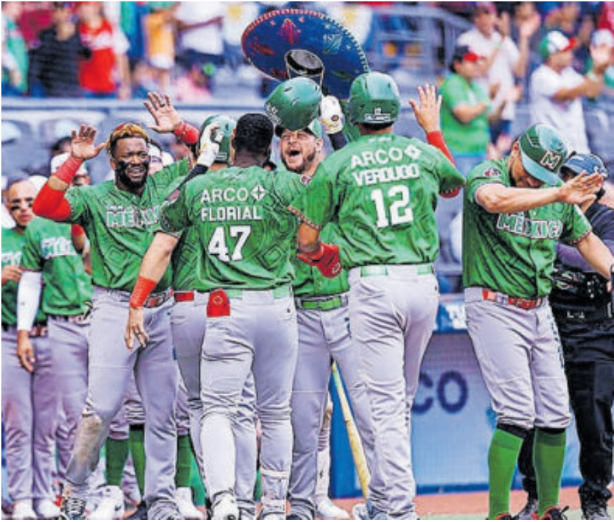
Los Tomateros vinieron de atrás para llegar a la final.