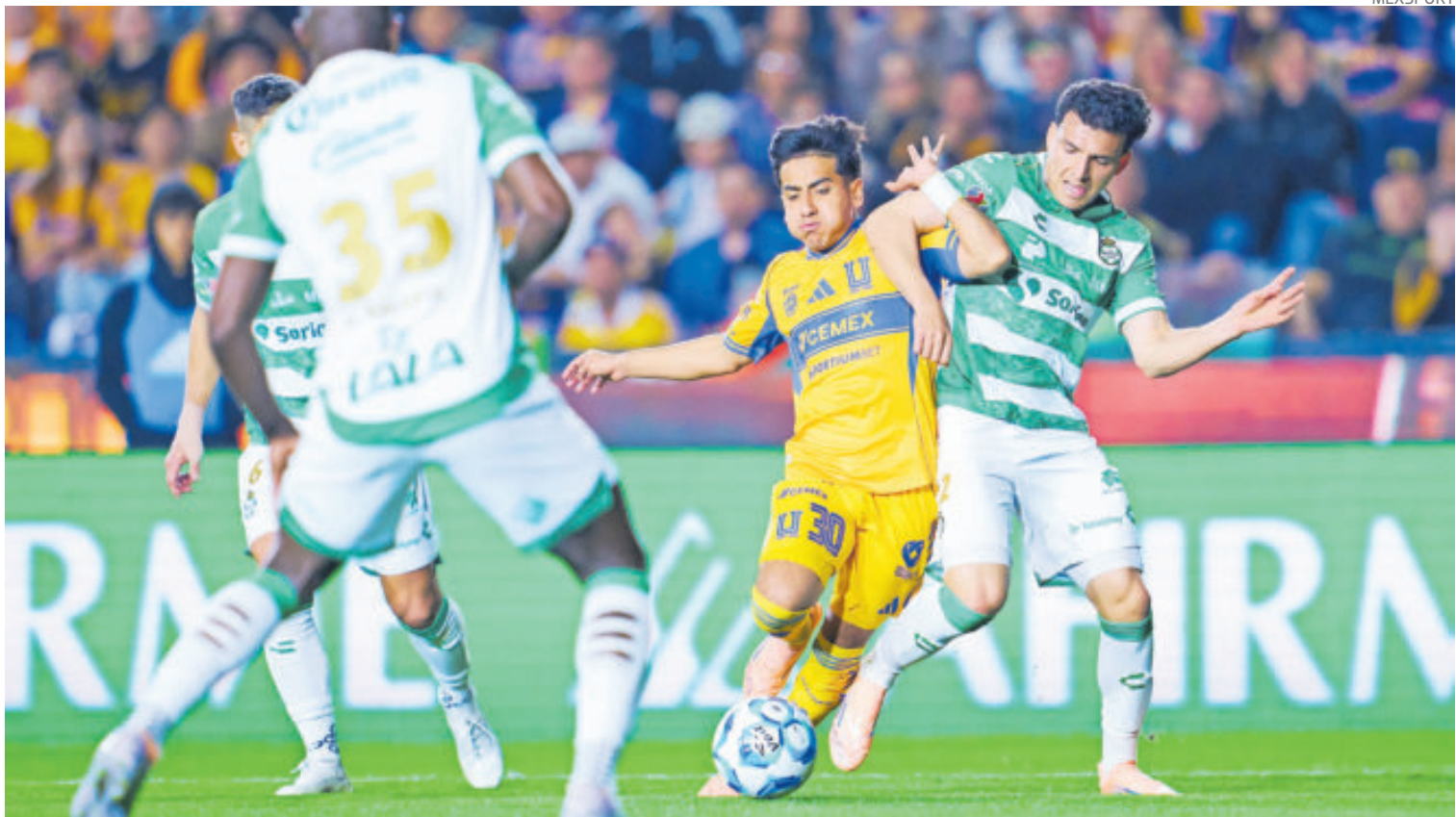
Tigres aprovechó la debilidad del Santos Laguna para darse un festín, sumar su tercer triunfo del torneo y amanecer de sublíder.