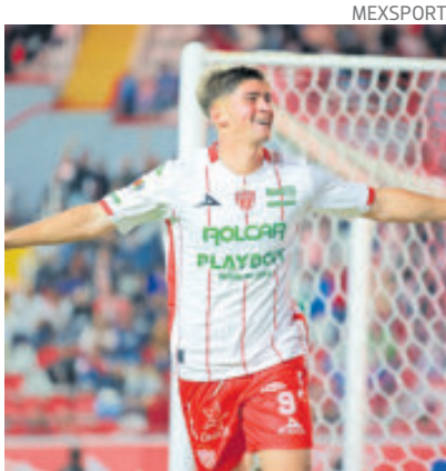
Jugando a medio gas, los Rayos humillaron al equipo potosino.