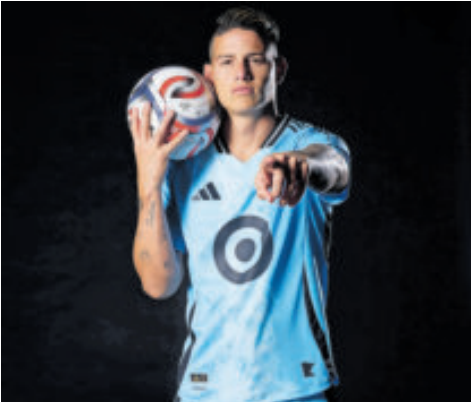
El colombiano encontró acomodo en la MLS y le viene bien rumbo al Mundial.

El club dijo que buscaban un portero joven, atlético y con proyección, y encontraron exactamente eso en Campos Jr, mexicano-estadounidense de 19 años.