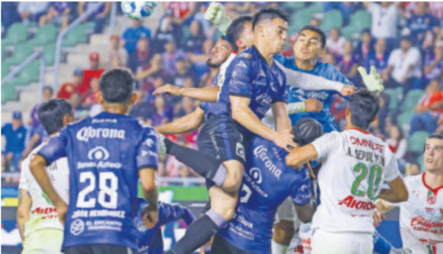
Al final del partido Chivas desaceleró y Mazatlán amenazó con alcanzarlo en el marcador, pero pese a ello, el Rebaño se defendió bien y sacó la victoria.