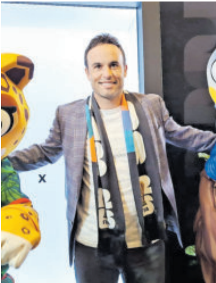
El Capitán América otra vez al ataque y lanza sus misiles hacia el Tricolor.

Donovan desea lo mejor a EU, pero tampoco es que traigan un trabuco, lo que pasa es que México ha estado bajo de nivel.