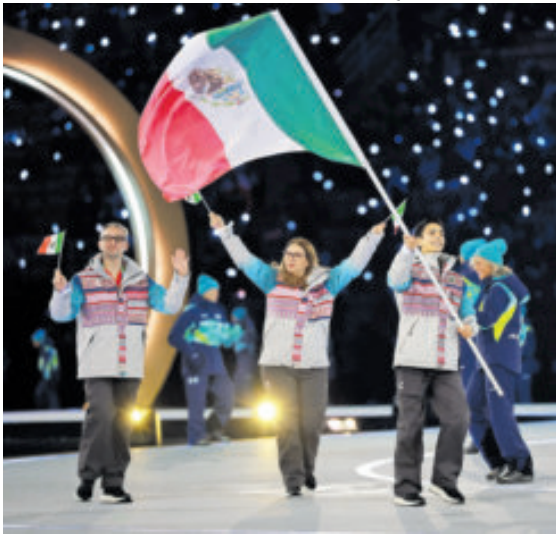
La delegación mexicana en el desfile inaugural.

las campeonas olímpicas de voleibol Anna Danesi, Paola Egonu y Carlotta Cambi. La antorcha salió de San Siro y, después de un mensaje de paz de la sudafricana y estadounidense Charlize Theron, inspirado en Nelson Mandela, vino el encendido de los dos pebeteros de estos juegos. Dichos pebeteros fueron encendidos por los esquiadores Alberto Tomba y Deborah Compagnoni, ambos tres veces campeones olímpicos, en el Arco de la Paz de Milán; y por la también esquiadora Sofia Goggia, campeona olímpica en 2018, en la Plaza Dibona de Cortina d'Ampezzo. Es primera vez en la historia que unos Juegos Olímpicos cuentan con dos pebeteros que custodian dos llamas diferentes. La sede principal de la ceremonia de apertura de estos Juegos Olímpicos fue el mítico Estadio Giuseppe Meazza (San Siro) de Milán, en lo que fue su último gran evento antes de ser derribado para la construcción de un nuevo estadio. La ceremonia contó con interpretación de Laura Pausini, Mariah Carey y Andrea Bocelli, entre otros artistas.