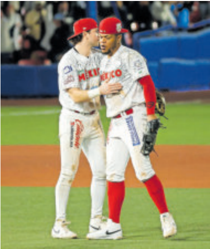
La felicitación entre los jugadores tras la victoria.