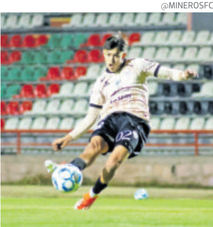
Los Mineros logran amargo empate.