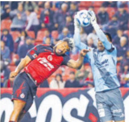
Los Xolos decepcionan en su cancha con un empate soporífero ante Puebla.