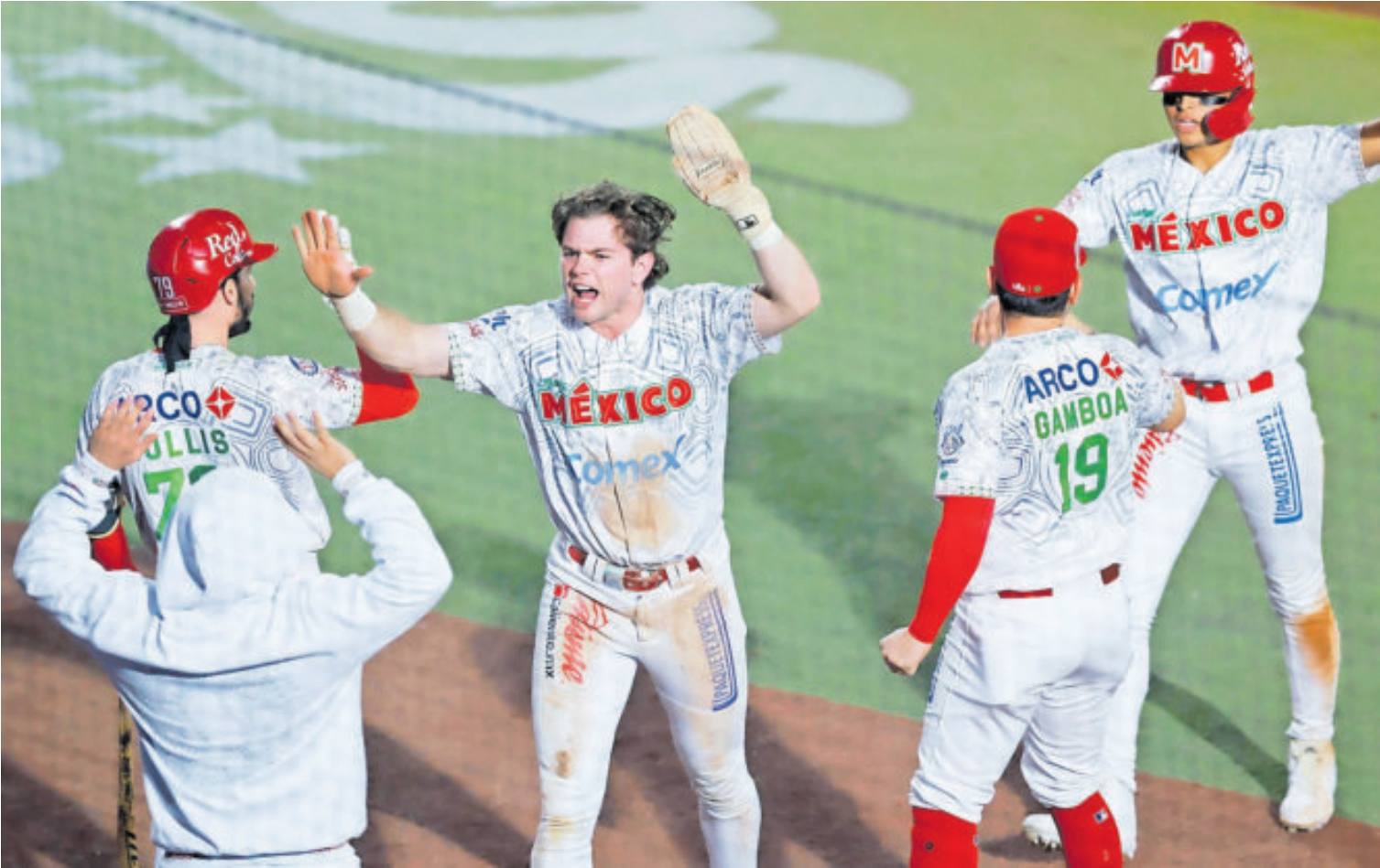
En la séptima, los Charros le dieron la vuelta con tres carreras.