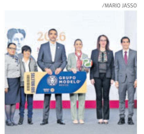
Abre la chequera del 2025 al 2027.

Escalante explicó que el contexto nacional ha permitido sostener el desempeño de la empresa. "El contexto económico político en el país ha sido súper favorable para nosotros continuar con los buenos resultados", señaló durante su intervención.