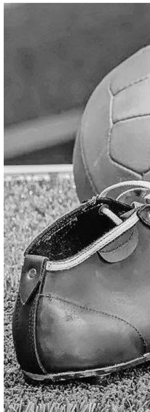
El balón dejó de rodar y los tacos se quedaron.

fondear a ninguna de las federaciones de fútbol de los países europeos.