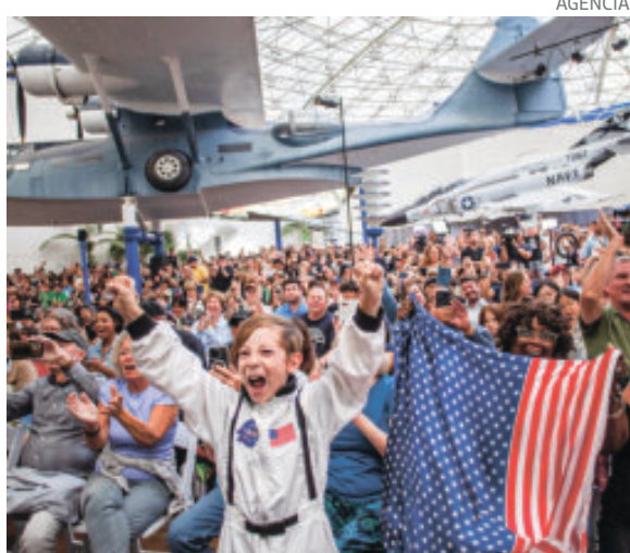
Decenas de personas festejaron el amerizaje exitoso.

Su cápsula Orion realizó un amerizaje suave, a 30 kilómetros por hora, en el océano Pacífico, frente a la costa de