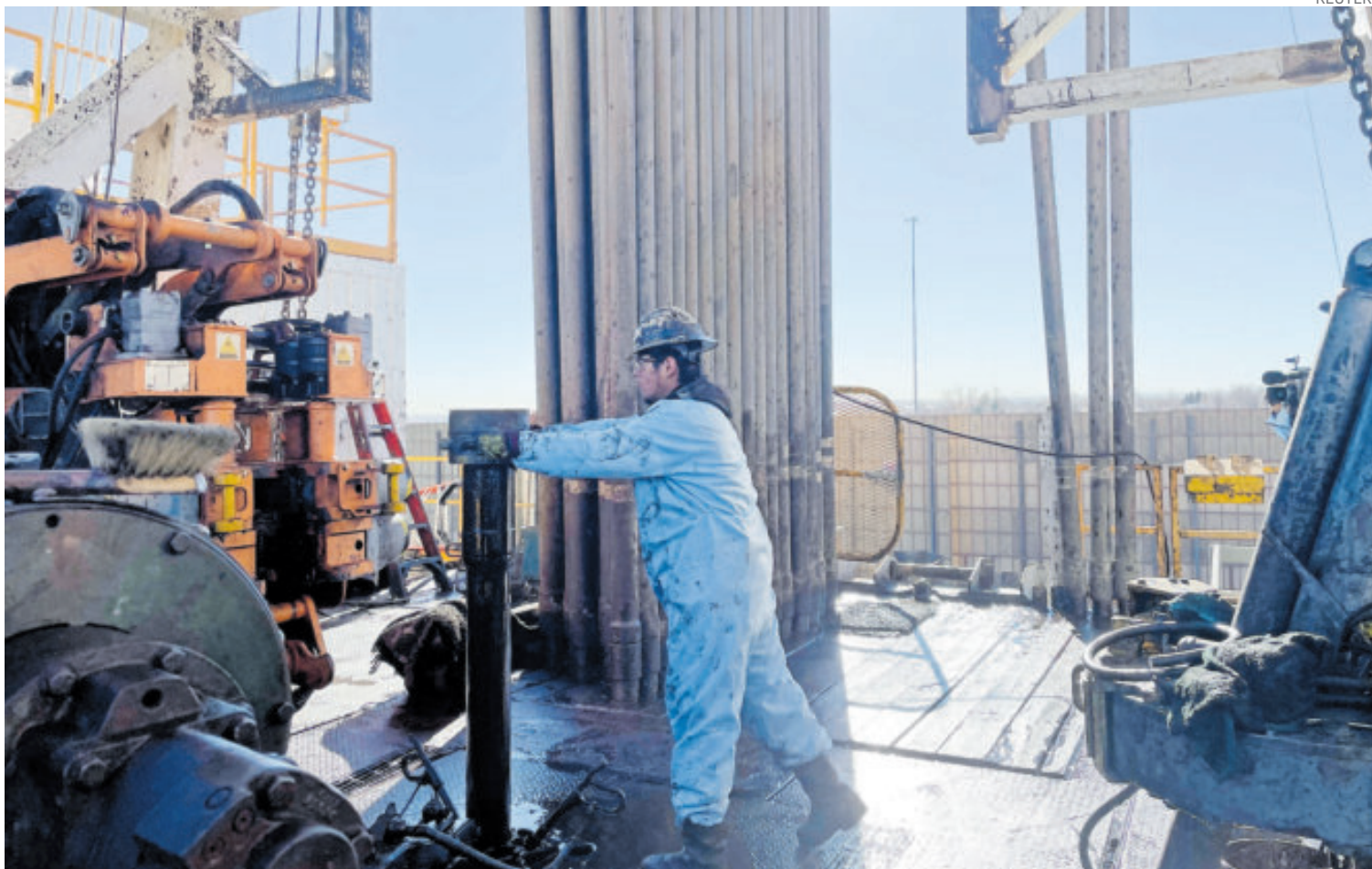
La técnica consiste en inyectar agua a alta presión mezclada con arena y químicos para romper la roca y liberar los hidrocarburos.