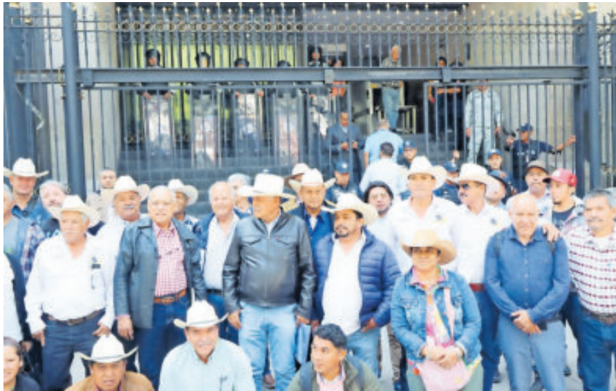
Les cierran la puerta cuando ya estaban en la Secretaría de Gobernación.

“No podemos quitar a nuestros compañeros porque si de aquí no sacamos soluciones a los problemas del campo, nos vamos a volver a manifestar (...) y que no