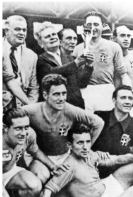
Italia no pudo defender la corona.

No había la infraestructura necesaria en todo el Viejo Continente, ni dinero para