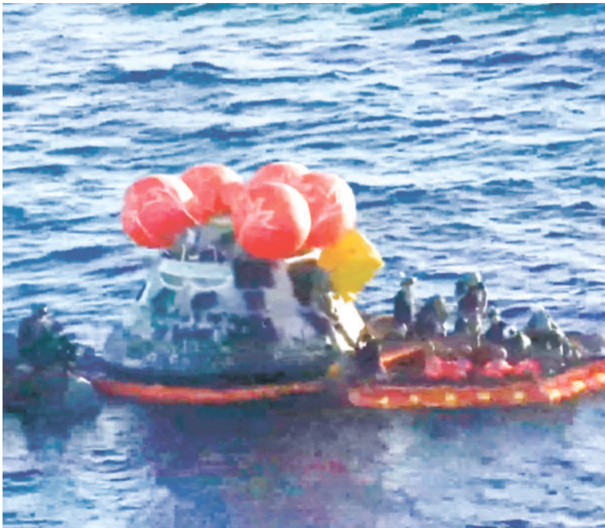
La cápsula fue rescatada de las aguas del Pacífico por elementos militares.