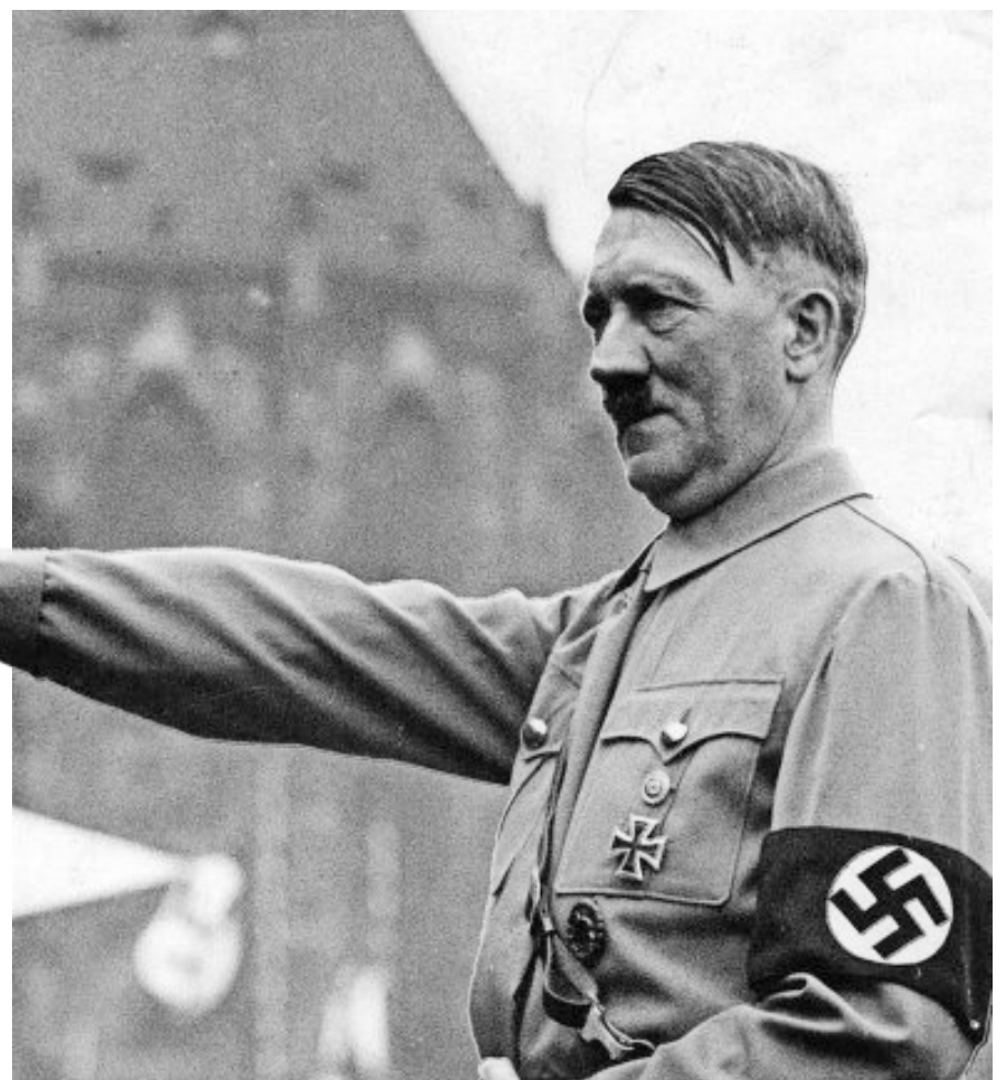
Historia negra. Hitler y los nazis provocaron terror y muerte en Europa.

6 AÑOS duró la Segunda Guerra Mundial, pero la reconstrucción de los países europeos tardó muchos años más.