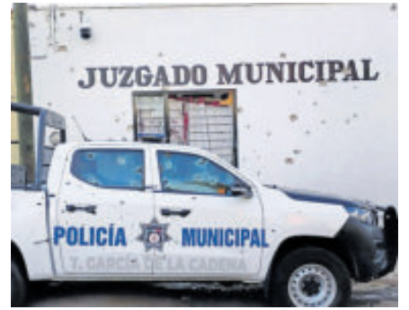
Así terminaron fachada y patrulla.

Acusó que estaban a las 10:00 am, pero los recibió un muro de policías y granaderos. Asimismo, explicó que entre agricultores y transportistas habían hecho una comitiva de 60 representantes de todos los estados del país, pero la Secretaría de Gobernación se negó a recibir a todos y pidió ajustar la comitiva a máximo 20 representantes. La mesa de diálogo nunca se concretó porque desde la Secretaría de Gobernación también había exigencias de que no hubiera bloqueos carreteros ni cierres de casetas de peaje.