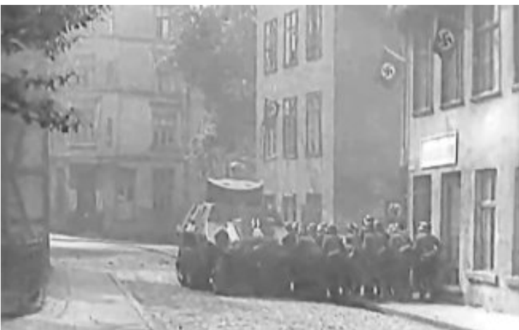
Europa vivió la destrucción y quedó devastada por la guerra.