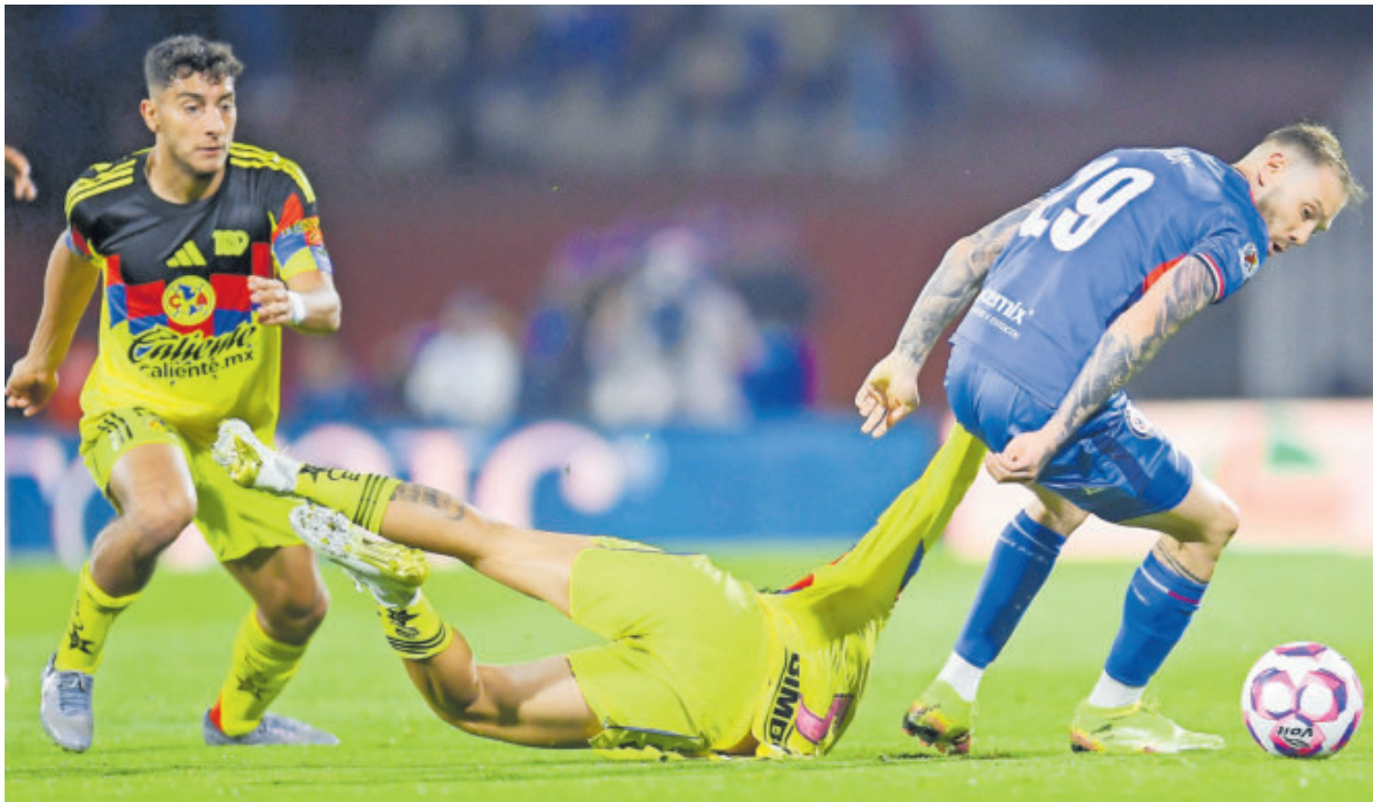
América y Cruz Azul encaran el Clásico con la urgencia de un triunfo.