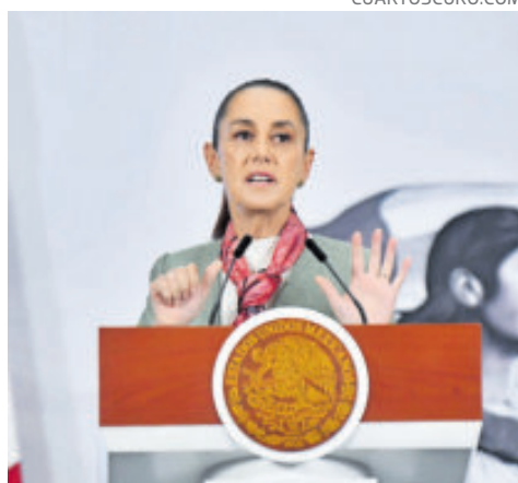
Hay acompañamiento técnico y recursos.

“Sí, se está apoyando. A todos los estados de la República, tanto en la prevención, el