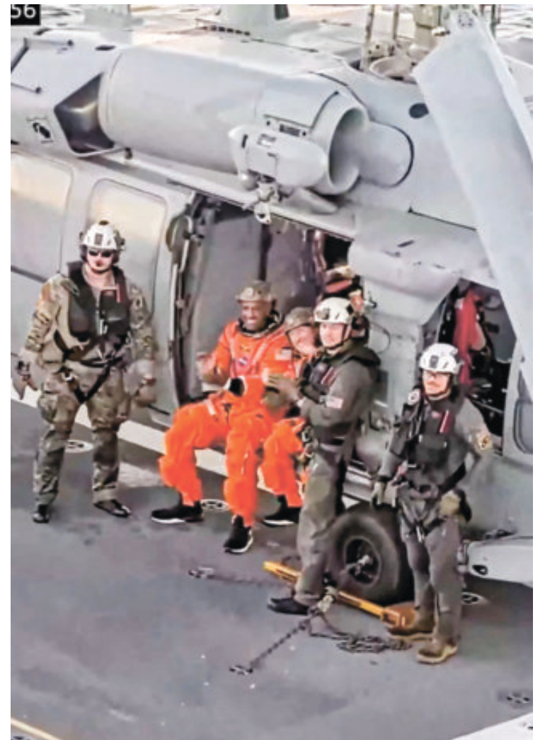
Posteriormente fueron trasladados a suelo firme en helicóptero.