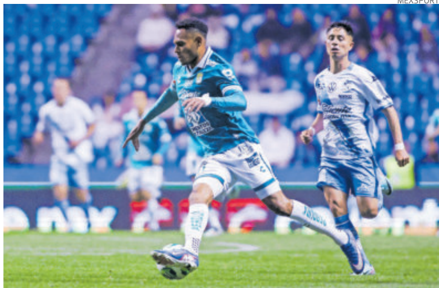
La Fiera saca un triunfo valioso que le da vida y Puebla está virtualmente fuera.