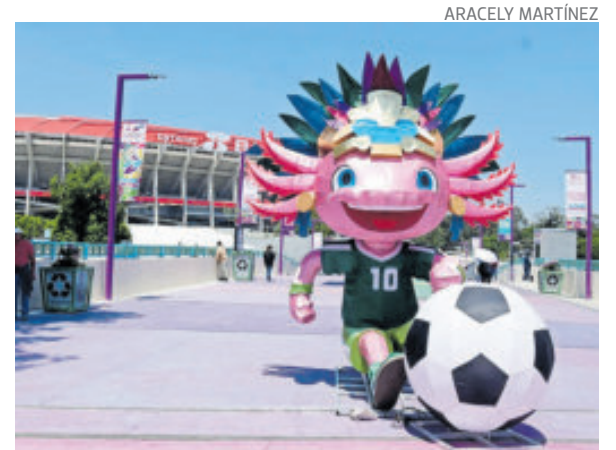
Muchos aficionados van a sufrir hoy en el Azteca.

Por otra parte, el Estadio Banorte informó que solamente aquellos que adquirieron un cajón de estacionamiento en mil 139 pesos en la plataforma de Fanki podrán hacer uso del mismo. Eso quiere decir que no habrá posibilidad de comprar un lugar de estacionamiento el día del partido, por lo que se le recomienda a la gente que no lleve vehículo ya que no se le permitirá el acceso, a menos que demuestre que pagó su cajón a ese precio.