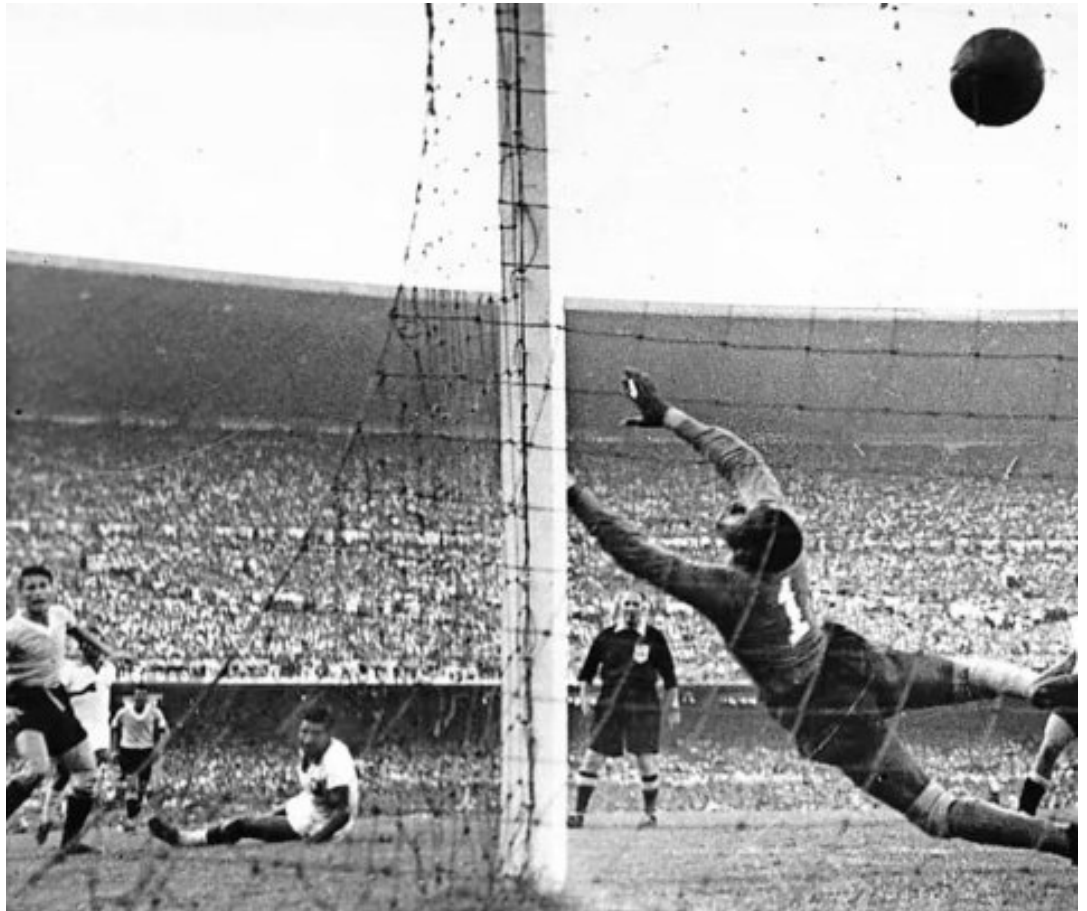
Uruguay no se achicó en ese momento y pasó a la historia con esa gran hazaña.

más audaces de lo que López Fontana les había pedido.