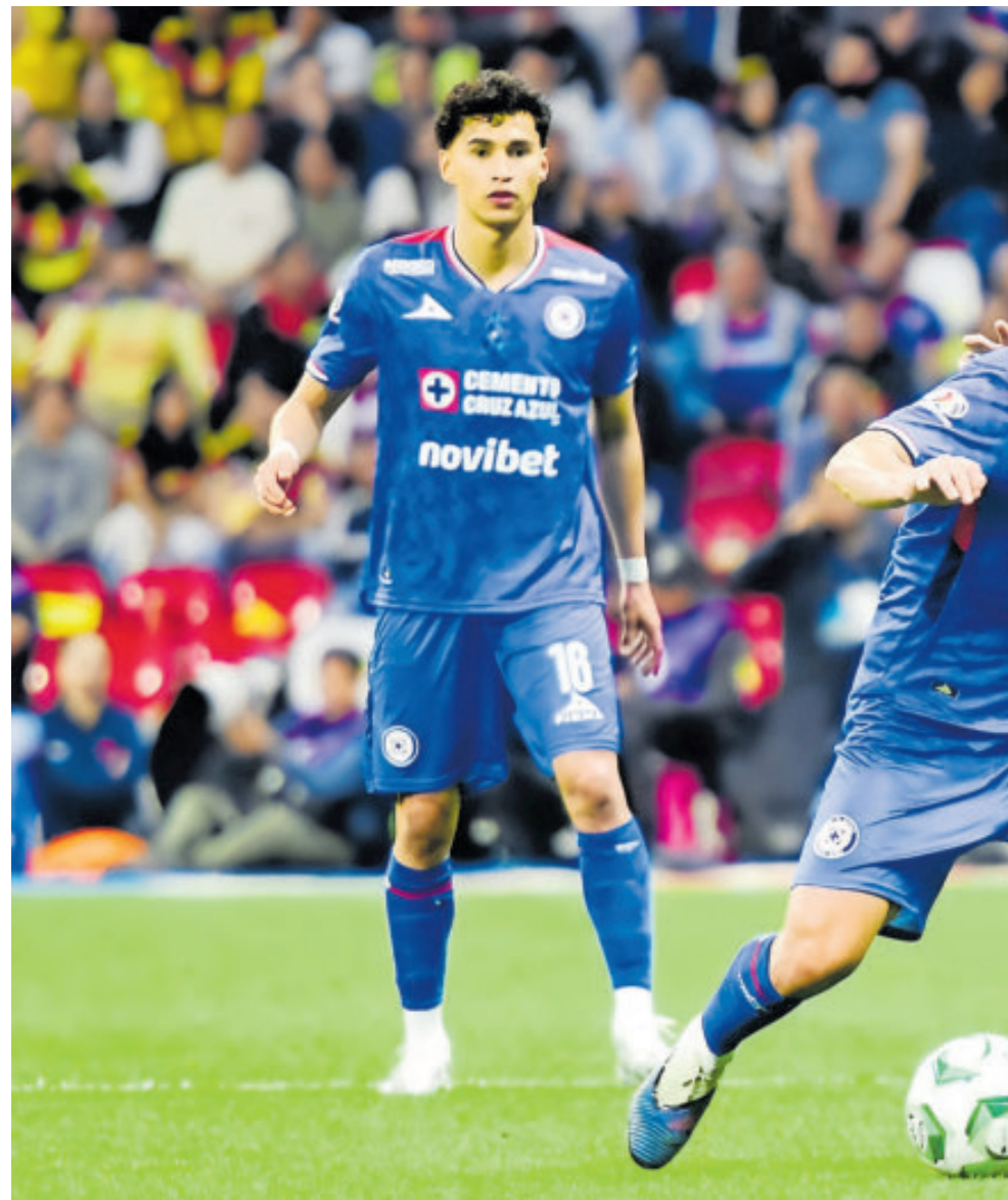
Ambos cuadros se neutralizaron en la cancha del Banorte, brindando un juego sososo y poco vistoso para sus seguidores.

capar la chance de respirarle en la nuca a Chivas en la pelea por el liderato; además, si Toluca gana su partido este domingo, bajará a los cementeros al tercer lugar.