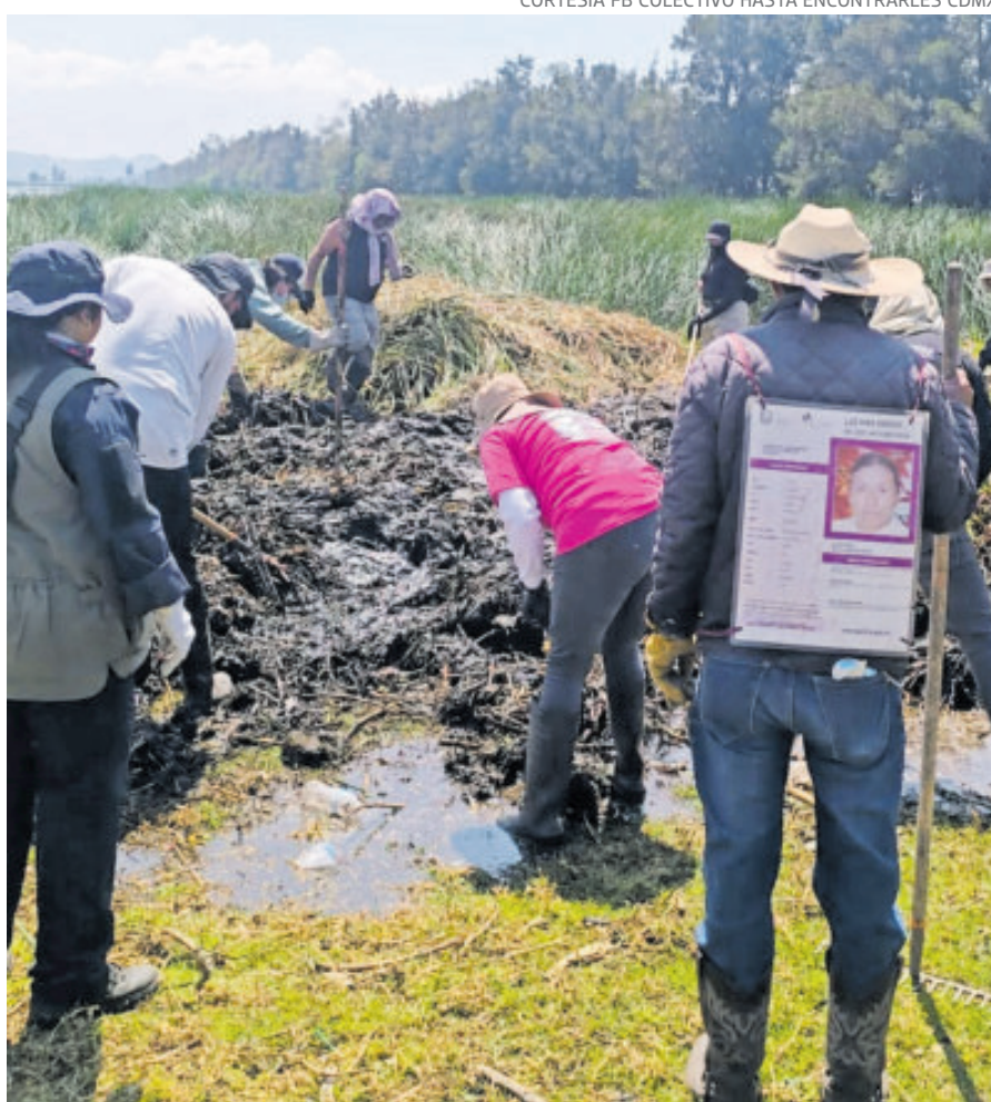
Colectivos, junto con funcionarios, realizaron las labores de búsqueda.