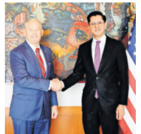
Ronald Johnson y Roberto Velasco.

La reunión con Ronald Johnson forma parte de la serie de acercamientos que Roberto Velasco ha comenzado a sostener con representantes de distintos gobiernos tras su llegada a la cancillería, con el propósito de retomar la agenda de política exterior de México.