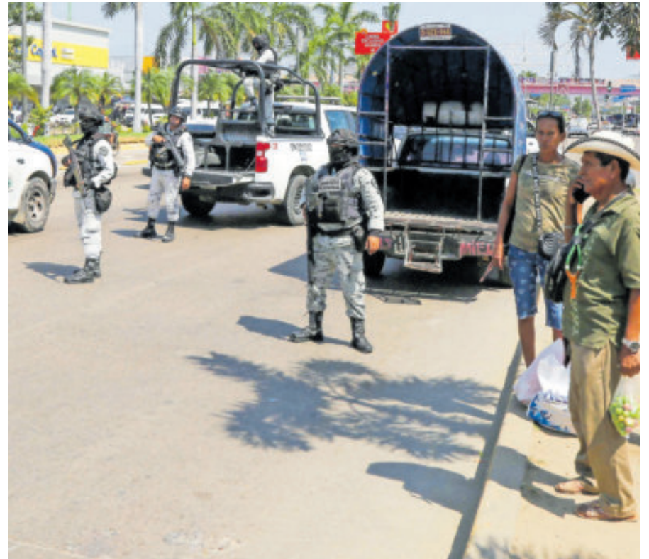
Hasta el cierre de edición se desconoce el móvil del ataque.

En 2025, según datos del Secretariado Ejecutivo del Sistema Nacional de Seguridad Pública (SESNSP), Guerrero registró mil 312 homicidios dolosos, 425 menos