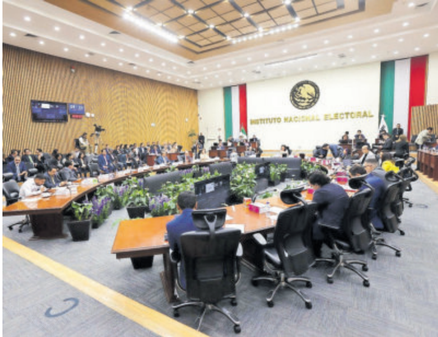
Consejeros electorales, en sesión del INE.