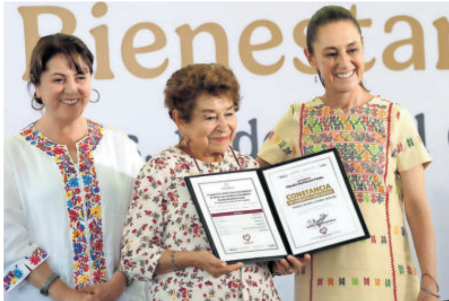
Claudia Sheinbaum entregó escrituras en Morelos.

SE BUSCA agilizar flujos comerciales y fortalecer la competitividad regional.