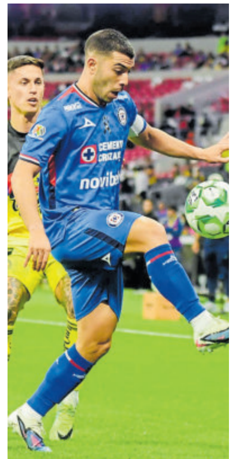
Cruz Azul no encuentra la fórmula para ganar y preocupa a Larcamón.

Con esa misión de sumar de a tres fue que América salió al campo, ante una afición azulcrema que fue mayoría en este recinto, si bien los cementeros también