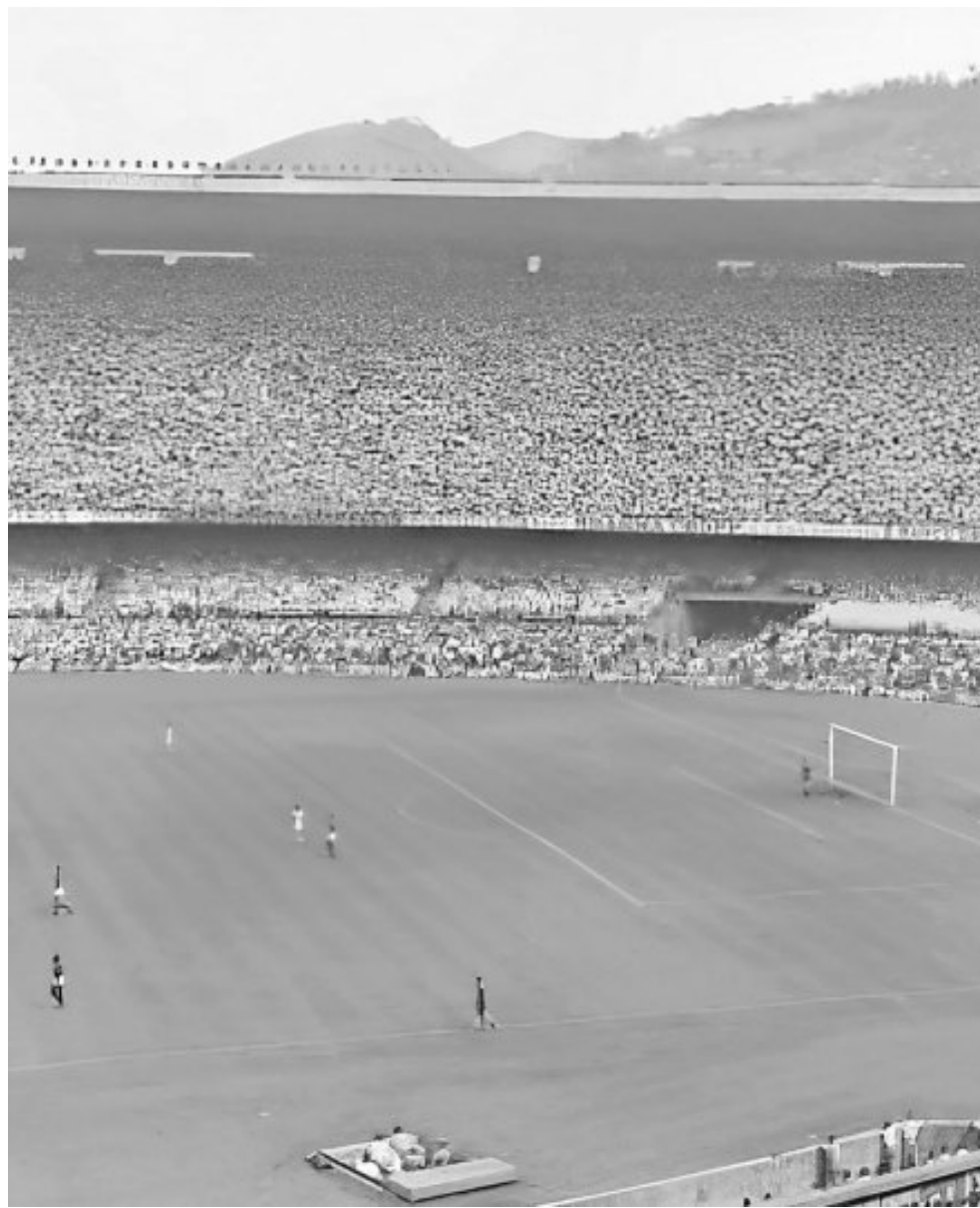
El imponente Estadio Maracanã vivió un momento histórico y amargo en la historia de los mundiales al ver caer a su selección ante los charrúas.

Además, no había programada ninguna final. Los cuatro primeros se decidirían mediante los resultados de una liguilla, por lo que los organizadores simplemente tuvieron suerte de que Uruguay y Brasil, los dos equipos que competían por el tro-