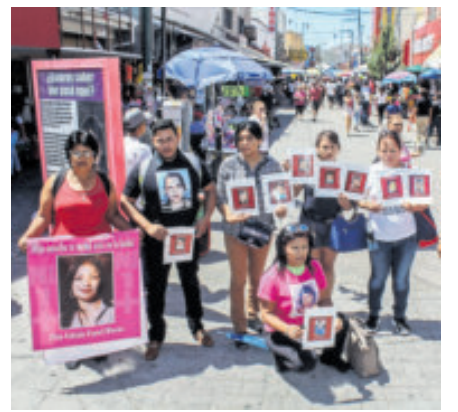
Madres buscadoras de Chihuahua.