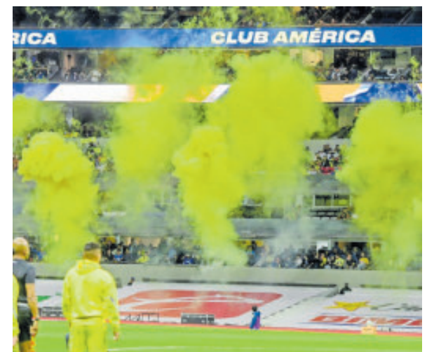
Ambiente espectacular en las gradas del estadio.