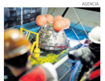
Trabajadores de la NASA recuperan la cápsula de Orion.

“No era en absoluto adecuado para la exploración a largo plazo ni para estancias prolongadas”, explicó.