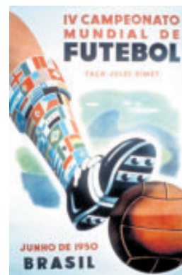
IMAGEN OFICIAL DEL MUNDIAL 1950