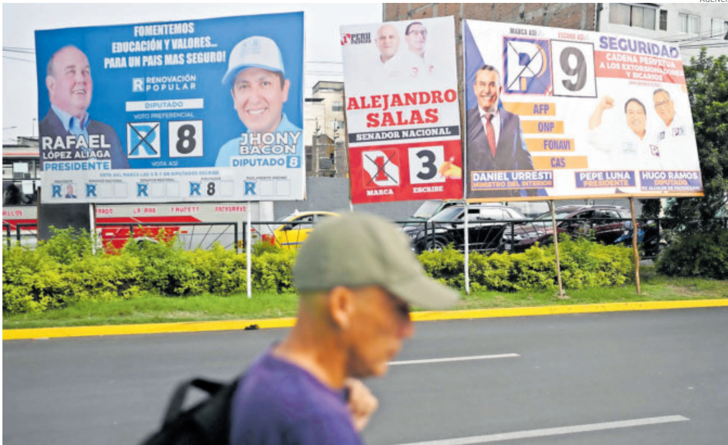
Lima, la capital, tenía propaganda electoral de 35 candidatos en cada rincón previo a la elección.