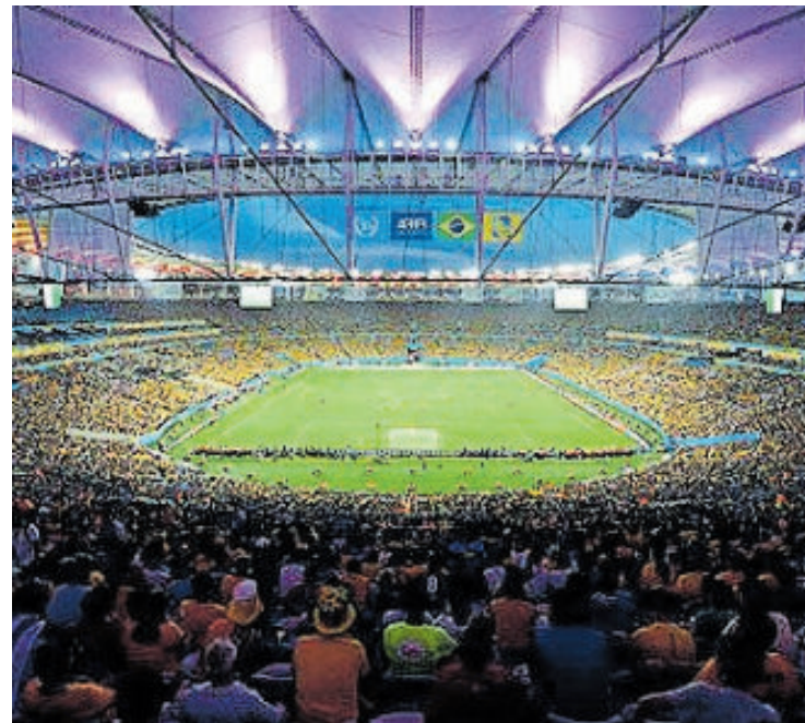
Actualmente así luce el estadio brasileño, que no olvida aquella triste jornada en busca del título avalado por la FIFA.

feo antes de los dos últimos partidos, se enfrentarían en el Maracanã de Río de Janeiro. Un empate le habría bastado a Brasil para ser campeón. Sin embargo, el destino tenía deparada una gran sorpresa.