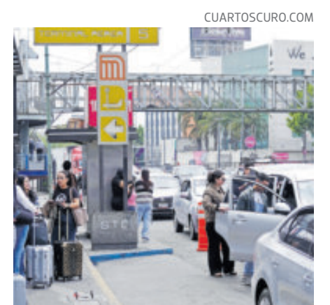
Aseguran que falta un marco legal.