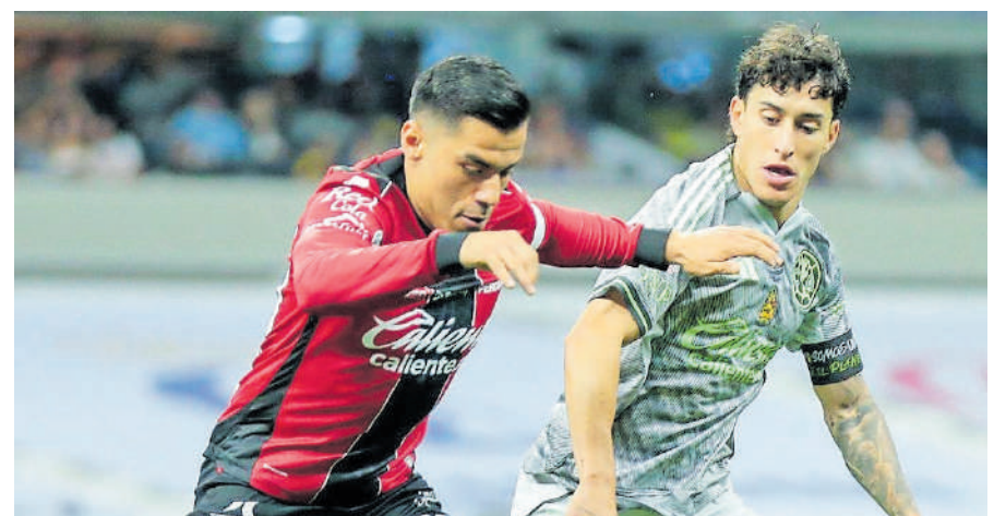
Los tapatíos terminan el torneo con 26 unidades.

Será un clásico capitalino de alarido en cuartos de final y si bien se puede decir que Pumas es favorito por haber terminado como líder, se sabe que esos juegos son totalmente distintos y quizá América ahí pueda encontrar la fuerza y el futbol para avanzar de ronda.