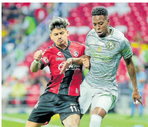
Los Zorros nunca dejaron de apretar.