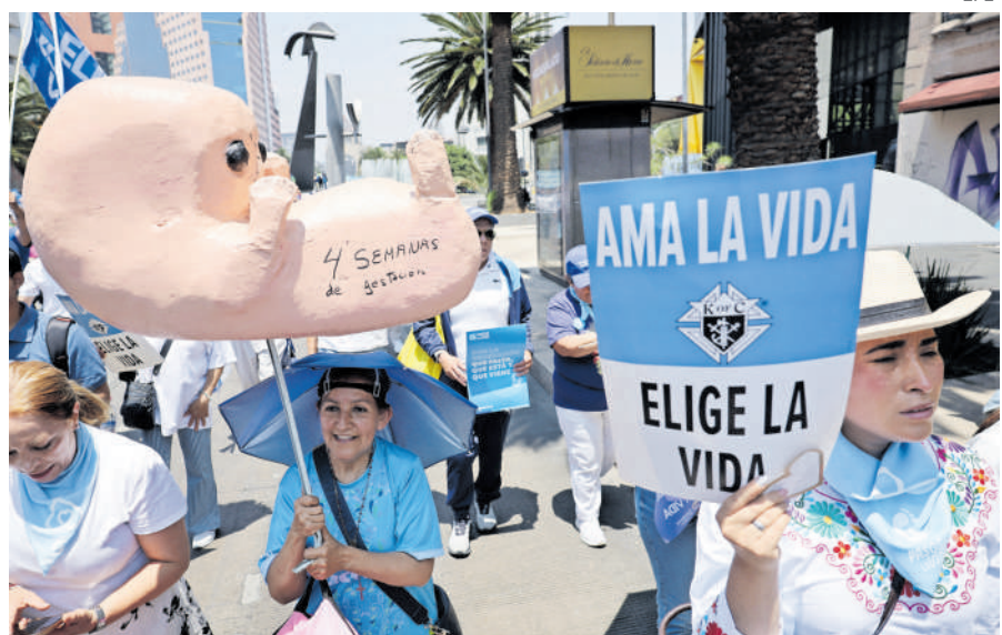
Alrededor de 2 mil personas marcharon en la Ciudad de México.