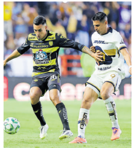
Pachuca podría bajar al cuarto lugar si hoy gana Cruz Azul.