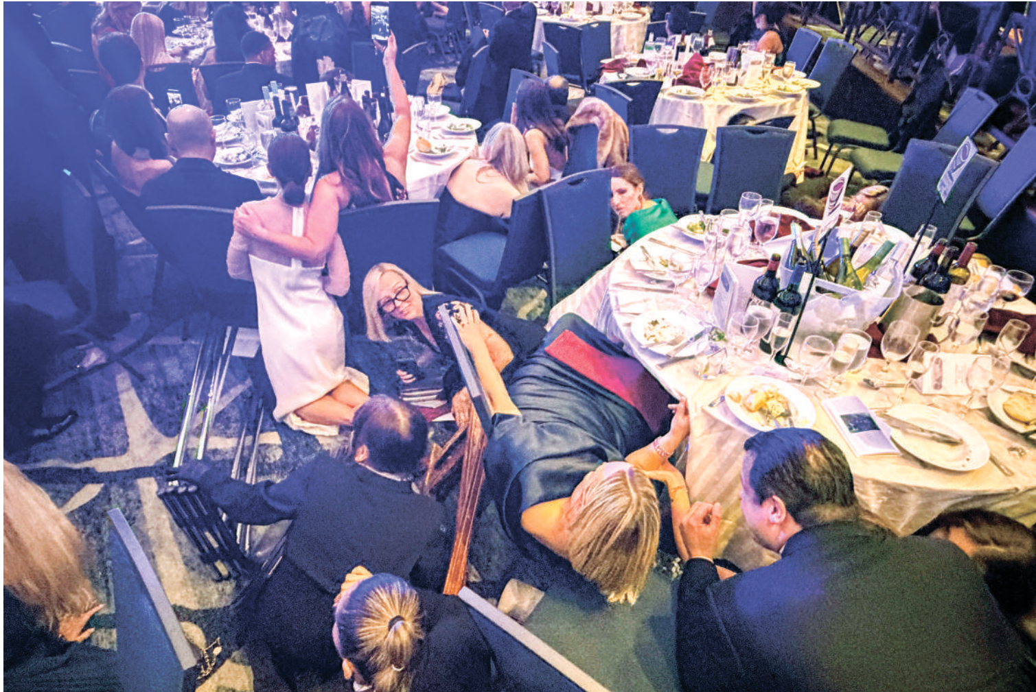
Los asistentes a la cena en el Hotel Hilton de Washington se resguardaron al escuchar el estruendo.