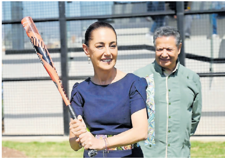
La presidenta Claudia Sheinbaum, ayer, en Hidalgo.

SE llevará a cabo del 25 de abril al 2 de mayo, con una meta de 1.7 millones de dosis a nivel nacional.