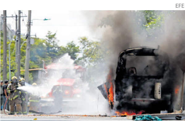
La explosión se registró cerca de una instalación del Ejército en Cali.

Con esto, los republicanos dominarían el mapa político nacional y sería uno de los mayores retrocesos para el