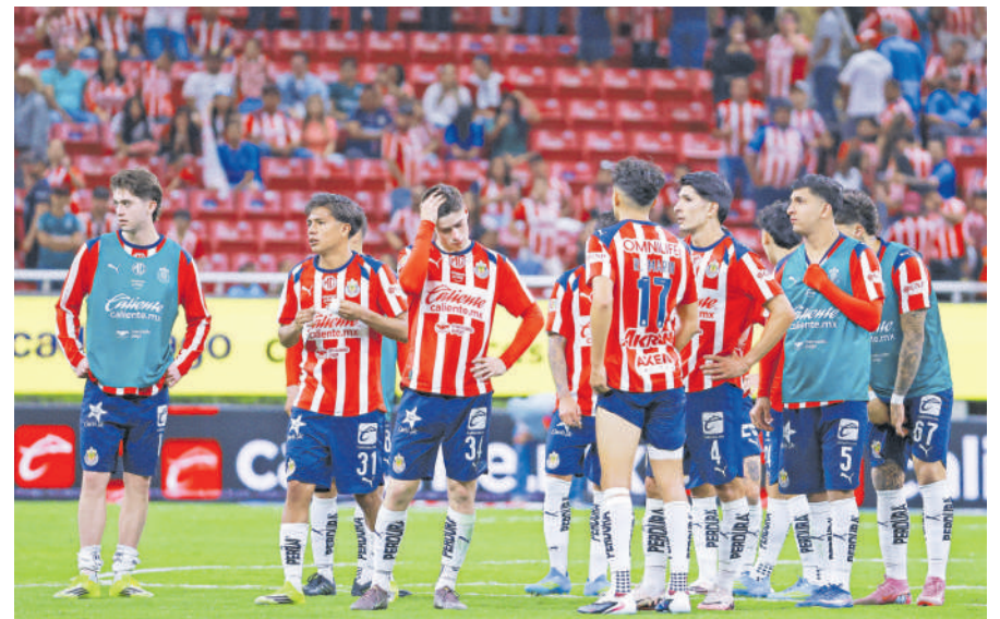
Guadalajara se fue en ceros en sus últimos dos partidos.