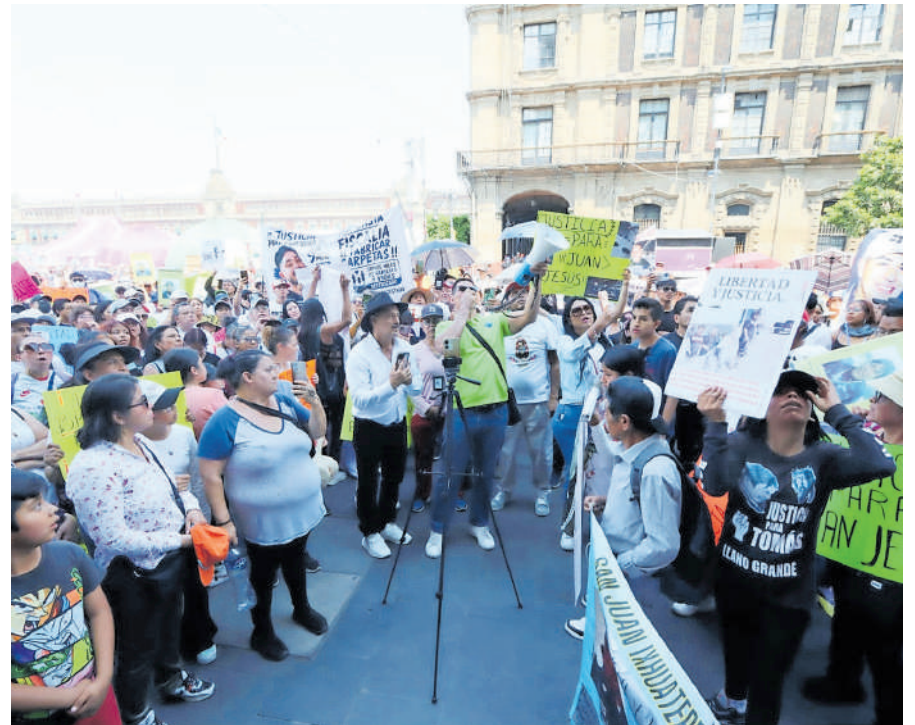
Familias de personas presas acompañaron la marcha del vigilante.