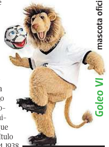
Goleo VI mascota oficial

Sin aún haber ganador, la final se fue hasta los penales y ahí no falló ningún italiano, pero sí un francés: David Trezeguet, con lo que Italia ganó en penales luego de que Fabio Grosso cobrará el quinto y definitivo para la Azzurra, que así lograba su cuarto título Mundial, tras los de 1934, 1938 y 1982.