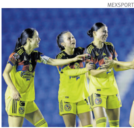
América terminó como líder general del Clausura 2026, con 42 puntos.