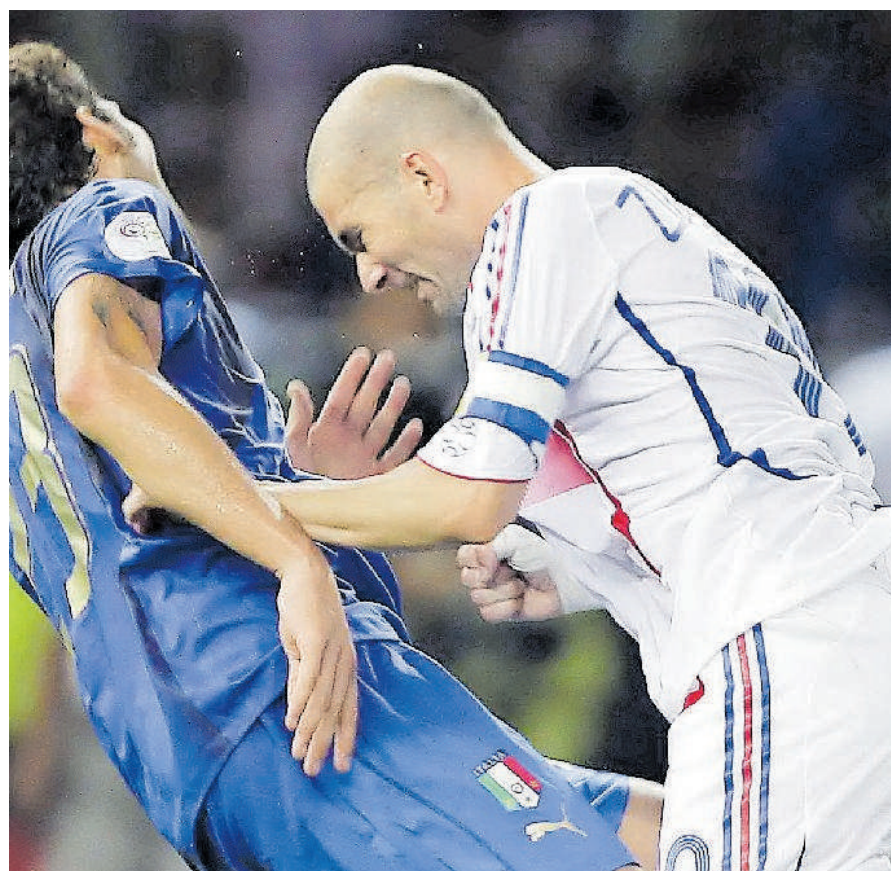
Zidane dejó en desventaja a Francia en la final con su expulsión por el cabezazo.

Contragolpe que inició Cannavaro desde zona defensiva al salir como empera-