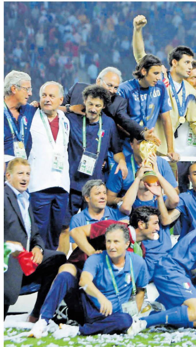
Cannavaro, Buffon, Gennaro Gattuso, entre otros, conformaron la selección italiana campeona.

TANTOS anotó el alemán Miroslav Klose, con los que se llevó el título de goleador de aquella edición mundialista.