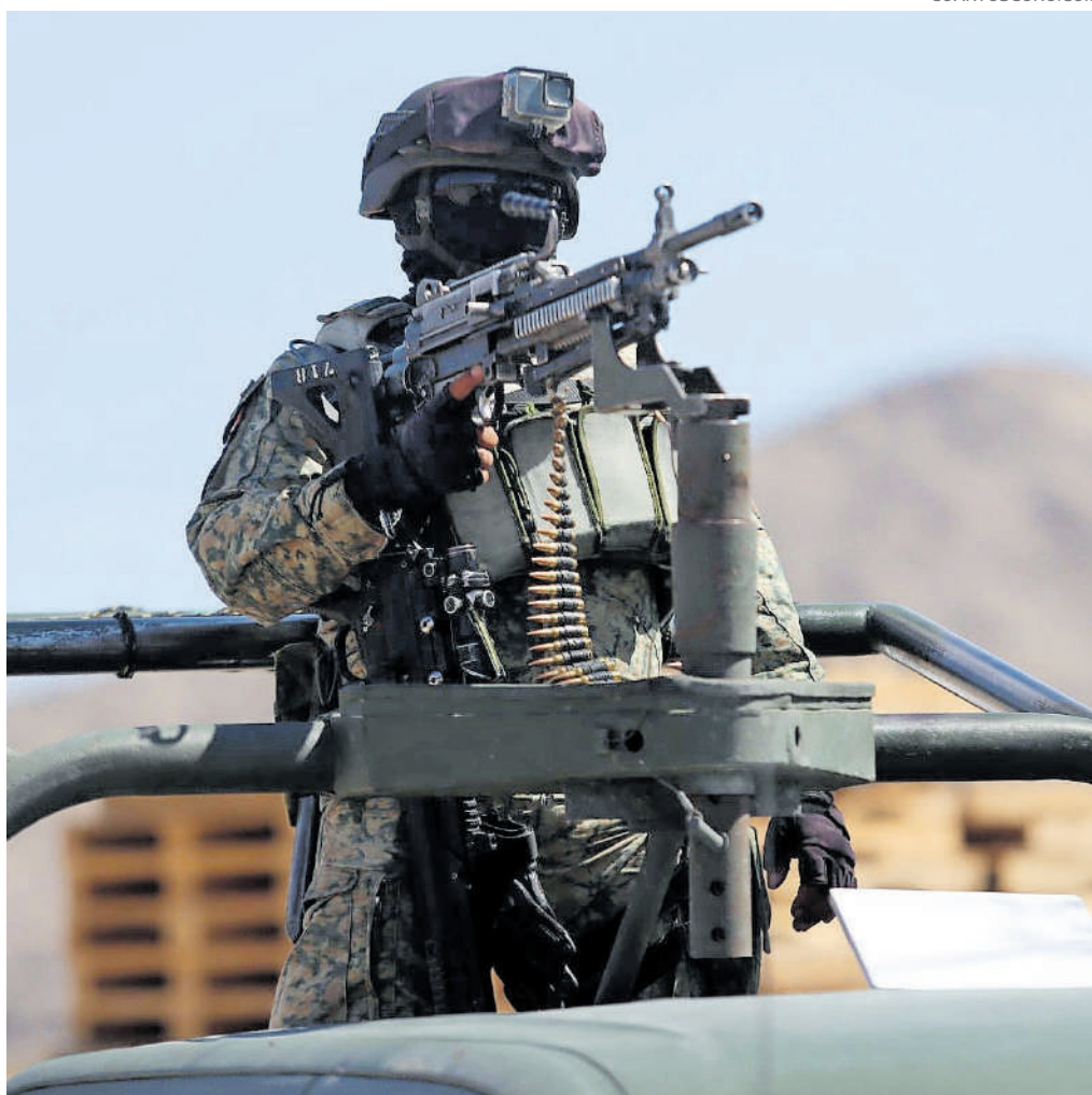
Autoridades federales se han desplegado en el estado.

El gabinete de seguridad señaló que la legislación mexicana establece que no se