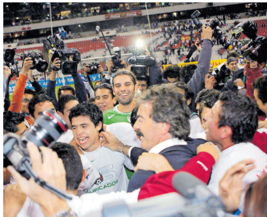
La Selección Mexicana clasificó a esa Copa del Mundo "caminando".

barrió para conectar el esférico y vencer al arquero Roberto Abbondanzieri.