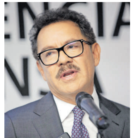
Ignacio Mier, presidente de Jucopo.

También expresó su pesar por el fallecimiento de cuatro personas —dos elementos estatales y dos agentes estadounidenses— y extendió sus condolencias a sus familias, compañeros de trabajo y personas cercanas, al tiempo que reiteró el acompañamiento institucional correspondiente durante el proceso de revisión de los hechos.