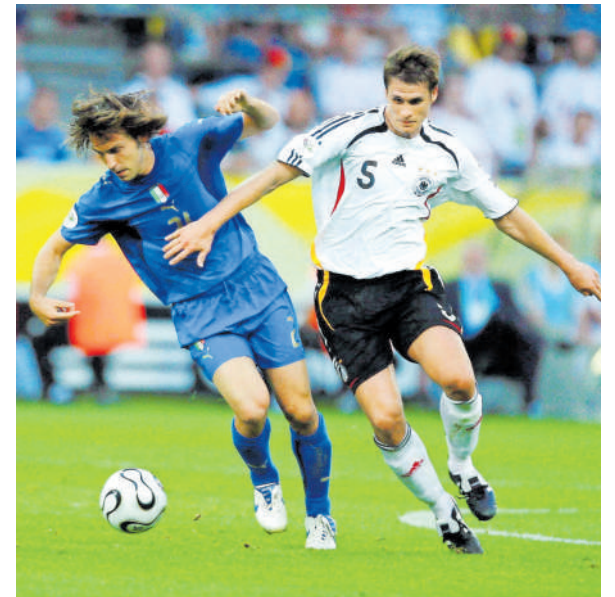
Italia evitó que Alemania fuera profeta en su tierra y eliminó a los locales en semifinales.

En la final, Zinedine Zidane 'se volvió loco' y le propinó un cabezazo en el pecho marco Materazzi que le costó la expulsión.