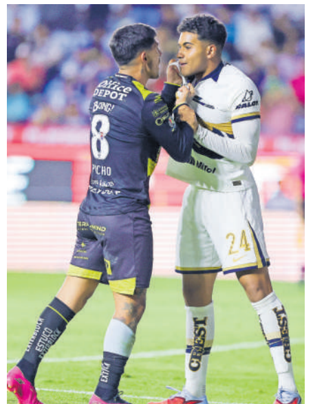
El encuentro entre Tuzos y felinos terminó 'calientito'.