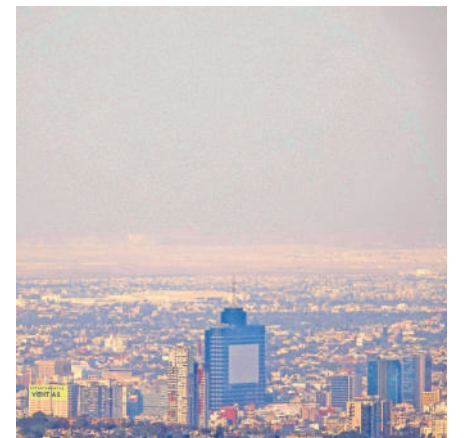
La calidad del aire en la capital fue considerada ayer "muy mala".

Quedan exentos de estas medidas los vehículos que sean eléctricos e híbridos, unidades de emergencia, transporte escolar autorizado, motocicletas y automóviles destinados a atender emergencias médicas.