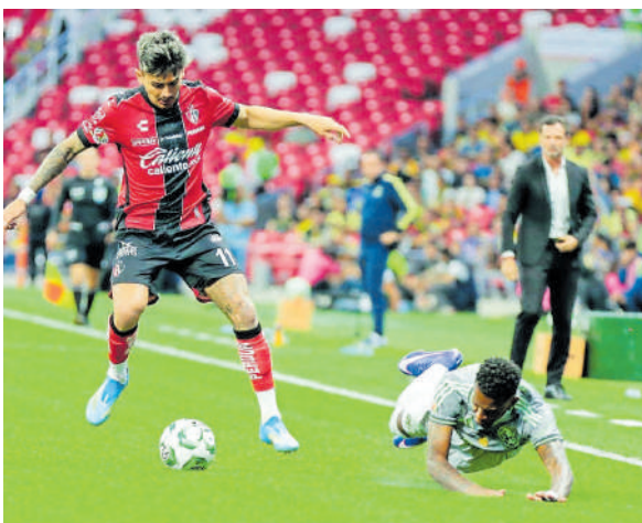
Atlas discreto, pero ya está en la Fiesta Grande.