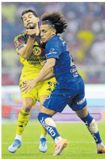
Con los juegos de hoy se definen las series semifinales del Clausura 2026.