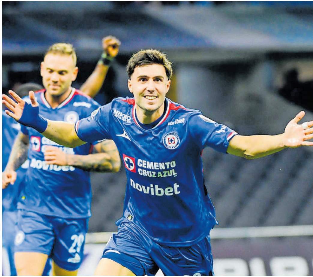
Paradela aprovechó que no se marcó una supuesta mano para hacer la única anotación.

Este podría ser el último juego del Clausura 2026 en el Estadio Azteca; el 13 de mayo la FIFA tomará posesión del inmueble.