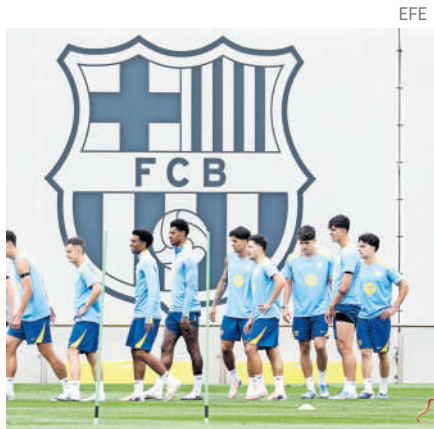
De ganar, Barcelona será campeón.