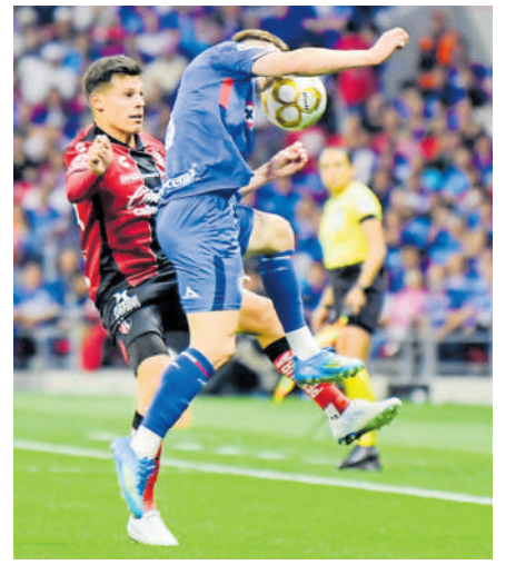
La localía pesó en contra de los Zorros, que no encontraron respuesta.