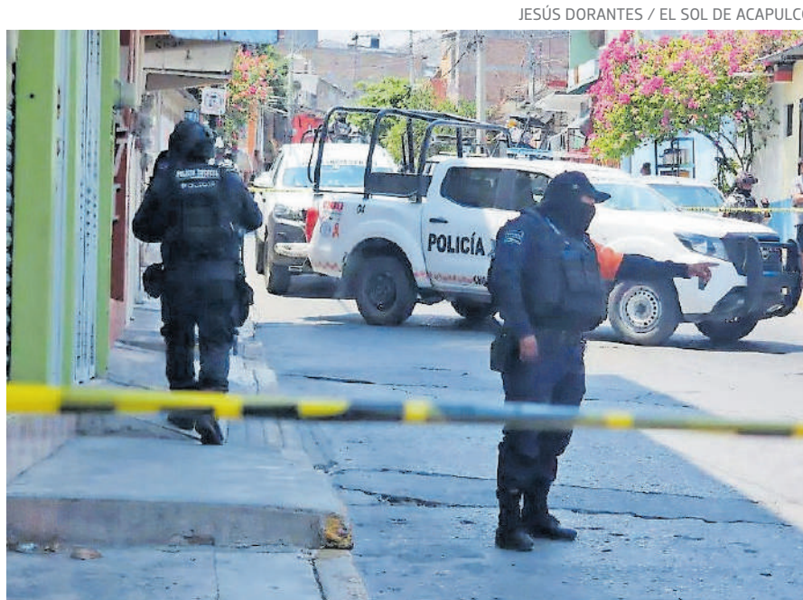
Autoridades investigan el caso.

PIDEN apoyo a la presidenta Sheinbaum y a la gobernadora Salgado para frenar la violencia.