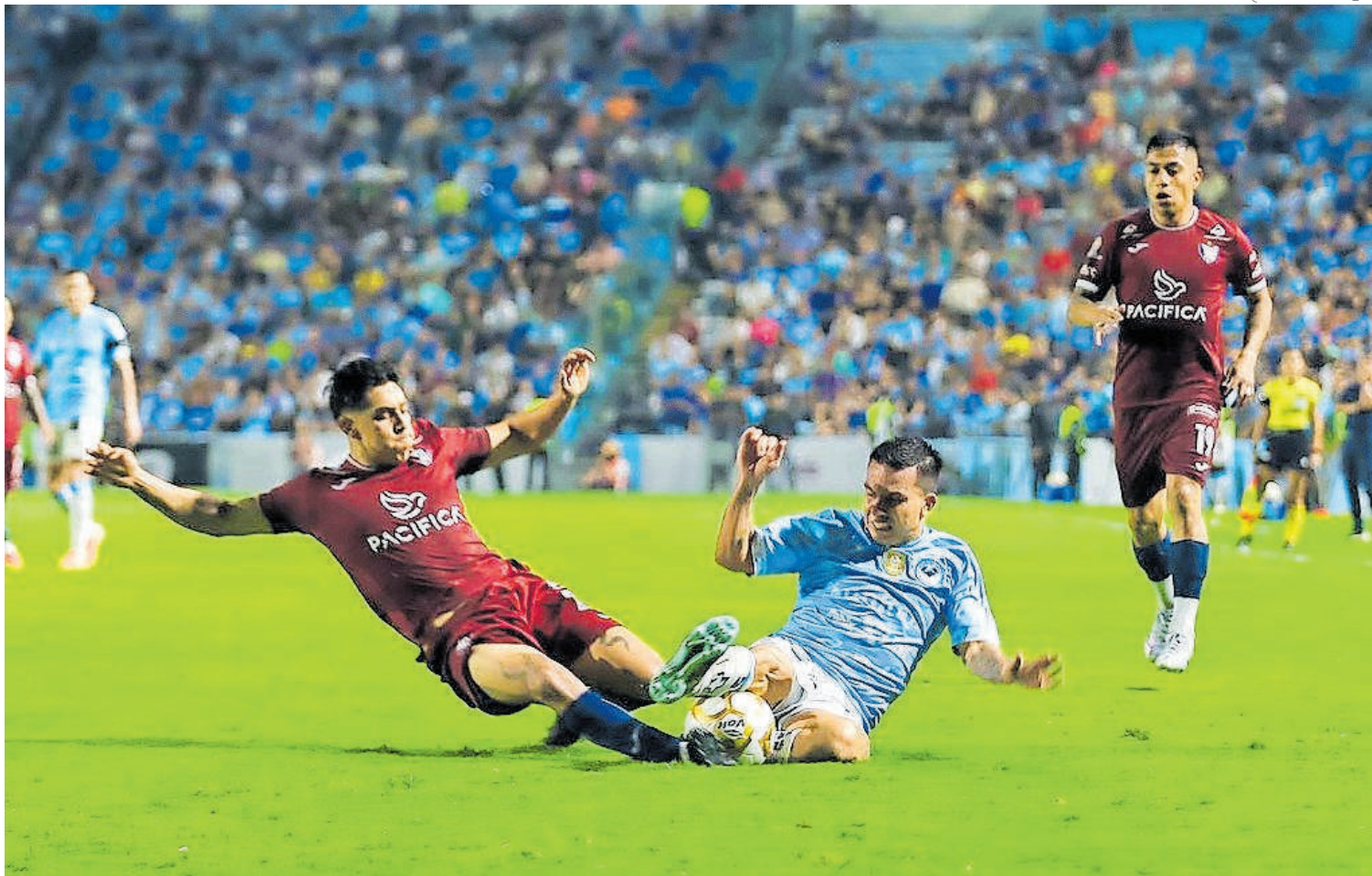
Tepatlán dejó mucho que desear en su planteamiento, pues no lo modificó a pesar de tener dos hombres de más.