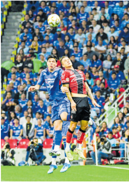
Los Rojinegros pelearon, pero no les alcanzó ante un mejor equipo celeste.

Este podría ser el último juego del Clausura 2026 en el Estadio Azteca; el 13 de mayo la FIFA tomará posesión del inmueble.