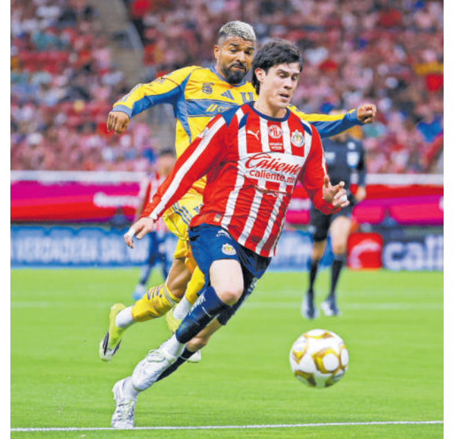
Partidazo de Campillo en zona defensiva.