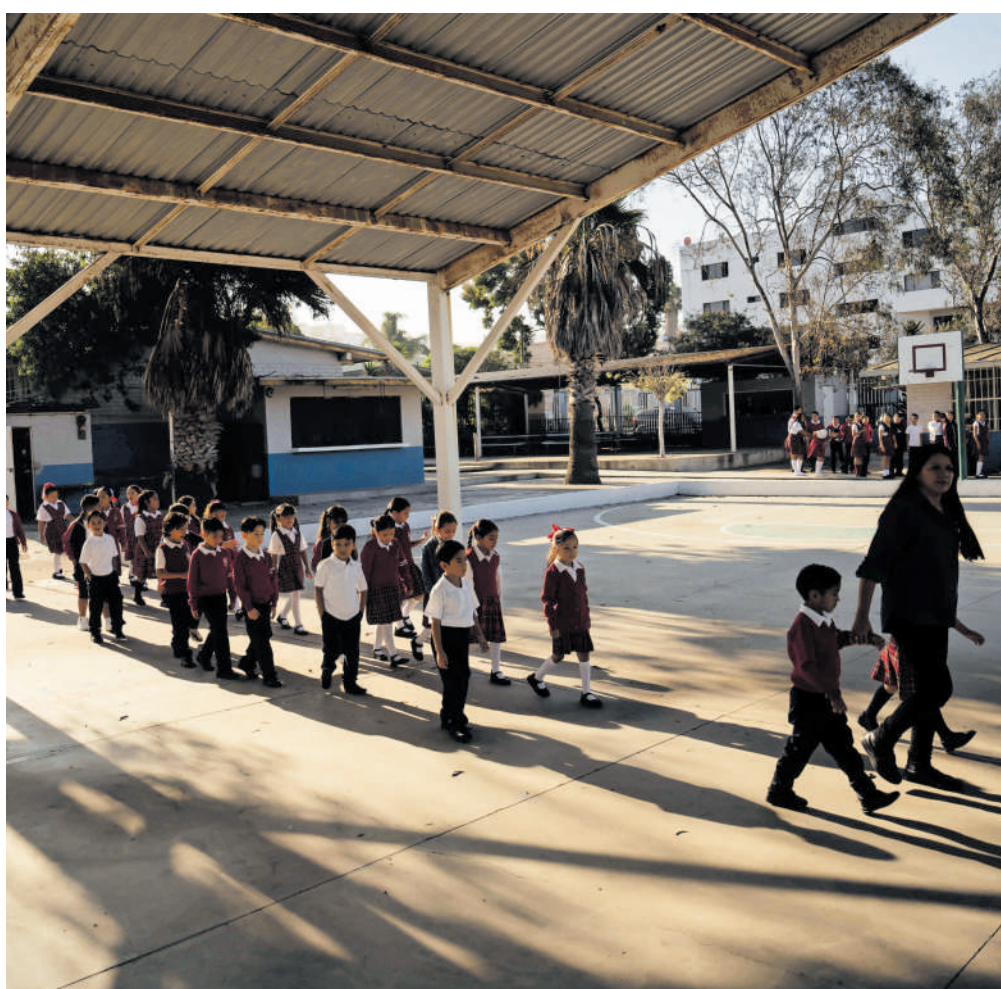
Organizaciones alertan por riesgos en la educación de los menores.

La comisión indicó que corresponde a la SEP y a las autoridades educativas, tanto federales y como estatales, garantizar que estos ajustes no afecten el acceso