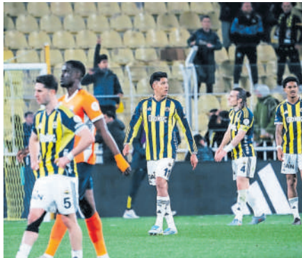
El Machín podría reportarse en el CAR.