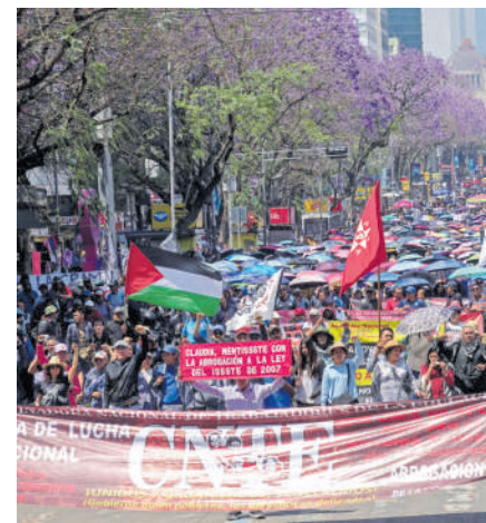
Integrantes de la CNTE, durante una movilización en la CDMX.

Finalmente, el organismo de derechos humanos enfatizó que el interés superior de niñas, niños y adolescentes debe mantenerse como eje rector en el diseño e implementación de políticas públicas y programas relacionados con el sistema educativo nacional.