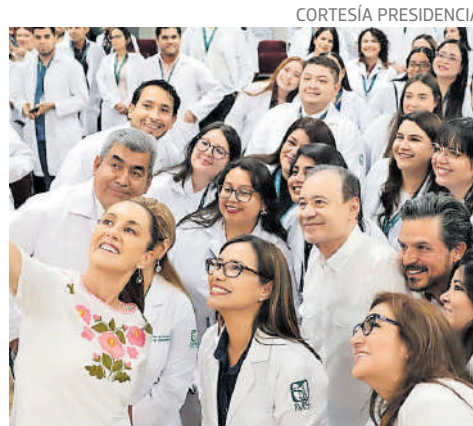
La presidenta Claudia Sheinbaum , ayer, en Hermosillo, Sonora.

“Imagínense ustedes que hay mexicanas y mexicanos que traen a una española, recientemente presidenta de la Comunidad de Madrid, Isabel Díaz Ayuso, y reconocen a Hernán Cortés. El conquistador, si algo tuvo, fue primero que llegó a invadir los territorios que había en esta tierra y, segundo, una terrible discriminación, violencia, esclavismo, exterminio”, afirmó al encabezar el Plan de Justicia