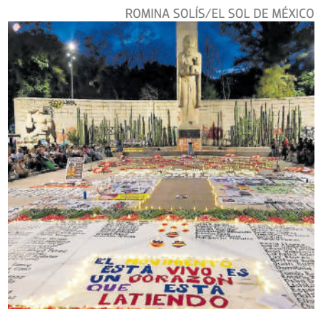
Velada por los desaparecidos, ayer.

“Usted dijo ‘llegamos todas’. Entonces escúchenos. (...) Necesitamos que se arme con el valor y coraje de una madre que busca incansablemente a su hija desapa-