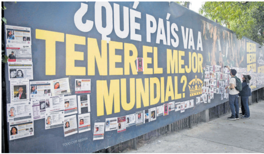
Madres buscadoras, ayer, durante la protesta alrededor del Estadio Azteca.