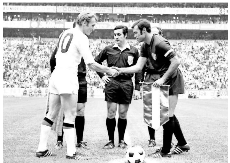
El Telstar de México 1970 fue el primer balón con nombre propio.

mentos del calendario solar. Era un balón funcional y, al mismo tiempo, un homenaje cultural al país anfitrión.