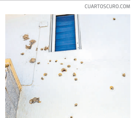
Residencia ubicada en la colonia Las Quintas.

En un comunicado, la Secretaría de Seguridad de Sinaloa confirmó que la vivienda atacada fue habitada por Rocha Moya y precisó que el inmueble permanece desocupado desde hace de 10 años.