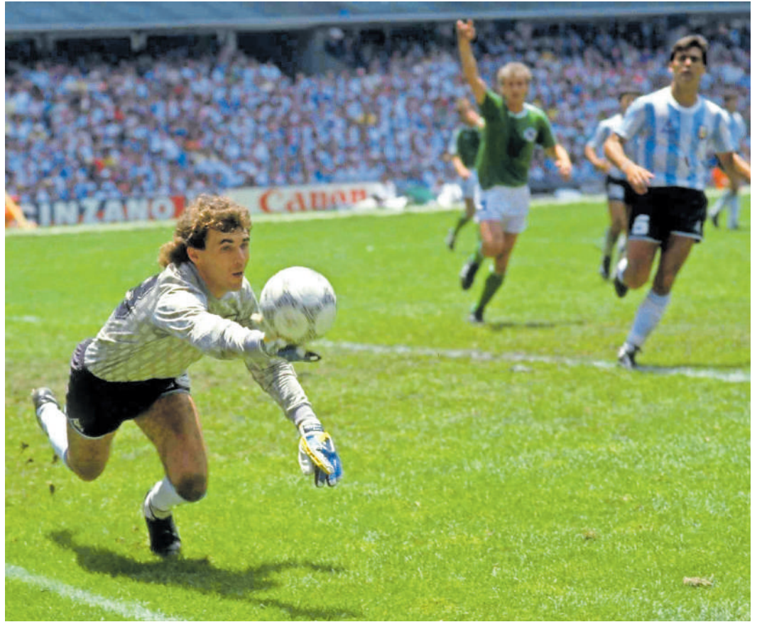
El balón Azteca vio coronarse a Diego Armando Maradona y Argentina en 1986.