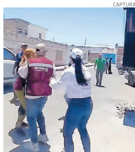
Ataque a patadas en un evento en Coahuila, ayer.

De acuerdo con versiones difundidas por simpatizantes y actores políticos de la región, el incidente se habría registrado en medio de una fuerte tensión interna que, desde hace tiempo, existe entre distintos grupos de Morena en ese municipio. Los choques políticos y las acusaciones entre corrientes internas se han intensificado